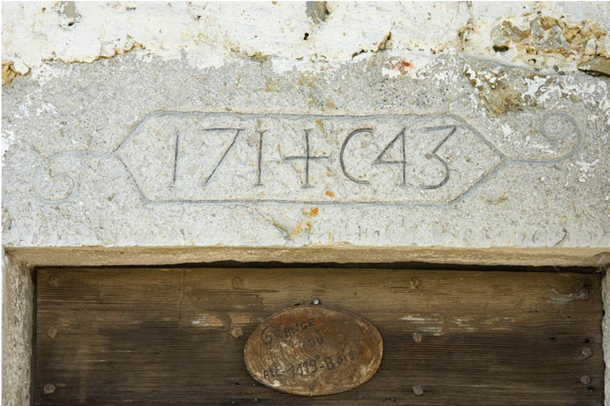
Linteau daté 1743.