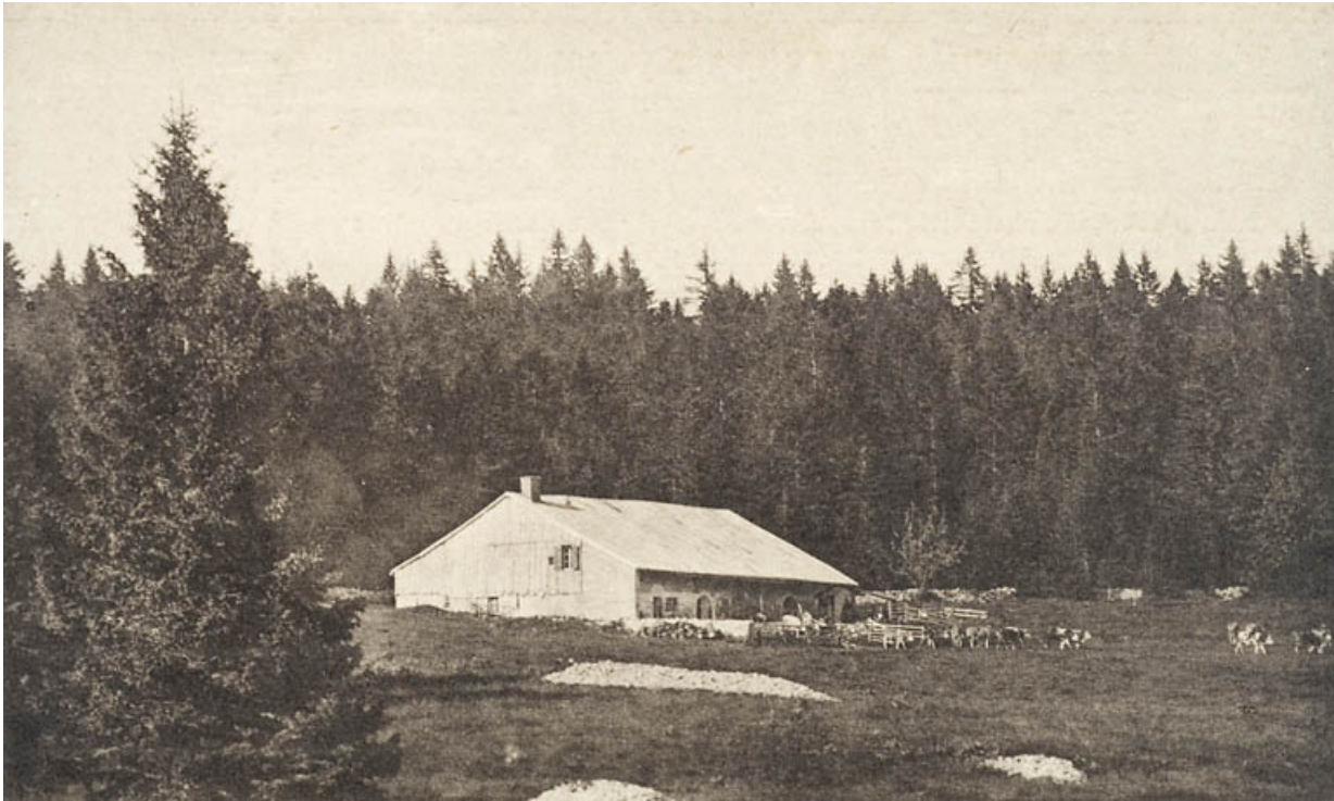
[Vue d'ensemble, depuis le sud], [1ère moitié 20e siècle].