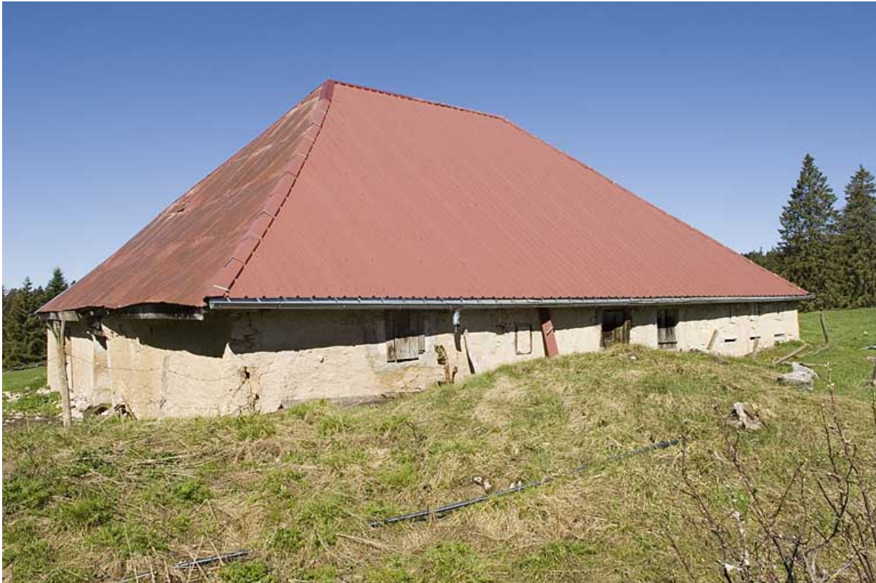
Façade postérieure et citerne.