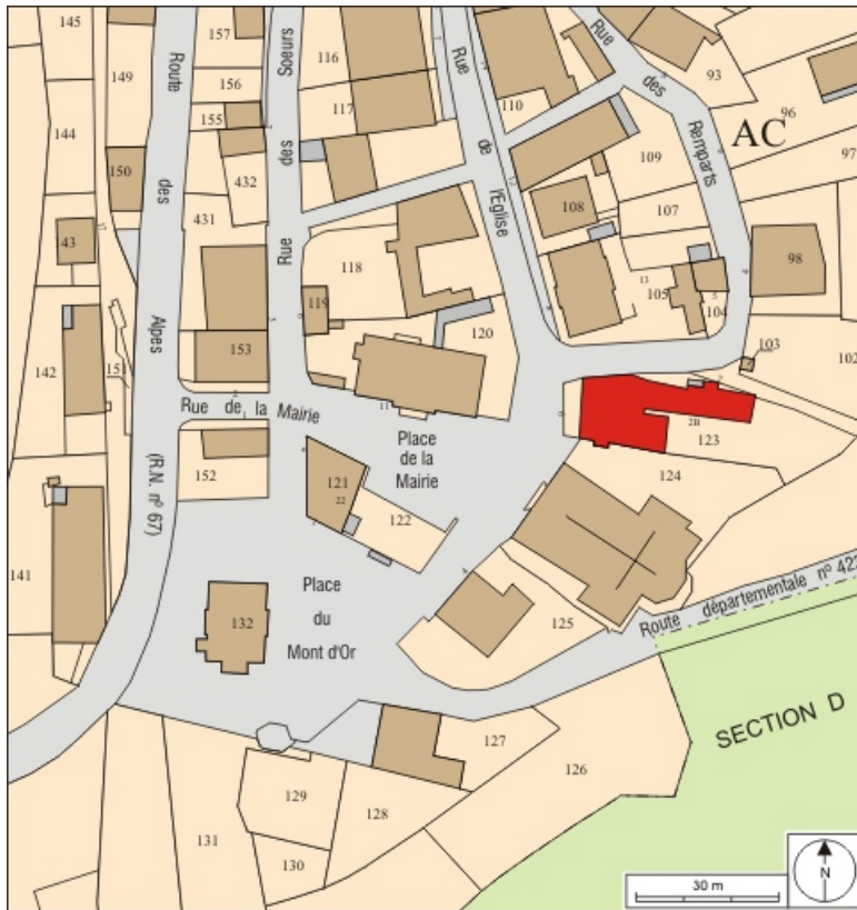
Plan masse et de situation. 25, Jougne, 6 rue de l'Église