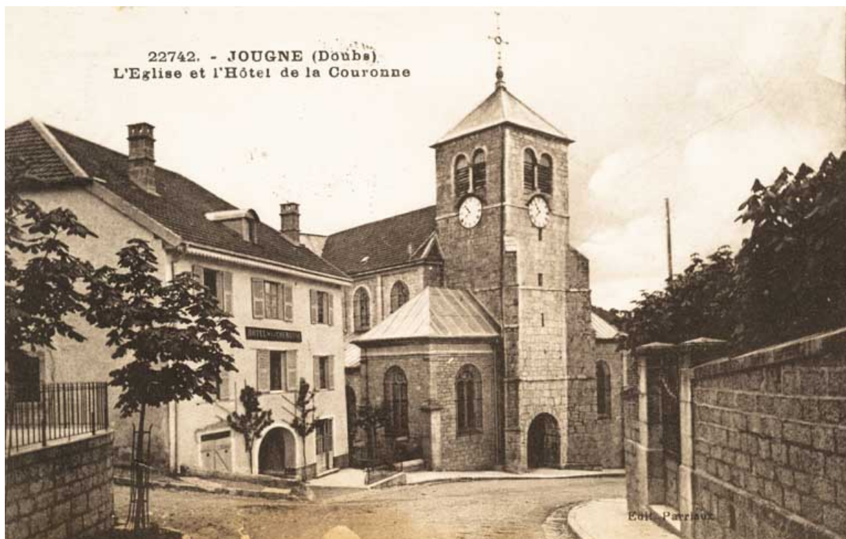
22742. - Jougne (Doubs). L'Eglise et l'Hôtel de la Couronne, [1ère moitié 20e siècle ?]. 25, Jougne