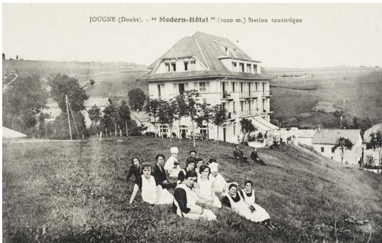
Jougne (Doubs). - "Modern'Hôtel" (1020 m.) Station touristique, [milieu 20e siècle]. 25, Jougne, 7 rue du Mont Ramey