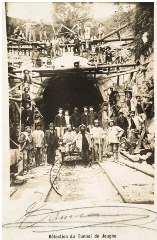
Réfection du Tunnel de Jougne