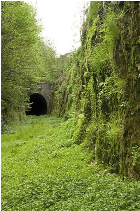
Tunnel et tranchée.