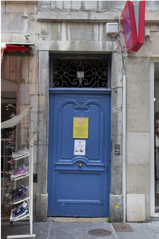
Façade antérieure de logis principal : détail de la porte du couloir.

25, Besançon Grande Rue 28, lieudit : îlot Sainte-Ursule