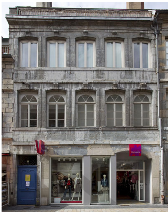
Façade antérieure de logis principal : de face.

25, Besançon Grande Rue 28, lieudit : îlot Sainte-Ursule