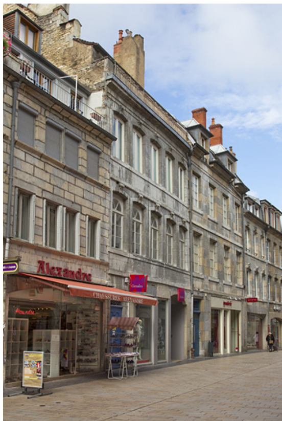
Vue d'ensemble depuis la rue, de trois quarts gauche.

25, Besançon Grande Rue 28, lieudit : îlot Sainte-Ursule