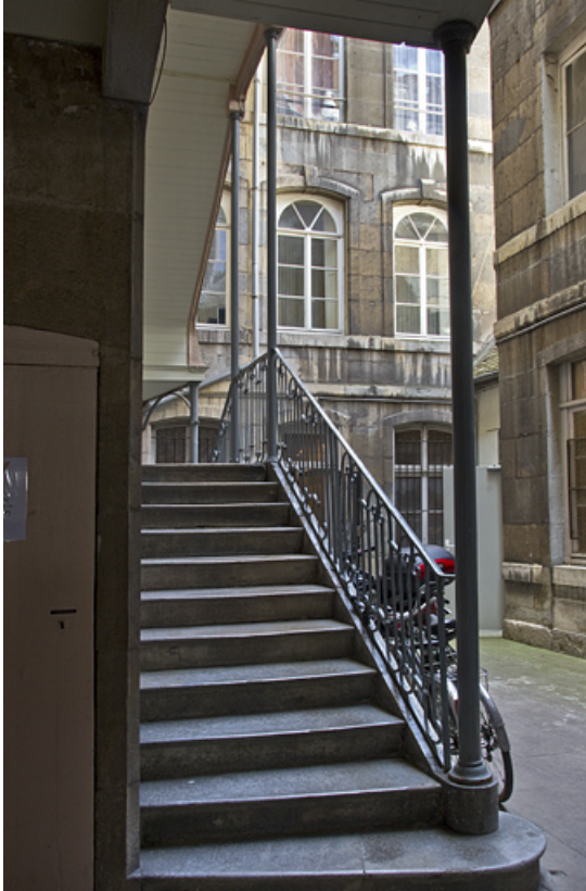
Vue du premier logis secondaire depuis le départ de l'escalier à cage ouverte.

25, Besançon Grande Rue 28, lieudit : îlot Sainte-Ursule