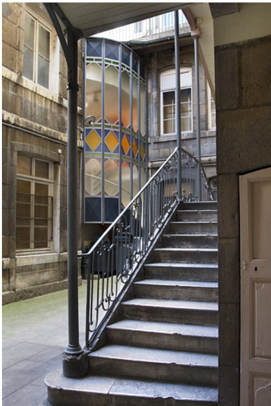
Vue du départ de l'escalier à cage ouverte depuis le fond de la première cour.

25, Besançon Grande Rue 28, lieudit : îlot Sainte-Ursule