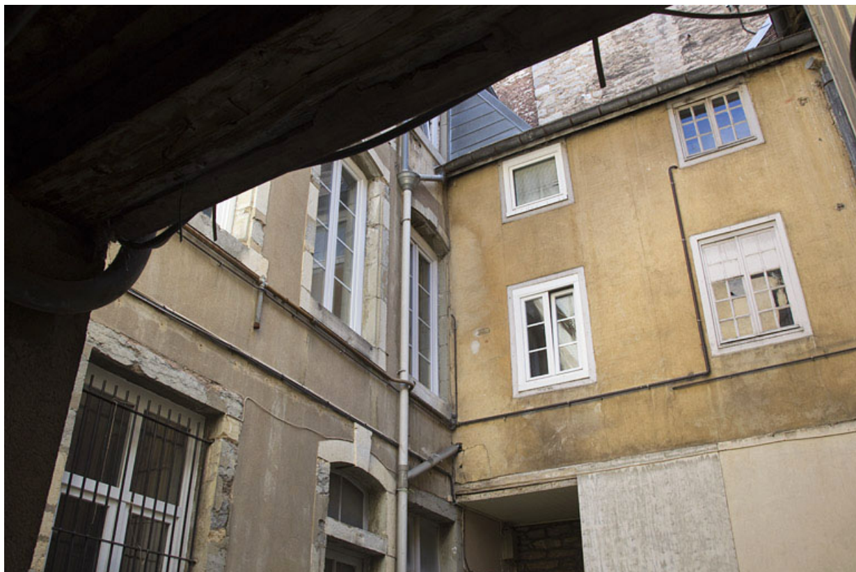
Vue des étages des logis secondaires depuis le fond de la deuxième cour.

25, Besançon Grande Rue 28, lieudit : îlot Sainte-Ursule