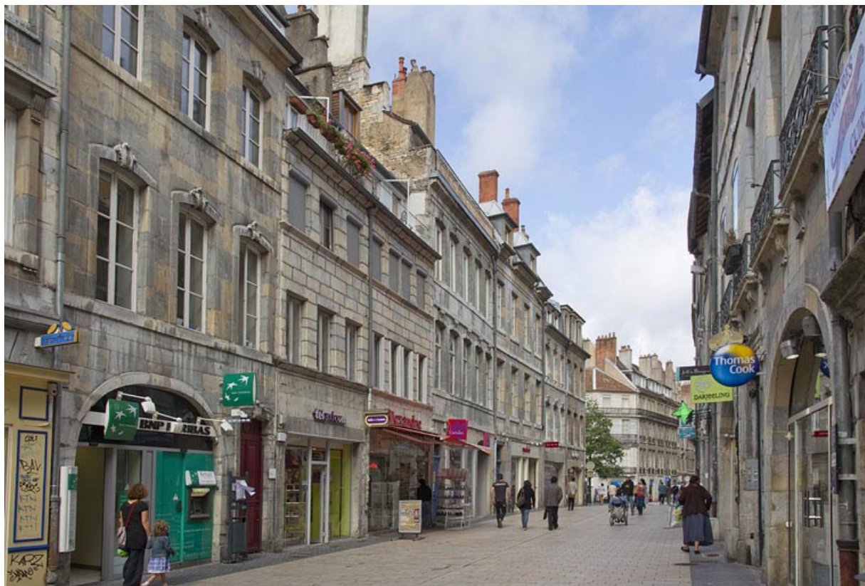
Vue d'ensemble éloignée depuis la rue : de trois quarts gauche.

25, Besançon Grande Rue 28, lieudit : îlot Sainte-Ursule