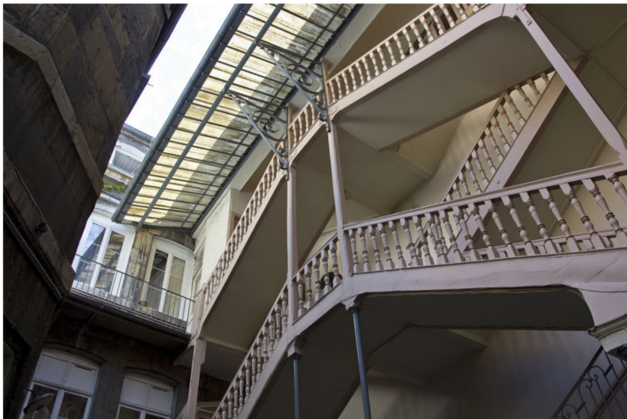
Escalier à cage ouverte, partie supérieure : de trois quarts droit.

25, Besançon Grande Rue 28, lieudit : îlot Sainte-Ursule