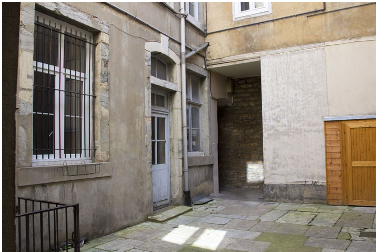
Vue du rez-de-chaussée des logis secondaires depuis le fond de la deuxième cour.

25, Besançon Grande Rue 28, lieudit : îlot Sainte-Ursule