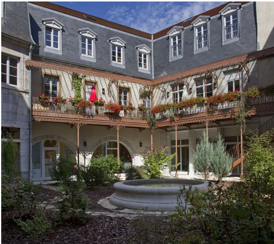
Logis principal : vue des façades depuis le fond de la cour.

25, Besançon, 11 rue Pasteur, lieudit : îlot Sainte-Ursule