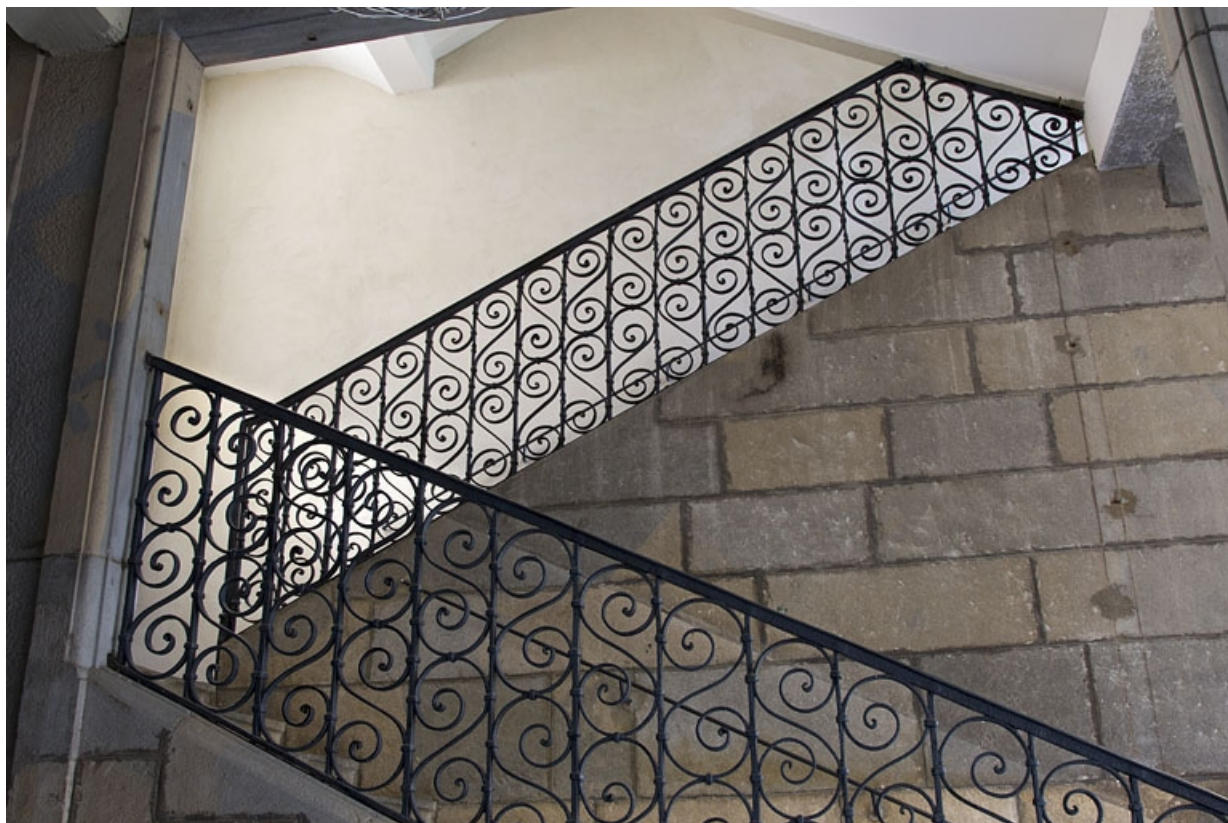
Logis principal, intérieur, escalier : détail de la rampe en ferronnerie.

25, Besançon, 11 rue Pasteur, lieudit : îlot Sainte-Ursule