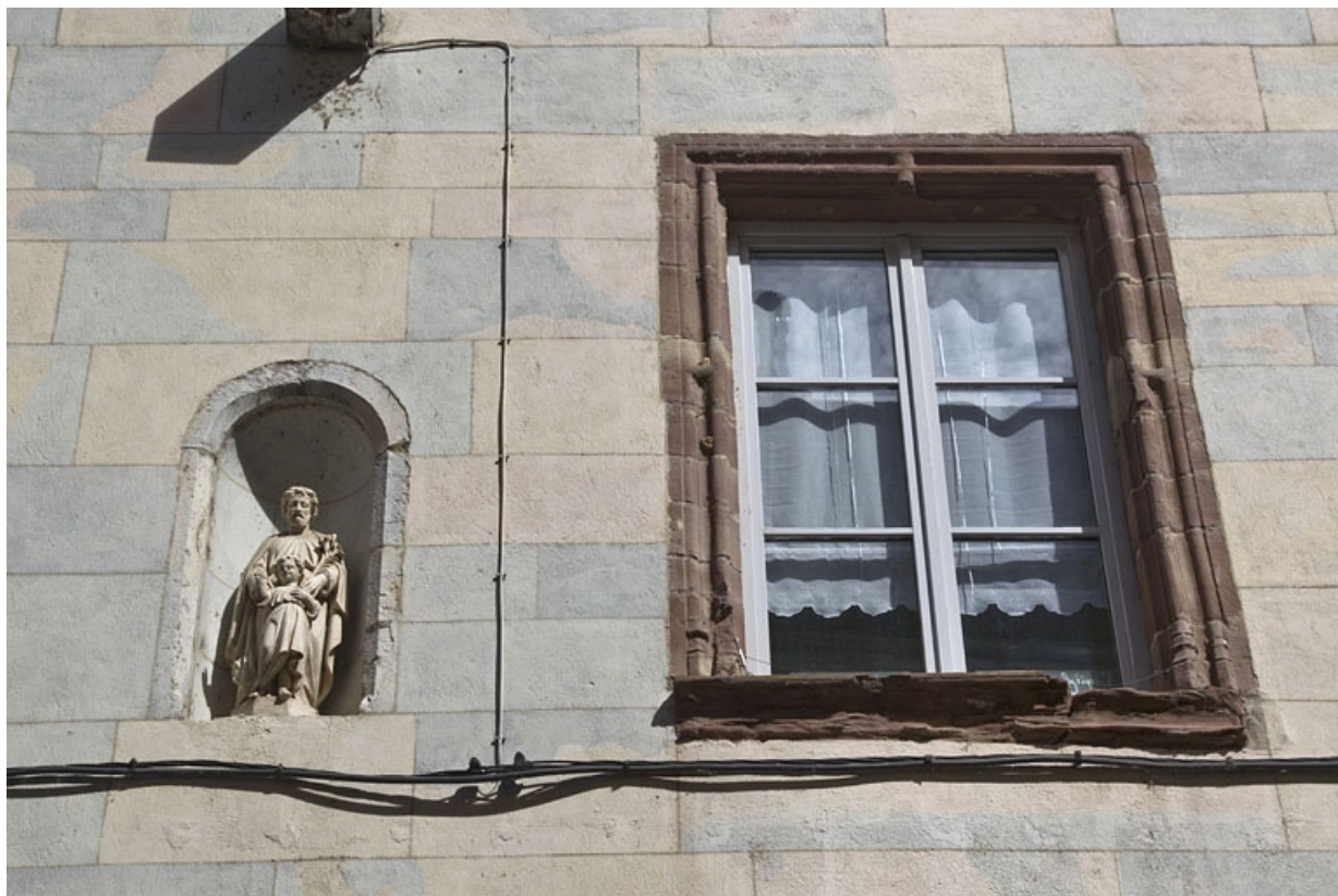
Logis principal, aile droite, façade postérieure : détail d'une niche et d'une fenêtre du premier étage.

25, Besançon, 11 rue Pasteur, lieudit : îlot Sainte-Ursule