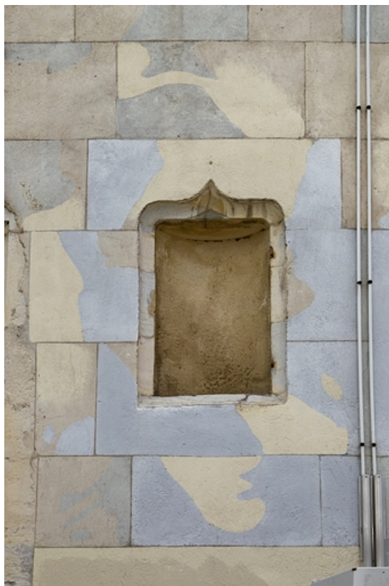
Logis principal, façade antérieure, partie droite : détail d'une niche.

25, Besançon, 11 rue Pasteur, lieudit : îlot Sainte-Ursule