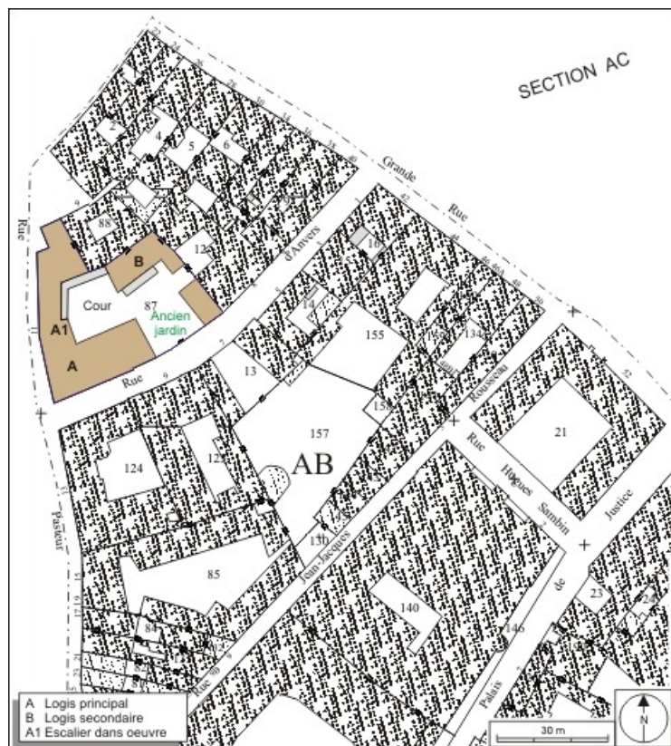
Plan masse et de situation. Extrait du plan cadastral, 1974, section AB. 25, Besançon, 11 rue Pasteur, lieudit : îlot Sainte-Ursule