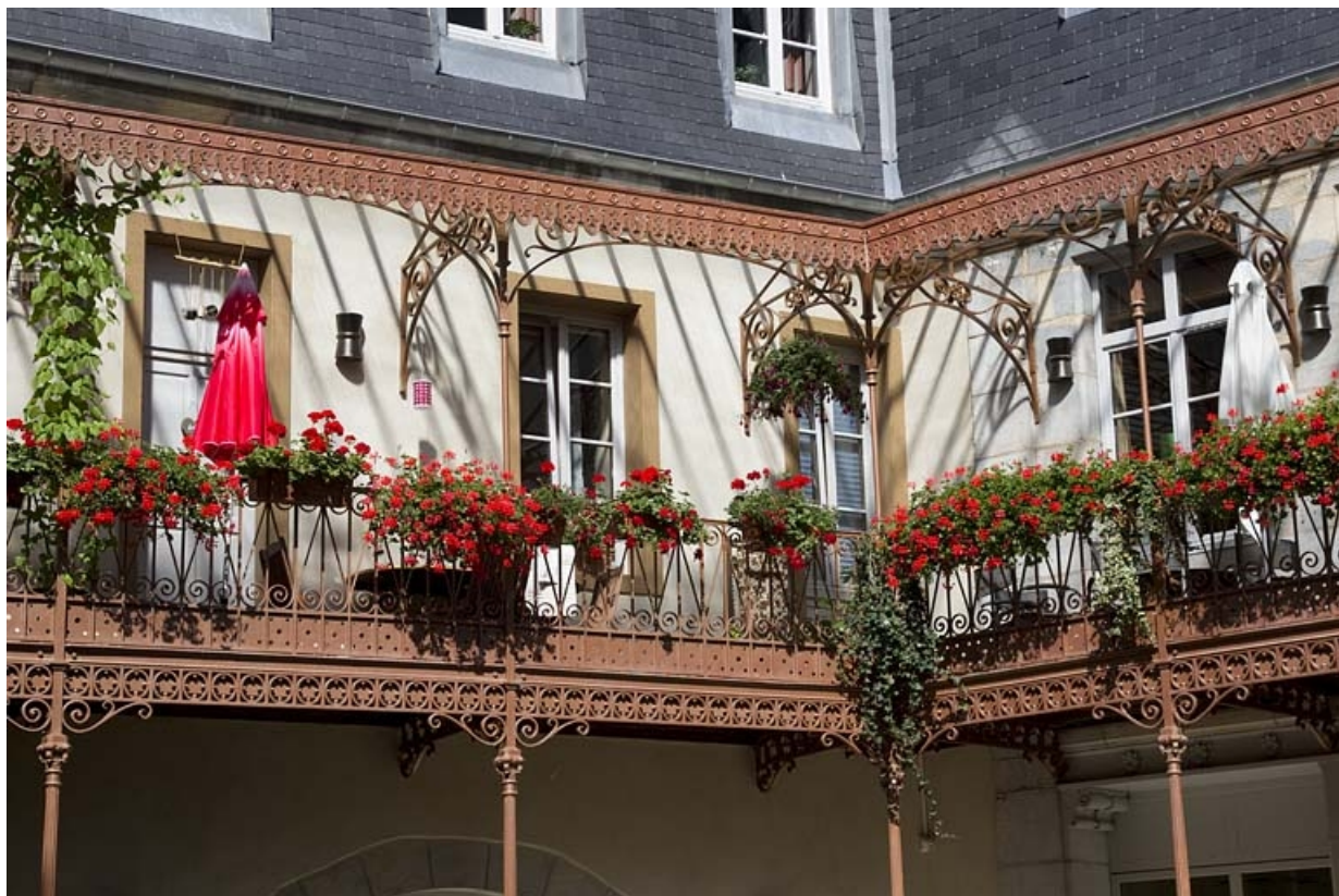
Logis principal, premier étage sur cour : détail du auvent métallique.

25, Besançon, 11 rue Pasteur, lieudit : îlot Sainte-Ursule