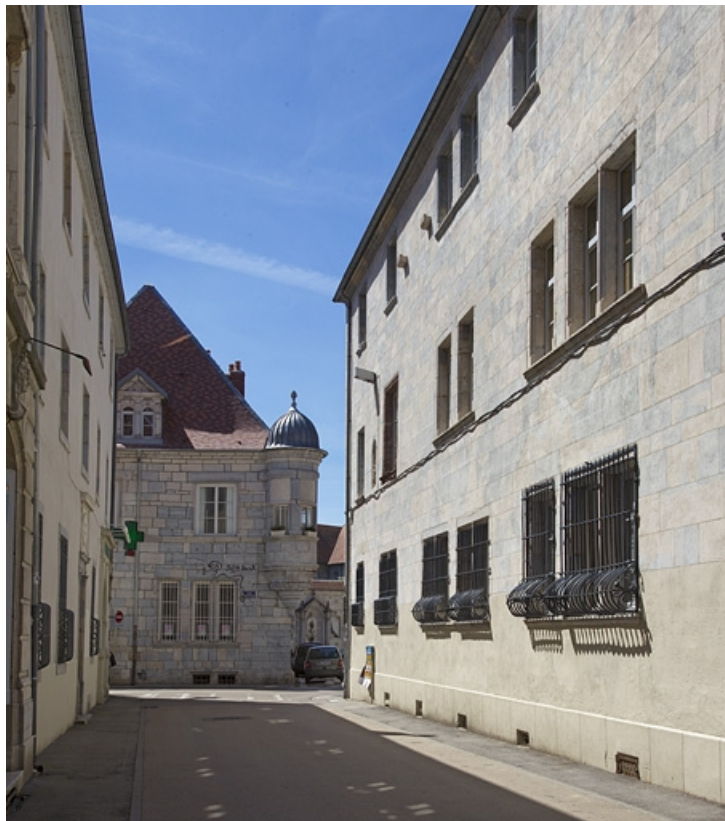
Logis principal, façade latérale droite sur rue : de trois quarts droit. 25, Besançon, 11 rue Pasteur, lieudit : îlot Sainte-Ursule