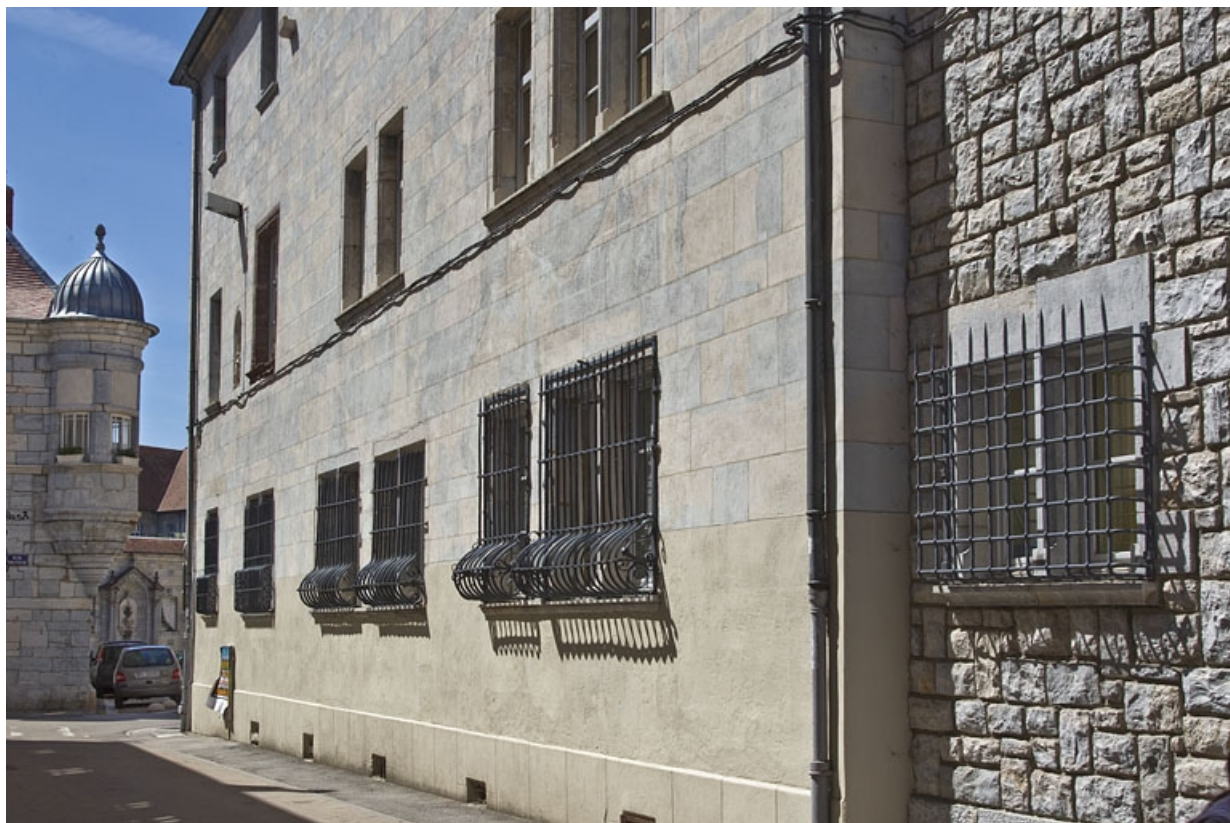
Logis principal, aile droite, façade postérieure : de trois quarts droit.

25, Besançon, 11 rue Pasteur, lieudit : îlot Sainte-Ursule