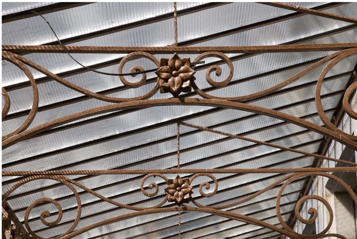
Logis principal : détail de la structure métallique du auvent.

25, Besançon, 11 rue Pasteur, lieudit : îlot Sainte-Ursule