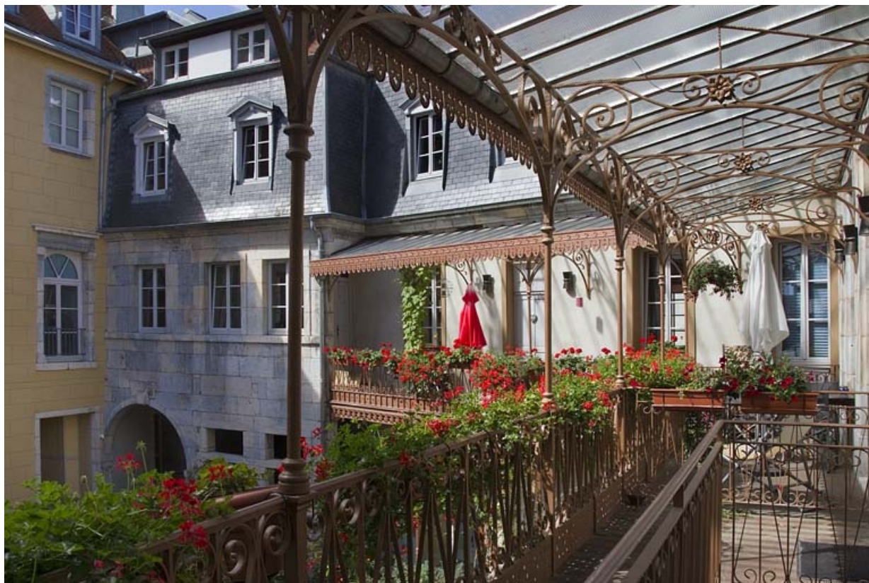
Logis principal : vue de l'intérieur du auvent métallique.

25, Besançon, 11 rue Pasteur, lieudit : îlot Sainte-Ursule