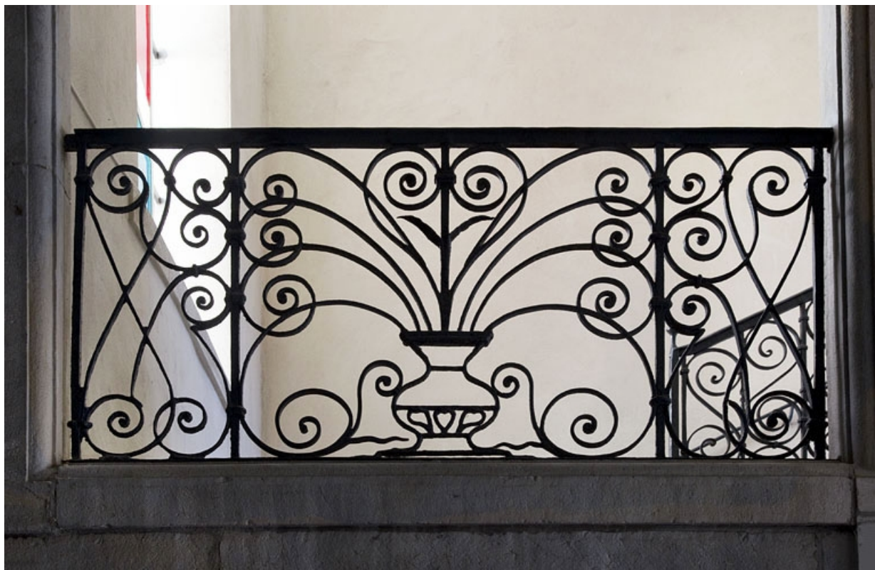
Logis principal, intérieur, escalier : détail d'un garde corps en ferronnerie.

25, Besançon, 11 rue Pasteur, lieudit : îlot Sainte-Ursule