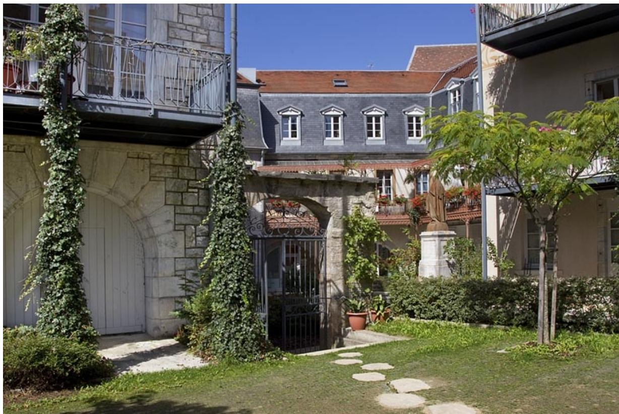
Détail de la porte séparant la cour de l'ancien jardin. 25, Besançon, 11 rue Pasteur, lieudit : îlot Sainte-Ursule