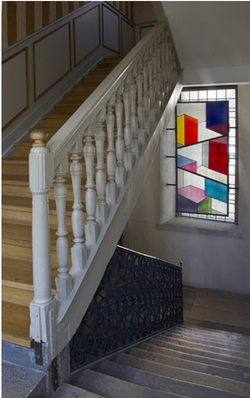
Logis principal, intérieur : détail de la partie supérieure de l'escalier avec une rampe en bois tourné. 25, Besançon, 11 rue Pasteur, lieudit : îlot Sainte-Ursule