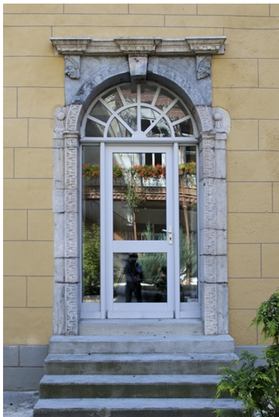
Logis principal, aile droite, façade sur cour : détail d'une porte du rez-de-chaussée.

25, Besançon, 11 rue Pasteur, lieudit : îlot Sainte-Ursule