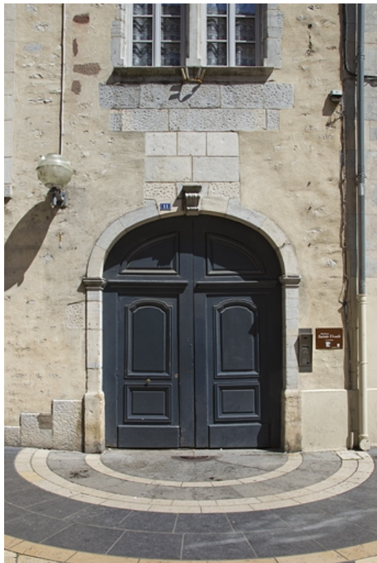
Logis principal, façade antérieure : détail du portail d'entrée.

25, Besançon, 11 rue Pasteur, lieudit : îlot Sainte-Ursule