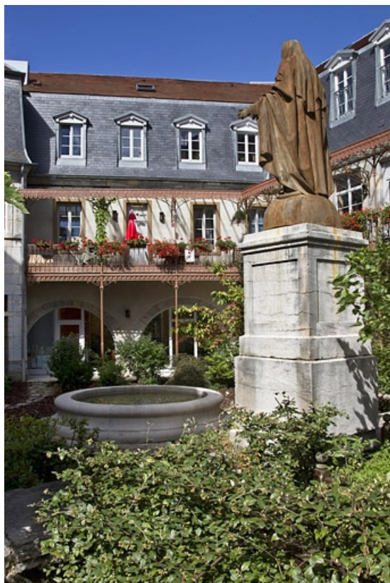
Logis principal, vue d'ensemble de la façade postérieure depuis le fond de la cour.

25, Besançon, 11 rue Pasteur, lieudit : îlot Sainte-Ursule