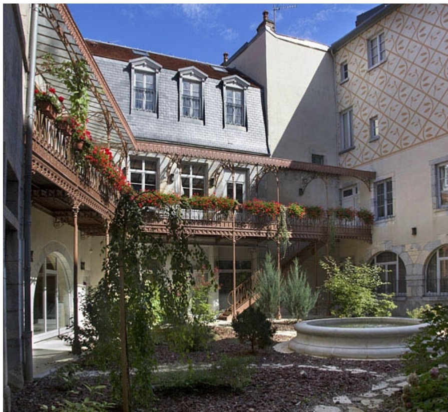
Logis principal : vue des façades depuis le fond de la cour.

25, Besançon, 11 rue Pasteur, lieudit : îlot Sainte-Ursule