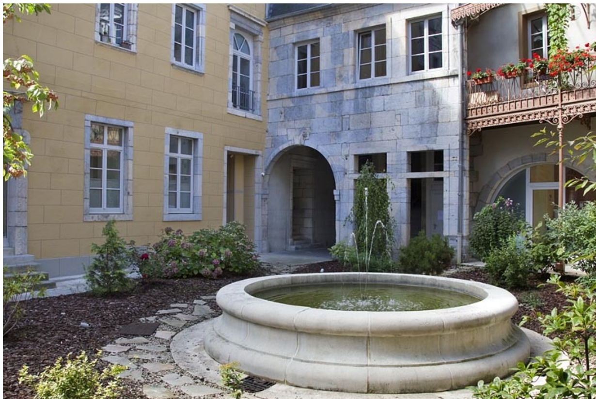
Logis principal, façade postérieure : détail du passage cocher, de trois quarts droit. 25, Besançon, 11 rue Pasteur, lieudit : îlot Sainte-Ursule