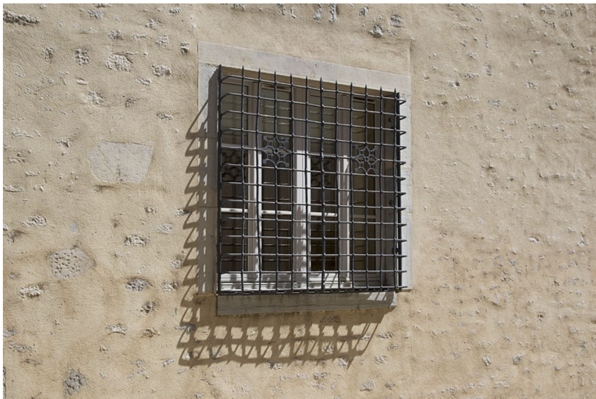
Logis principal, façade antérieure : détail d'une grille de fenêtre.

25, Besançon, 11 rue Pasteur, lieudit : îlot Sainte-Ursule