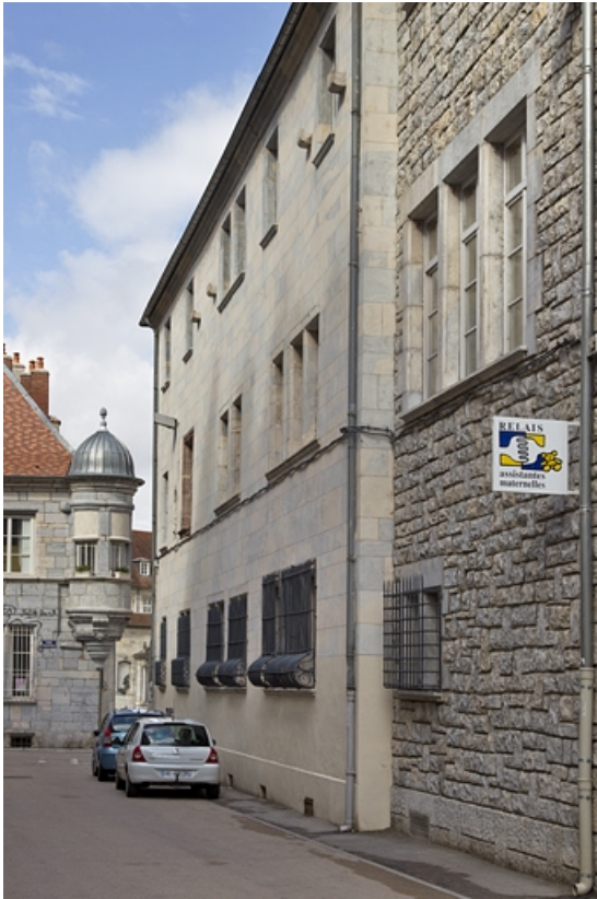
Logis principal, aile droite, façade postérieure depuis la rue d'Anvers : de trois quarts droit. 25, Besançon, 11 rue Pasteur, lieudit : îlot Sainte-Ursule