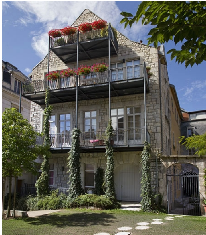
Logis principal, pignon de l'aile droite : de trois quarts droit.

25, Besançon, 11 rue Pasteur, lieudit : îlot Sainte-Ursule