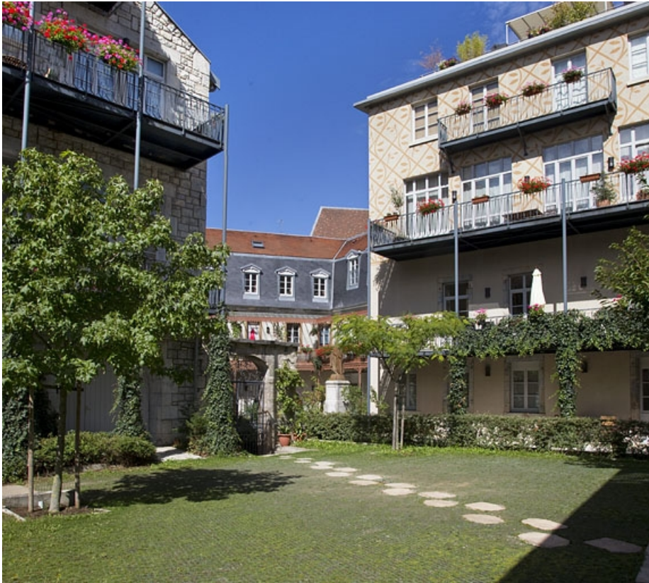
Logis secondaire depuis le fond de l'ancien jardin : de trois quarts droit.

25, Besançon, 11 rue Pasteur, lieudit : îlot Sainte-Ursule