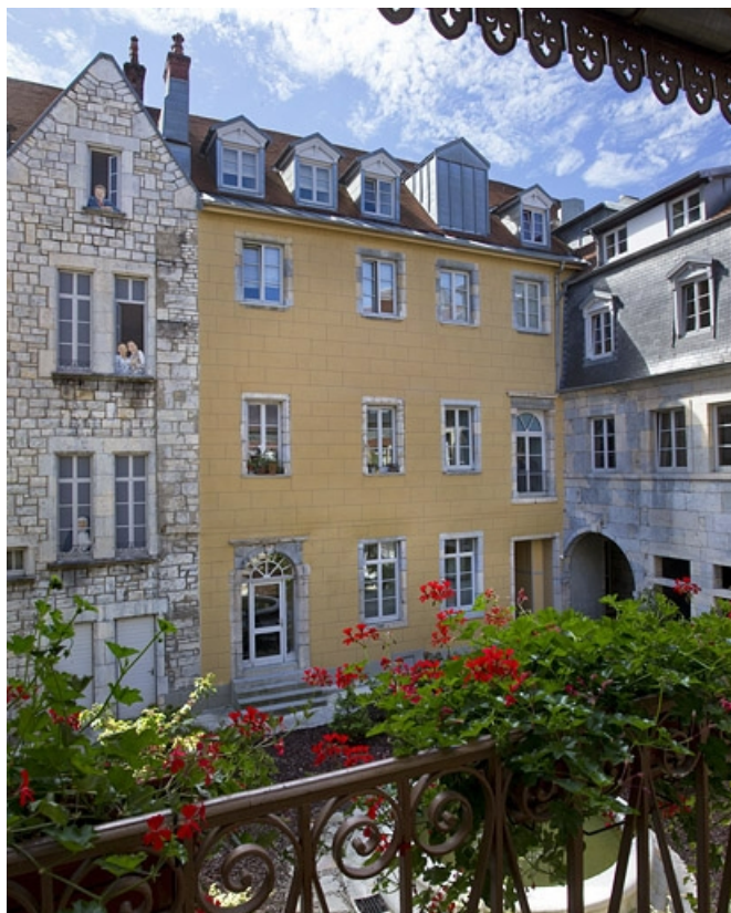
Logis principal, aile droite : façade sur cour, de trois quarts gauche. 25, Besançon, 11 rue Pasteur, lieudit : îlot Sainte-Ursule