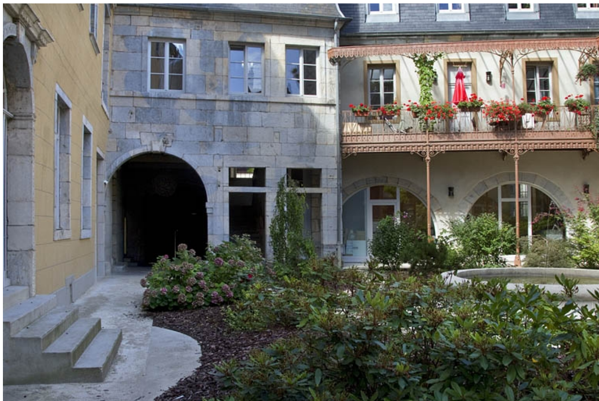
Logis principal, façade postérieure : détail du passage cocher depuis le fond de la cour.

25, Besançon, 11 rue Pasteur, lieudit : îlot Sainte-Ursule