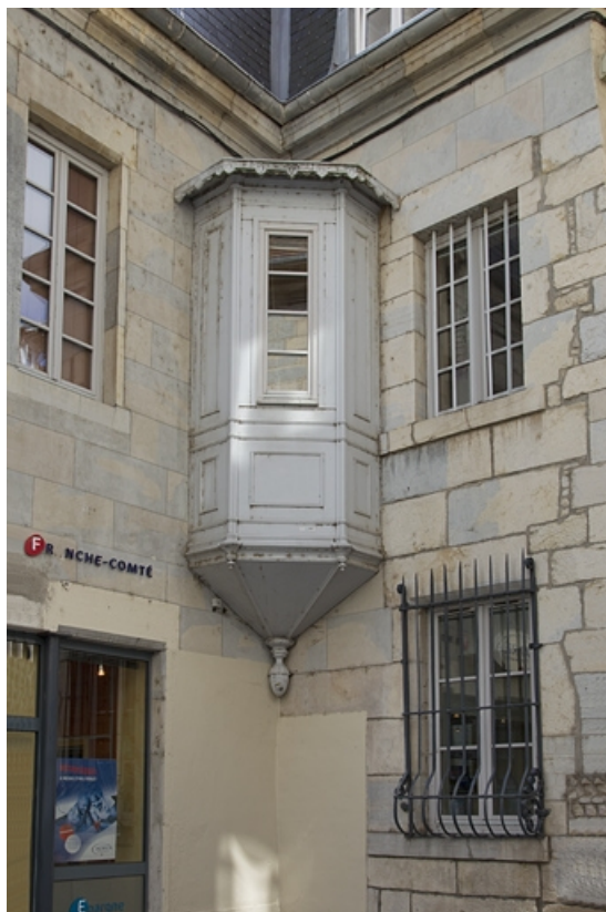
Logis principal, façade antérieure, partie gauche : détail d'une logette.

25, Besançon, 11 rue Pasteur, lieudit : îlot Sainte-Ursule