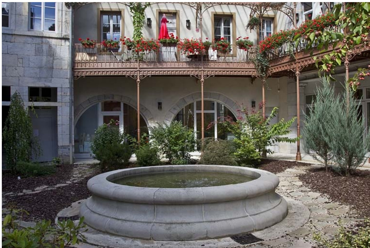
Logis principal, façade postérieure, partie gauche : détail du auvent métallique.

25, Besançon, 11 rue Pasteur, lieudit : îlot Sainte-Ursule