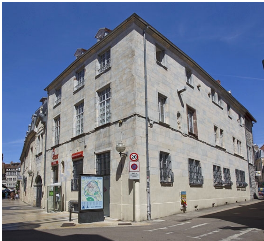
Logis principal : vue d'ensemble depuis l'angle des deux rues.

25, Besançon, 11 rue Pasteur, lieudit : îlot Sainte-Ursule