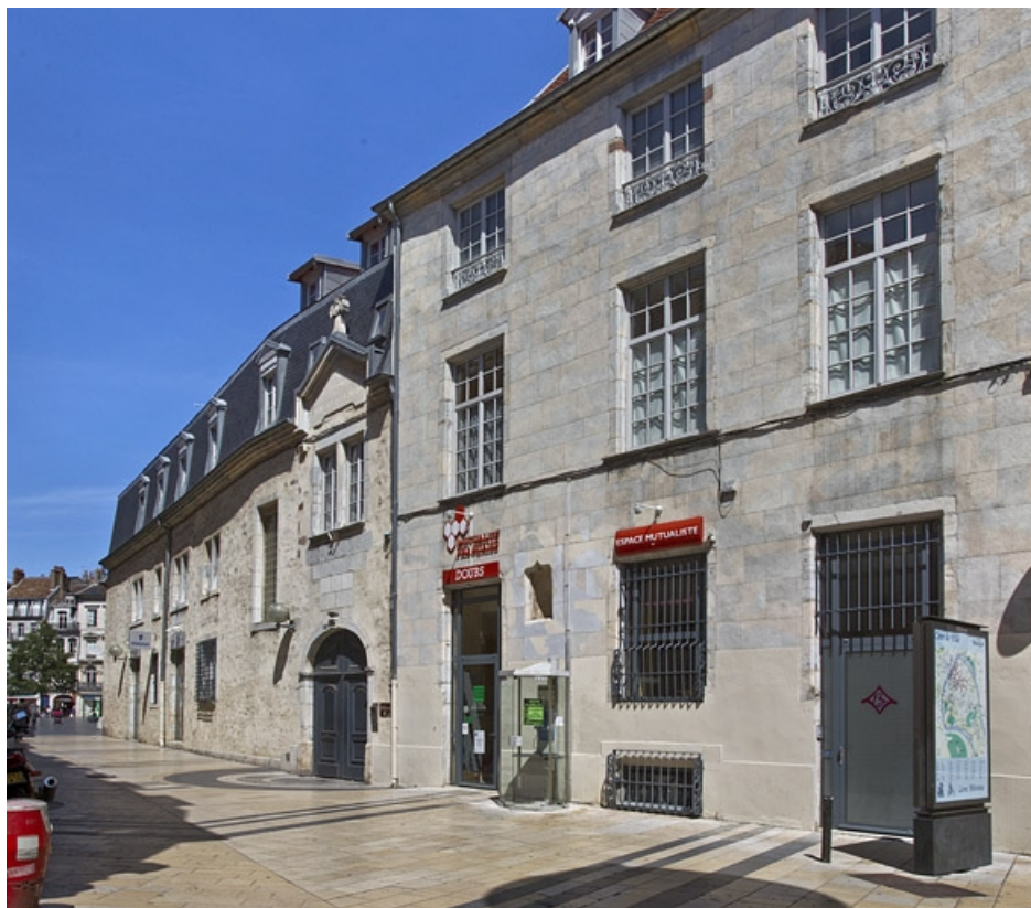
Logis principal : vue d'ensemble de la façade antérieure, de trois quarts droit. 25, Besançon, 11 rue Pasteur, lieudit : îlot Sainte-Ursule