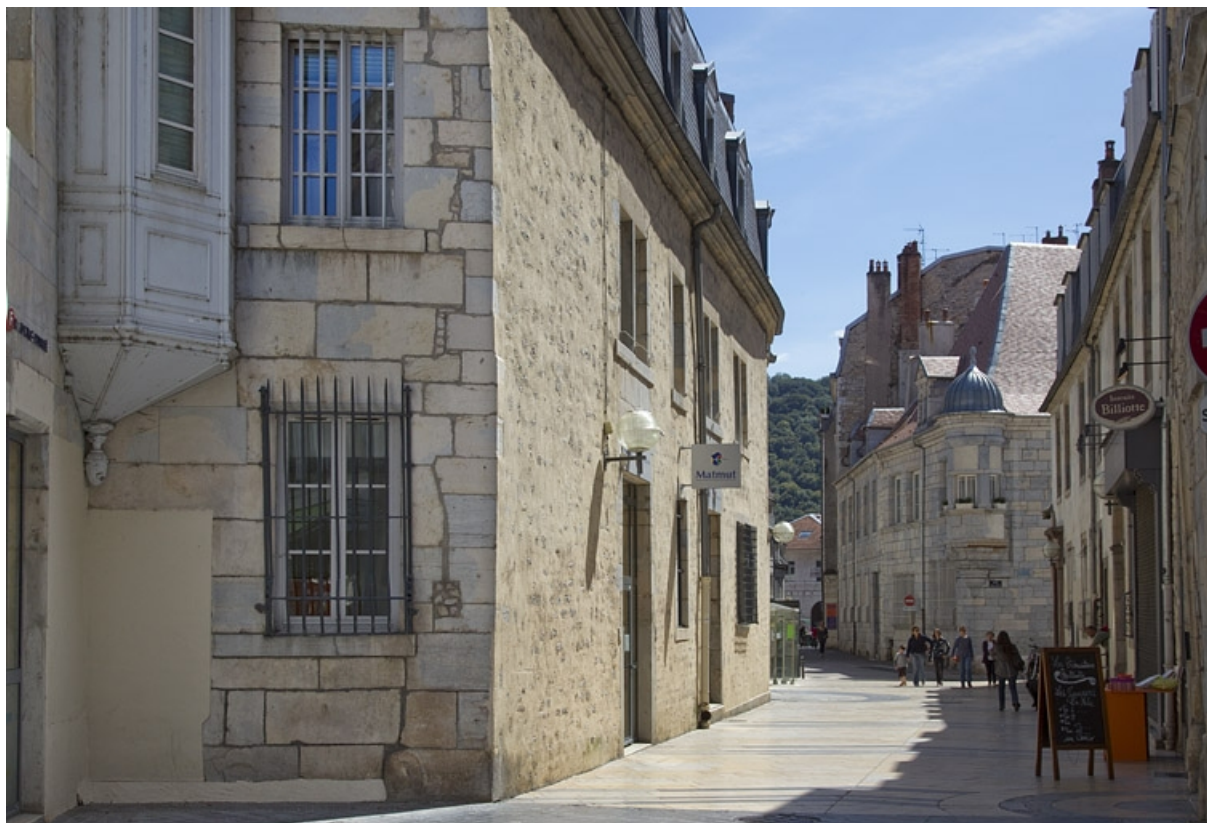
Logis principal, façade antérieure, partie gauche : de trois quarts gauche.

25, Besançon, 11 rue Pasteur, lieudit : îlot Sainte-Ursule