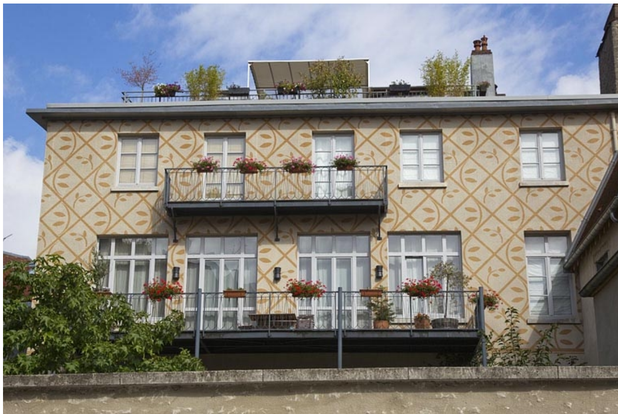
Logis secondaire, façade antérieure depuis la rue d'Anvers : de face.

25, Besançon, 11 rue Pasteur, lieudit : îlot Sainte-Ursule