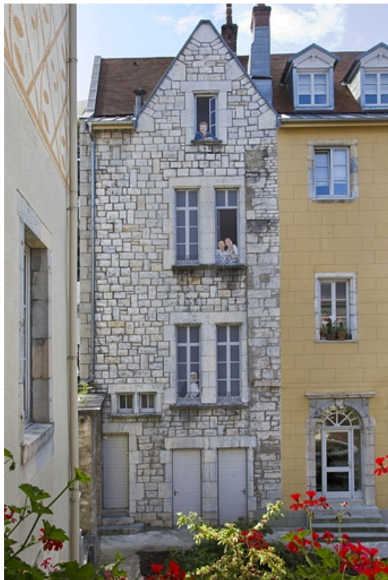
Logis principal, extrémité de l'aile droite : façade sur cour, de face.

25, Besançon, 11 rue Pasteur, lieudit : îlot Sainte-Ursule