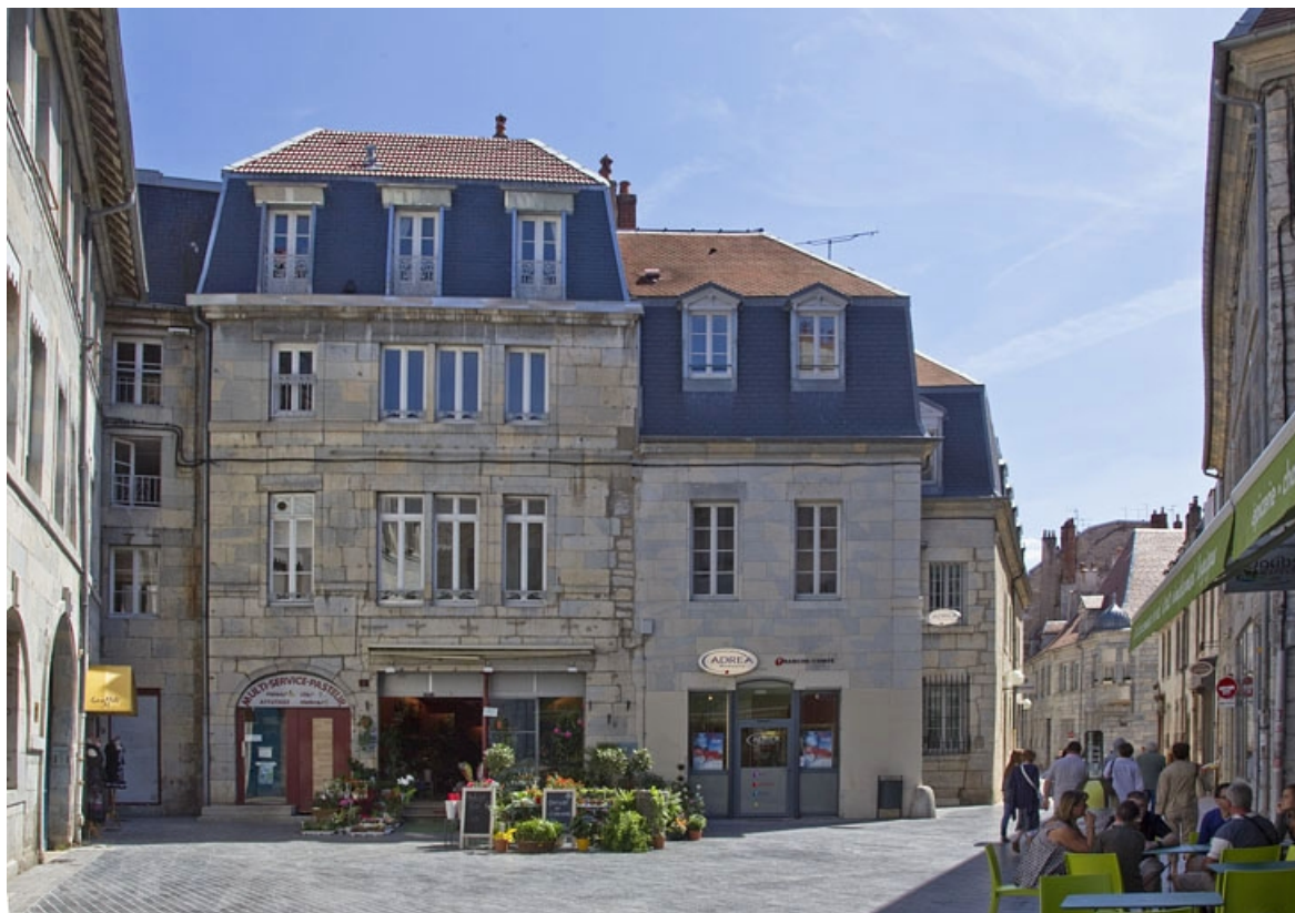
Logis principal, façade antérieure, partie gauche : vue éloignée depuis la place Pasteur.

25, Besançon, 11 rue Pasteur, lieudit : îlot Sainte-Ursule