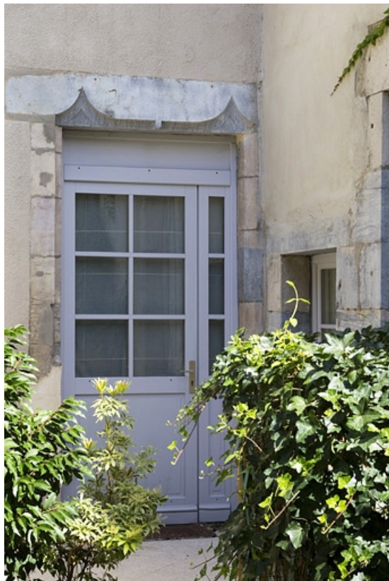
Logis principal, aile gauche sur cour : détail d'une porte du rez-de-chaussée. 25, Besançon, 11 rue Pasteur, lieudit : îlot Sainte-Ursule