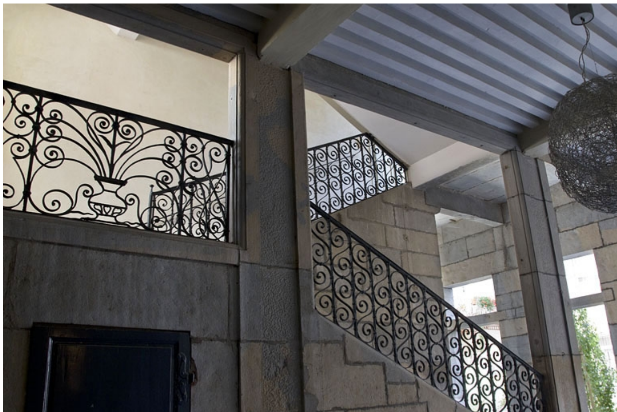
Logis principal, intérieur, escalier : détail des premières volées depuis le passage cocher.

25, Besançon, 11 rue Pasteur, lieudit : îlot Sainte-Ursule