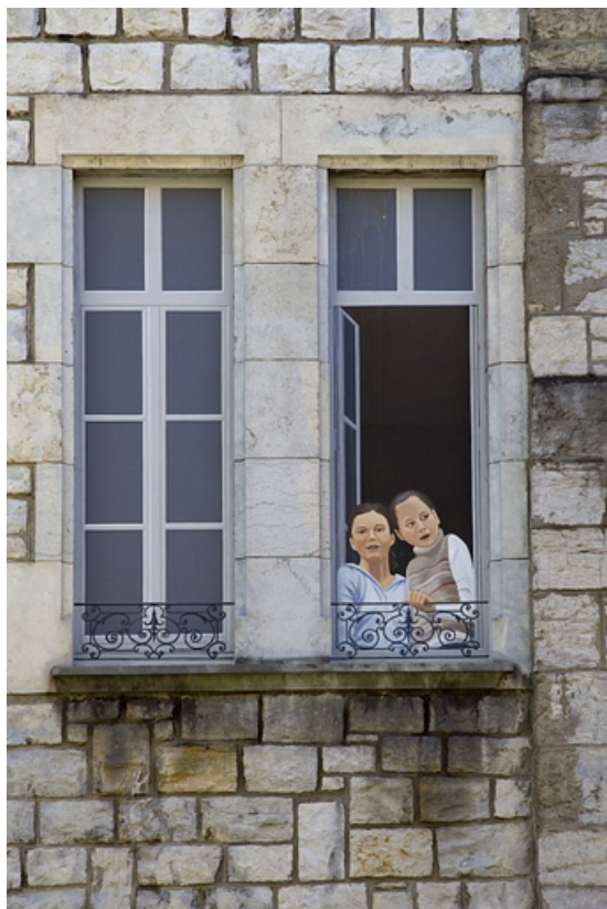
Logis principal, extrémité de l'aile droite, façade sur cour : détail des fenêtres du deuxième étage. 25, Besançon, 11 rue Pasteur, lieudit : îlot Sainte-Ursule