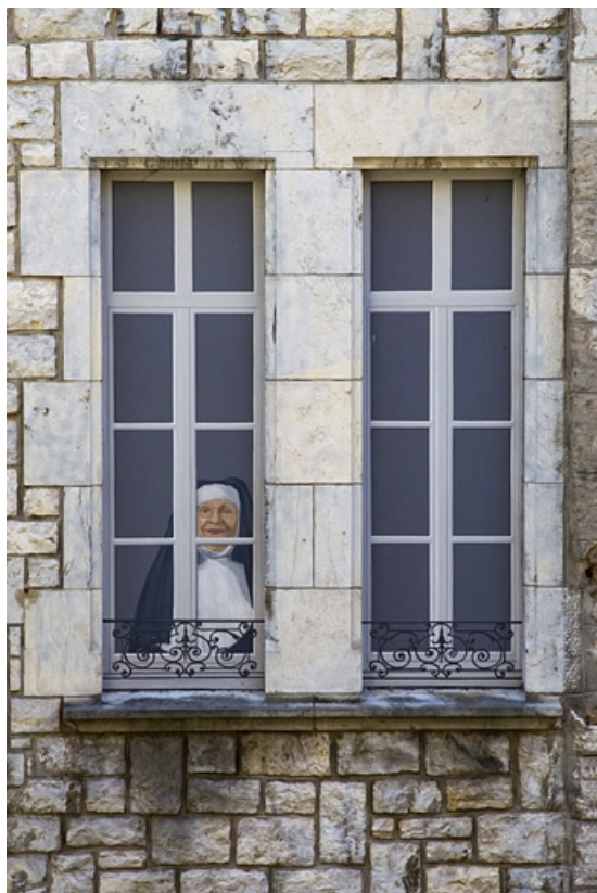
Logis principal, extrémité de l'aile droite, façade sur cour : détail des fenêtres du premier étage. 25, Besançon, 11 rue Pasteur, lieudit : îlot Sainte-Ursule