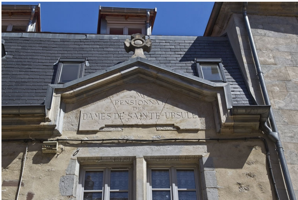
Logis principal, façade antérieure : détail de l'inscription.

25, Besançon, 11 rue Pasteur, lieudit : îlot Sainte-Ursule