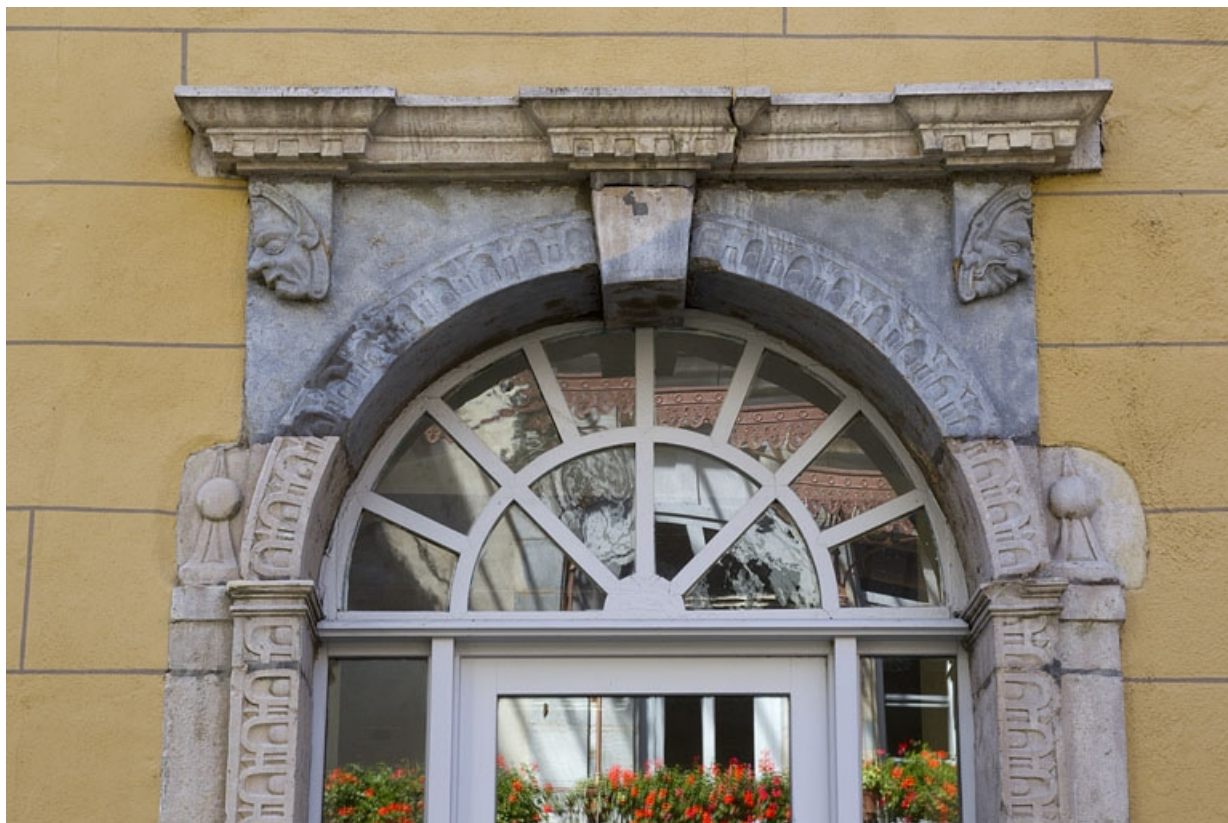
Logis principal, aile droite, façade sur cour, porte du rez-de-chaussée : détail de la partie supérieure. 25, Besançon, 11 rue Pasteur, lieudit : îlot Sainte-Ursule