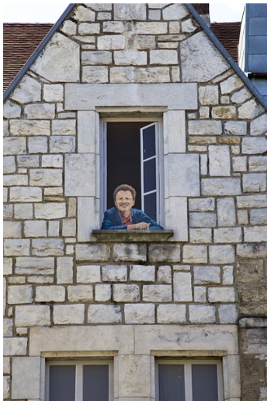
Logis principal, extrémité de l'aile droite, façade sur cour : détail de la fenêtre du pignon.

25, Besançon, 11 rue Pasteur, lieudit : îlot Sainte-Ursule