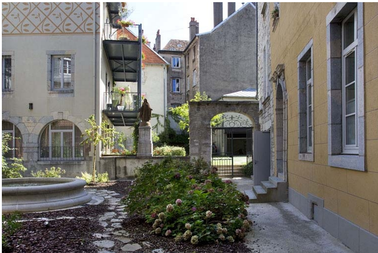
Vue de la cour depuis l'entrée.

25, Besançon, 11 rue Pasteur, lieudit : îlot Sainte-Ursule