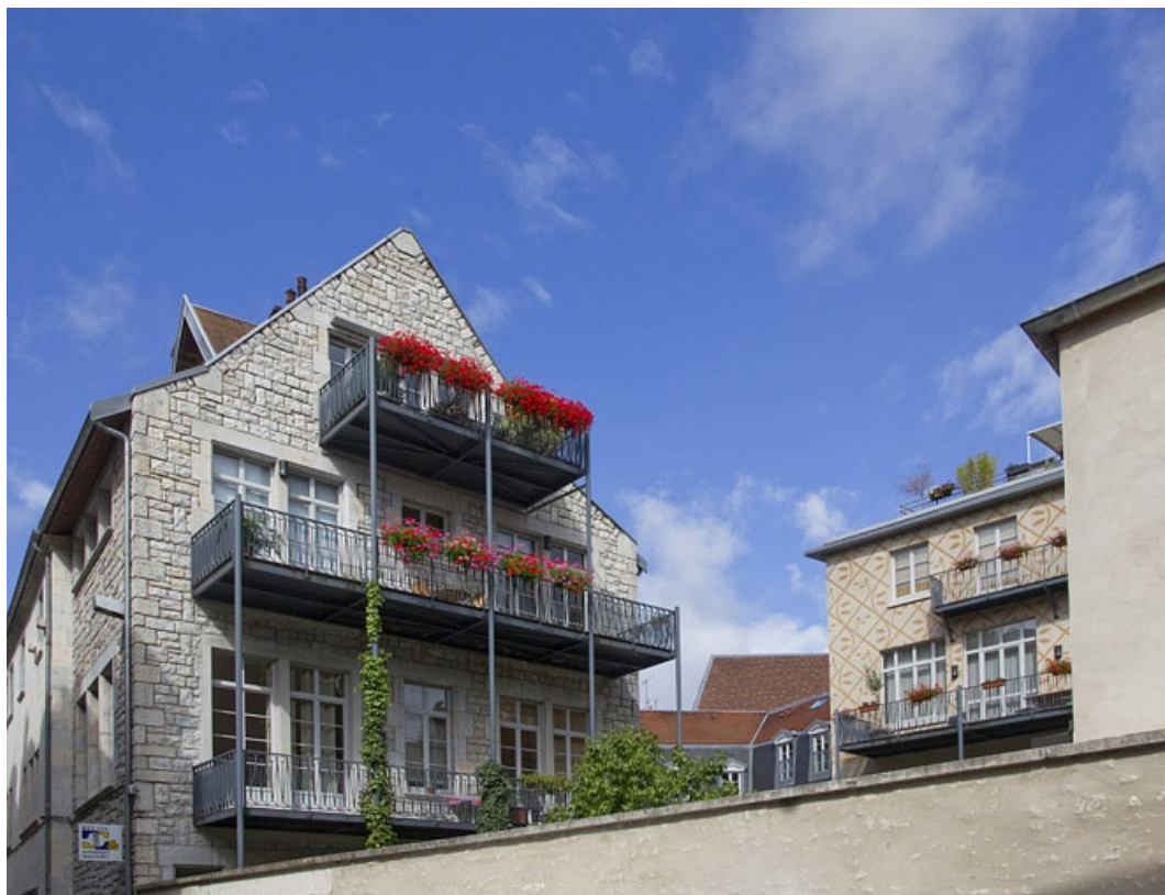
Logis principal, pignon de l'aile droite : vue d'ensemble depuis la rue d'Anvers.

25, Besançon, 11 rue Pasteur, lieudit : îlot Sainte-Ursule