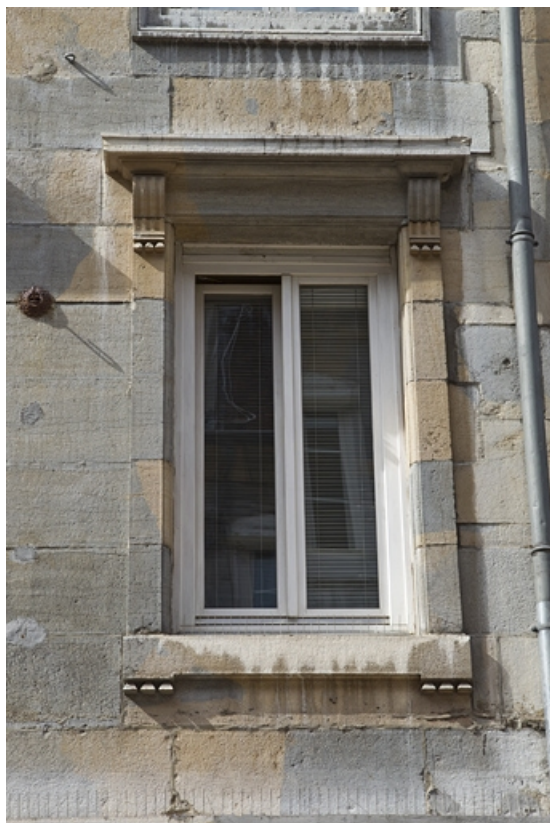
Façade antérieure : détail d'une fenêtre du premier étage.

25, Besançon Grande Rue 36, lieudit : îlot Sainte-Ursule