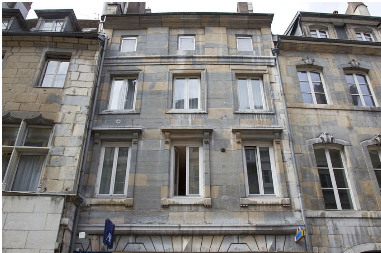
Façade antérieure : détail des étages, de face.

25, Besançon Grande Rue 36, lieudit : îlot Sainte-Ursule