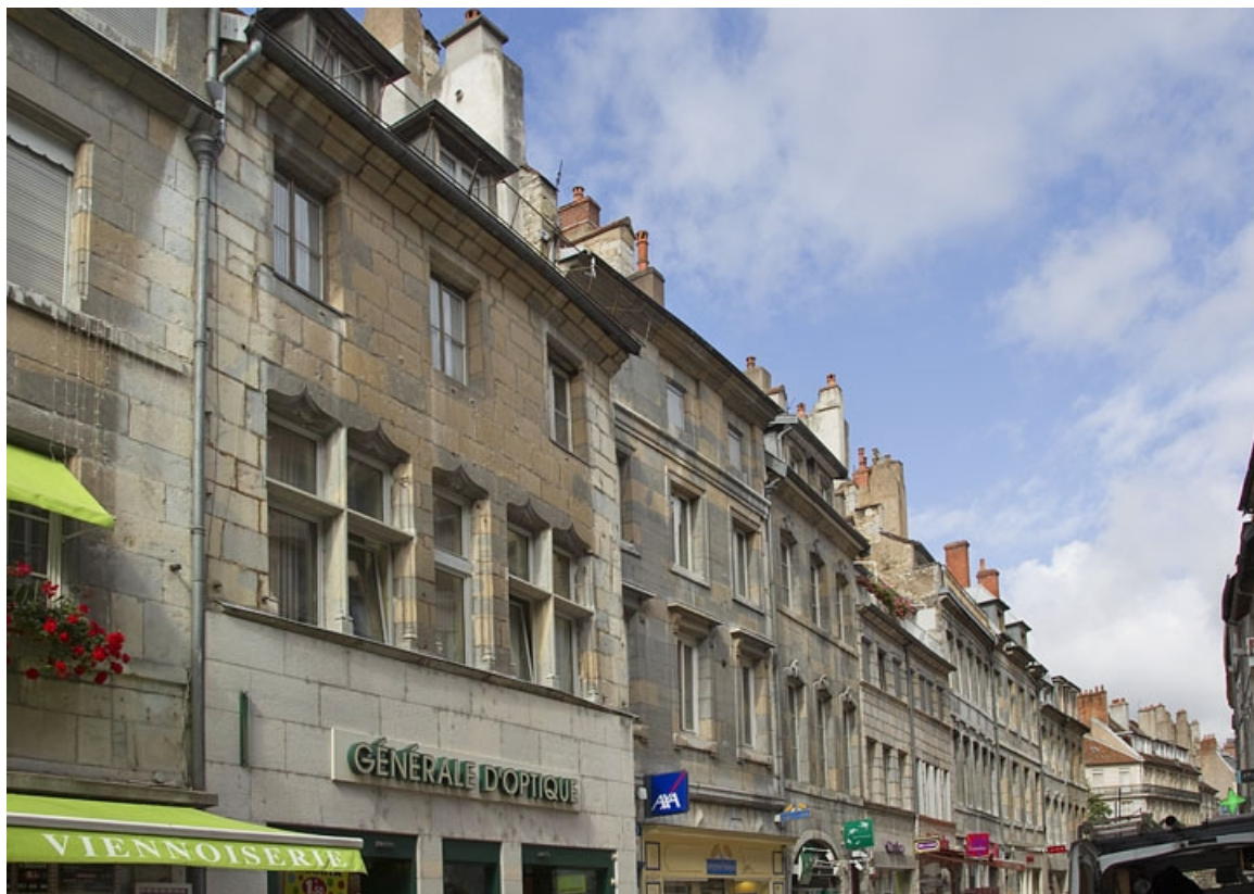
Vue d'ensemble éloignée depuis la rue : de trois quarts gauche.

25, Besançon Grande Rue 36, lieudit : îlot Sainte-Ursule