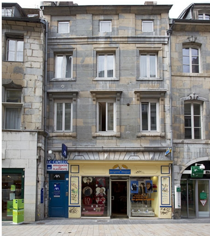
Vue d'ensemble de la façade antérieure : de face.

25, Besançon Grande Rue 36, lieudit : îlot Sainte-Ursule