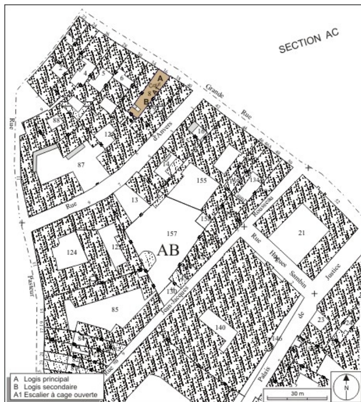
Plan masse et de situation. Extrait du plan cadastral, 1974, section AB. 25, Besançon Grande Rue 36, lieudit : îlot Sainte-Ursule