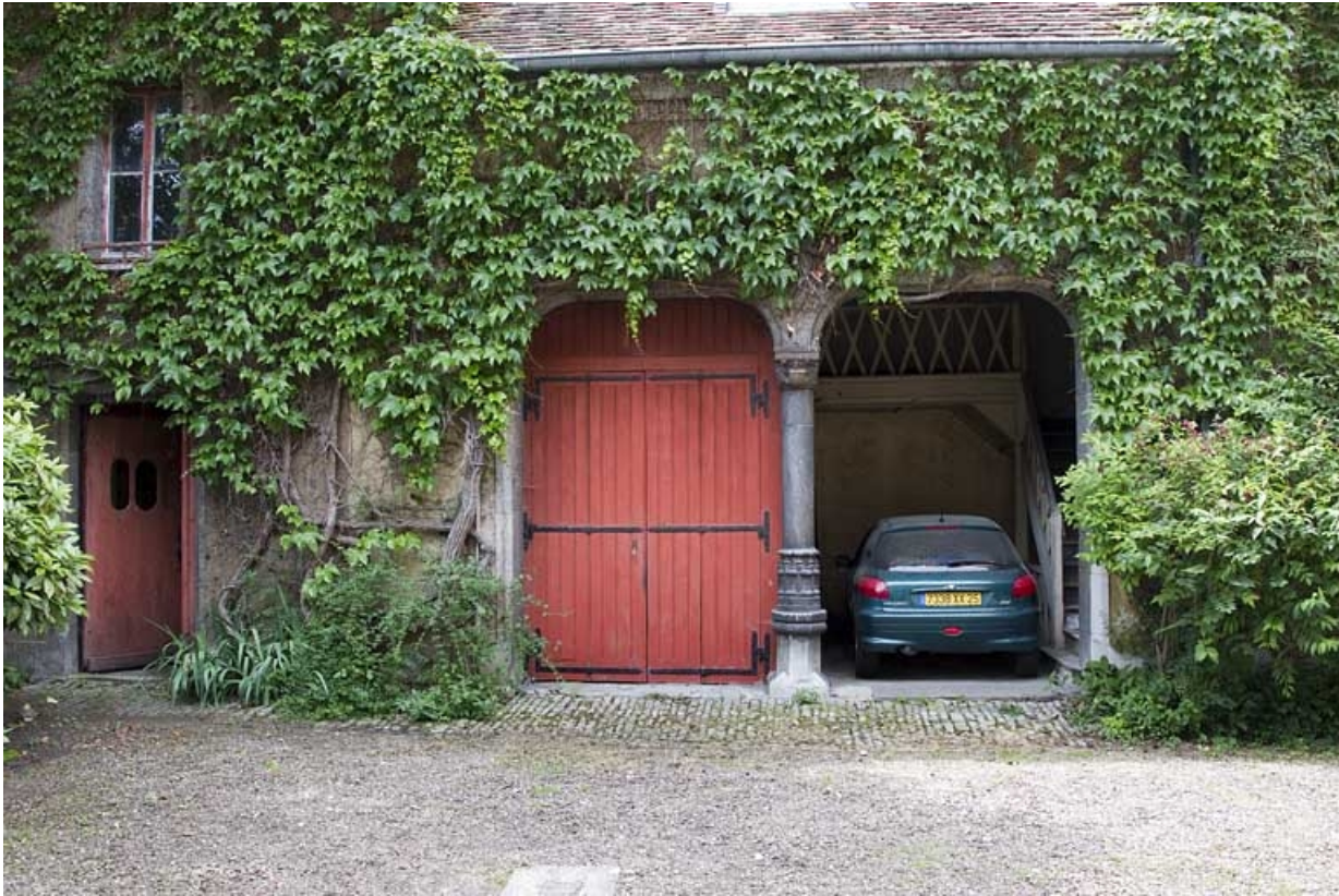
Bâtiment des remises : façade antérieure.

25, Besançon, 7 rue d' Anvers, lieudit : îlot d' Emskerque