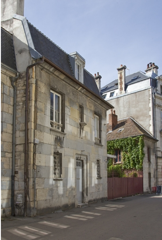
Vue d'ensemble depuis la rue, de trois quarts gauche.

25, Besançon, 7 rue d' Anvers, lieudit : îlot d' Emskerque