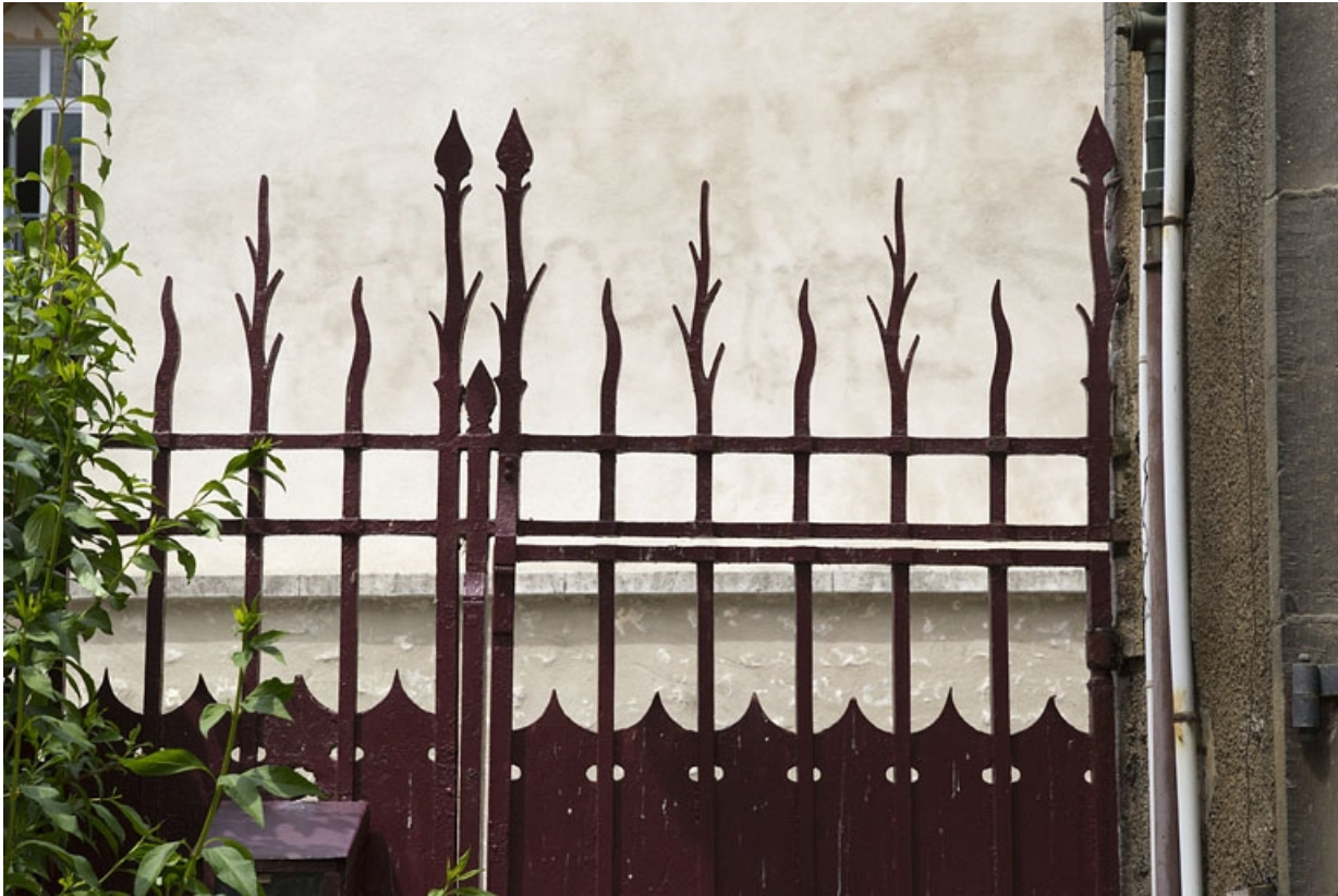
Clôture de cour : détail de la partie supérieure du portail.

25, Besançon, 7 rue d' Anvers, lieudit : îlot d' Emskerque