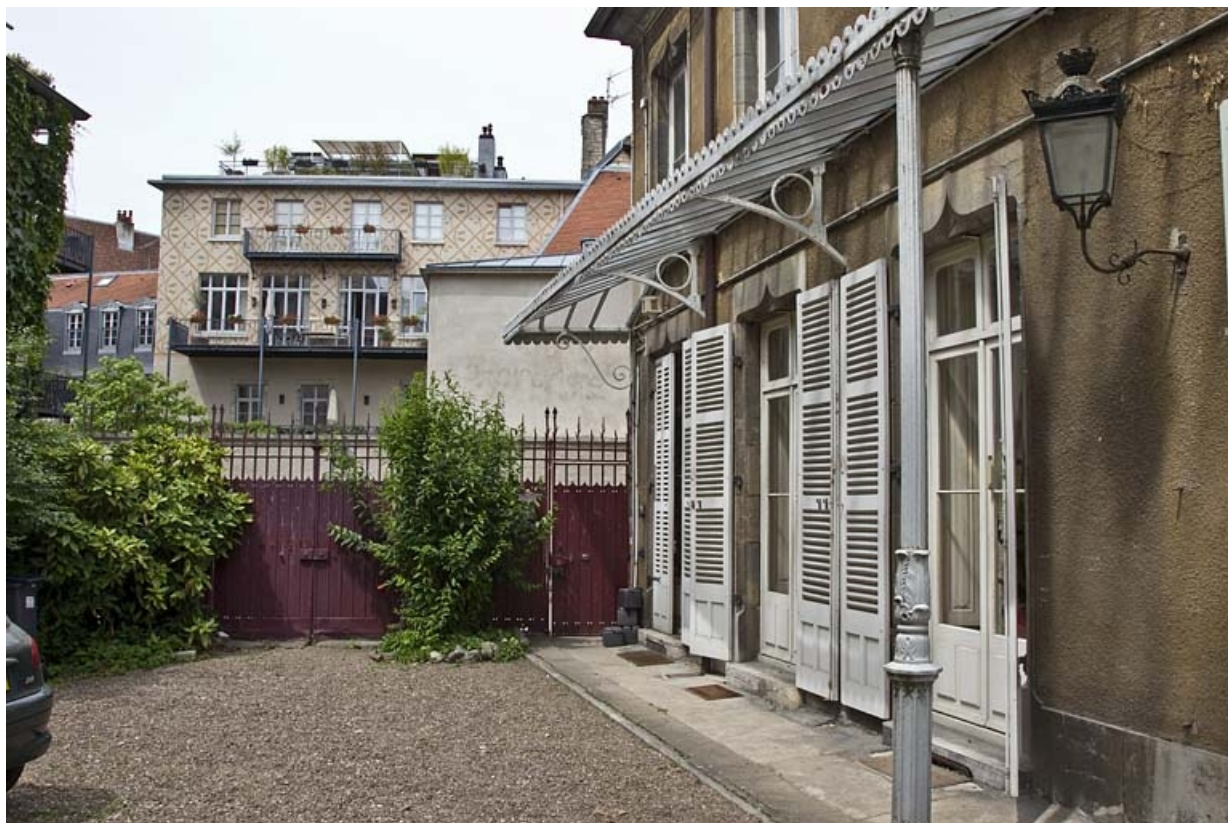
Vue de la cour depuis le fond de la parcelle : de trois quart gauche.

25, Besançon, 7 rue d' Anvers, lieudit : îlot d' Emskerque