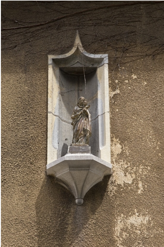
Logis principal, façade antérieure : détail de la niche. 25, Besançon, 7 rue d' Anvers, lieudit : îlot d' Emskerque