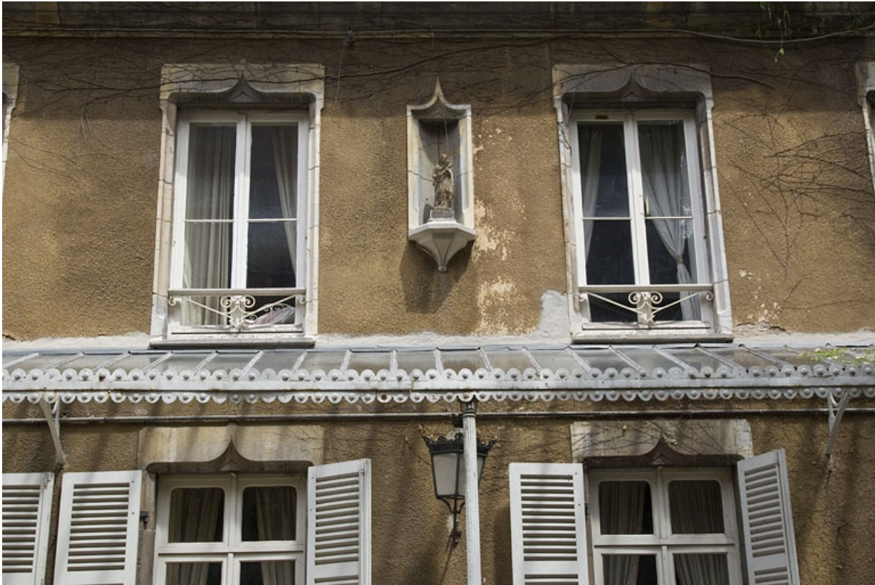
Logis principal, façade antérieure : fenêtres et niche du premier étage.

25, Besançon, 7 rue d' Anvers, lieudit : îlot d' Emskerque