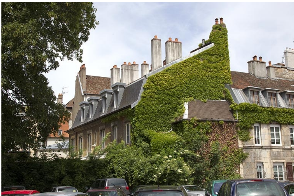
Vue du logis principal depuis la parcelle voisine, de trois quarts droit.

25, Besançon, 7 rue d' Anvers, lieudit : îlot d' Emskerque