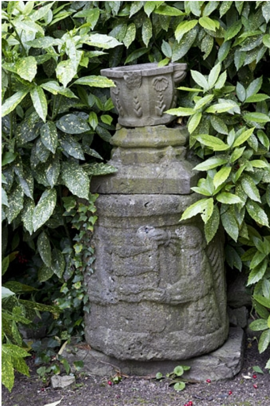
Cour : détail d'une sculpture déposée.

25, Besançon, 7 rue d' Anvers, lieudit : îlot d' Emskerque