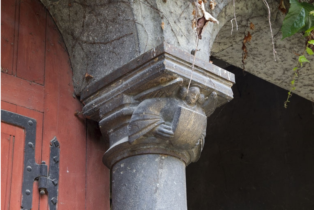
Bâtiment des remises, détail d'un chapiteau : ange portant un écu, de trois quarts gauche.

25, Besançon, 7 rue d' Anvers, lieu dit : îlot d' Emskerque