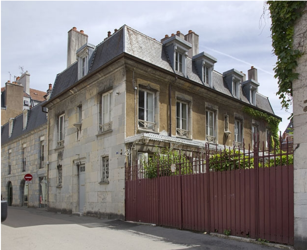
Vue d'ensemble depuis la rue, de trois quarts droit.

25, Besançon, 7 rue d' Anvers, lieudit : îlot d' Emskerque