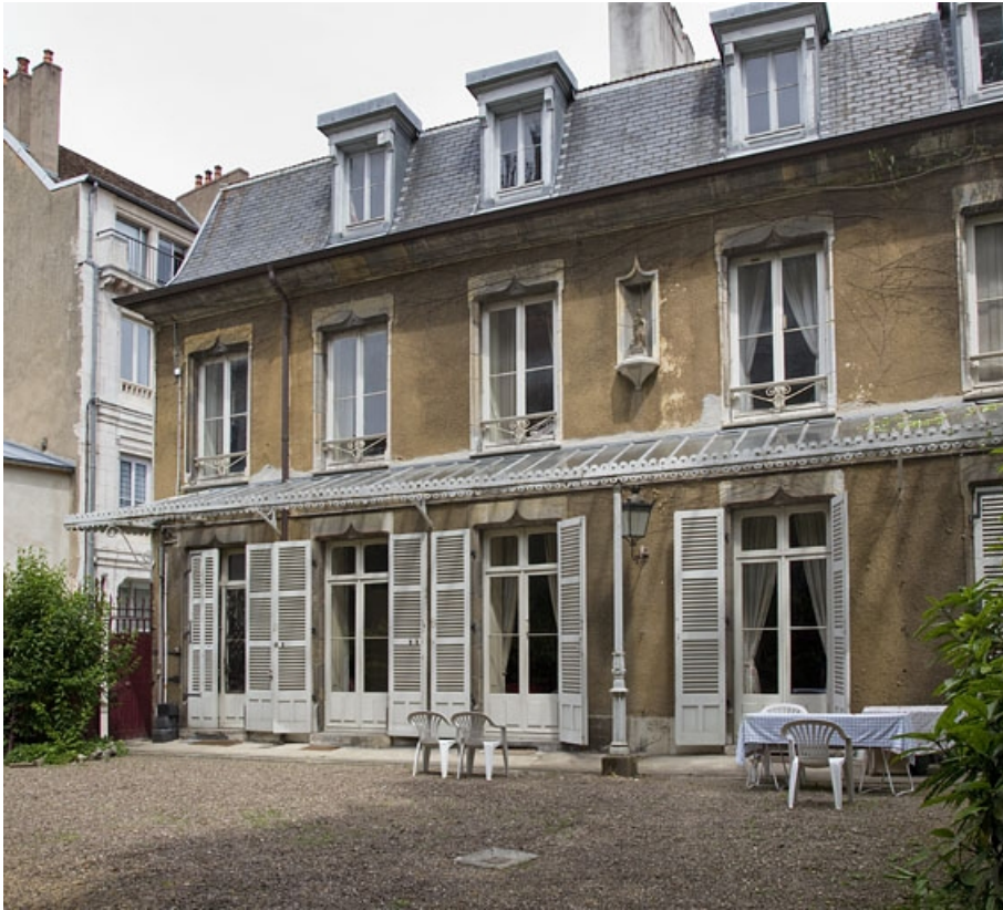
Vue d'ensemble de la façade antérieure, de trois quarts droit.

25, Besançon, 7 rue d' Anvers, lieudit : îlot d' Emskerque