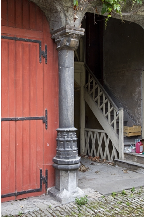
Bâtiment des remises : détail de la colonne et de son chapiteau.

25, Besançon, 7 rue d' Anvers, lieudit : îlot d' Emskerque