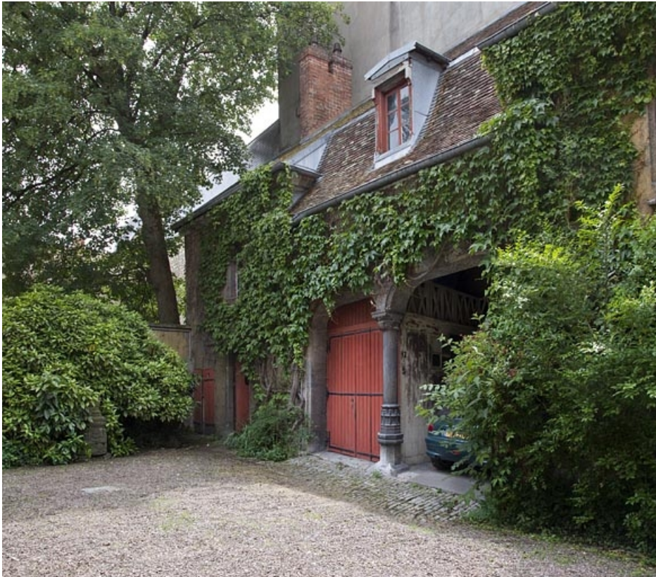
Vue d'ensemble du bâtiment des remises et du bûcher.

25, Besançon, 7 rue d' Anvers, lieudit : îlot d' Emskerque