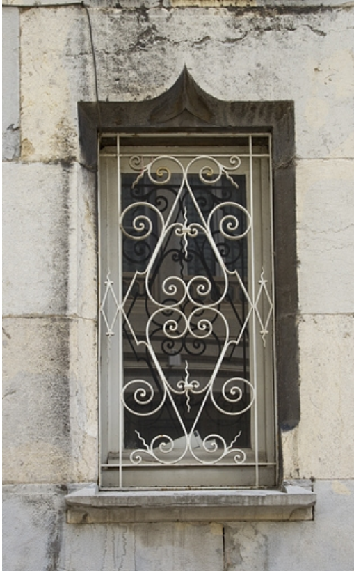
Logis principal, façade sur rue : détail de la ferronnerie d'une fenêtre.

25, Besançon, 7 rue d' Anvers, lieudit : îlot d' Emskerque