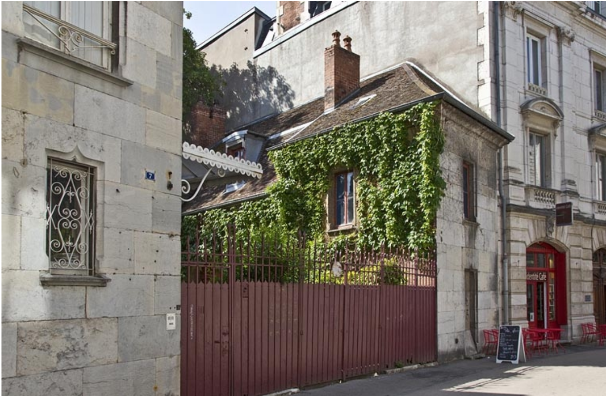
Détail de la clôture de cour sur rue, de trois quarts gauche.

25, Besançon, 7 rue d' Anvers, lieudit : îlot d' Emskerque