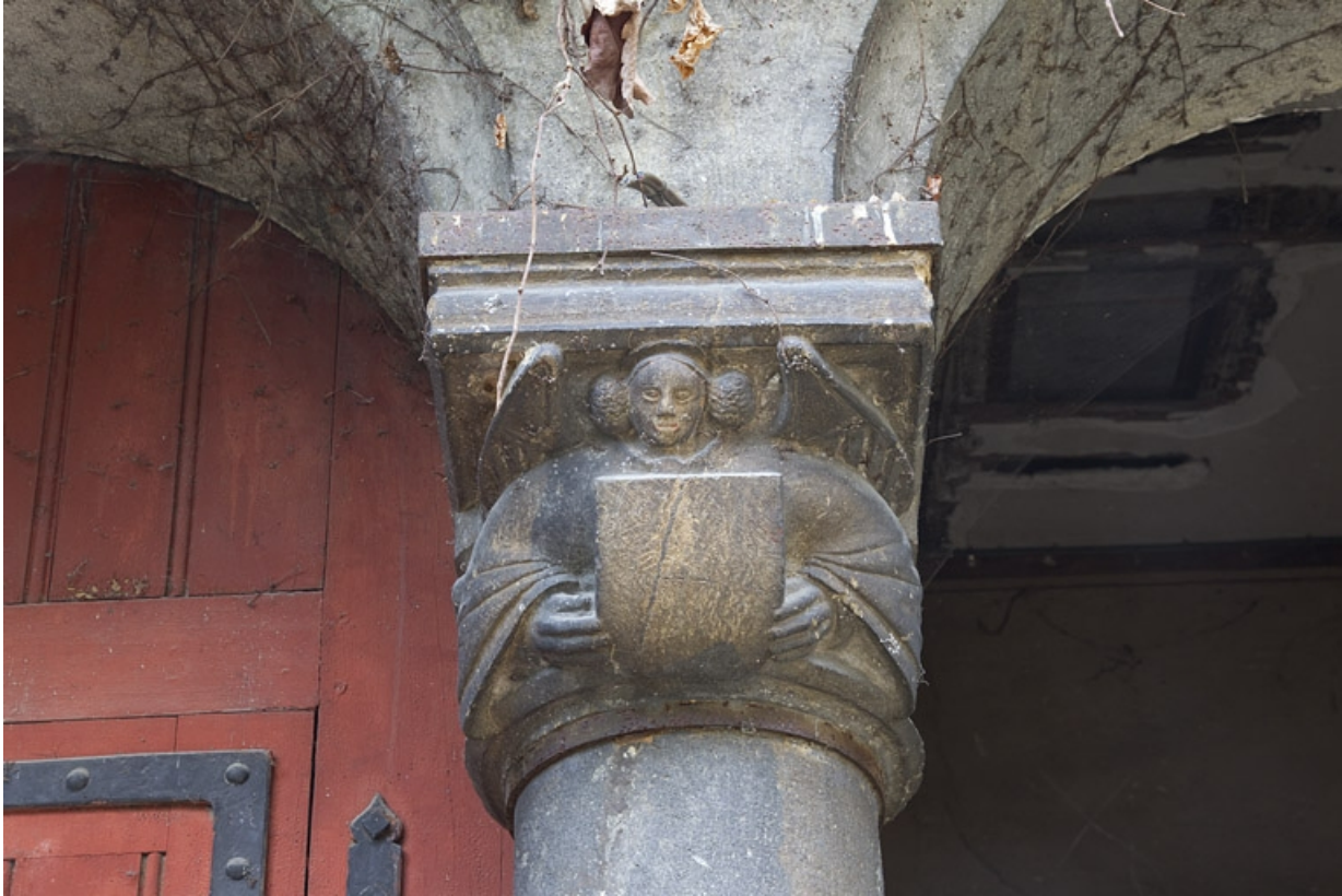
Bâtiment des remises, détail d'un chapiteau : anges portant un écu, de face.

25, Besançon, 7 rue d' Anvers, lieudit : îlot d' Emskerque