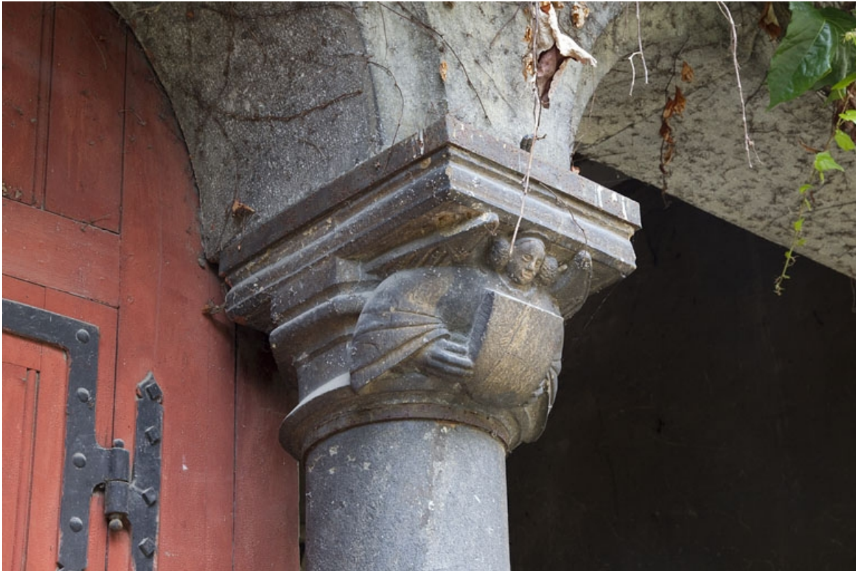
Bâtiment des remises, détail d'un chapiteau : ange portant un écu, de trois quarts gauche.

25, Besançon, 7 rue d' Anvers, lieudit : îlot d' Emskerque