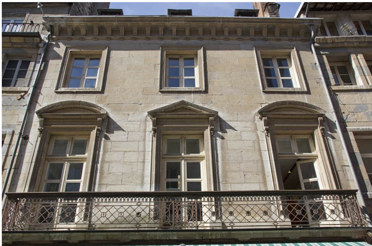
Logis principal, façade sur rue : détail des premier et deuxième étages, de face.

25, Besançon Grande Rue 48, lieudit : îlot d' Emskerque