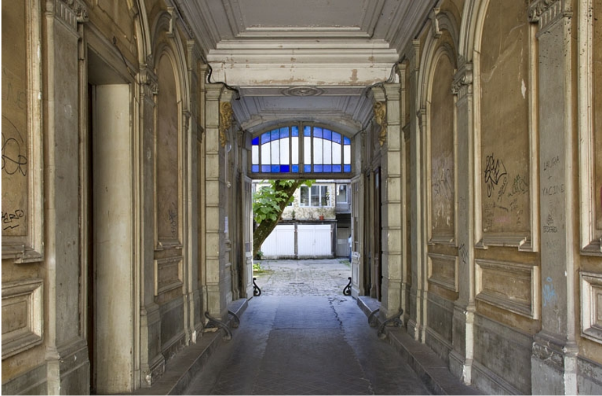
Logis principal, passage cocher : vue en direction de la cour. 25, Besançon, 9 rue d' Anvers, lieudit : îlot d' Emskerque