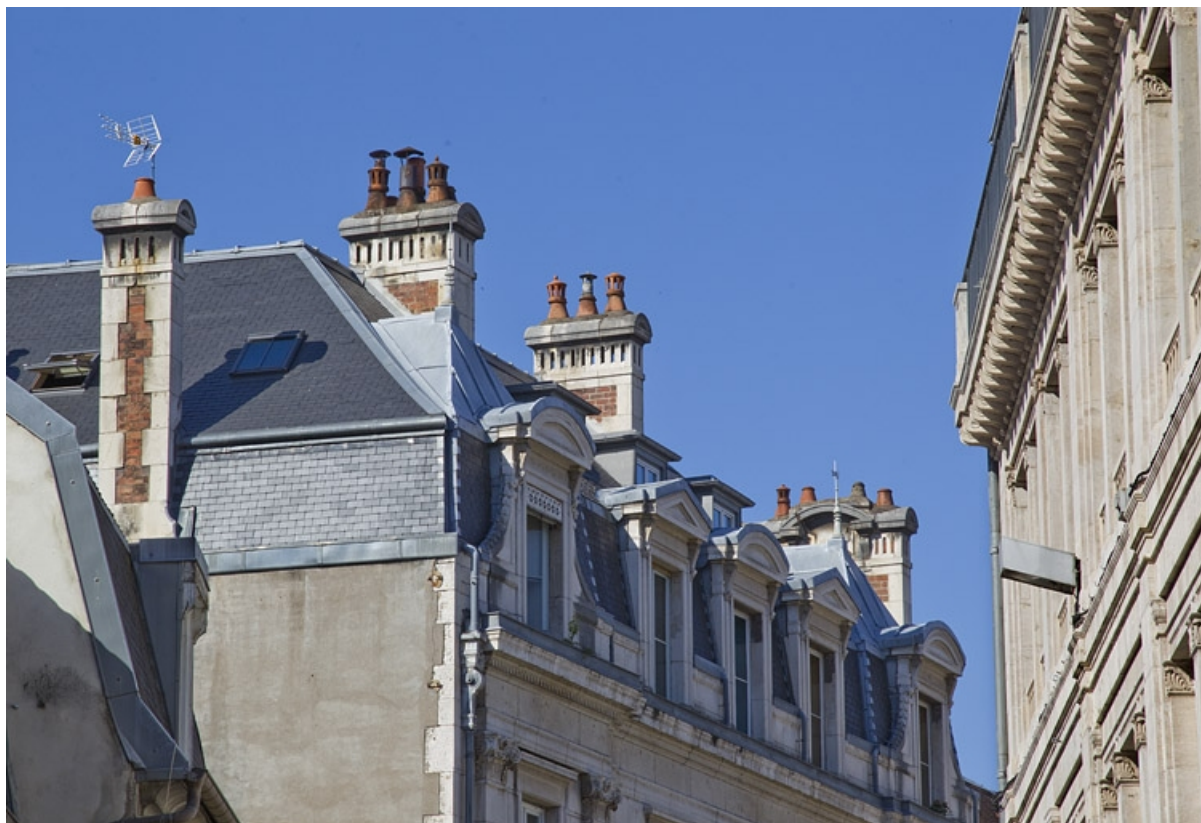
Logis principal : détail de l'étage de comble.

25, Besançon, 9 rue d' Anvers, lieudit : îlot d' Emskerque