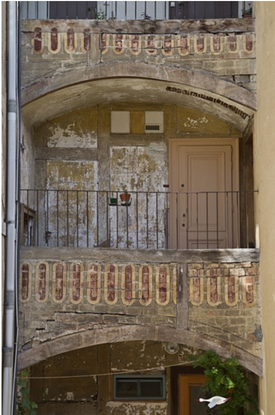
Galleries superposées entre le logis secondaire gauche et le logis principal : détail de la galerie du deuxième étage.

25, Besançon, 15 rue Pasteur, lieudit : îlot d' Emskerque