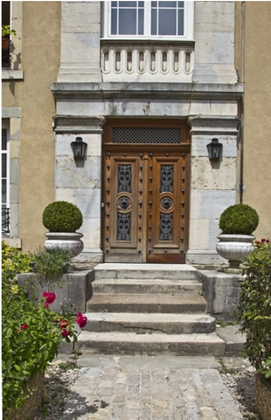
Logis secondaire à gauche dans la cour, façade : détail de la porte d'entrée.

25, Besançon, 15 rue Pasteur, lieudit : îlot d' Emskerque