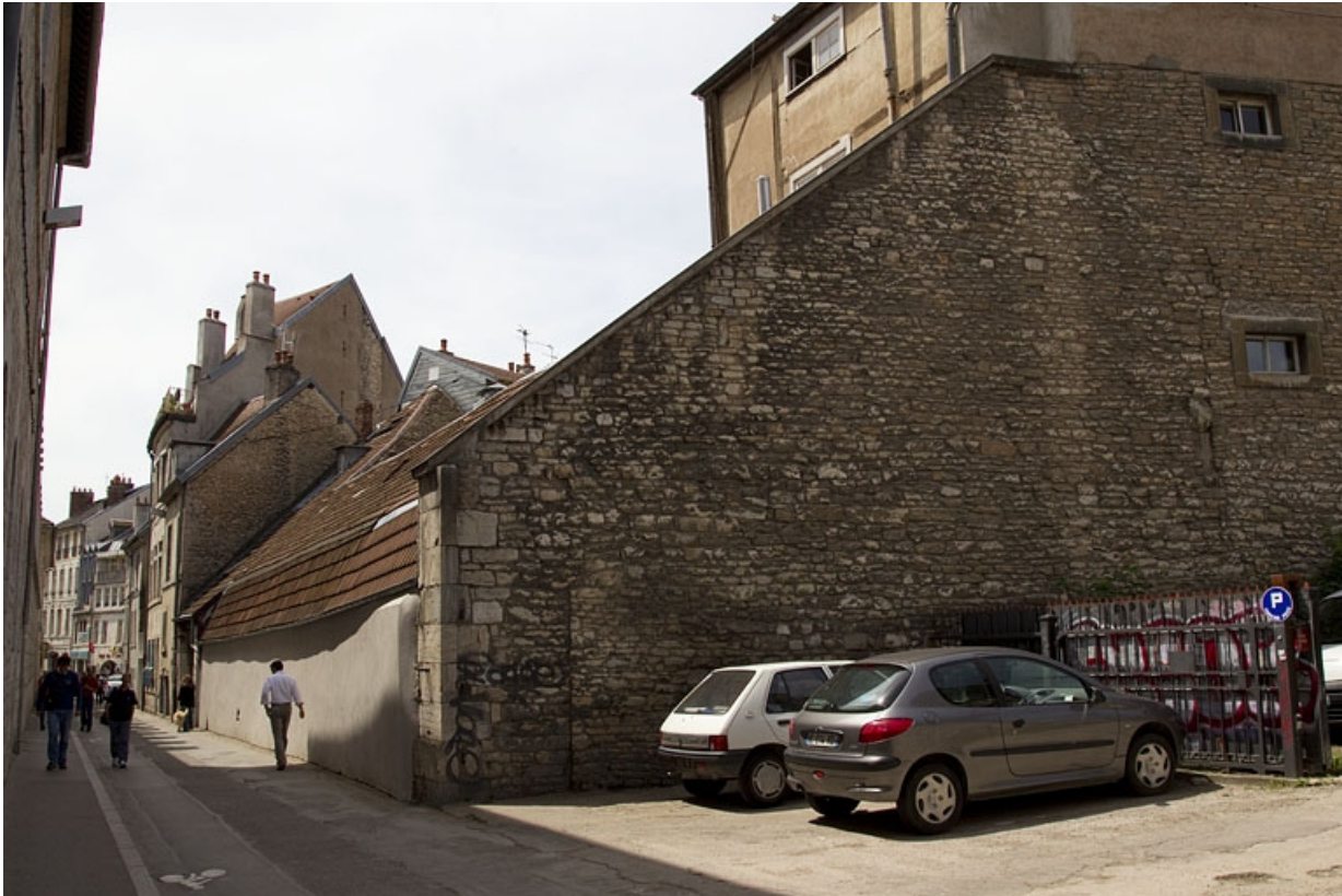
Logis secondaire au fond de la cour : façade postérieure, de trois quarts droit. 25, Besançon, 15 rue Pasteur, lieudit : îlot d' Emskerque