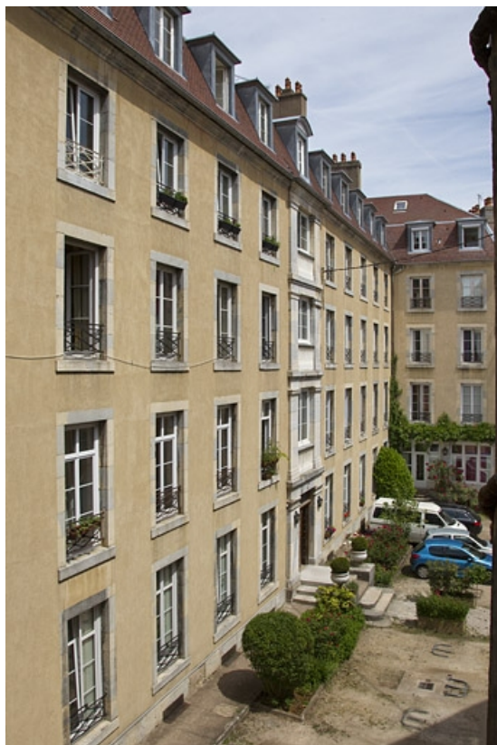
Logis secondaire gauche : vue d'ensemble de la façade antérieure, de trois quarts droit.

25, Besançon, 15 rue Pasteur, lieudit : îlot d' Emskerque