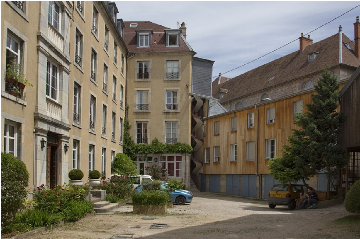
Vue des logis secondaires depuis l'entrée de la cour.

25, Besançon, 15 rue Pasteur, lieudit : îlot d' Emskerque