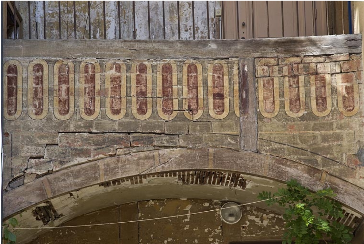
Galleries superposées entre le logis secondaire gauche et le logis principal : détail d'un décor peint.

25, Besançon, 15 rue Pasteur, lieudit : îlot d' Emskerque