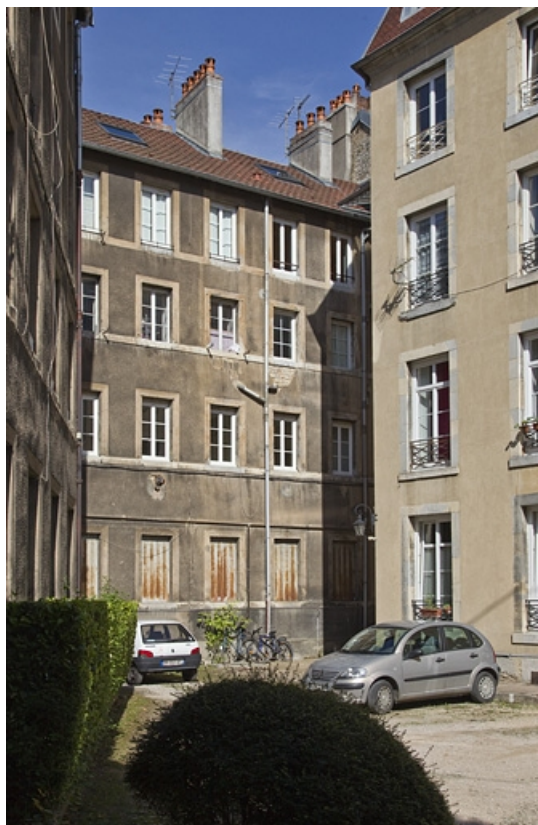
Logis principal, vue de la façade postérieure.

25, Besançon, 15 rue Pasteur, lieudit : îlot d' Emskerque