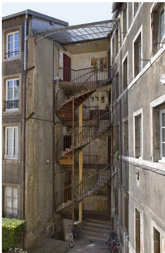
Vue d'ensemble de l'escalier à cage ouverte entre le logis secondaire droit et le logis principal.

25, Besançon, 15 rue Pasteur, lieudit : îlot d' Emskerque