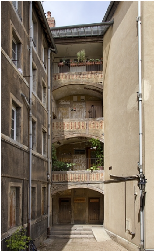
Vue d'ensemble des galeries superposées entre le logis secondaire gauche et le logis principal.

25, Besançon, 15 rue Pasteur, lieudit : îlot d' Emskerque