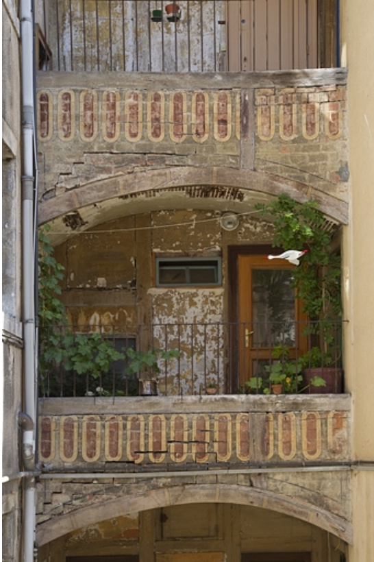
Galleries superposées entre le logis secondaire gauche et le logis principal : détail de la galerie du premier étage.

25, Besançon, 15 rue Pasteur, lieudit : îlot d' Emskerque