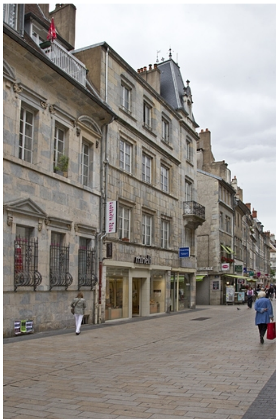
Logis principal : vue d'ensemble de la façade donnant sur la Grande Rue.

25, Besançon, 1, 3 rue d' Anvers, lieudit : îlot d' Emskerque