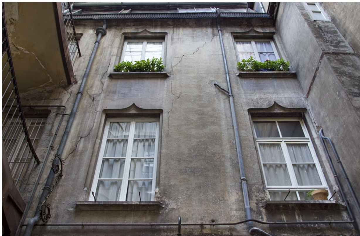
Logis principal, aile en fond de cour : vue d'ensemble.

25, Besançon, 1, 3 rue d' Anvers, lieudit : îlot d' Emskerque