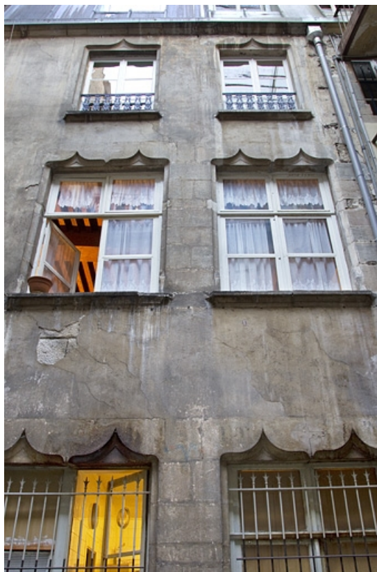
Logis secondaire : vue de la façade sur cour.

25, Besançon, 1, 3 rue d' Anvers, lieudit : îlot d' Emskerque