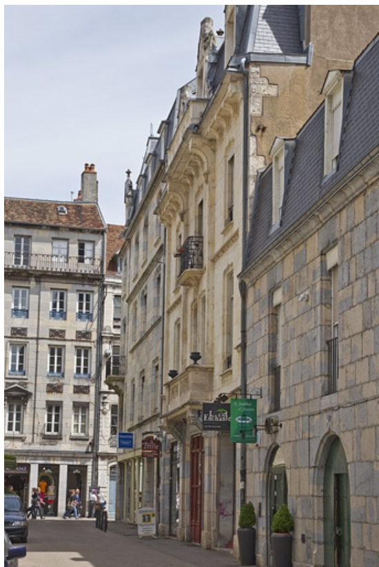
Vue d'ensemble des logis principal et secondaire depuis la rue d'Anvers.

25, Besançon, 1, 3 rue d' Anvers, lieudit : îlot d' Emskerque