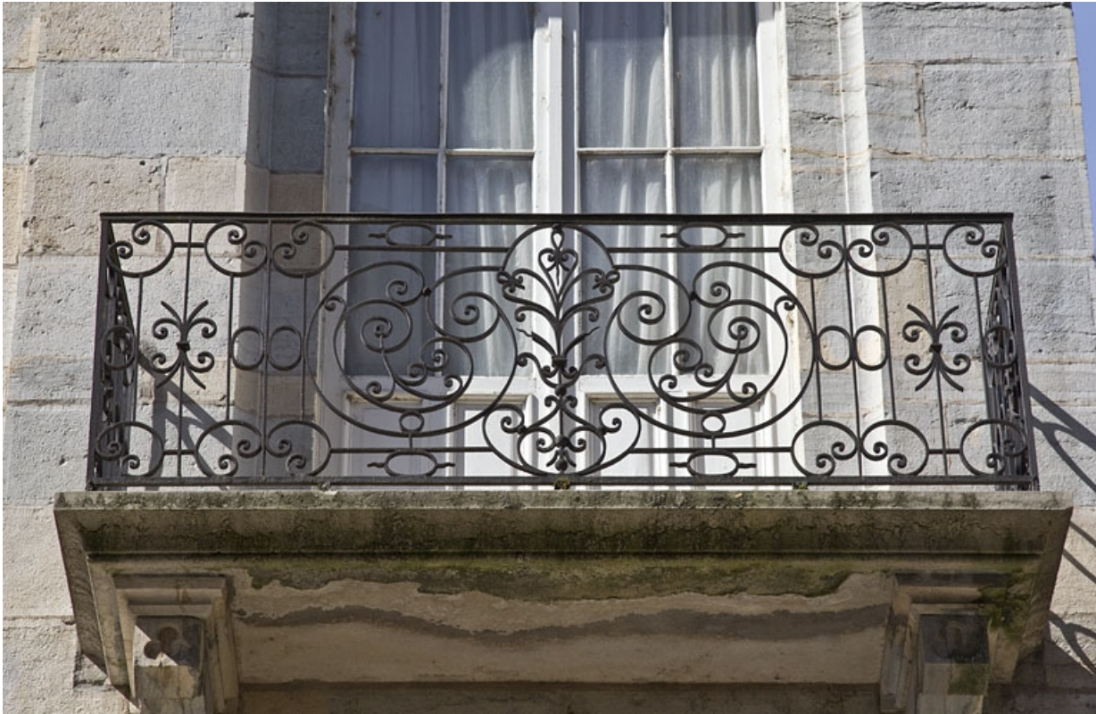
Logis principal : détail d'un balcon en ferronnerie.

25, Besançon, 1, 3 rue d' Anvers, lieudit : îlot d' Emskerque