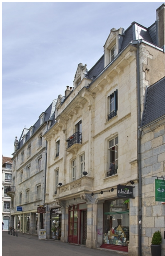
Logis secondaire, façade antérieure, de trois quarts droit.

25, Besançon, 1, 3 rue d' Anvers, lieudit : îlot d' Emskerque