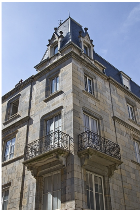
Vue rapprochée de l'angle du logis principal.

25, Besançon, 1, 3 rue d' Anvers, lieudit : îlot d' Emskerque