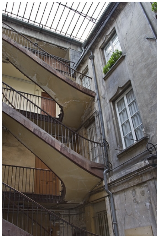
Vue d'ensemble de l'escalier à cage ouverte sur cour.

25, Besançon, 1, 3 rue d' Anvers, lieudit : îlot d' Emskerque