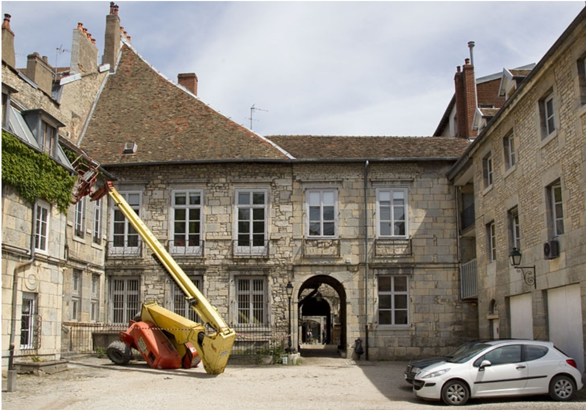
Premier logis secondaire, façade postérieure donnant sur l'ancien jardin.

25, Besançon Grande Rue 44, lieudit : îlot d' Emskerque