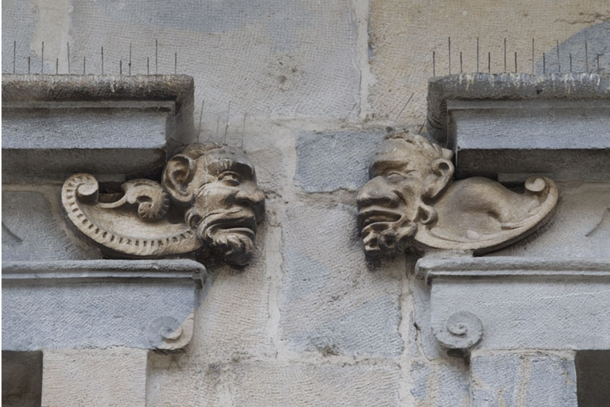
Logis principal, façade sur rue, premier étage, partie droite, troisième et quatrième fenêtre : mascarons droit et gauche. 25, Besançon Grande Rue 44, lieudit : îlot d' Emskerque