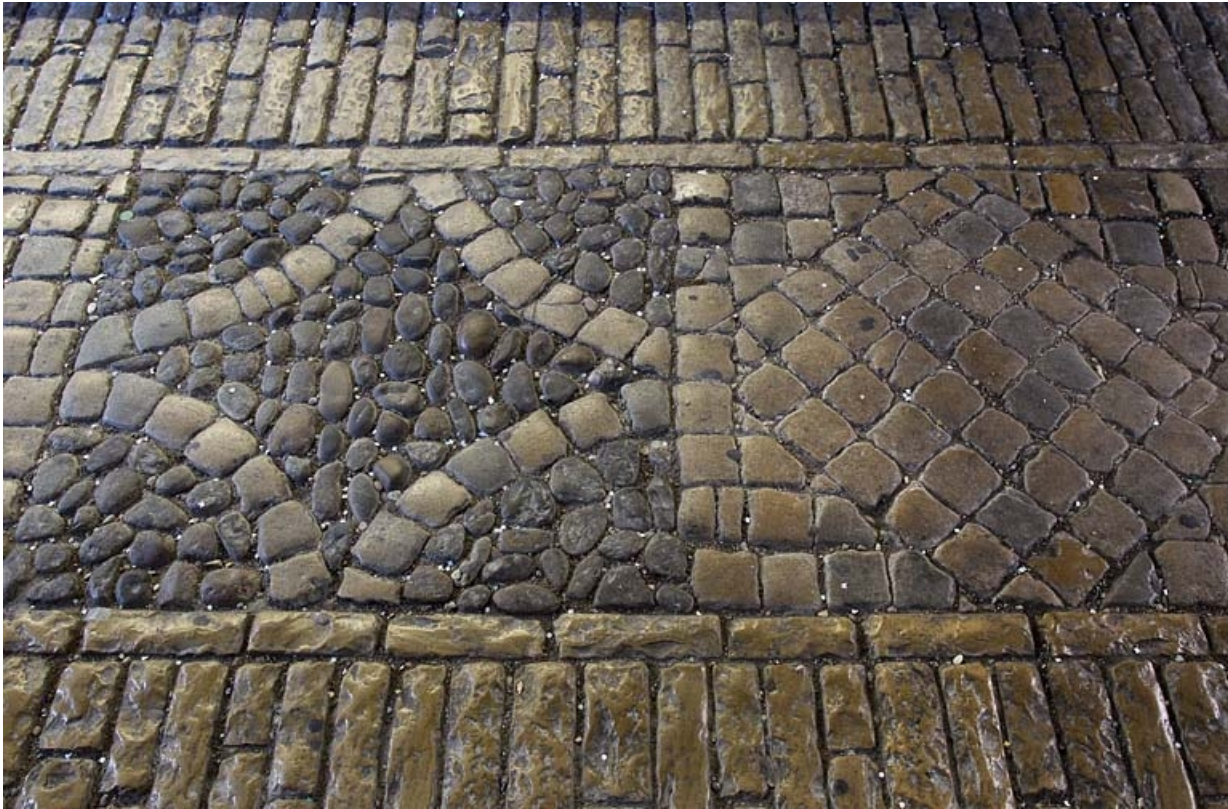
Premier passage cocher : détail du décor du sol.

25, Besançon Grande Rue 44, lieudit : îlot d' Emskerque