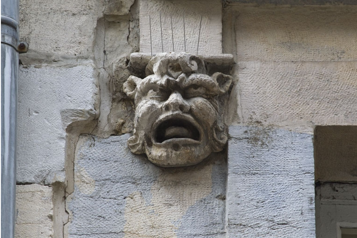
Logis principal, façade sur rue, partie gauche, premier étage, baie gauche : mascaron gauche. 25, Besançon Grande Rue 44, lieudit : îlot d' Emskerque