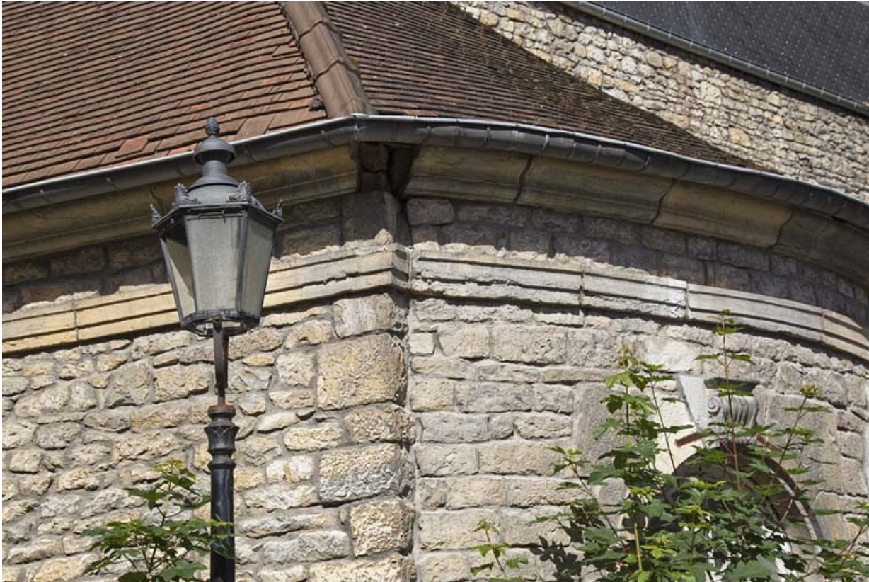
Fabrique de jardin : détail de la corniche du toit.

25, Besançon Grande Rue 44, lieudit : îlot d' Emskerque