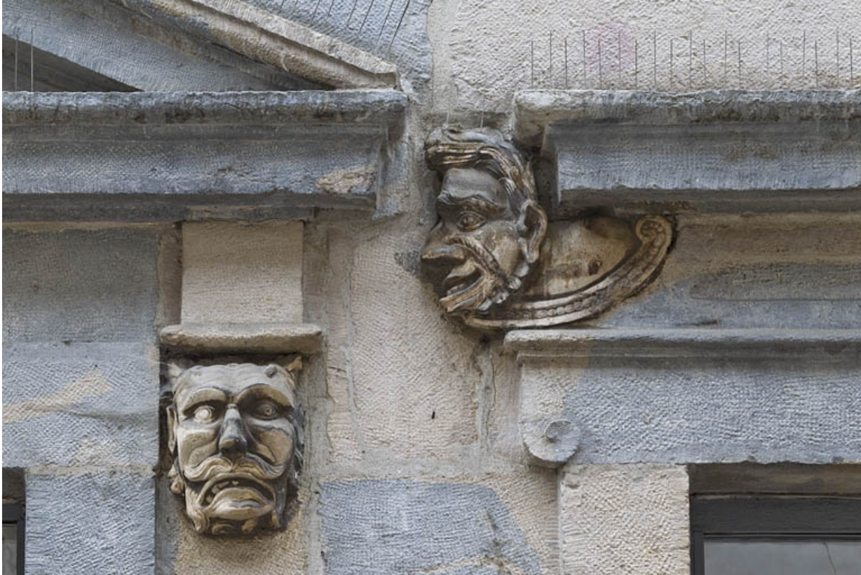
Logis principal, façade sur rue, partie droite, rez-de-chaussée, quatrième baie : mascarón gauche, et mascarón droit de la baie centrale.

25, Besançon Grande Rue 44, lieudit : îlot d' Emskerque