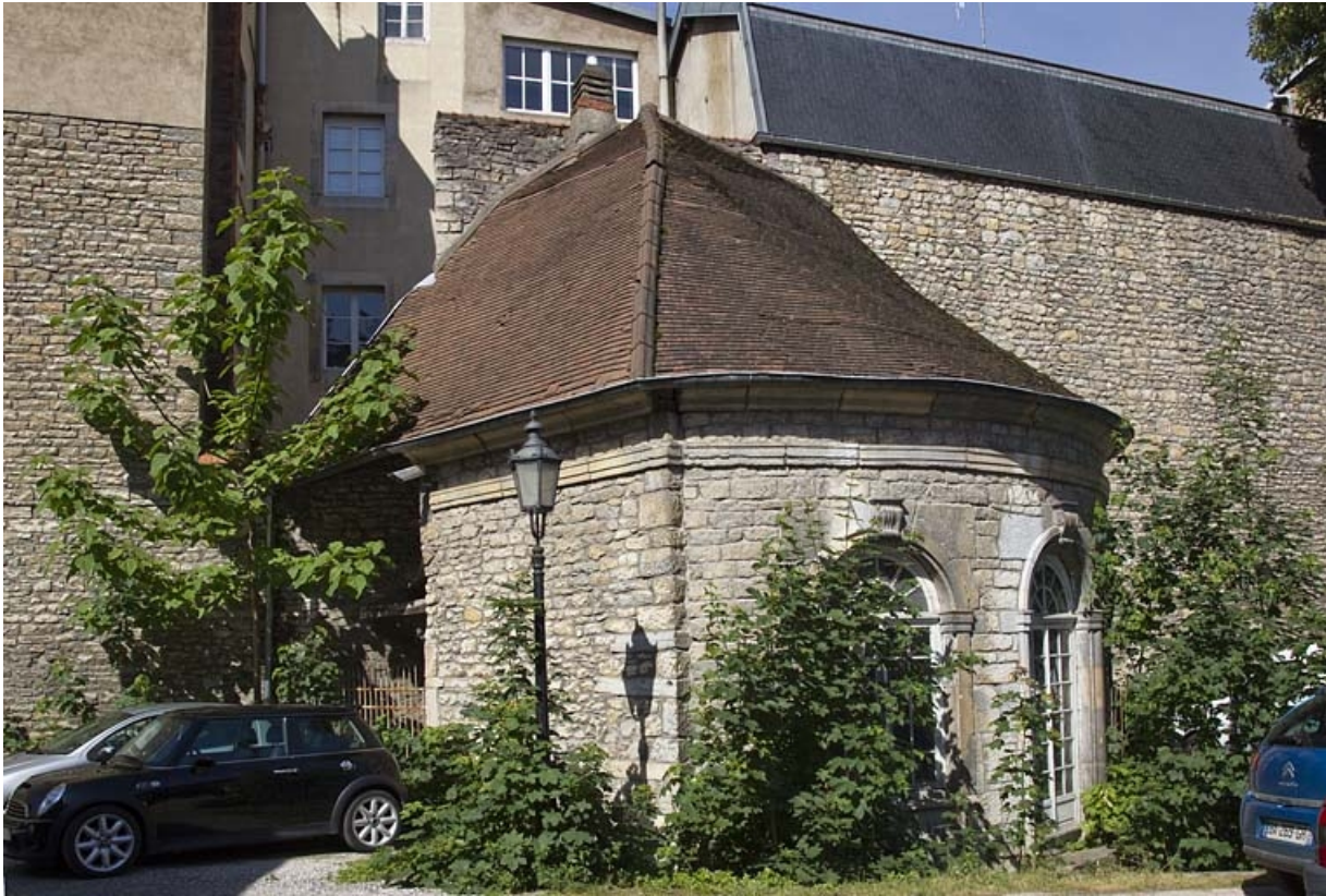
Fabrique de jardin : vue d'ensemble.

25, Besançon Grande Rue 44, lieudit : îlot d' Emskerque