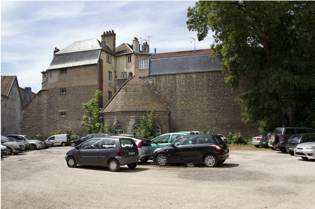
Vue de l'ancien jardin avec la fabrique de jardin.

25, Besançon Grande Rue 44, lieudit : îlot d' Emskerque