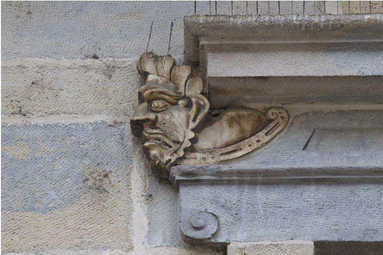
Logis principal, façade sur rue, premier étage, partie droite, fenêtre droite : mascaron gauche. 25, Besançon Grande Rue 44, lieudit : îlot d' Emskerque