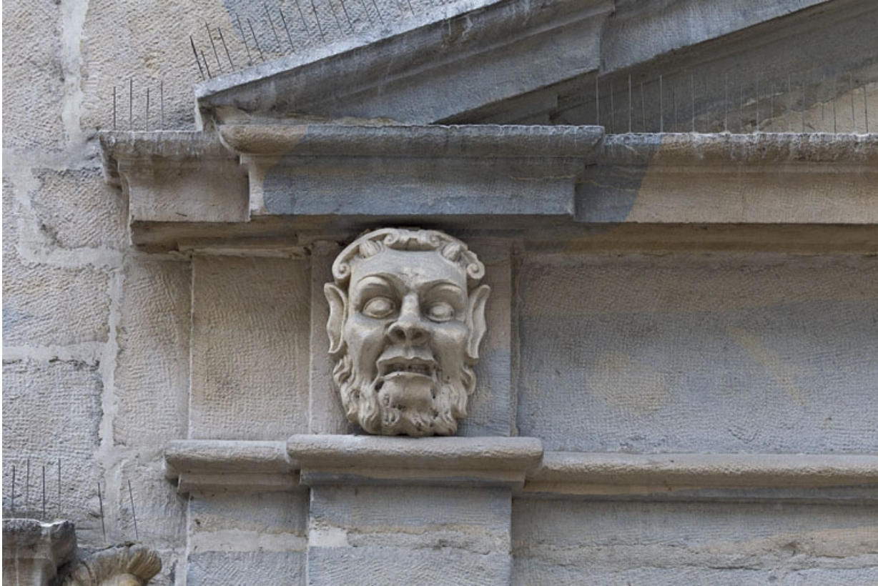
Logis principal, façade sur rue : mascaron gauche ornant le portail.

25, Besançon Grande Rue 44, lieudit : îlot d' Emskerque