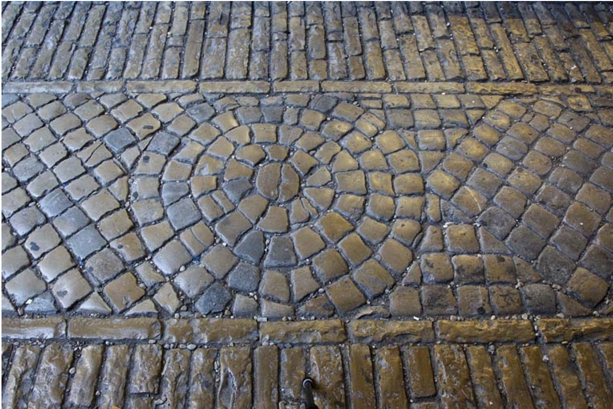
Premier passage cocher : détail du décor du sol.

25, Besançon Grande Rue 44, lieudit : îlot d' Emskerque