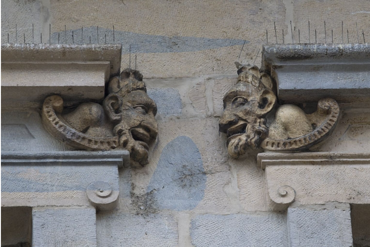
Logis principal, façade sur rue, partie gauche, premier étage, deuxième et troisième baies : mascarons gauche et droit. 25, Besançon Grande Rue 44, lieudit : îlot d' Emskerque