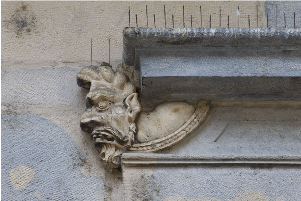
Logis principal, façade sur rue, premier étage, baie au dessus du portail : mascarón gauche.

25, Besançon Grande Rue 44, lieudit : îlot d' Emskerque