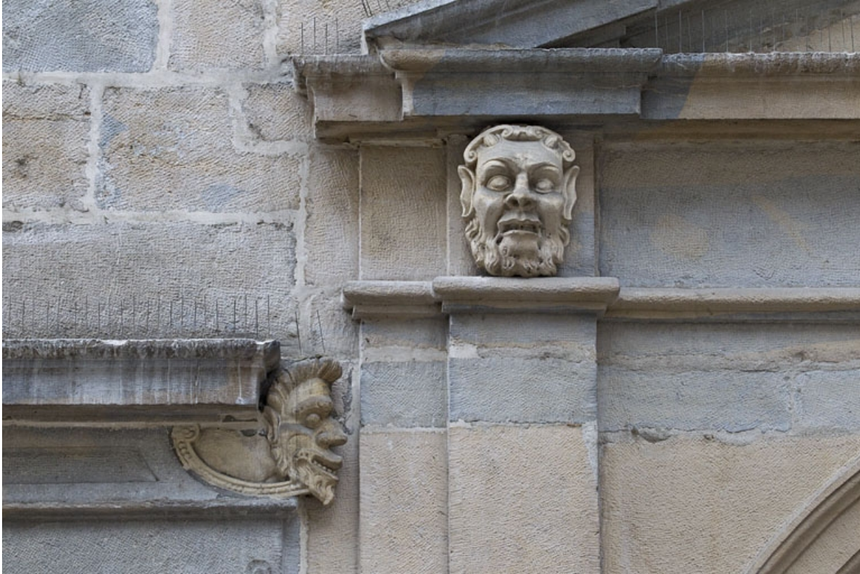
Logis principal, façade sur rue, partie droite, rez-de-chaussée, baie à droite de l'arcade boutiquière : mascaroon droit et mascaroon gauche ornant le portail.

25, Besançon Grande Rue 44, lieudit : îlot d' Emskerque