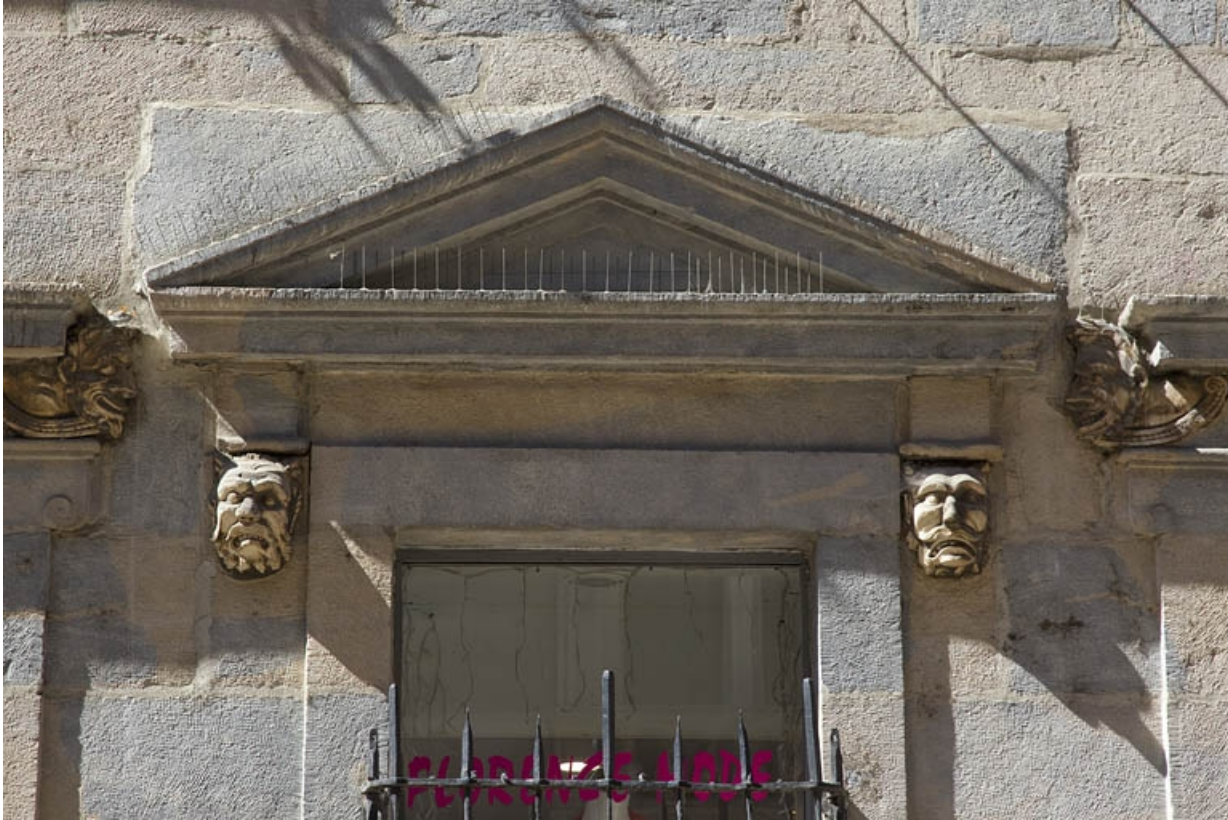
Logis principal, façade sur rue, partie droite : détail du fronton de la fenêtre centrale.

25, Besançon Grande Rue 44, lieudit : îlot d' Emskerque