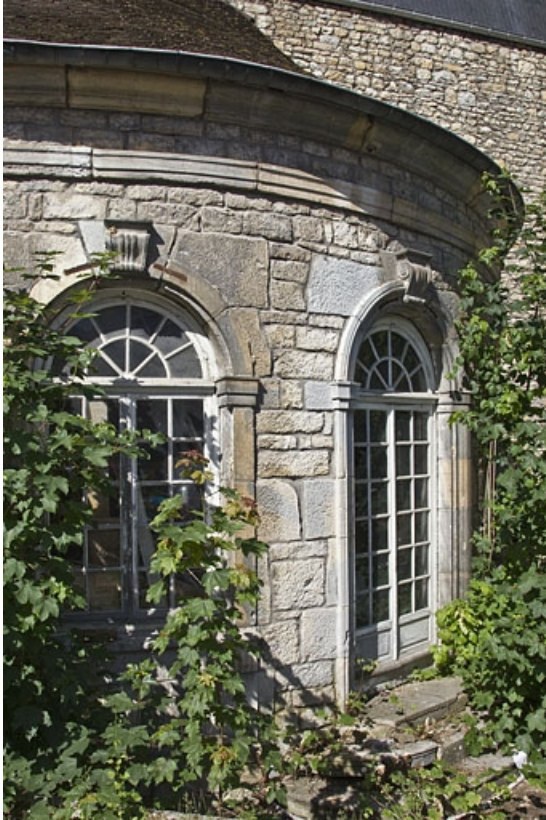
Fabrique de jardin : partie droite.

25, Besançon Grande Rue 44, lieudit : îlot d' Emskerque