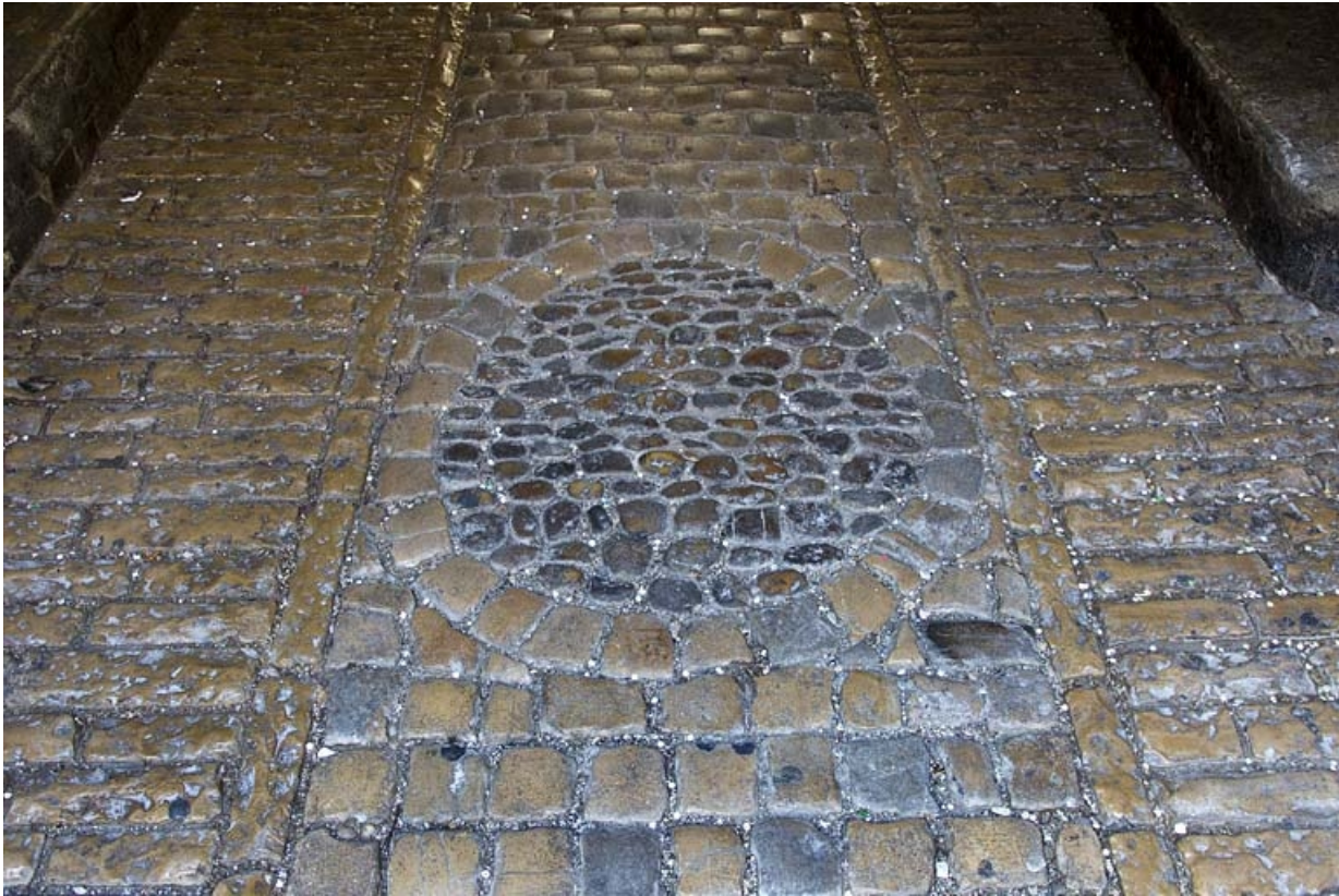
Premier passage cocher : détail du décor du sol.

25, Besançon Grande Rue 44, lieudit : îlot d' Emskerque