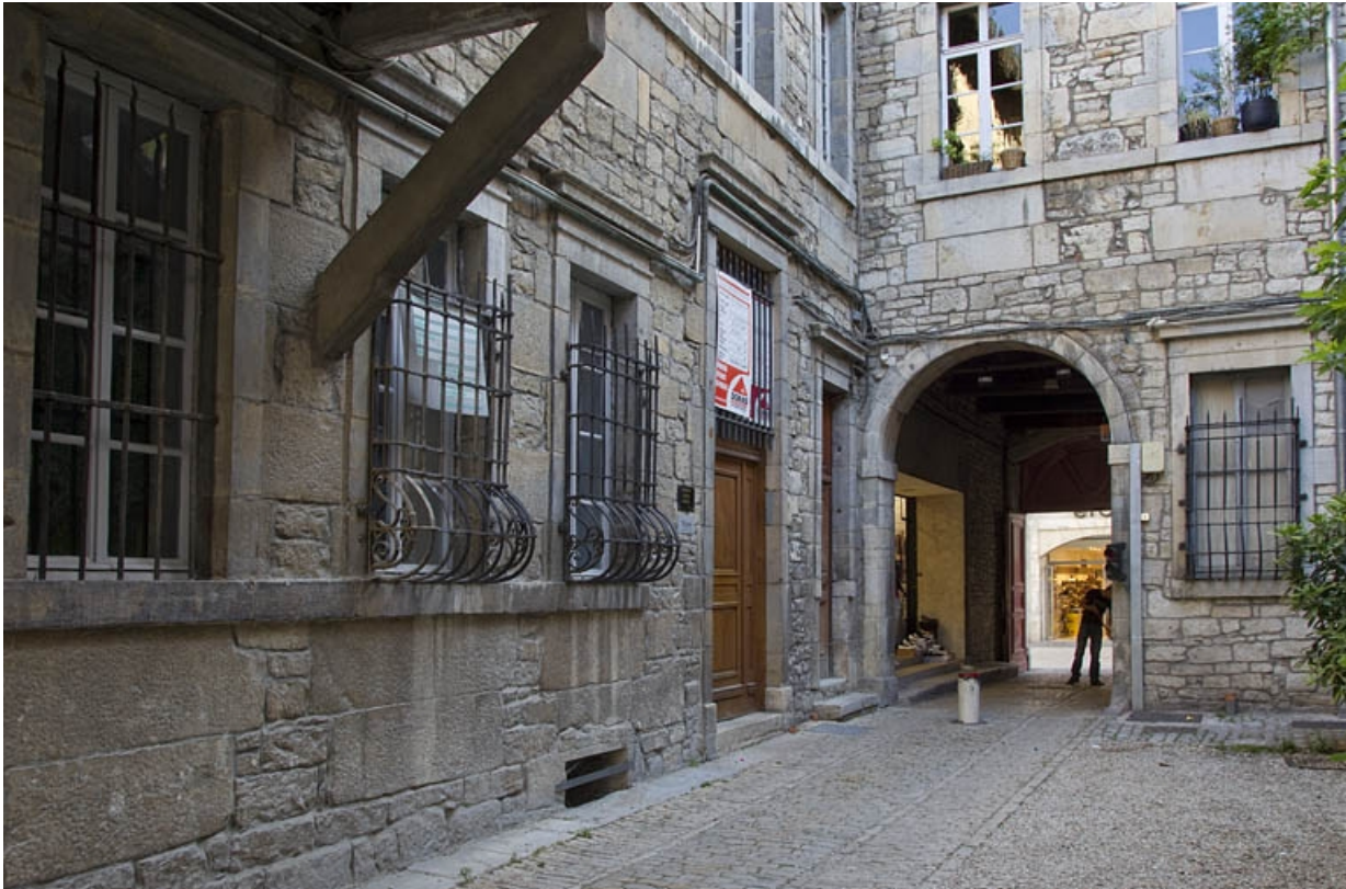
Vue du premier passage cocher depuis la cour, de trois quarts droit.

25, Besançon Grande Rue 44, lieudit : îlot d' Emskerque