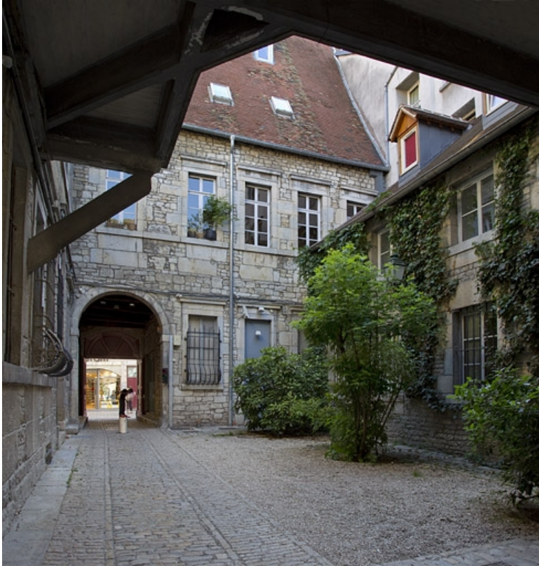
Logis principal : aile sur rue, façade postérieure.

25, Besançon Grande Rue 44, lieudit : îlot d' Emskerque