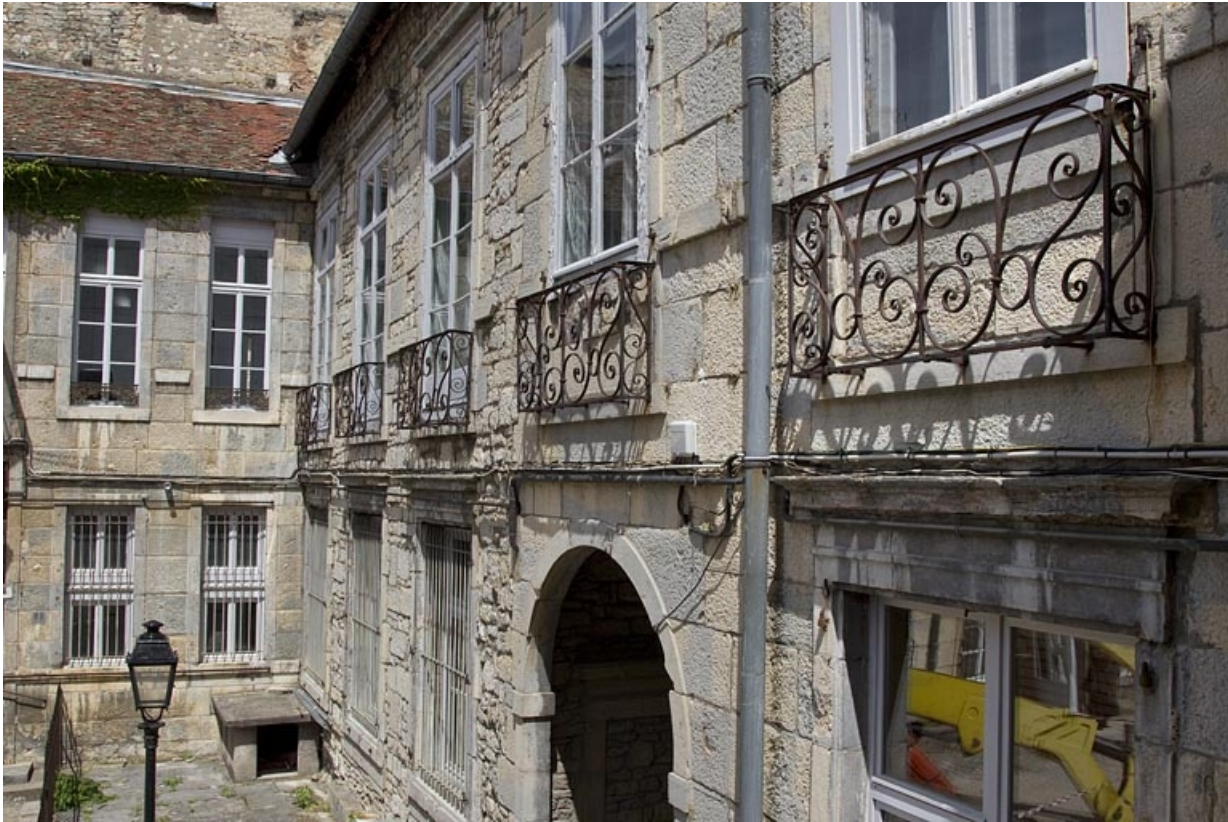
Façade postérieure du logis principal donnant sur l'ancien jardin : de trois quarts droit.

25, Besançon Grande Rue 44, lieudit : îlot d' Emskerque