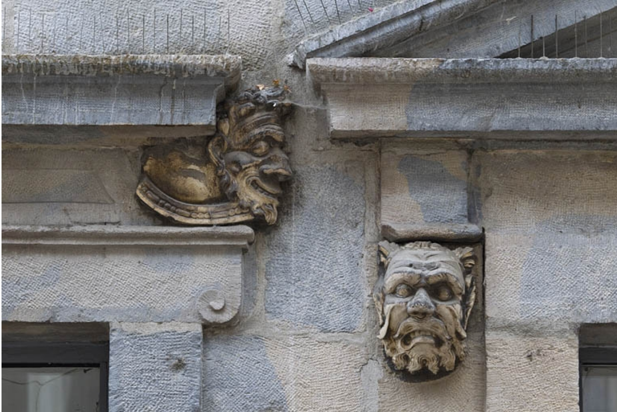
Logis principal, façade sur rue, partie droite, rez-de-chaussée, troisième baie : mascarons droit, et mascarons gauche de la baie centrale.

25, Besançon Grande Rue 44, lieudit : îlot d' Emskerque