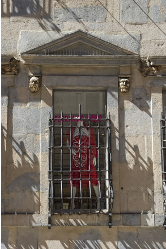
Logis principal, façade sur rue, partie droite : détail de la fenêtre centrale.

25, Besançon Grande Rue 44, lieudit : îlot d' Emskerque