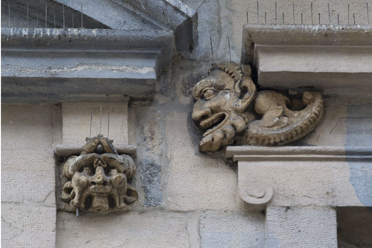
Logis principal, façade sur rue, partie gauche, premier étage, baie gauche : mascarons droit et mascarons gauche de la baie suivante. 25, Besançon Grande Rue 44, lieudit : îlot d' Emskerque