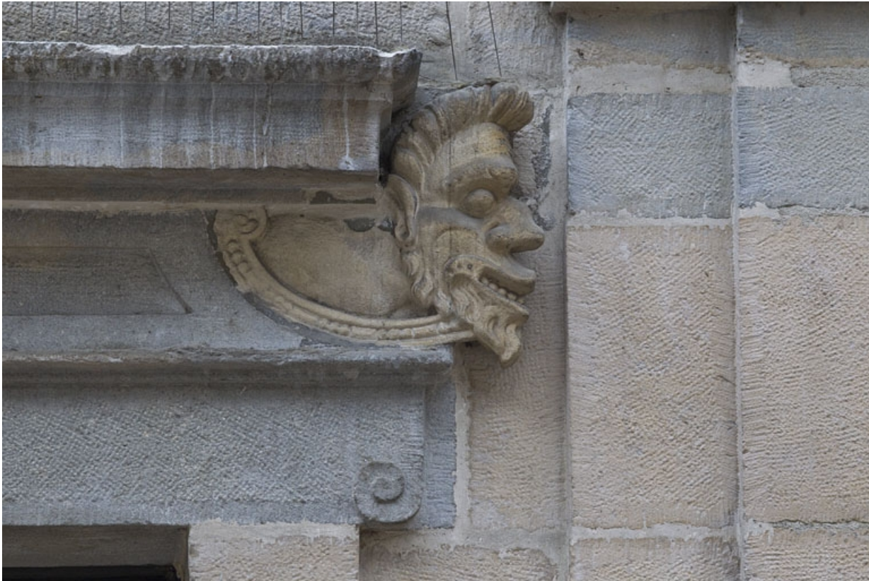
Logis principal, façade sur rue, partie droite, rez-de-chaussée, baie à droite de l'arcade boutiquière : mascaron droit. 25, Besançon Grande Rue 44, lieudit : îlot d' Emskerque