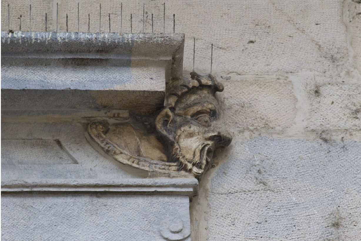
Logis principal, façade sur rue, premier étage, baie au dessus du portail : mascarón droit.

25, Besançon Grande Rue 44, lieudit : îlot d' Emskerque