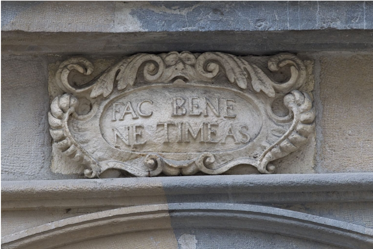
Logis principal, façade sur rue : détail de l'inscription latine ornant le portail.

25, Besançon Grande Rue 44, lieudit : îlot d' Emskerque