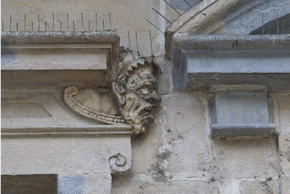
Logis principal, façade sur rue, premier étage, partie droite, fenêtre droite : mascaron droit.

25, Besançon Grande Rue 44, lieudit : îlot d' Emskerque