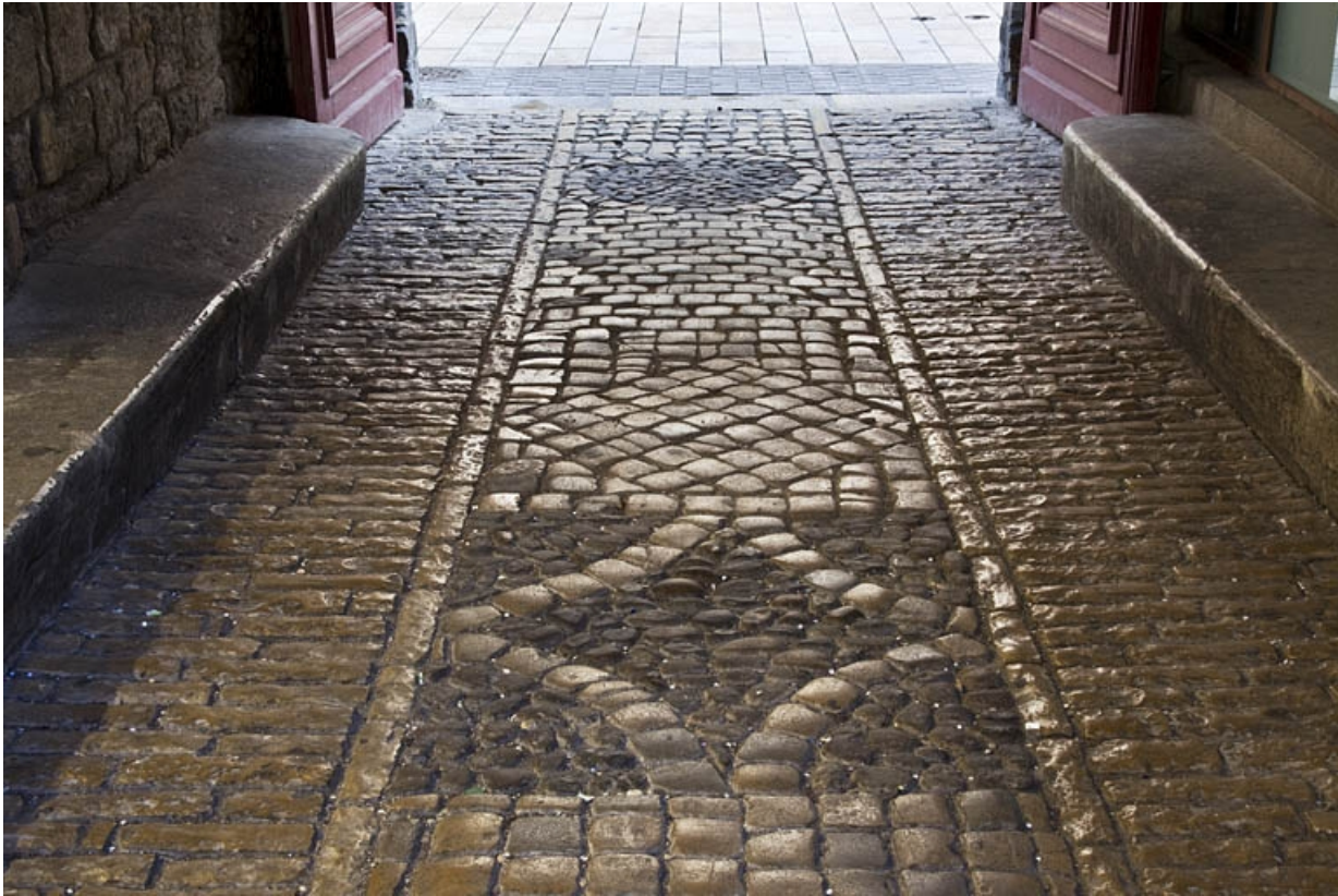
Premier passage cocher : détail du décor du sol, vue d'ensemble.

25, Besançon Grande Rue 44, lieudit : îlot d' Emskerque