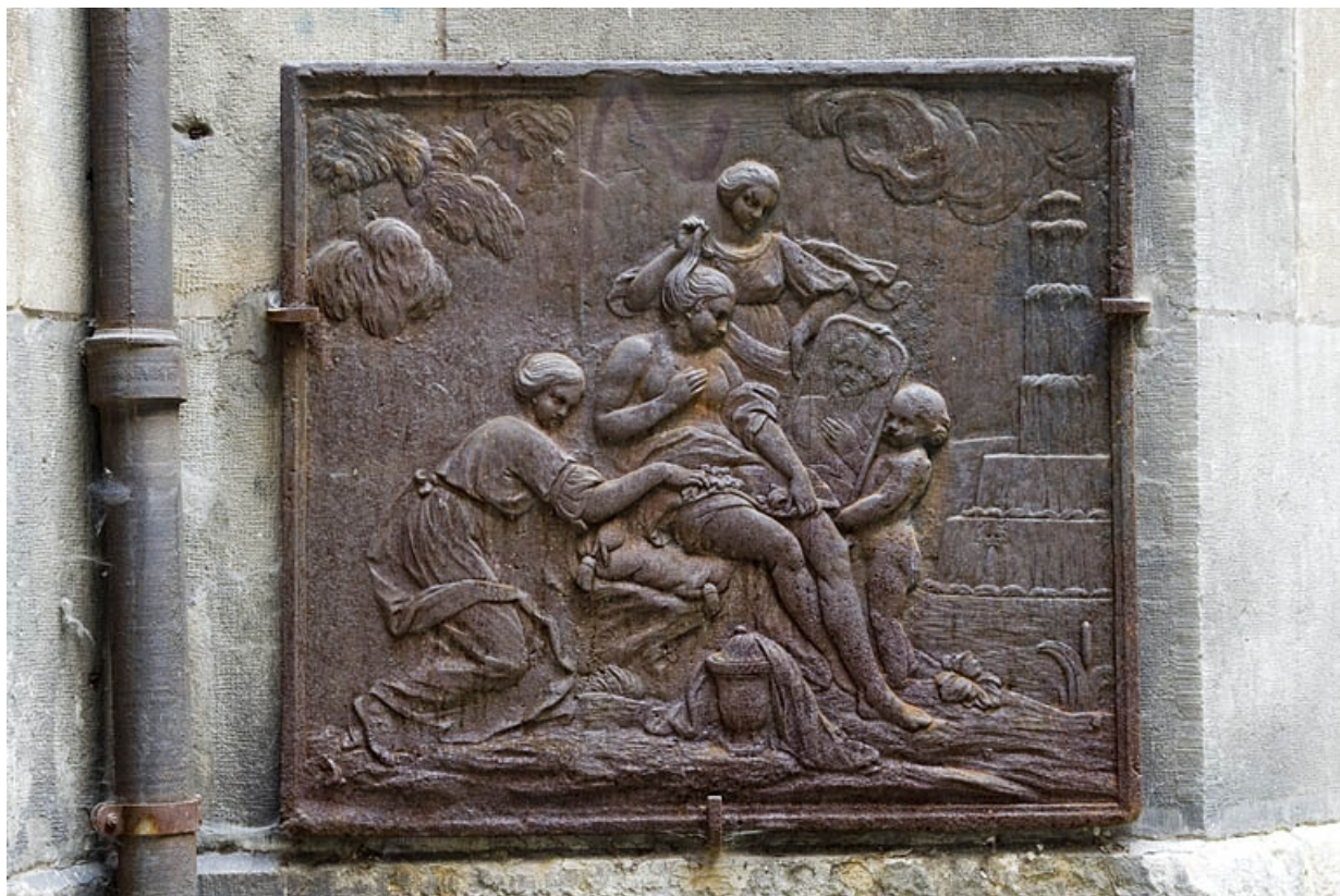
Première cour : plaque de cheminée déposée.

25, Besançon, 14 rue de la Préfecture, lieudit : îlot Mairie