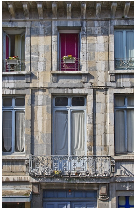
Logis principal, façade sur rue, premier étage : détail de la porte-fenêtre et du balcon.

25, Besançon, 26 rue Mégevand, lieudit : îlot Mairie