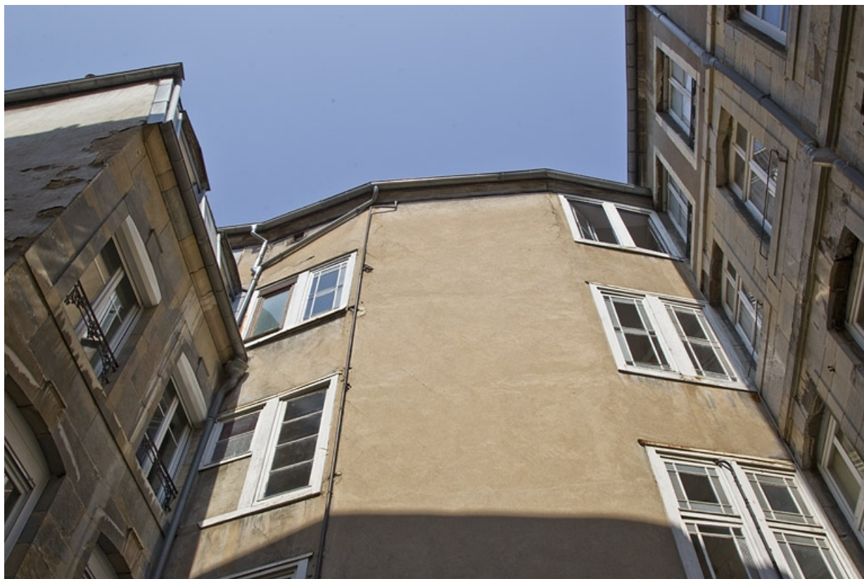
Escalier à droite de la première cour : vue de la cage extérieure.

25, Besançon, 26 rue Mégevand, lieudit : îlot Mairie