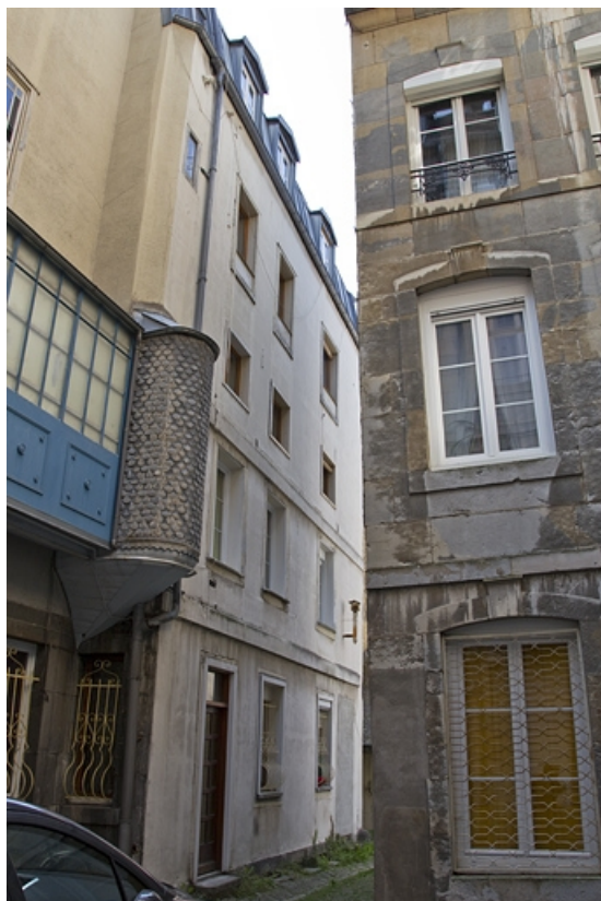
Vue des deux logis secondaires depuis la première cour.

25, Besançon, 26 rue Mégevand, lieudit : îlot Mairie