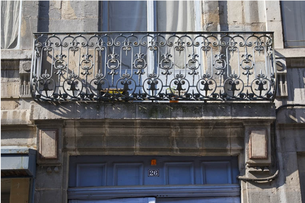
Logis principal, façade sur rue, premier étage : détail du balcon en ferronnerie. 25, Besançon, 26 rue Mégevand, lieudit : îlot Mairie