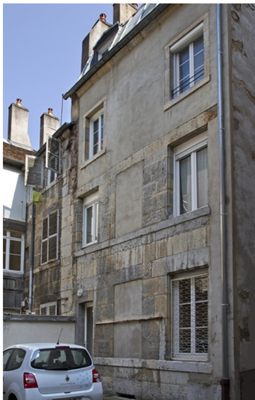
deuxième logis secondaire, façade postérieure : de trois quarts droit.

25, Besançon, 26 rue Mégevand, lieudit : îlot Mairie