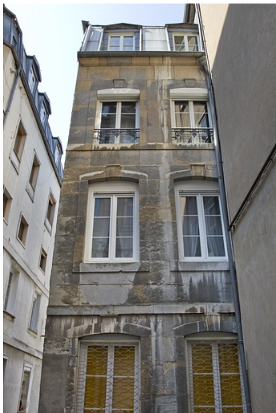
Vue du deuxième logis secondaire depuis la première cour.

25, Besançon, 26 rue Mégevand, lieudit : îlot Mairie