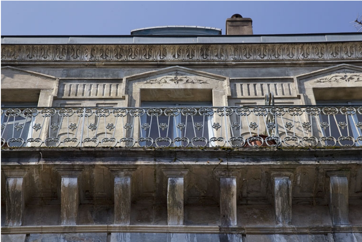
Logis principal, façade sur rue, troisième étage : détail du balcon filant en ferronnerie.

25, Besançon, 26 rue Mégevand, lieudit : îlot Mairie