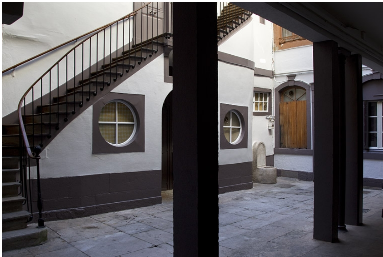
Vue de la cour depuis la sortie du couloir.

25, Besançon, 24 rue Mégevand, lieudit : îlot Mairie