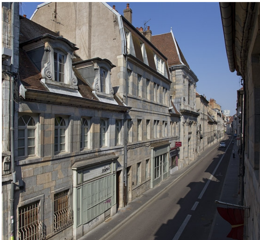
Logis principal, façade sur rue : de trois quarts gauche.

25, Besançon, 24 rue Mégevand, lieudit : îlot Mairie