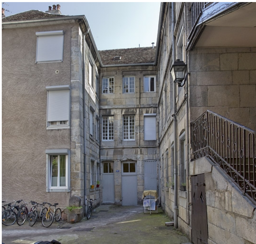
Vue d'ensemble du logis secondaire, depuis l'entrée de la cour.

25, Besançon, 11 rue Rivotte, lieudit : îlot des Jacobins