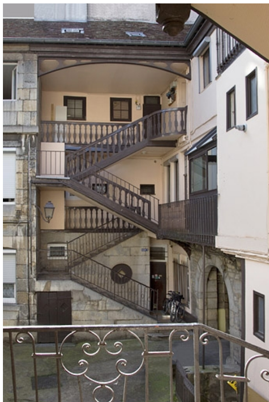
Vue d'ensemble de l'escalier à cage ouverte droit depuis l'escalier gauche.

25, Besançon, 11 rue Rivotte, lieudit : îlot des Jacobins