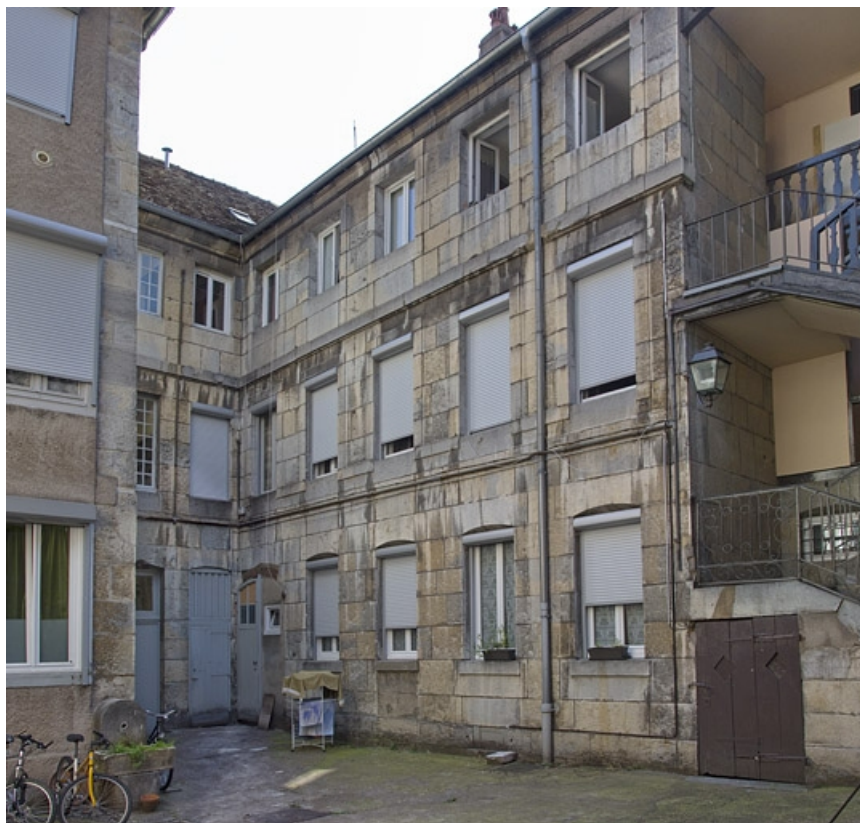
Vue d'ensemble de l'aile droite logis secondaire, de trois quarts droit.

25, Besançon, 11 rue Rivotte, lieudit : îlot des Jacobins