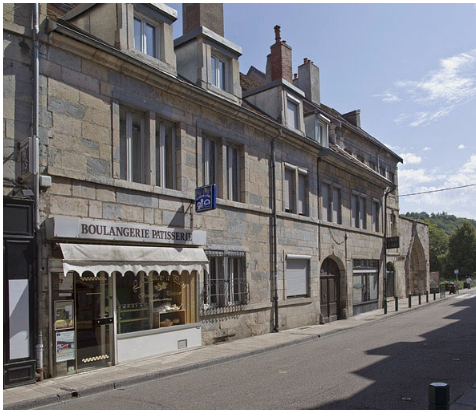
Vue d'ensemble depuis la rue, de trois quarts gauche.

25, Besançon, 11 rue Rivotte, lieudit : îlot des Jacobins