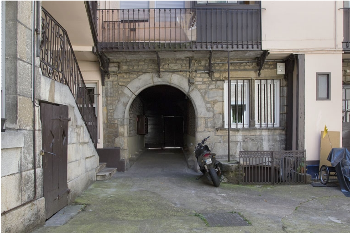
Logis principal, façade postérieure : détail du passage cocher. 25, Besançon, 11 rue Rivotte, lieudit : îlot des Jacobins