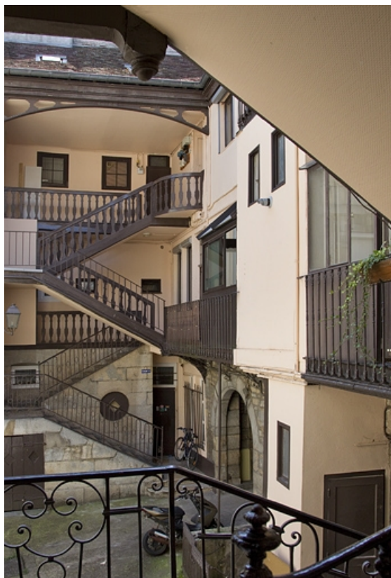
Escalier à cage ouverte droit : vue d'ensemble éloignée, de face.

25, Besançon, 11 rue Rivotte, lieudit : îlot des Jacobins