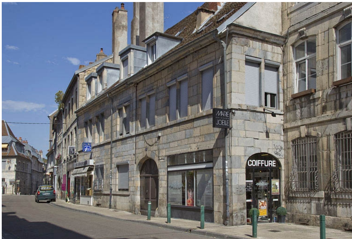
Vue d'ensemble depuis la rue, de trois quarts droit. 25, Besançon, 11 rue Rivotte, lieudit : îlot des Jacobins