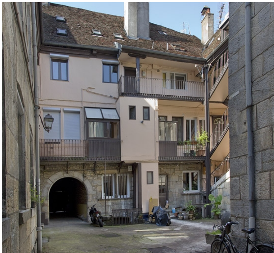
Logis principal : vue d'ensemble de la façade postérieure, depuis le fond de la cour. 25, Besançon, 11 rue Rivotte, lieudit : îlot des Jacobins