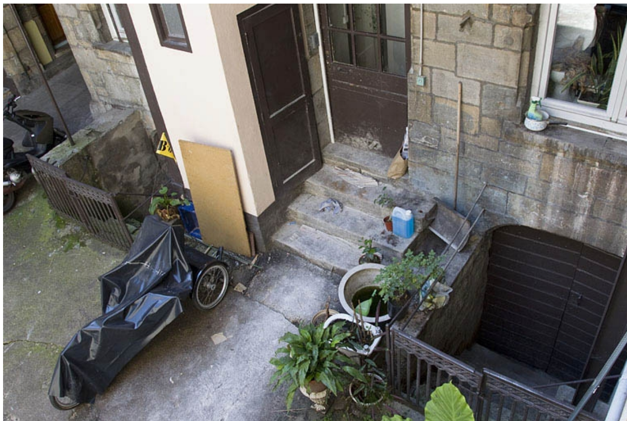
Logis principal, façade postérieure : détail des entrées de caves.

25, Besançon, 11 rue Rivotte, lieudit : îlot des Jacobins