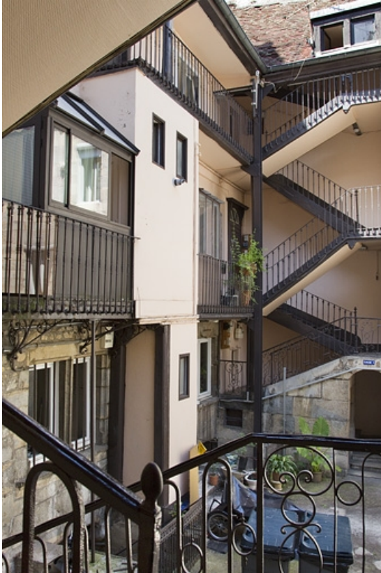
Vue d'ensemble de l'escalier à cage ouverte gauche, depuis l'escalier droit. 25, Besançon, 11 rue Rivotte, lieudit : îlot des Jacobins