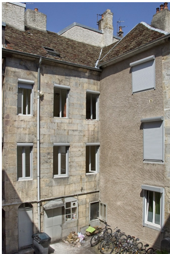
Logis secondaire : détail de l'aile gauche, de trois quarts gauche.

25, Besançon, 11 rue Rivotte, lieudit : îlot des Jacobins