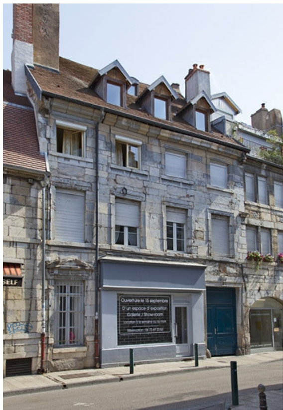
Vue d'ensemble depuis la rue, de trois quarts gauche.

25, Besançon, 5 rue Rivotte, lieudit : îlot des Jacobins