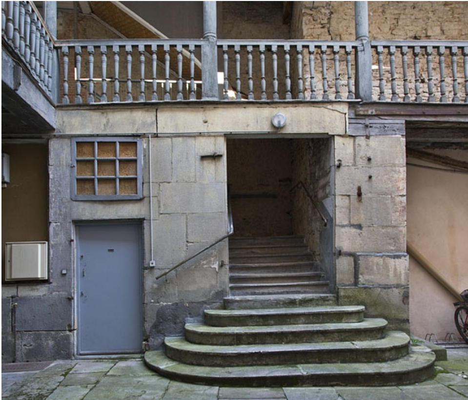
Escalier extérieur : détail du départ de l'escalier.

25, Besançon, 5 rue Rivotte, lieudit : îlot des Jacobins