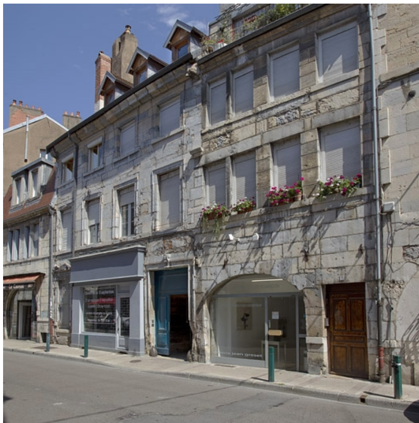
Vue d'ensemble depuis la rue, de trois quarts droit.

25, Besançon, 5 rue Rivotte, lieudit : îlot des Jacobins