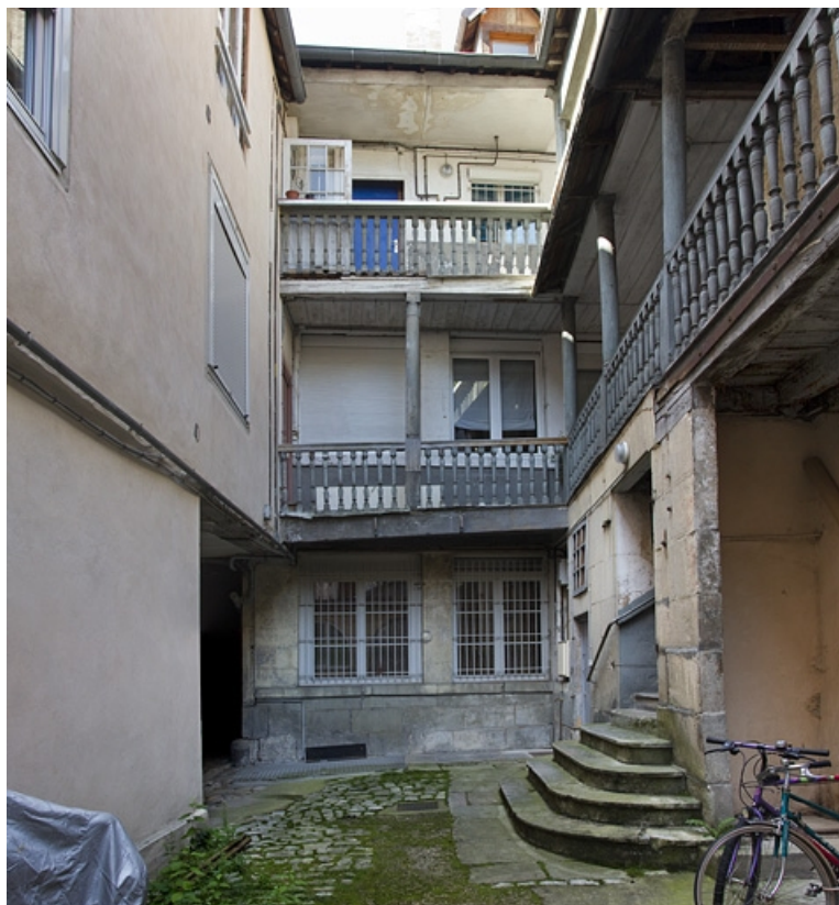
Logis principal : façade postérieure depuis le fond de la cour.

25, Besançon, 5 rue Rivotte, lieudit : îlot des Jacobins