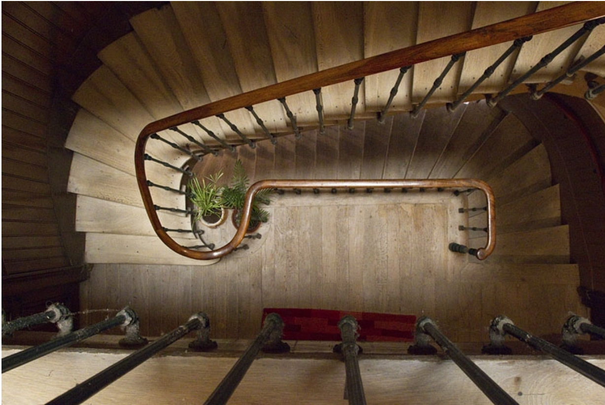
Logis principal : détail de l'escalier, vue plongeante.

25, Besançon, 19 rue de Pontarlier, lieudit : îlot des Jacobins