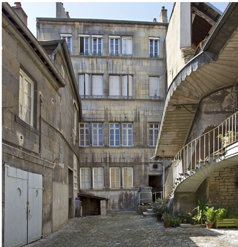
Vue de la façade postérieure du logis principal : de face. 25, Besançon, 19 rue de Pontarlier, lieudit : îlot des Jacobins