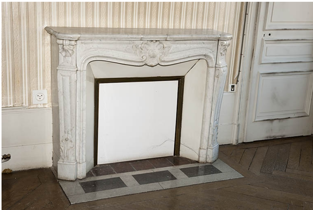
Logis au fond de la deuxième cour : détail d'une cheminée d'une pièce de l'étage.

25, Besançon, 9 rue de Pontarlier, lieudit : îlot Sarrail