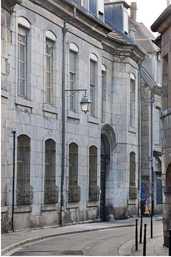
Façade antérieure de l'hôtel depuis la rue : de trois quarts gauche, vue rapprochée.

25, Besançon, 9 rue de Pontarlier, lieudit : îlot Sarrail