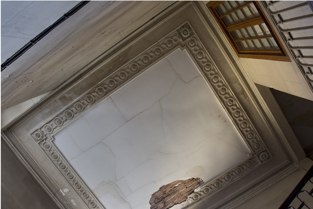
Logis principal, intérieur : détail du plafond de la cage de l'escalier principal.

25, Besançon, 28 rue de la Préfecture, lieudit : îlot Mairie