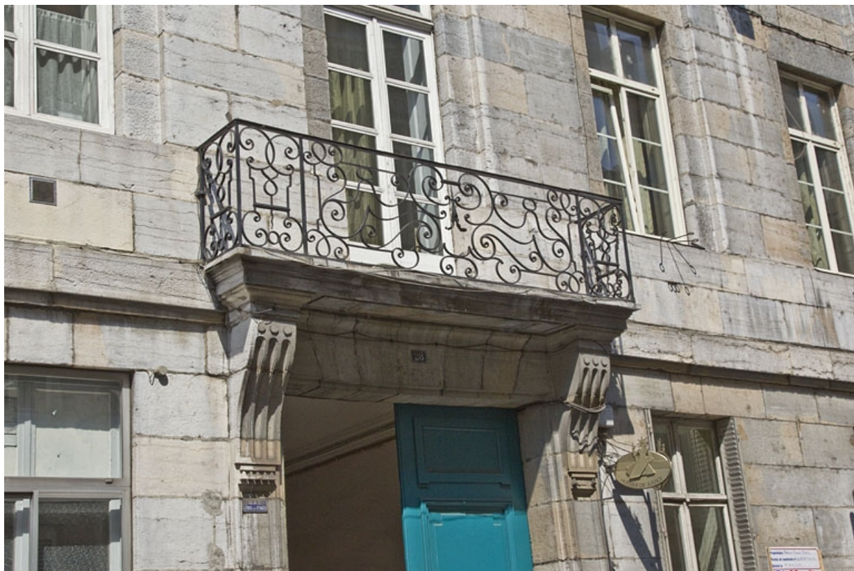
Logis principal, façade sur rue : détail du balcon.

25, Besançon, 28 rue de la Préfecture, lieudit : îlot Mairie