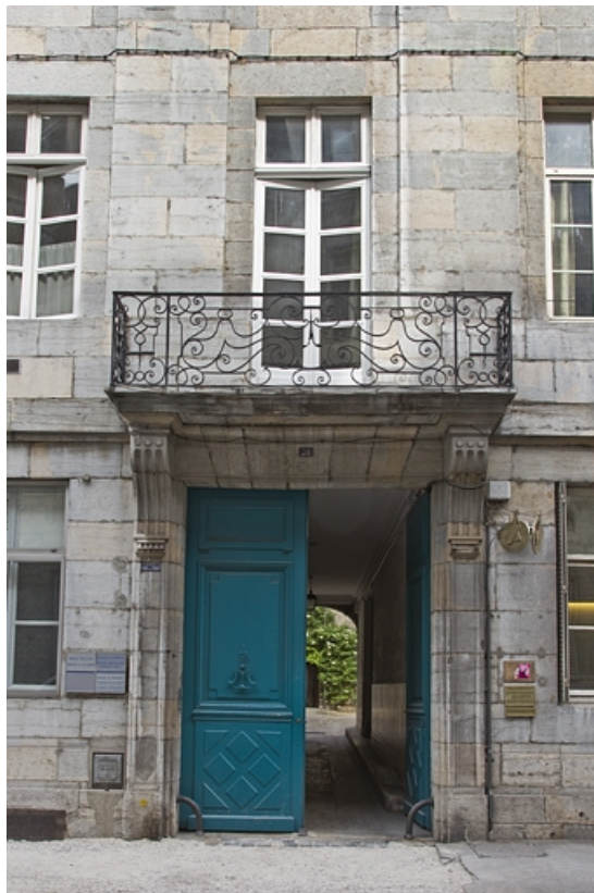
Logis principal : détail du portail d'entrée.

25, Besançon, 28 rue de la Préfecture, lieudit : îlot Mairie