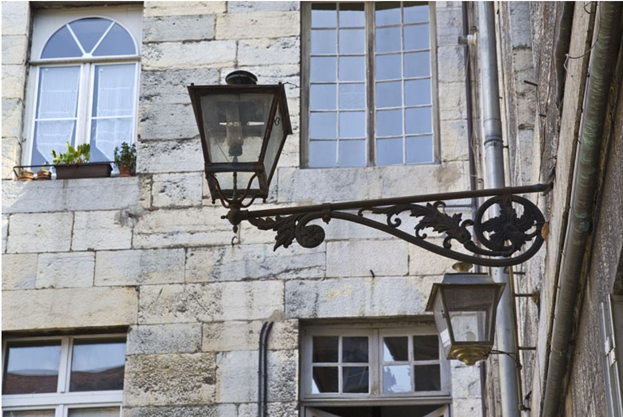
Cour : détail d'un bec de gaz.

25, Besançon, 28 rue de la Préfecture, lieudit : îlot Mairie