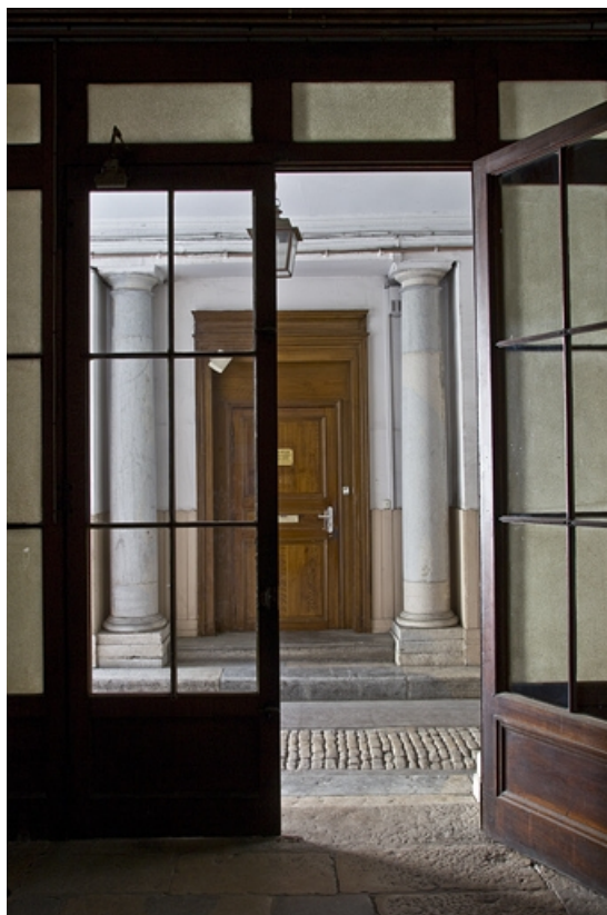
Détail d'une porte donnant sur le passage cocher depuis la porte de l'escalier. 25, Besançon, 28 rue de la Préfecture, lieudit : îlot Mairie