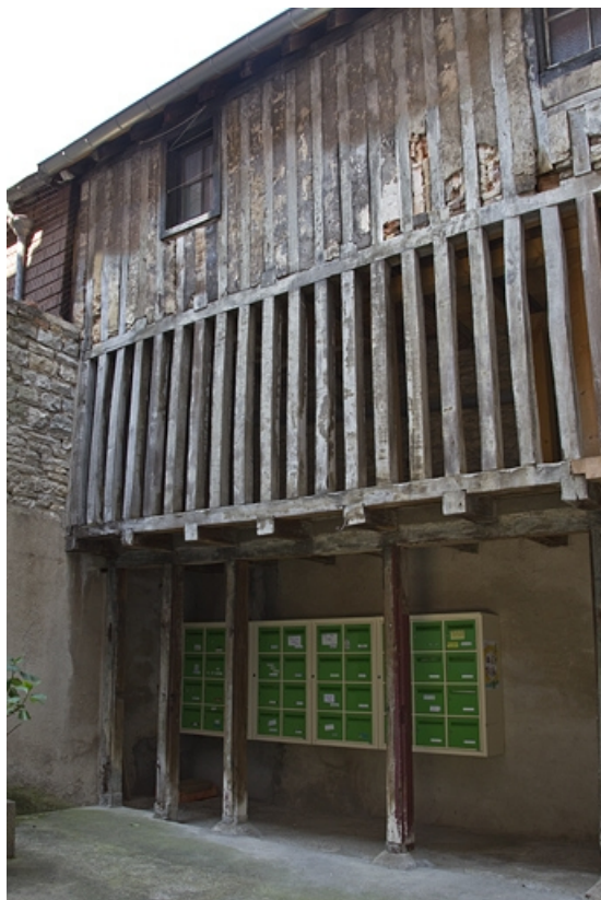
Vue d'ensemble du bûcher.

25, Besançon, 28 rue de la Préfecture, lieudit : îlot Mairie