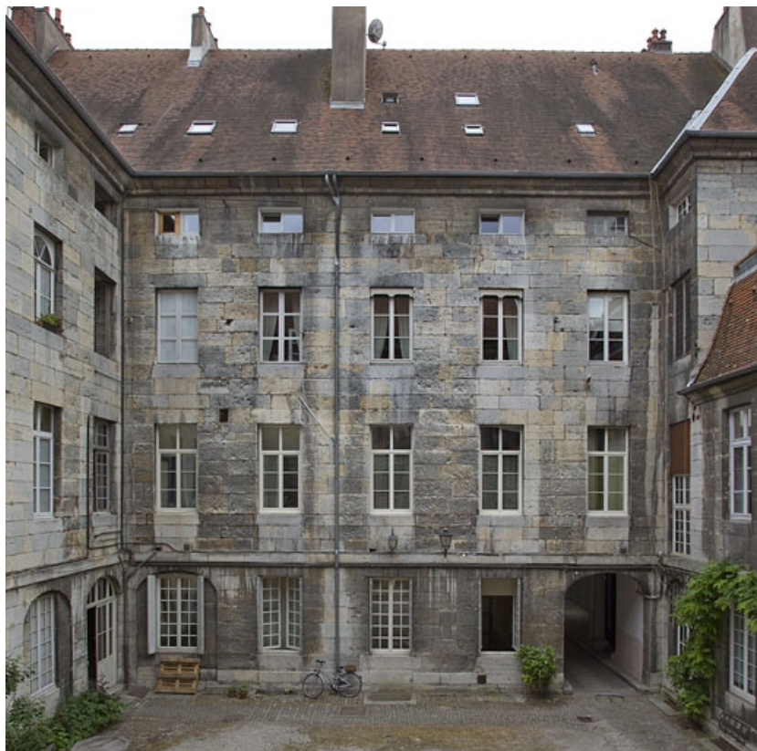
Logis principal : façade postérieure de l'aile sur rue, de face.

25, Besançon, 28 rue de la Préfecture, lieudit : îlot Mairie