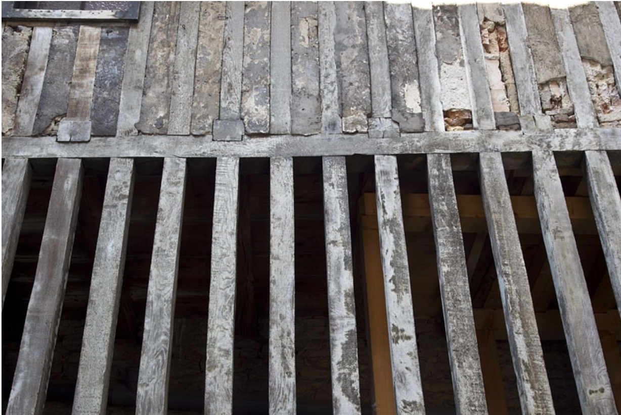
Bûcher : détail des pans de bois.

25, Besançon, 28 rue de la Préfecture, lieudit : îlot Mairie