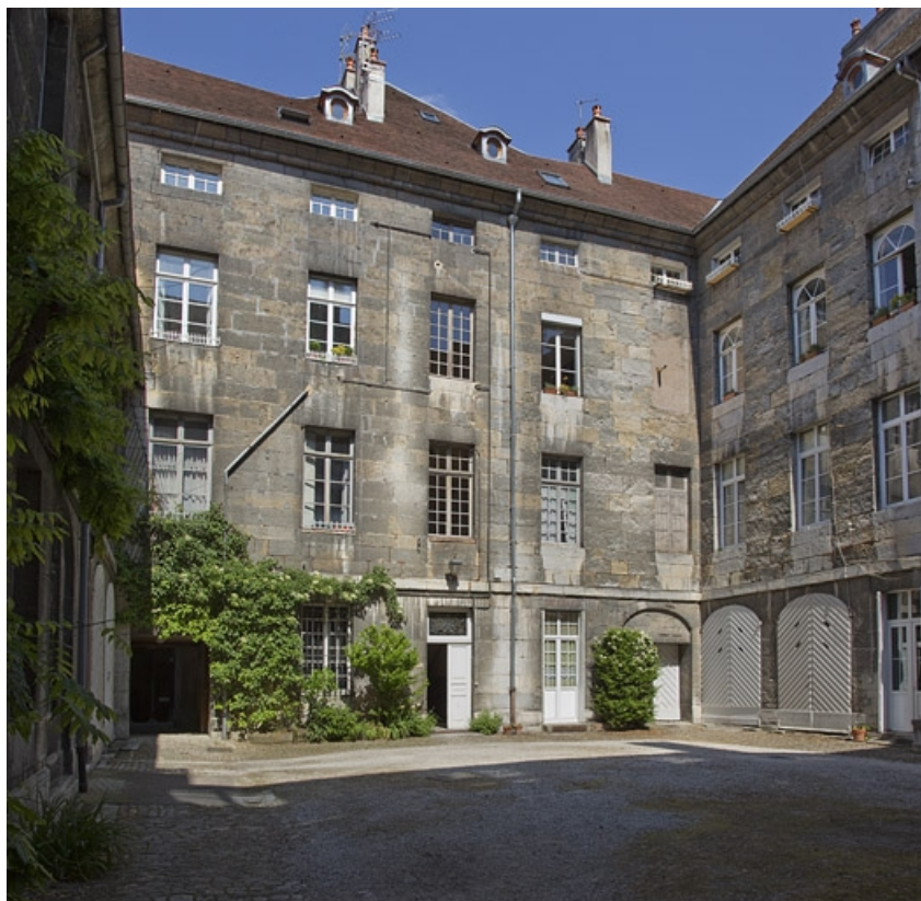
Vue de la cour depuis l'entrée.

25, Besançon, 28 rue de la Préfecture, lieudit : îlot Mairie