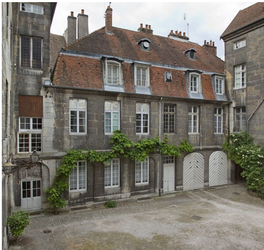
Vue de l'aile des communs à gauche de la cour.

25, Besançon, 28 rue de la Préfecture, lieudit : îlot Mairie