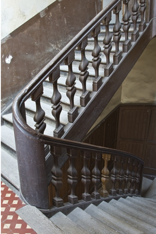
Logis principal, aile droite : détail de l'escalier secondaire.

25, Besançon, 28 rue de la Préfecture, lieudit : îlot Mairie