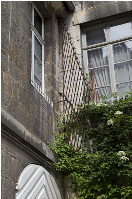
Cour : détail d'une grille de protection.

25, Besançon, 28 rue de la Préfecture, lieudit : îlot Mairie