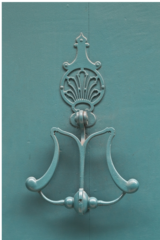
Portail d'entrée : détail du heurtor.

25, Besançon, 28 rue de la Préfecture, lieudit : îlot Mairie