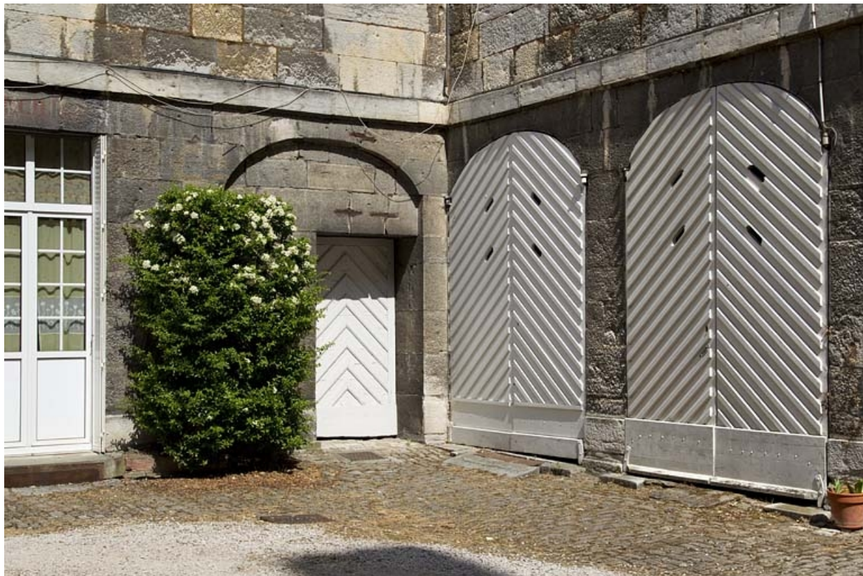
Logis principal, aile droite : vue des remises.

25, Besançon, 28 rue de la Préfecture, lieudit : îlot Mairie