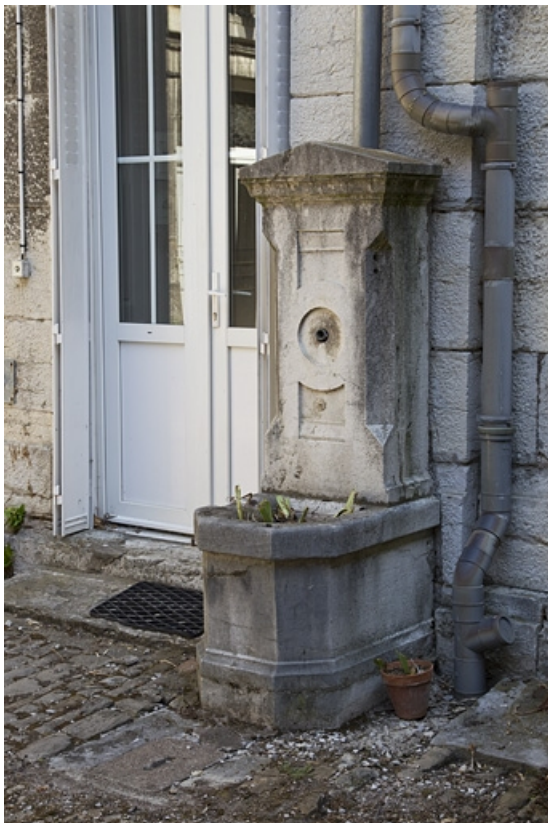
Détail de la fontaine située dans la cour.

25, Besançon, 28 rue de la Préfecture, lieudit : îlot Mairie