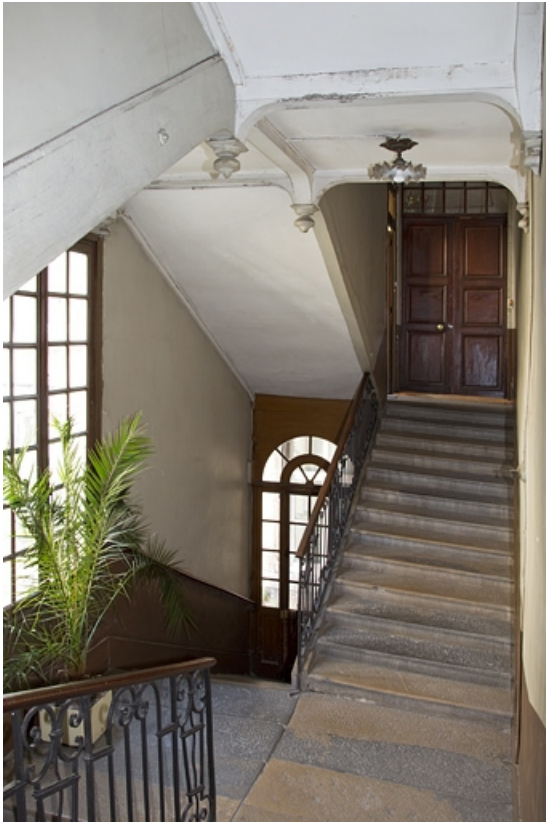
Vue d'ensemble de l'intérieur de l'escalier.

25, Besançon, 14 rue Mégevand, lieudit : îlot Mairie