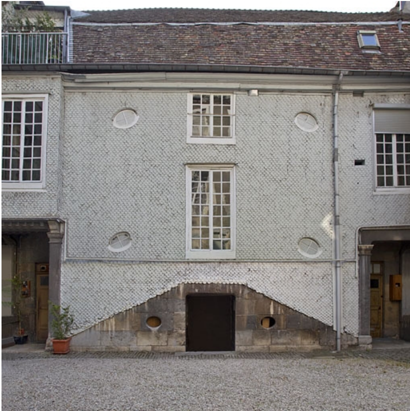
Escalier à cage fermée sur cour, de face.

25, Besançon, 14 rue Mégevand, lieudit : îlot Mairie