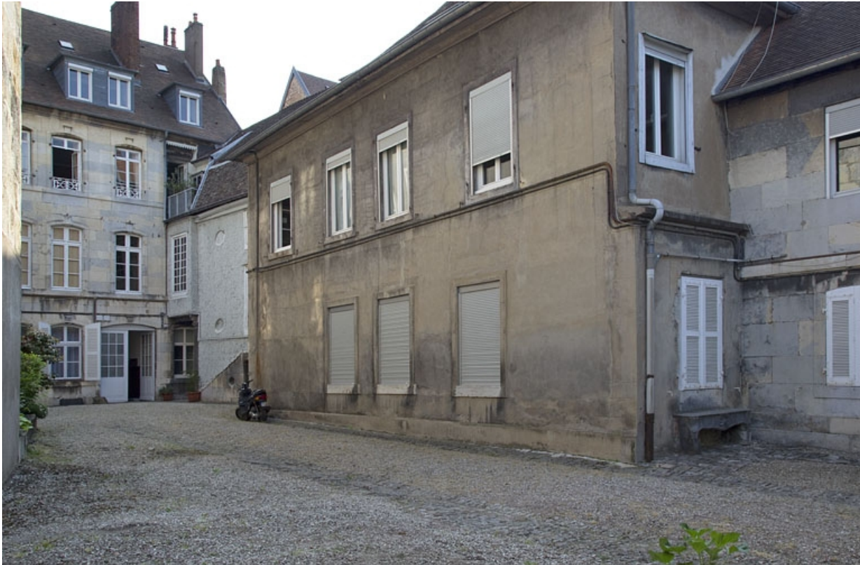
Vue du premier logis secondaire, de trois quarts droit.

25, Besançon, 14 rue Mégevand, lieudit : îlot Mairie