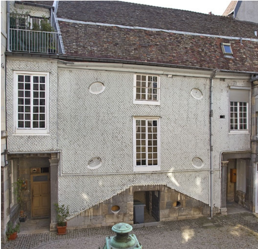
Escalier à cage fermée sur cour, de trois quarts gauche.

25, Besançon, 14 rue Mégevand, lieudit : îlot Mairie