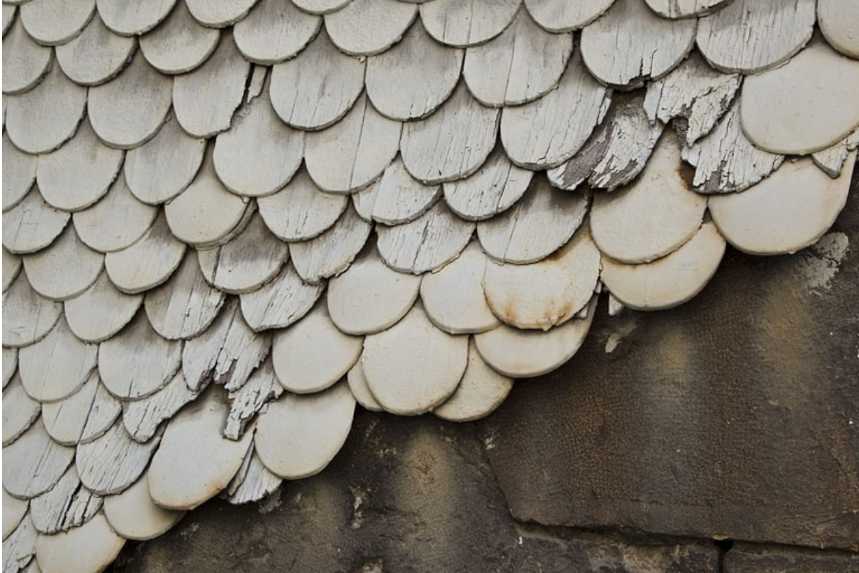
Détail des tavaillons recouvrant l'extérieur de la cage d'escalier : vue rapprochée.

25, Besançon, 14 rue Mégevand, lieudit : îlot Mairie