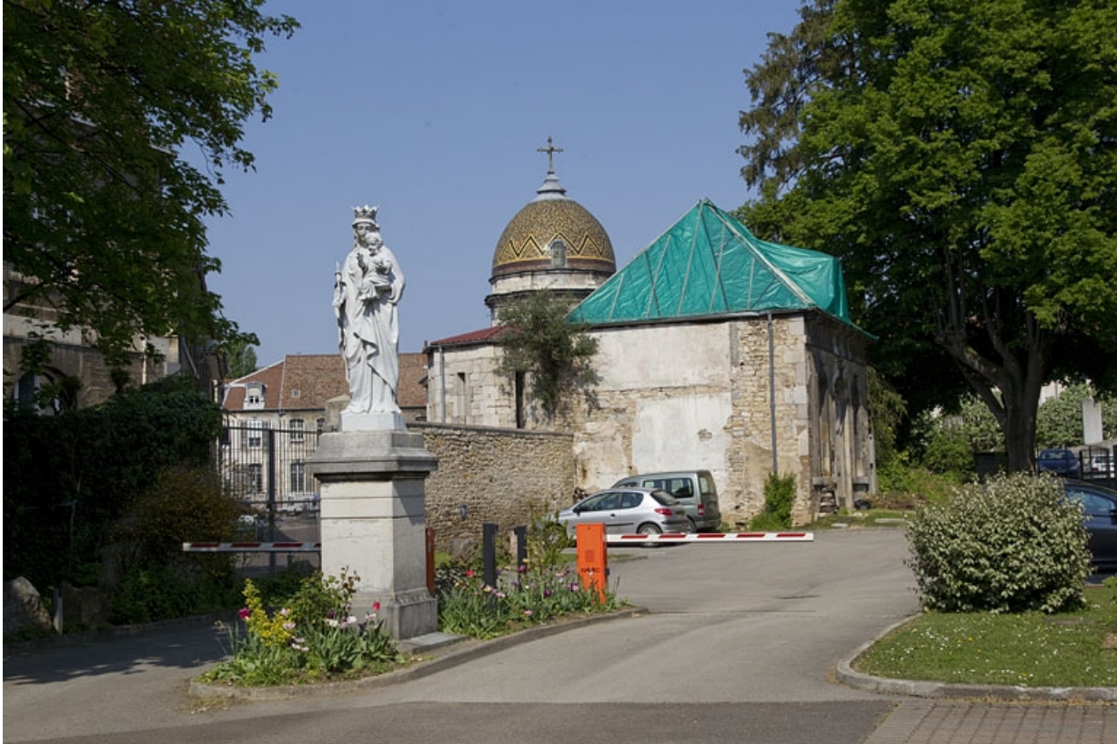
Pavillon de jardin : vue éloignée de trois quarts gauche.

25, Besançon, 14 rue Mégevand, lieudit : îlot Mairie