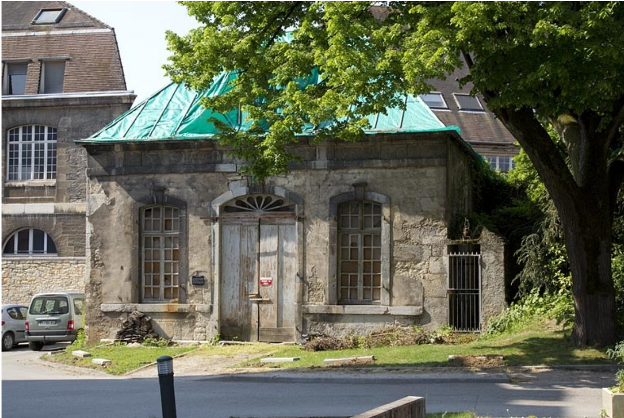
Pavillon de jardin : vue de la façade antérieure.

25, Besançon, 14 rue Mégevand, lieudit : îlot Mairie