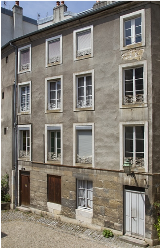
Troisième logis secondaire à droite de la cour : de trois quarts droit.

25, Besançon, 14 rue Mégevand, lieudit : îlot Mairie