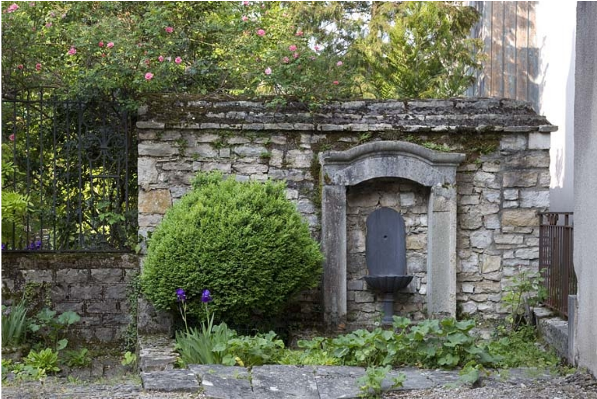
Vue de la borne-fontaine située contre le mur du jardin.

25, Besançon, 14 rue Mégevand, lieudit : îlot Mairie