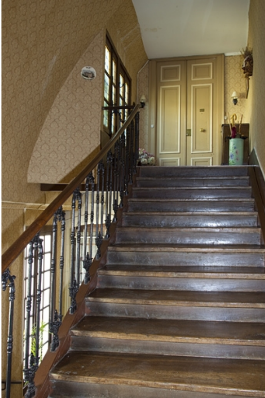
Intérieur de l'escalier : détail d'une volée.

25, Besançon, 14 rue Mégevand, lieudit : îlot Mairie