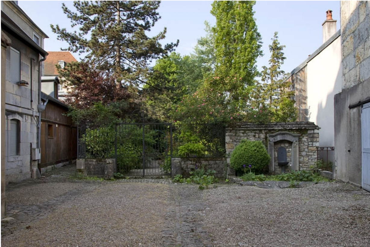
Vue de l'entrée du jardin depuis la cour.

25, Besançon, 14 rue Mégevand, lieudit : îlot Mairie