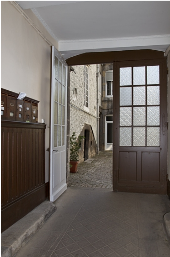
Vue du passage cocher en direction de la cour. 25, Besançon, 14 rue Mégevand, lieudit : îlot Mairie