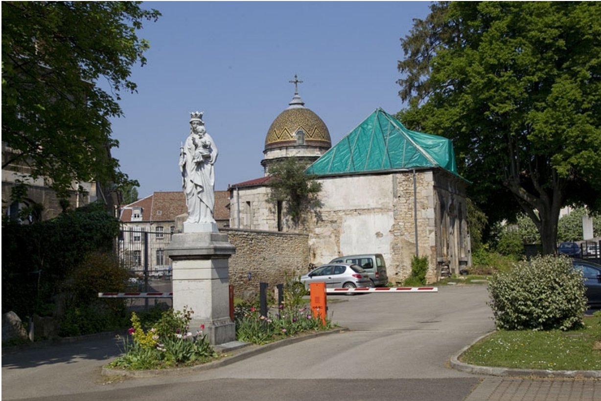
Pavillon de jardin : vue éloignée de trois quarts gauche.

25, Besançon, 14 rue Mégevand, lieudit : îlot Mairie