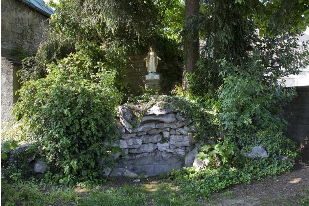
Vue des vestiges de la grotte artificielle.

25, Besançon, 14 rue Mégevand, lieudit : îlot Mairie