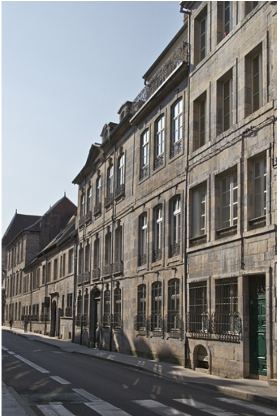
Logis principal, façade sur rue : de trois quarts droit. 25, Besançon, 14 rue Mégevand, lieudit : îlot Mairie