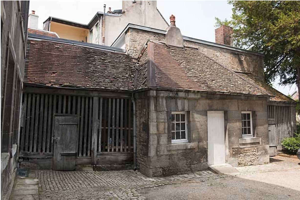
Buanderie et bûchers : vue d'ensemble de trois quarts gauche.

25, Besançon, 103 rue des Granges, lieudit : îlot Jean Cornet