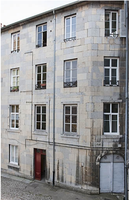
Deuxième logis secondaire à droite de la deuxième cour : détail de la partie droite.

25, Besançon, 103 rue des Granges, lieudit : îlot Jean Cornet