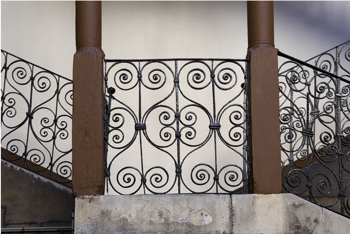
Escalier à cage ouverte à droite de la première cour : détail du décor de la rampe en ferronnerie.

25, Besançon, 103 rue des Granges, lieudit : îlot Jean Cornet