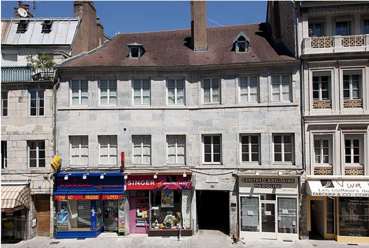
Vue d'ensemble du logis principal depuis la rue.

25, Besançon, 103 rue des Granges, lieudit : îlot Jean Cornet