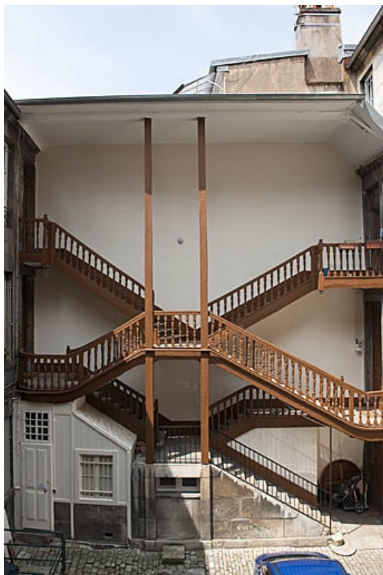
Vue d'ensemble de l'escalier à cage ouverte à gauche de la première cour, de face.

25, Besançon, 103 rue des Granges, lieudit : îlot Jean Cornet