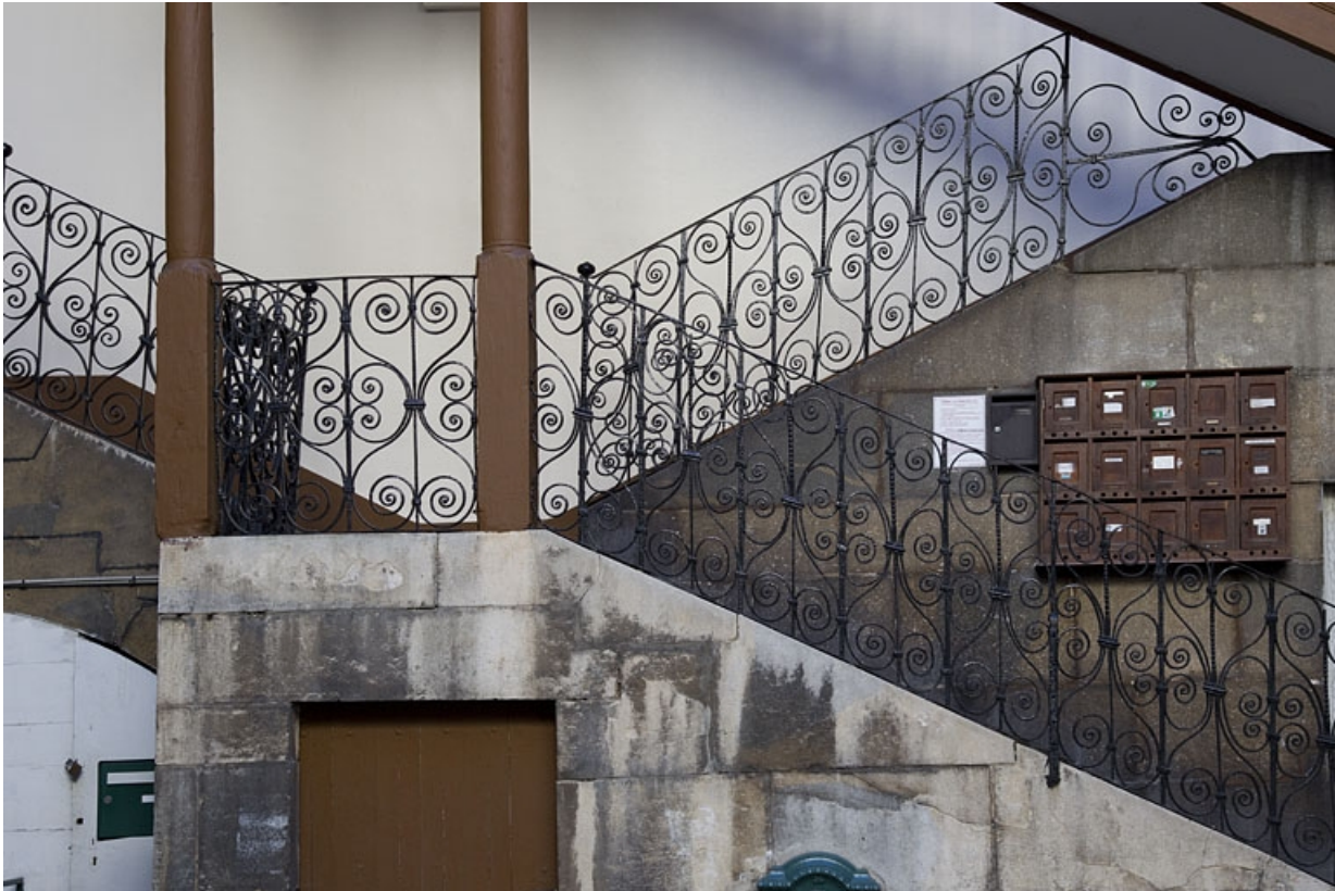
Escalier à cage ouverte à droite de la première cour : détail de la rampe en ferronnerie.

25, Besançon, 103 rue des Granges, lieudit : îlot Jean Cornet