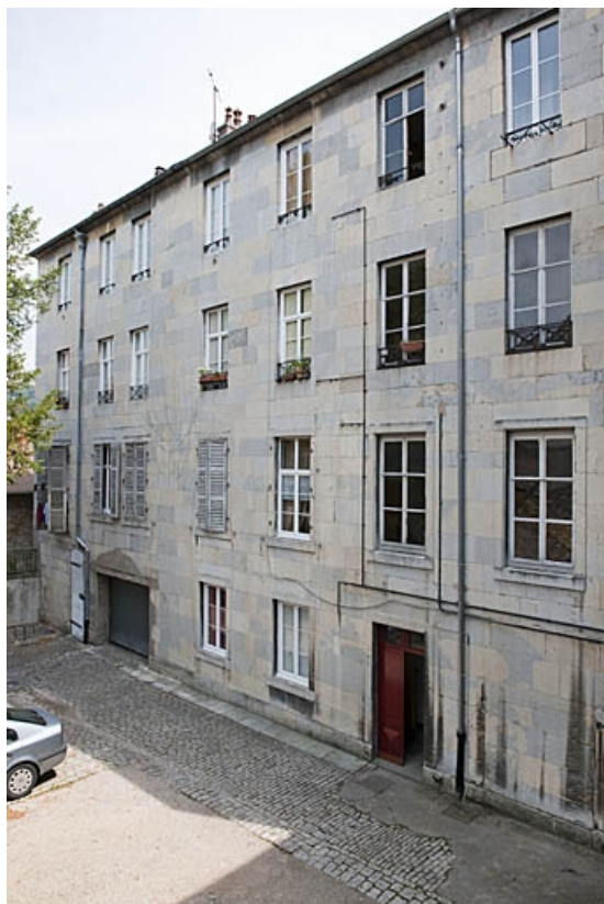
Vue d'ensemble du deuxième logis secondaire à droite de la deuxième cour : de trois quarts droit.

25, Besançon, 103 rue des Granges, lieudit : îlot Jean Cornet