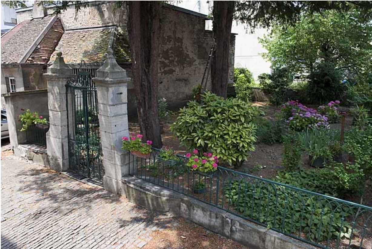
Vue d'ensemble du jardin à gauche de la deuxième cour. 25, Besançon, 103 rue des Granges, lieudit : îlot Jean Cornet