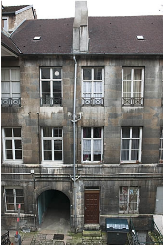
Logis principal : vue d'ensemble de la façade postérieure.

25, Besançon, 103 rue des Granges, lieudit : îlot Jean Cornet