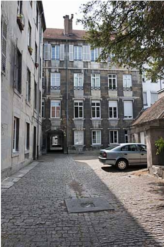
Vue d'ensemble de la façade postérieure du premier logis secondaire donnant sur la deuxième cour. 25, Besançon, 103 rue des Granges, lieudit : îlot Jean Cornet