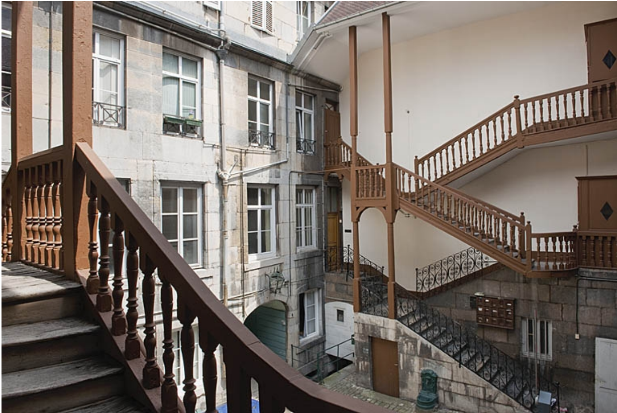
Vue d'ensemble de l'escalier à cage ouverte à droite de la première cour, de trois quarts droit.

25, Besançon, 103 rue des Granges, lieudit : îlot Jean Cornet