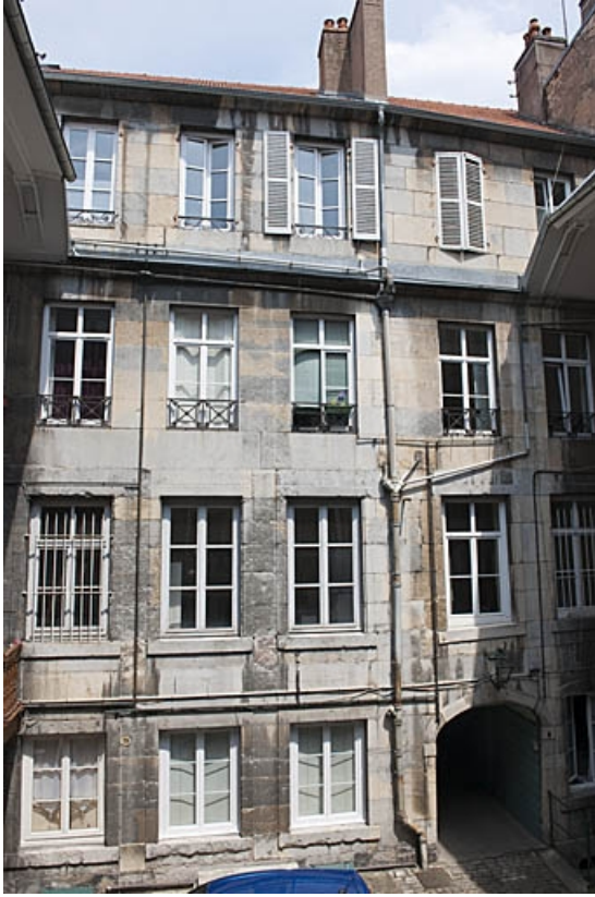
Premier logis secondaire : vue d'ensemble de la façade antérieure.

25, Besançon, 103 rue des Granges, lieudit : îlot Jean Cornet