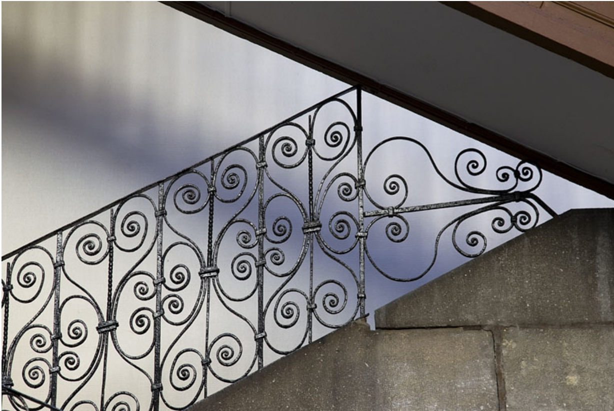
Escalier à cage ouverte à droite de la première cour : détail du décor de la rampe en ferronnerie.

25, Besançon, 103 rue des Granges, lieudit : îlot Jean Cornet