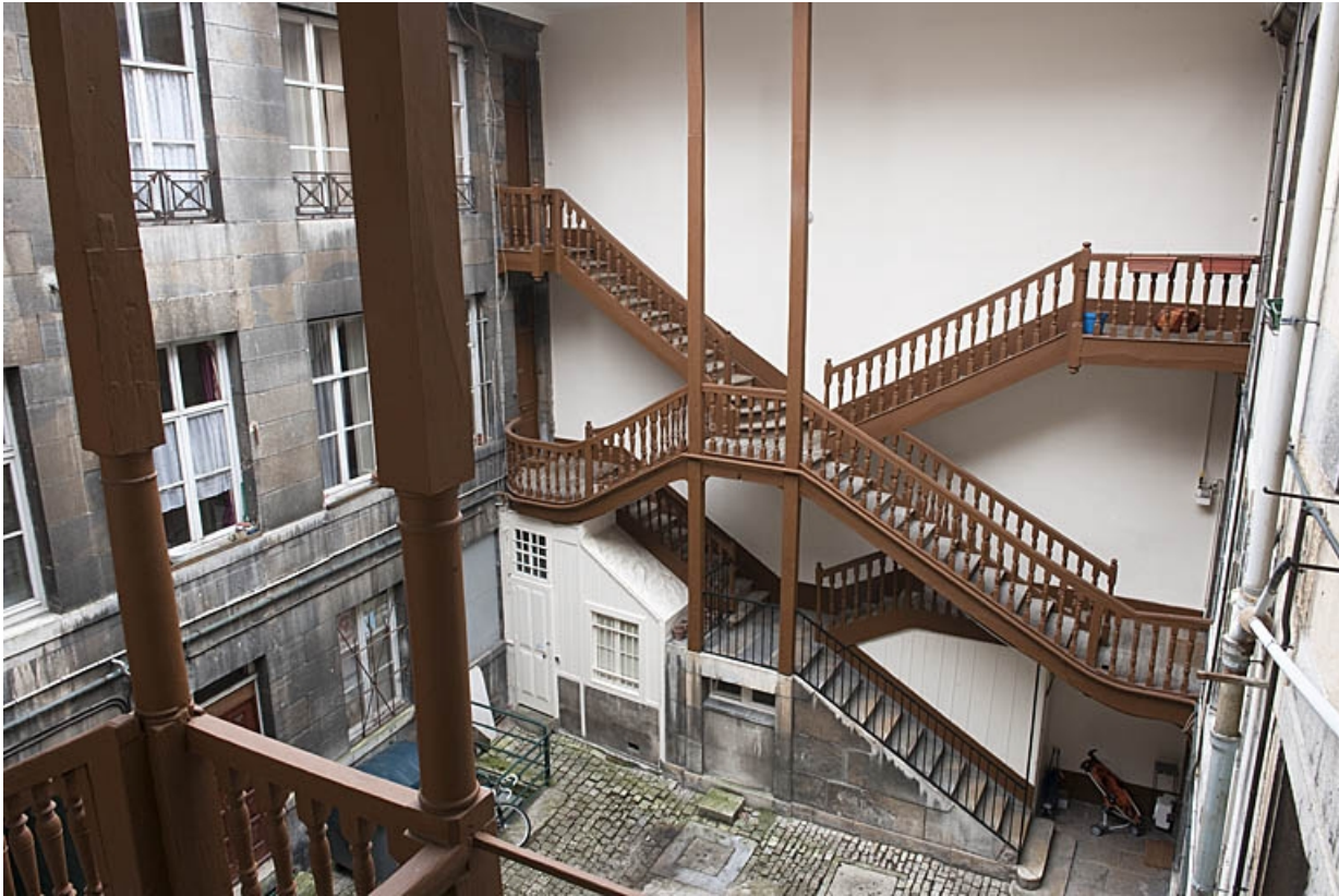
Vue d'ensemble de l'escalier à cage ouverte à gauche de la première cour, depuis l'escalier droit.

25, Besançon, 103 rue des Granges, lieudit : îlot Jean Cornet