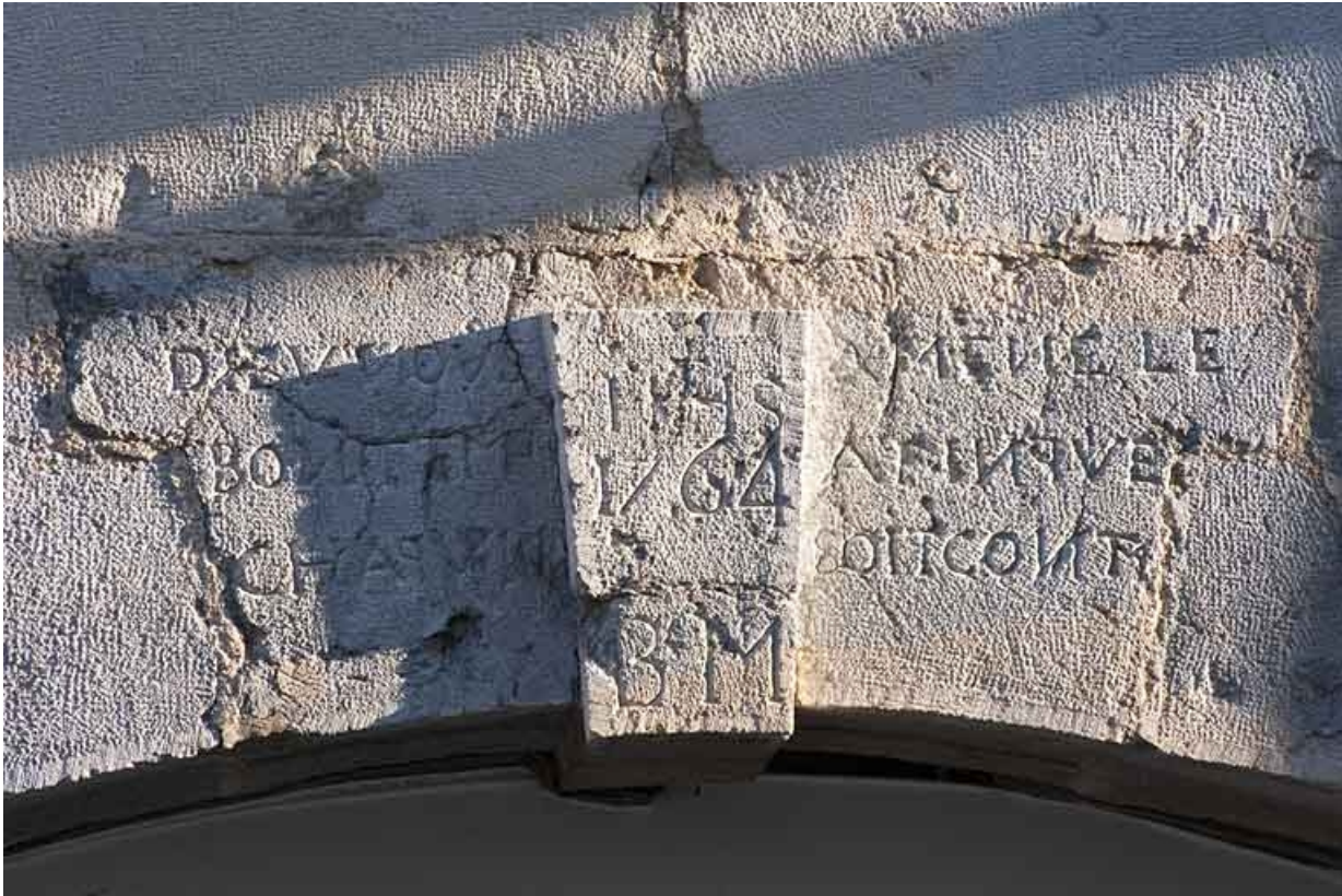
25, Besançon, 34 rue Bersot, lieudit : îlot Jean Cornet