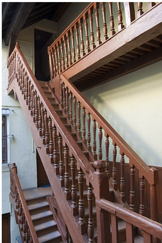
Escalier à cage ouverte à droite dans la première cour : détail des volées supérieures.

25, Besançon, 40, 42 rue Bersot, lieudit : îlot Jean Cornet