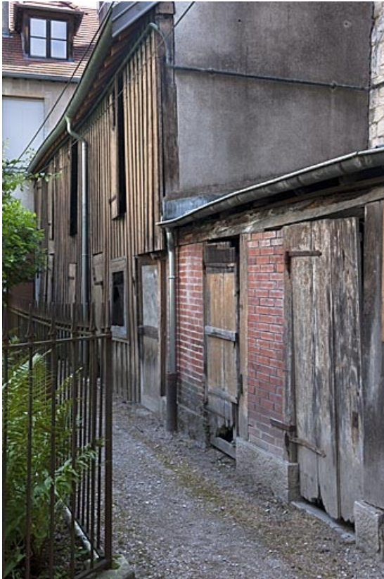
Vue d'ensemble des bûchers dans la deuxième cour : de trois quarts droit.

25, Besançon, 83 rue des Granges, lieudit : îlot Jean Cornet