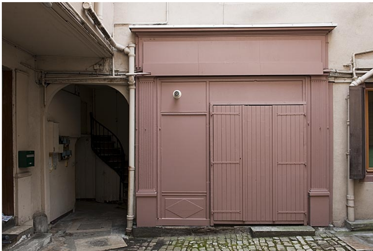
Détail de la devanture de l'ancienne boutique située dans la première cour.

25, Besançon, 83 rue des Granges, lieudit : îlot Jean Cornet