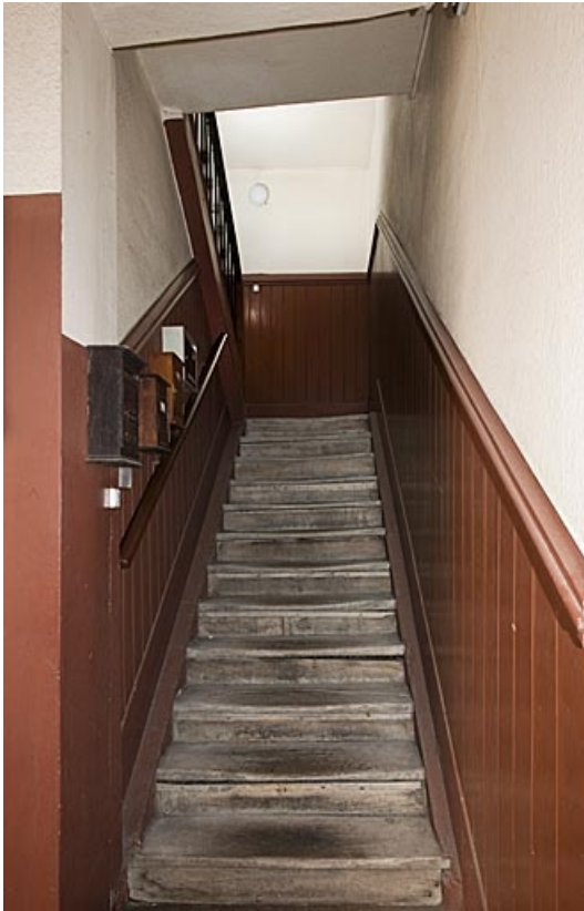
Logis principal : détail de l'escalier à droite du passage cocher.

25, Besançon, 83 rue des Granges, lieudit : îlot Jean Cornet