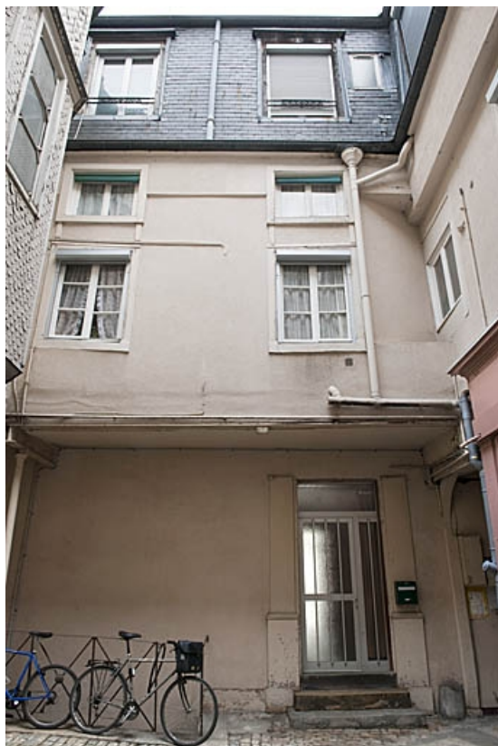
Logis principal : façade située au fond de la première cour.

25, Besançon, 83 rue des Granges, lieudit : îlot Jean Cornet