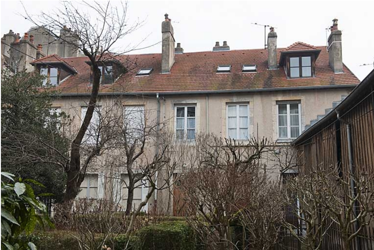
Vue d'ensemble du logis secondaire au fond de la deuxième cour.

25, Besançon, 83 rue des Granges, lieudit : îlot Jean Cornet