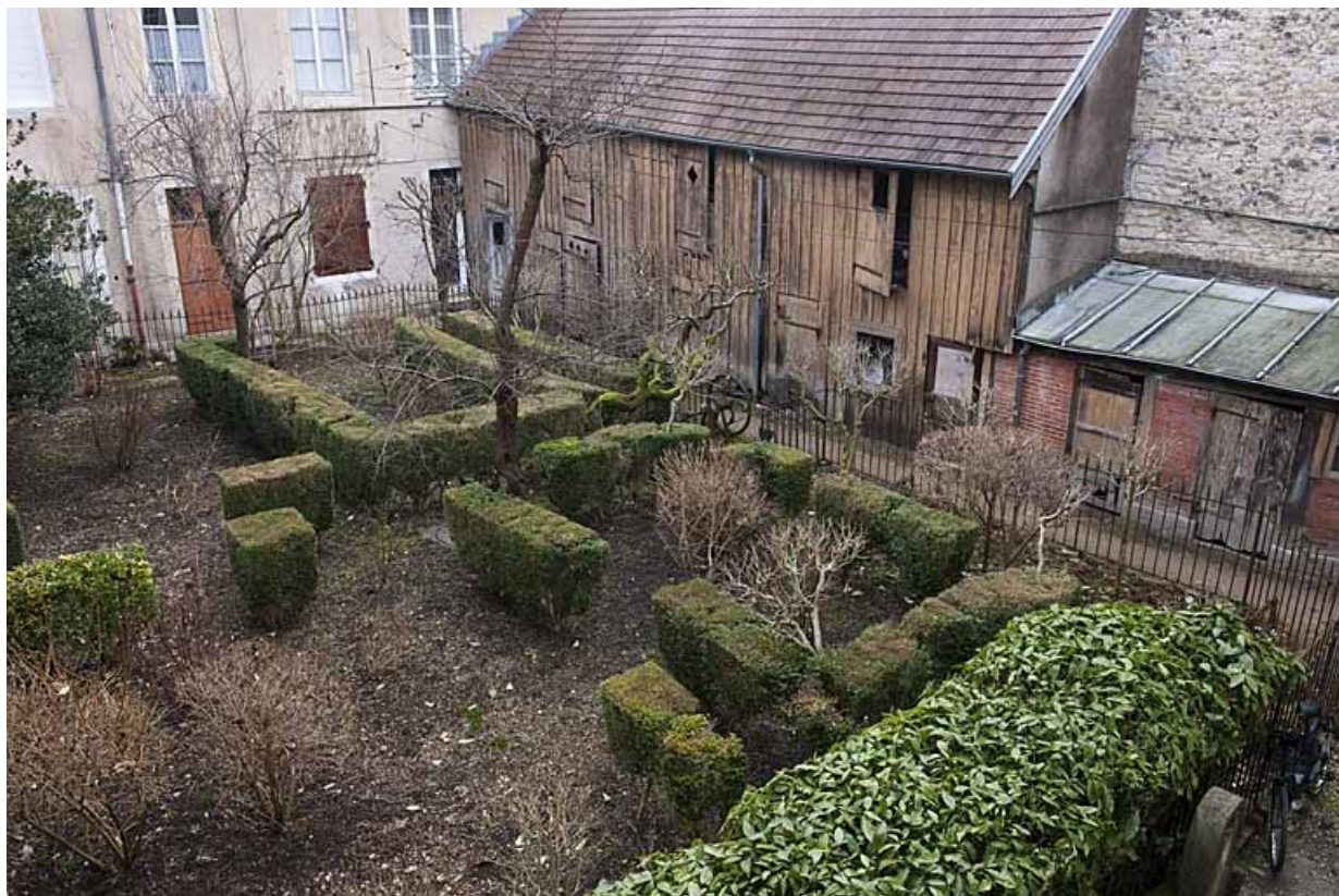
Vue d'ensemble du jardin en hiver.

25, Besançon, 83 rue des Granges, lieudit : îlot Jean Cornet