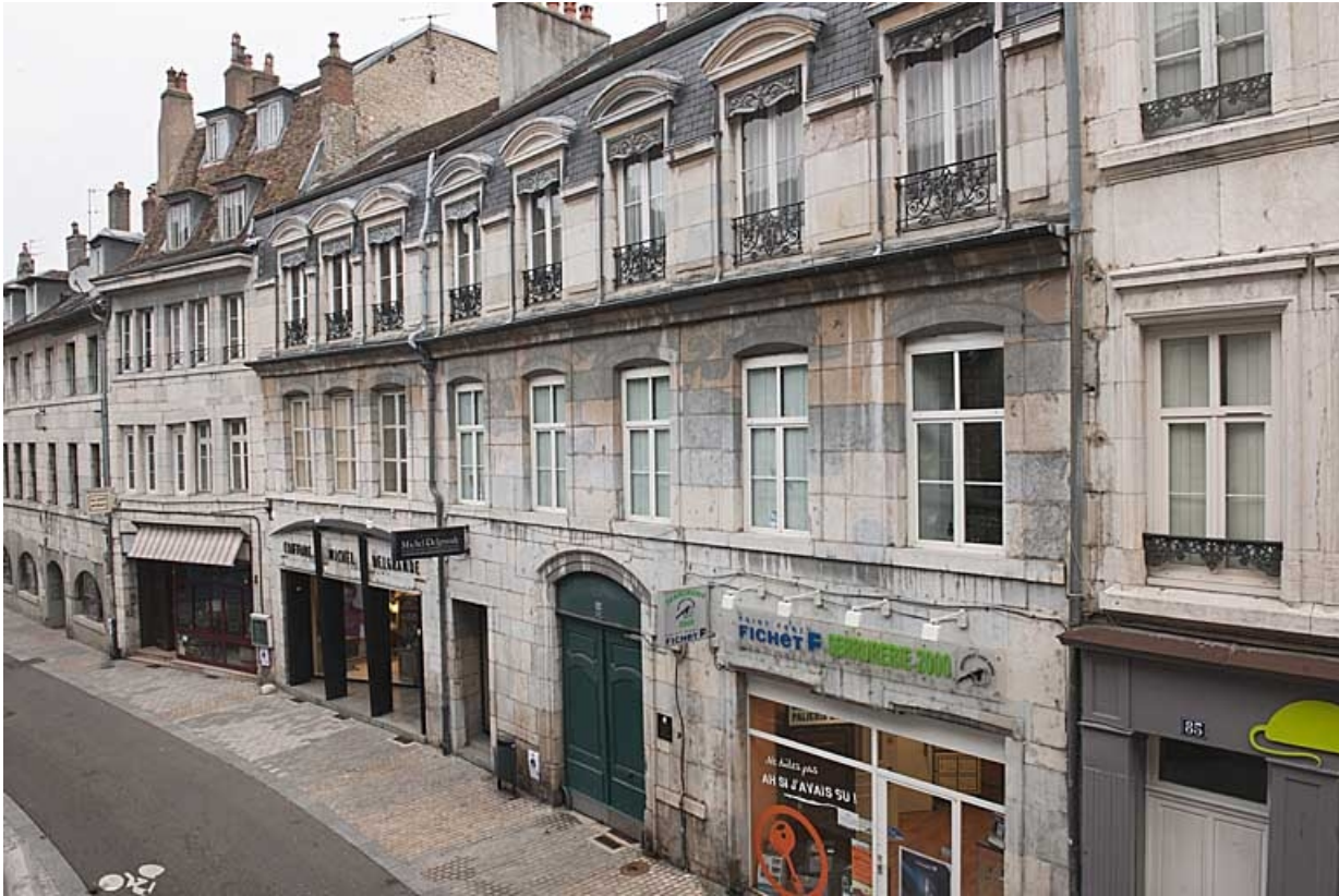
Logis principal : façade sur rue de trois quarts droit, vue éloignée.

25, Besançon, 83 rue des Granges, lieudit : îlot Jean Cornet