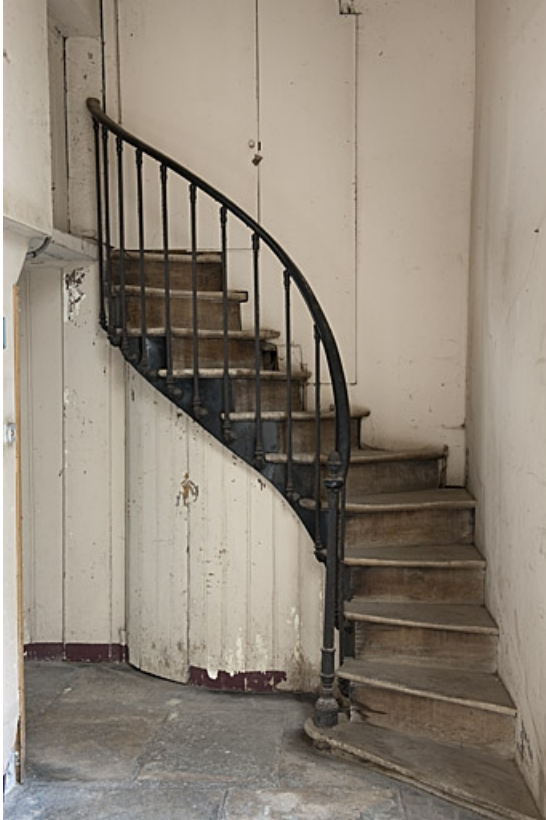
Logis principal : détail du départ d'un escalier secondaire au fond de la première cour.

25, Besançon, 83 rue des Granges, lieudit : îlot Jean Cornet