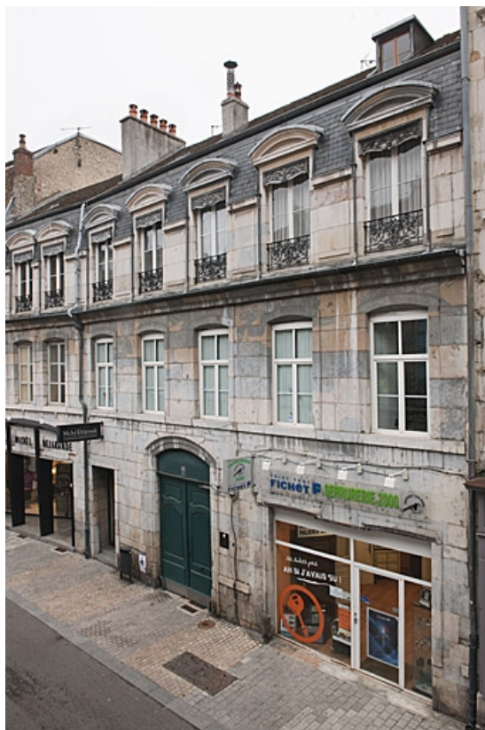
Logis principal : façade sur rue de trois quarts droit.

25, Besançon, 83 rue des Granges, lieudit : îlot Jean Cornet