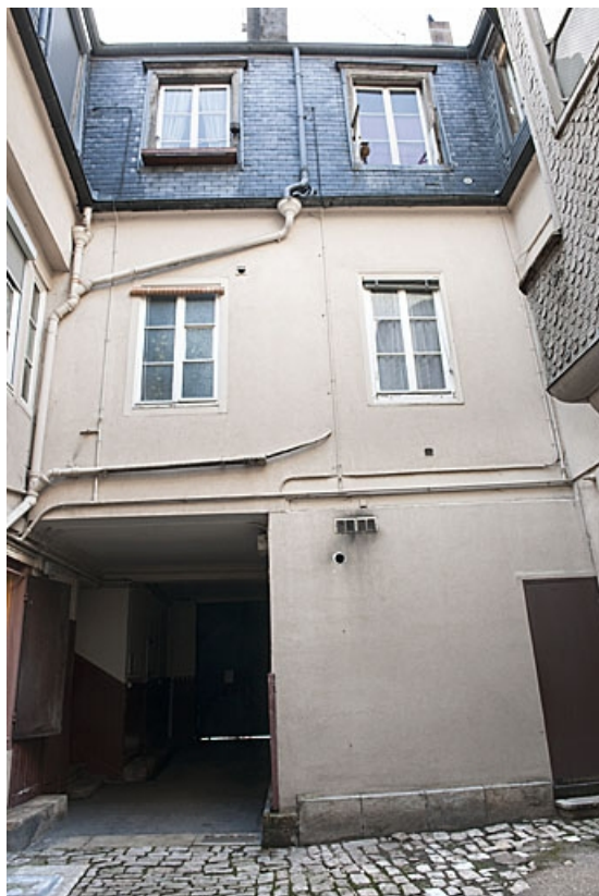
Logis principal : façade postérieure.

25, Besançon, 83 rue des Granges, lieudit : îlot Jean Cornet