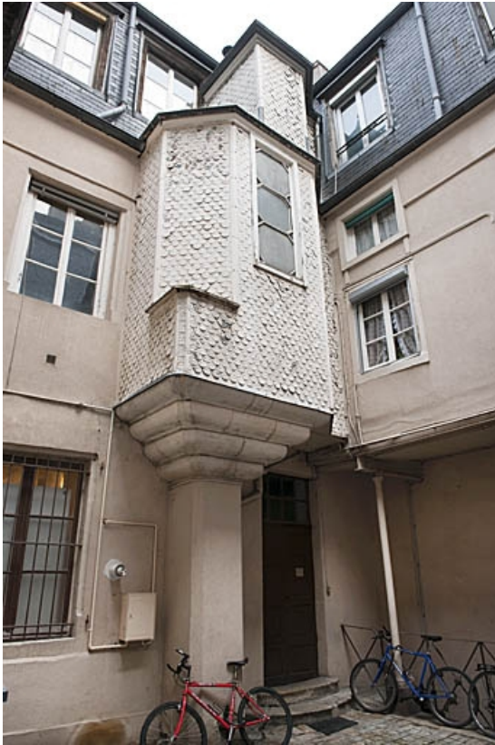
Logis principal : détail de l'avant-corps sur pilier à gauche de la première cour. 25, Besançon, 83 rue des Granges, lieudit : îlot Jean Cornet