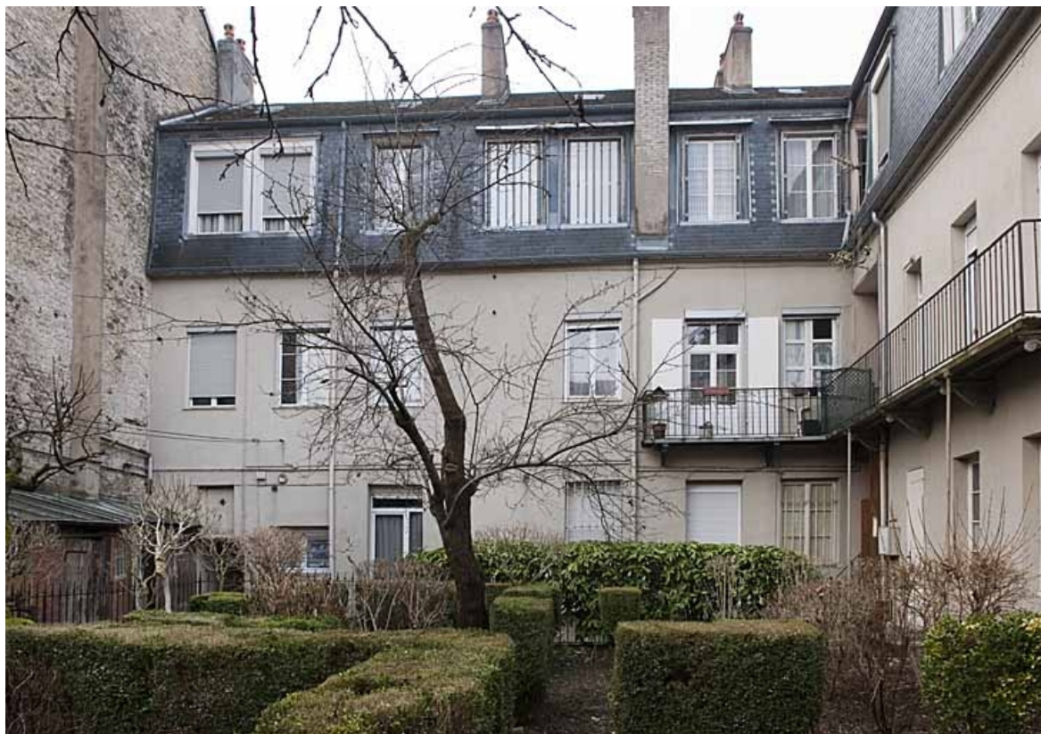
Logis principal : façade postérieure donnant sur la deuxième cour et le jardin.

25, Besançon, 83 rue des Granges, lieudit : îlot Jean Cornet