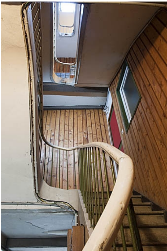
Logis principal : détail de l'escalier situé dans l'aile gauche.

25, Besançon, 83 rue des Granges, lieudit : îlot Jean Cornet