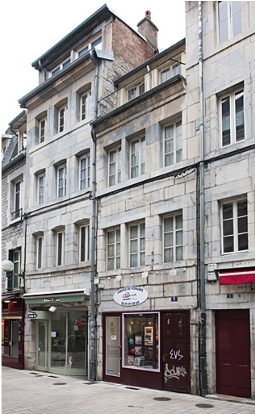
Façade sur rue, de trois quarts droit.

25, Besançon, 8 rue Bersot, lieudit : îlot Jean Cornet