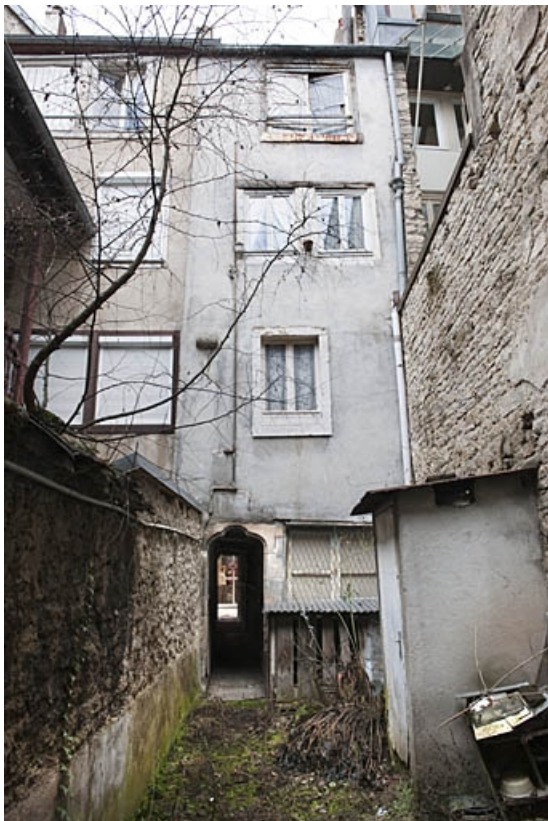
Logis principal : façade postérieure, de face.

25, Besançon, 8 rue Bersot, lieudit : îlot Jean Cornet