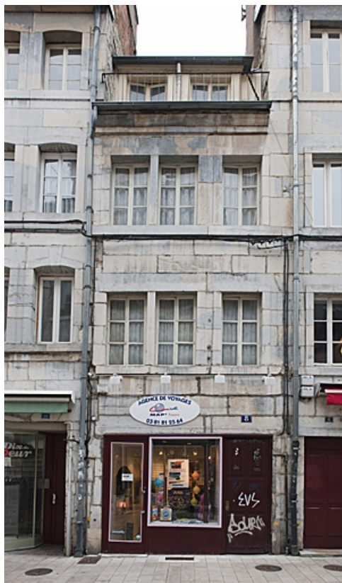
Façade sur rue, de face.

25, Besançon, 8 rue Bersot, lieudit : îlot Jean Cornet