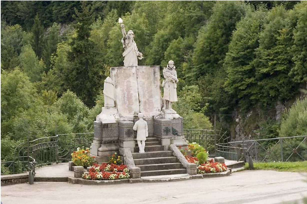
Vue générale de trois quart gauche. 25, Jougne place du Mont d'Or