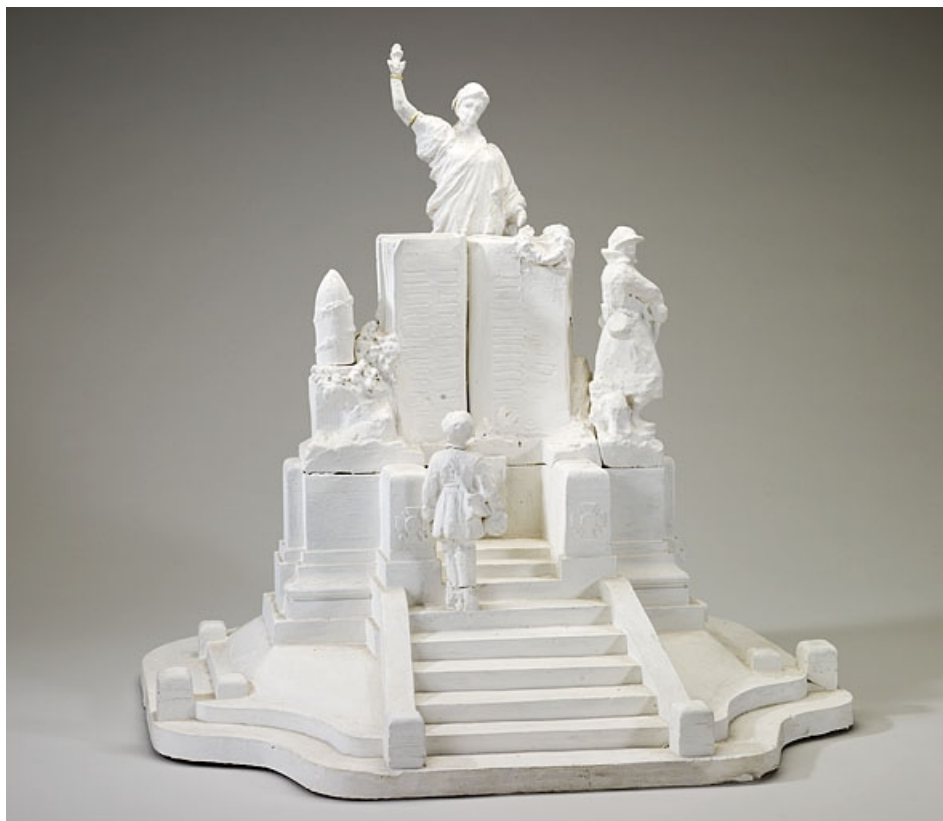
Maquette (projet réalisé) déposée au musée de Jougne. 25, Jougne place du Mont d'Or