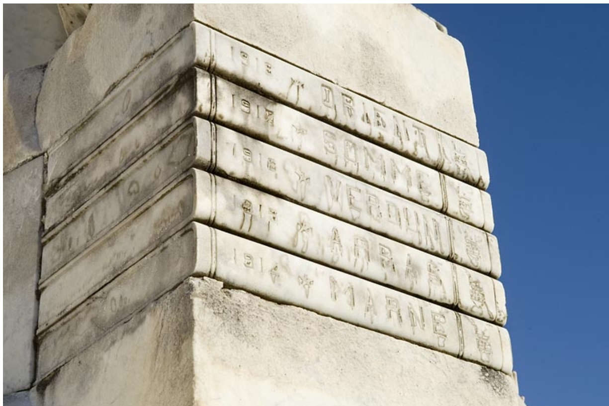
Détail du revers : le dos des livres avec les noms des principales batailles. 25, Jougne place du Mont d'Or