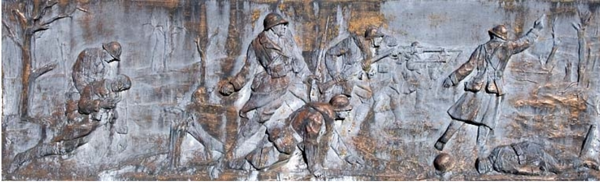
Détail : bas-relief I' "Attaque." 25, Jougne place du Mont d'Or