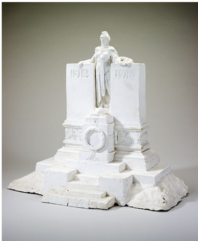
Maquette (projet non réalisé) déposée au musée de Jougne. 25, Jougne place du Mont d'Or