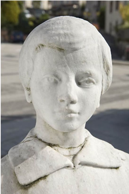
Détail : tête de l'enfant.