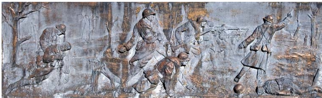
Détail : bas-relief I' "Attaque."