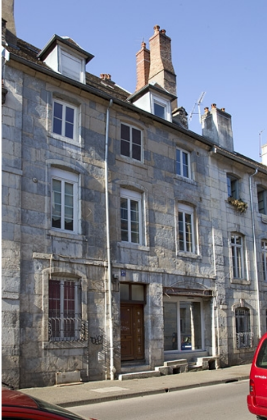
Vue d'ensemble depuis la rue, de trois quarts gauche. 25, Besançon, 20 rue Charles Nodier, lieudit : îlot Préfecture