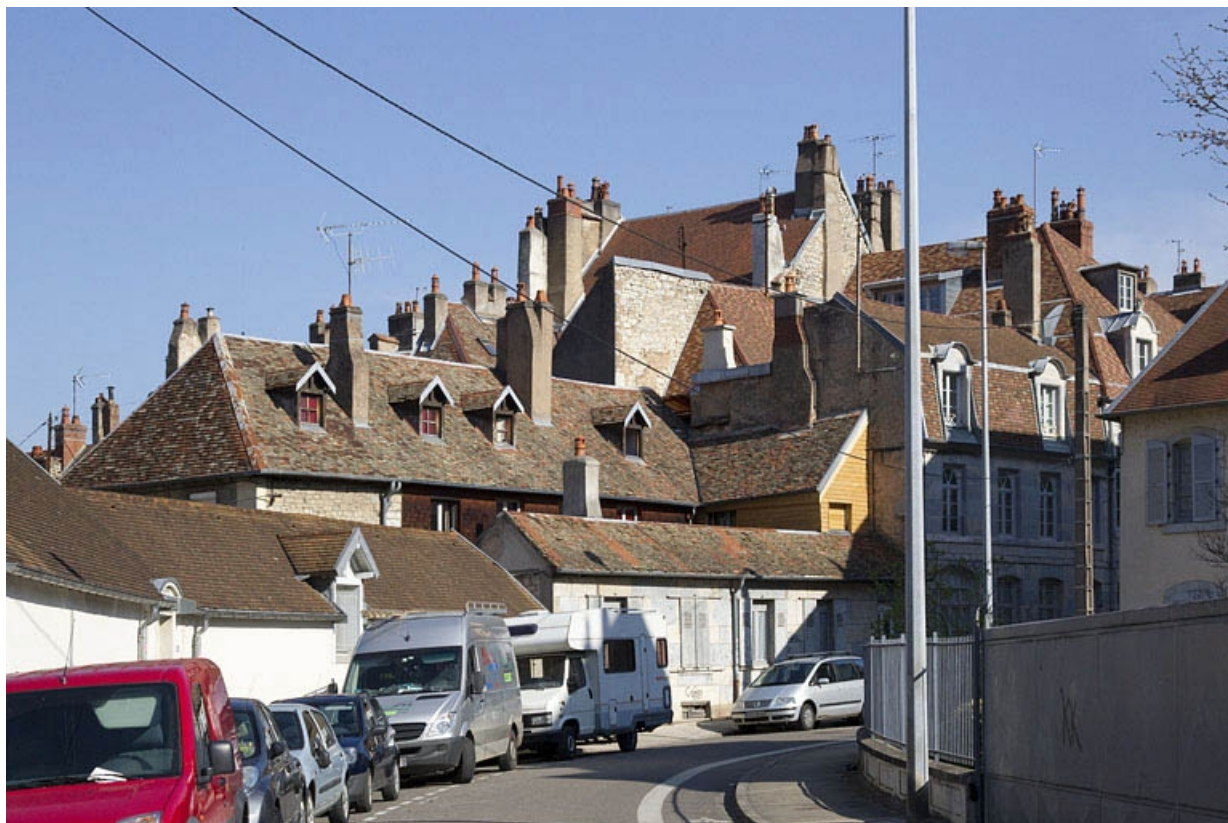
Vue d'ensemble depuis le fond de la rue du Porteau.

25, Besançon, 22 rue Charles Nodier, lieudit : îlot Préfecture