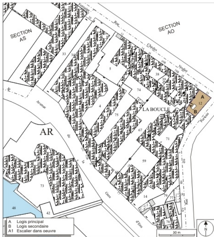
Plan masse et de situation. Extrait du plan cadastral, 1974, section AS2. 25, Besançon, 22 rue Charles Nodier, lieudit : îlot Préfecture