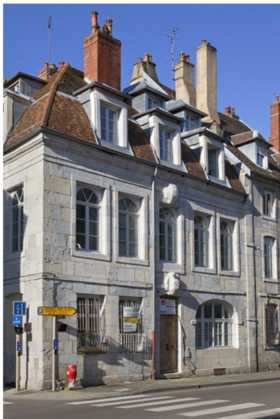
Façade antérieure : vue d'ensemble de trois quarts gauche.

25, Besançon, 22 rue Charles Nodier, lieudit : îlot Préfecture