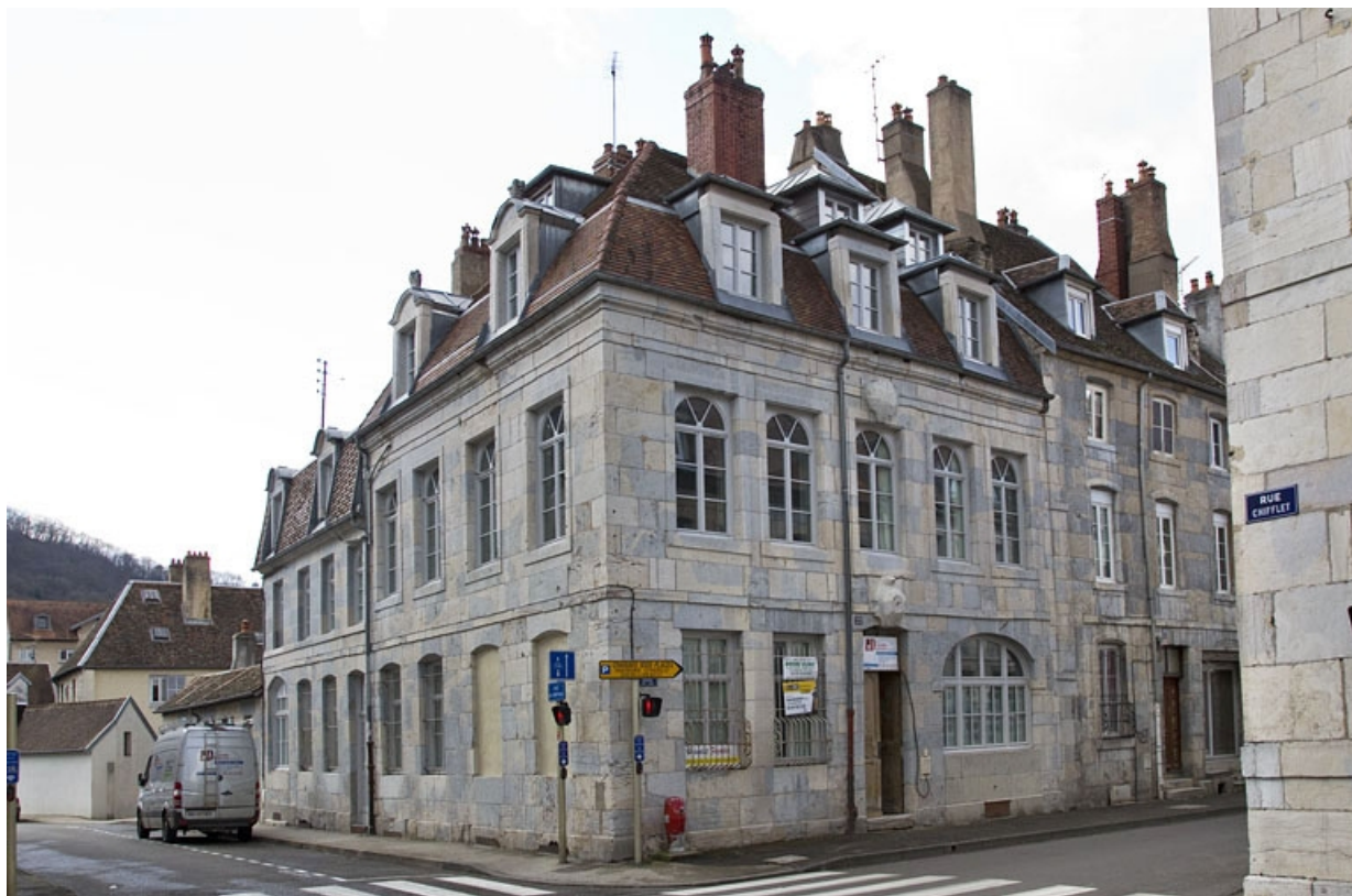
Vue d'ensemble depuis la rue, de trois quarts gauche.

25, Besançon, 22 rue Charles Nodier, lieudit : îlot Préfecture