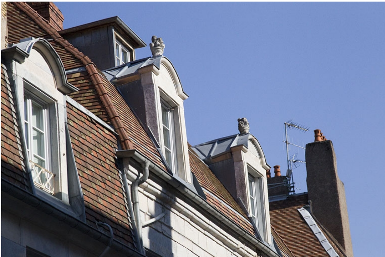
Détail des lucarnes sur le versant de toit donnant rue du Porteau.

25, Besançon, 22 rue Charles Nodier, lieudit : îlot Préfecture