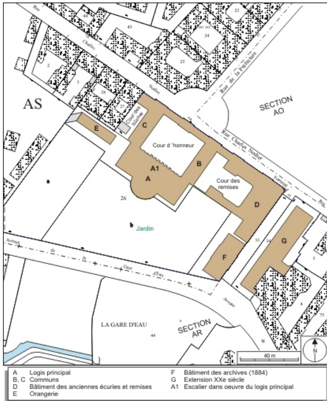
Plan masse et de situation. Extrait du plan cadastral, 1974, section AS2. 25, Besançon, 8bis, 10 rue Charles Nodier, lieudit : îlot Préfecture