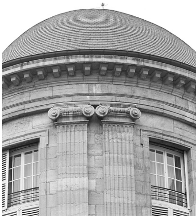
Façade postérieure, rotonde : détail des chapiteaux de deux pilastres jumelés. 25, Besançon, 8bis, 10 rue Charles Nodier, lieudit : îlot Préfecture