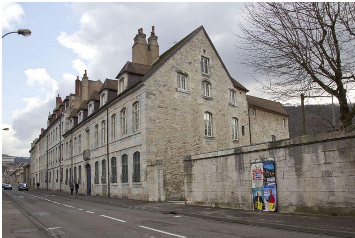
Vue d'ensemble dans l'alignement de la rue, de trois quarts droit.

25, Besançon, 2 rue Charles Nodier, lieudit : îlot Préfecture