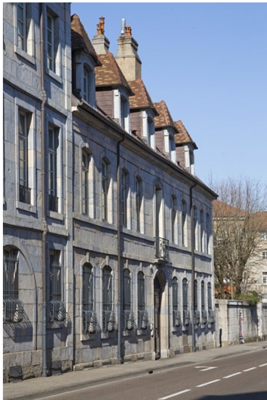
Façade antérieure : vue rapprochée, de trois quarts gauche.

25, Besançon, 2 rue Charles Nodier, lieudit : îlot Préfecture