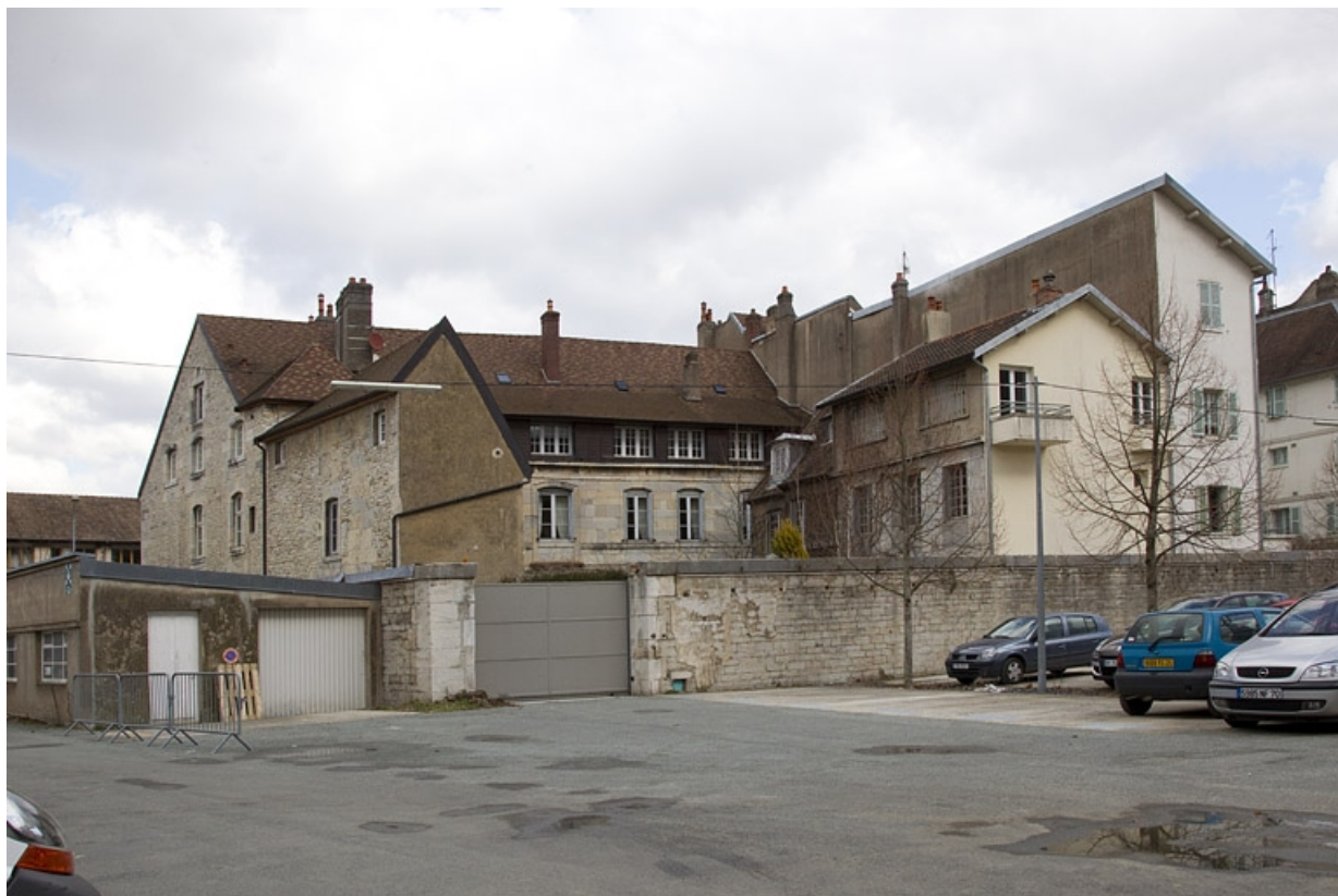
Vue d'ensemble de l'arrière de l'édifice, de trois quarts gauche.

25, Besançon, 2 rue Charles Nodier, lieudit : îlot Préfecture