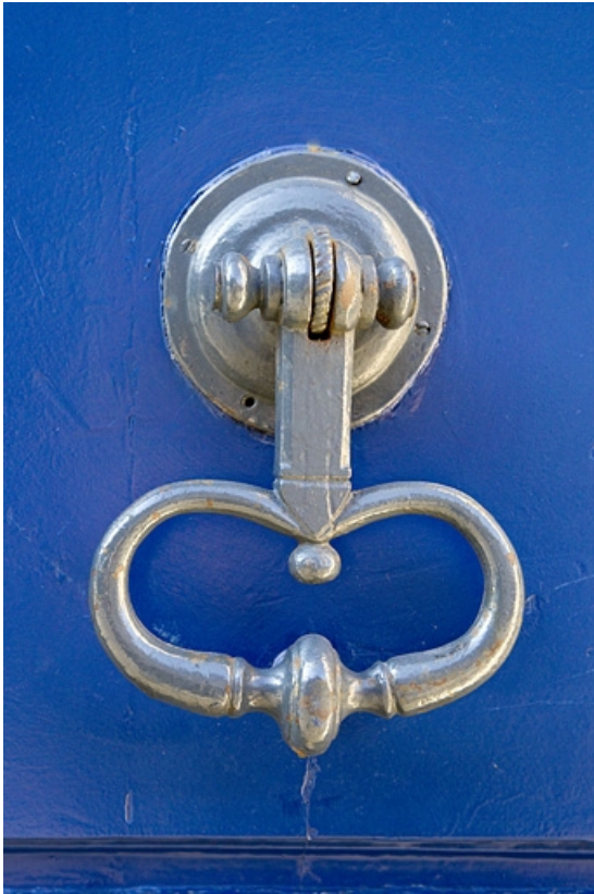
Façade antérieure, portail d'entrée : détail du portail.

25, Besançon, 2 rue Charles Nodier, lieudit : îlot Préfecture