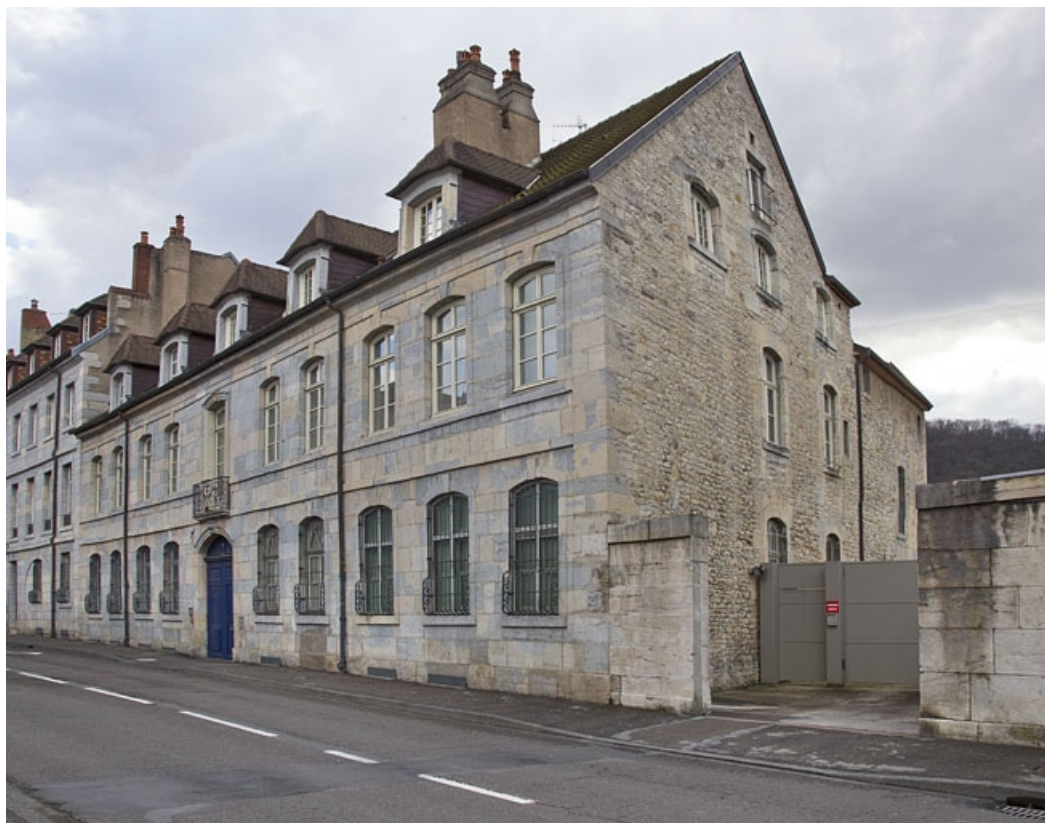
Vue d'ensemble depuis la rue, de trois quarts droit.

25, Besançon, 2 rue Charles Nodier, lieudit : îlot Préfecture