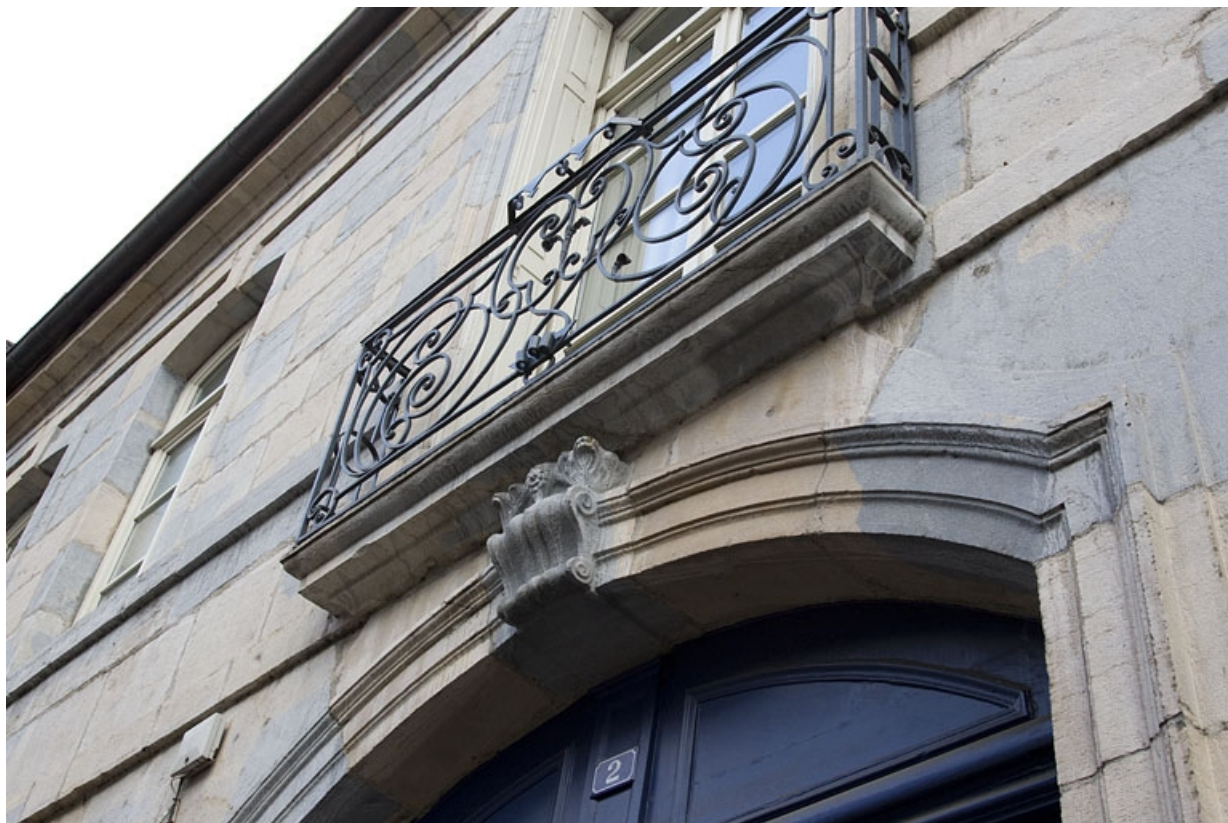
Façade antérieure : détail du balcon en ferronnerie, de trois quarts droit.

25, Besançon, 2 rue Charles Nodier, lieudit : îlot Préfecture