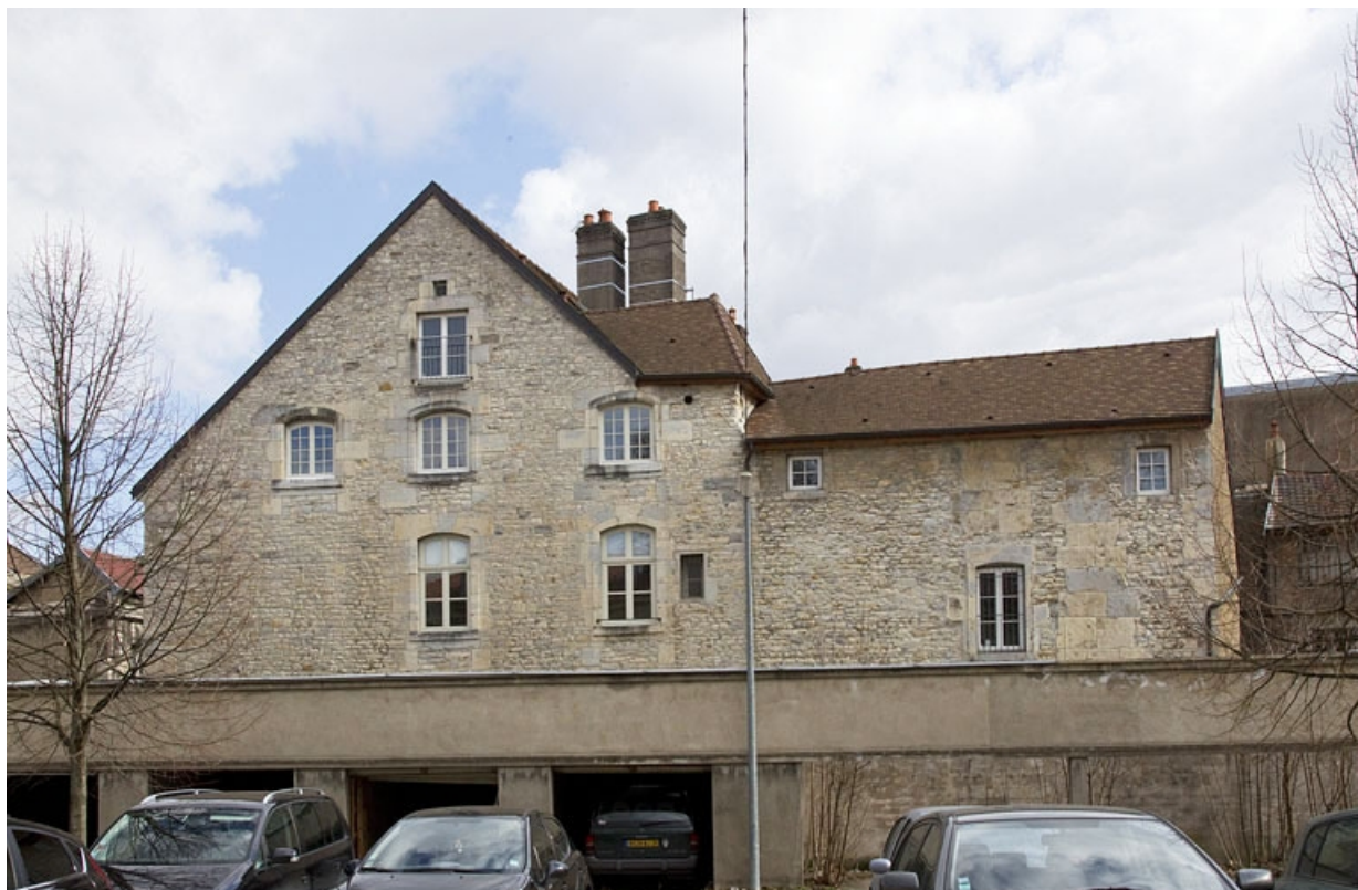
Vue de la façade latérale droite, de face.

25, Besançon, 2 rue Charles Nodier, lieudit : îlot Préfecture