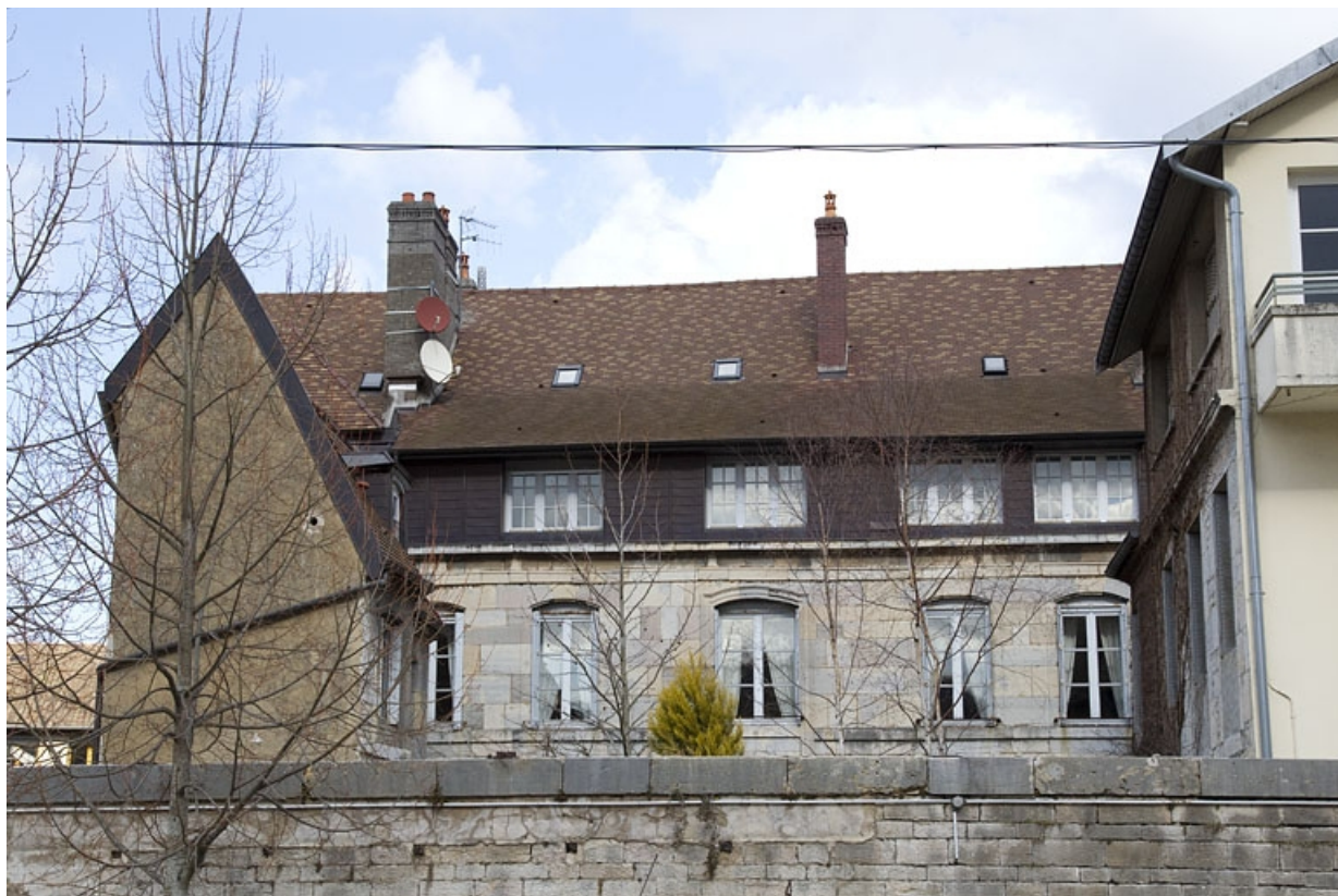
Vue de la façade postérieure depuis l'extérieur de la parcelle.

25, Besançon, 2 rue Charles Nodier, lieudit : îlot Préfecture