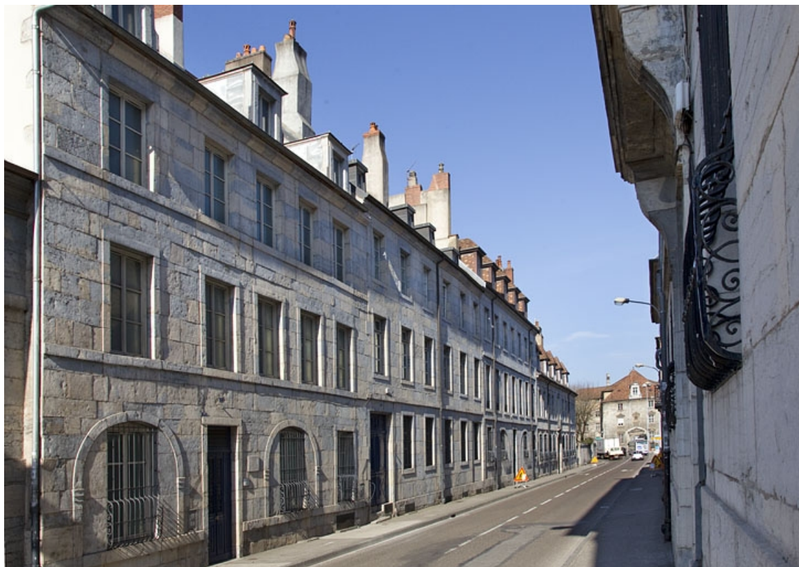
Vue d'ensemble dans l'alignement de la rue, de trois quarts gauche.

25, Besançon, 6 rue Charles Nodier, lieudit : îlot Préfecture