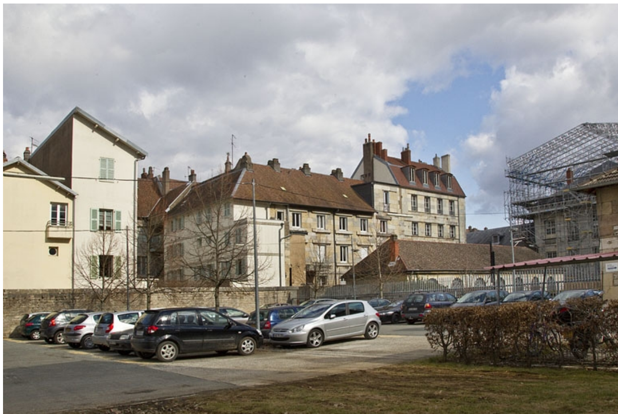
Vue d'ensemble éloignée de l'arrière de l'édifice.

25, Besançon, 6 rue Charles Nodier, lieudit : îlot Préfecture