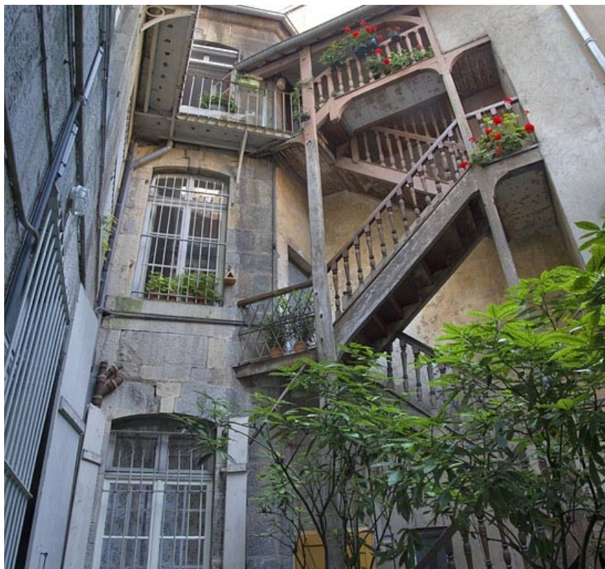
Vue d'ensemble de l'escalier à cage ouverte sur cour : de trois quarts droit.

25, Besançon, 6 rue Lecourbe, lieudit : îlot Lecourbe