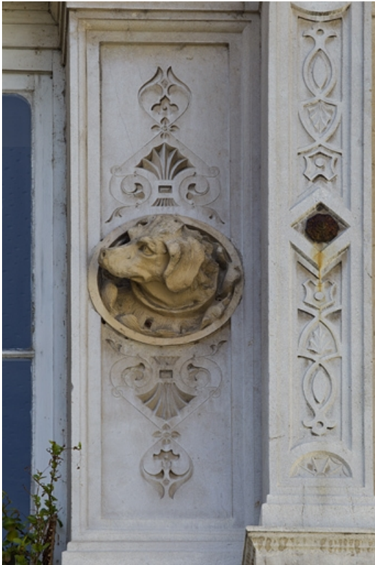
Façade d'angle, deuxième étage, baie centrale, détail du décor droit : tête de chien. 25, Besançon, 2 rue Lecourbe, lieudit : îlot Lecourbe