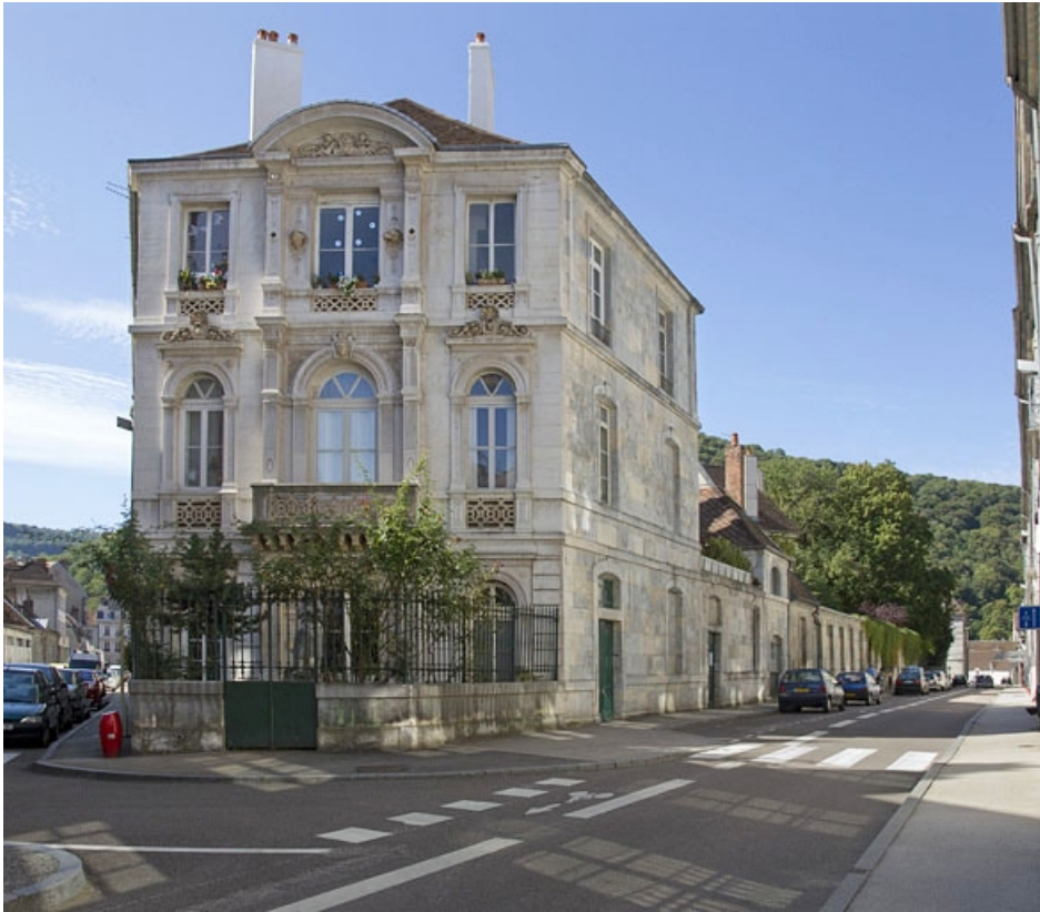
Vue d'ensemble depuis l'angle de la rue Chifflet. 25, Besançon, 2 rue Lecourbe, lieudit : îlot Lecourbe