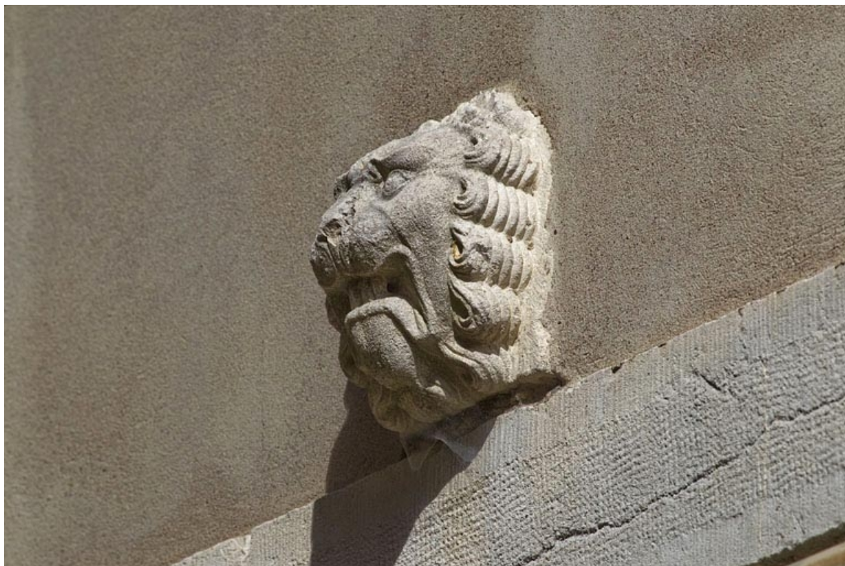
Logis secondaire (anciens communs) : détail du mufle de lion décorant la façade.

25, Besançon, 12 rue Lecourbe, lieudit : îlot Lecourbe