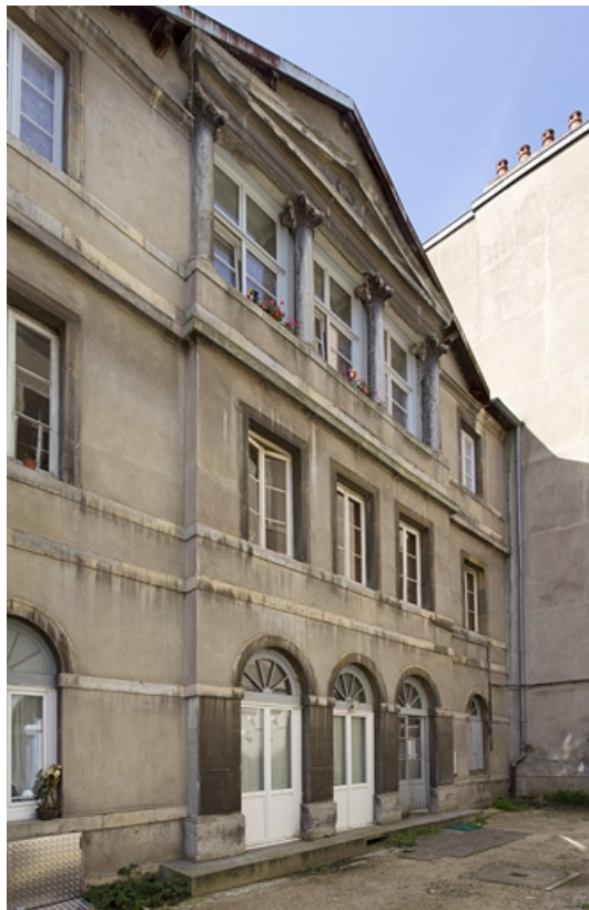
Façade antérieure du logis principal : de trois quarts gauche.

25, Besançon, 12 rue Lecourbe, lieudit : îlot Lecourbe