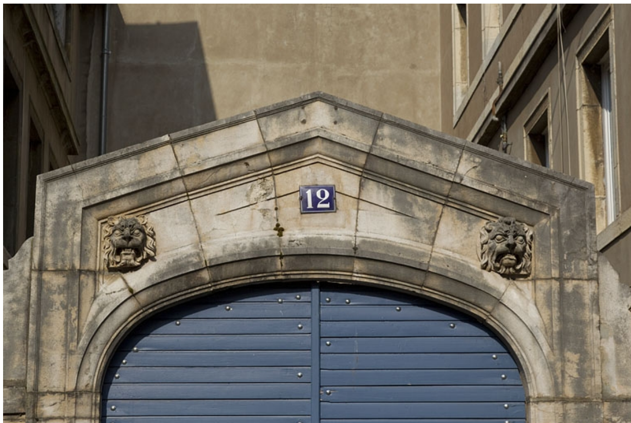
Portail d'entrée : détail de la partie supérieure.

25, Besançon, 12 rue Lecourbe, lieudit : îlot Lecourbe