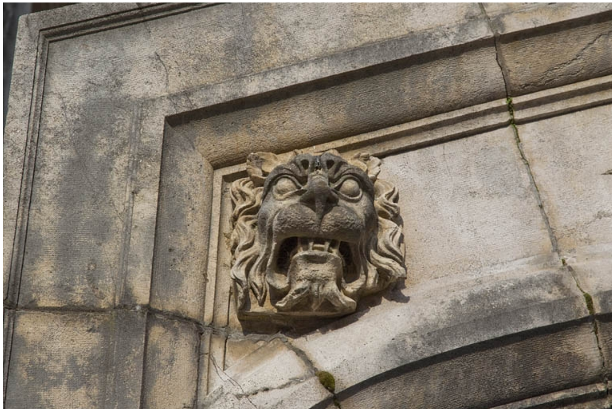
Portail d'entrée, partie supérieure : détail du mufle de lion gauche.

25, Besançon, 12 rue Lecourbe, lieudit : îlot Lecourbe