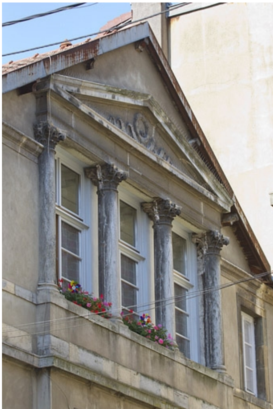
Logis principal, deuxième étage, partie centrale : détail des colonnes supportant le fronton, de trois quarts gauche. 25, Besançon, 12 rue Lecourbe, lieudit : îlot Lecourbe