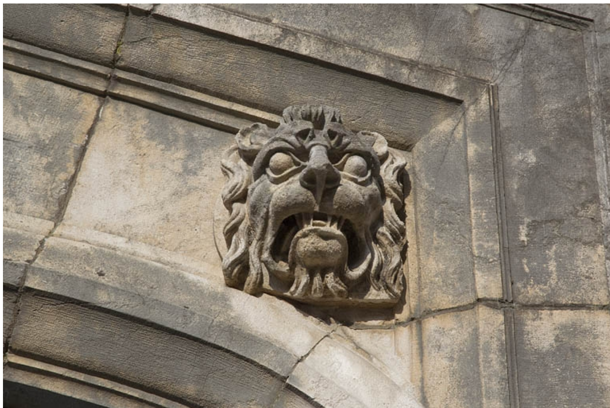
Portail d'entrée, partie supérieure : détail du mufle de lion droit.

25, Besançon, 12 rue Lecourbe, lieudit : îlot Lecourbe