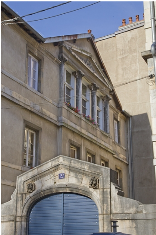
Logis principal et portail depuis la rue : de trois quarts gauche.

25, Besançon, 12 rue Lecourbe, lieudit : îlot Lecourbe