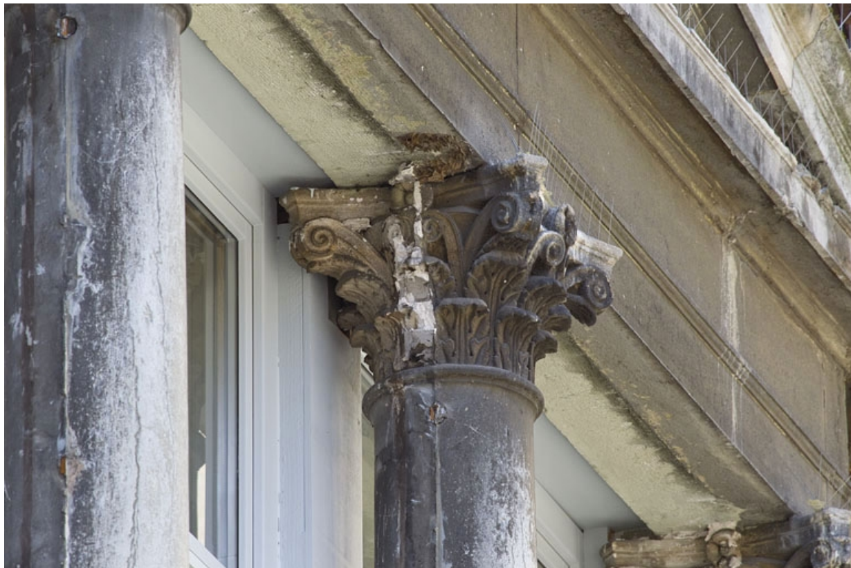
Logis principal, façade antérieure : détail d'un chapiteau corinthien.

25, Besançon, 12 rue Lecourbe, lieudit : îlot Lecourbe