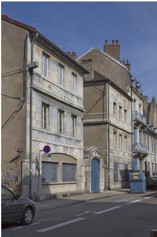
Vue d'ensemble depuis la rue : de trois quarts gauche.

25, Besançon, 12 rue Lecourbe, lieudit : îlot Lecourbe