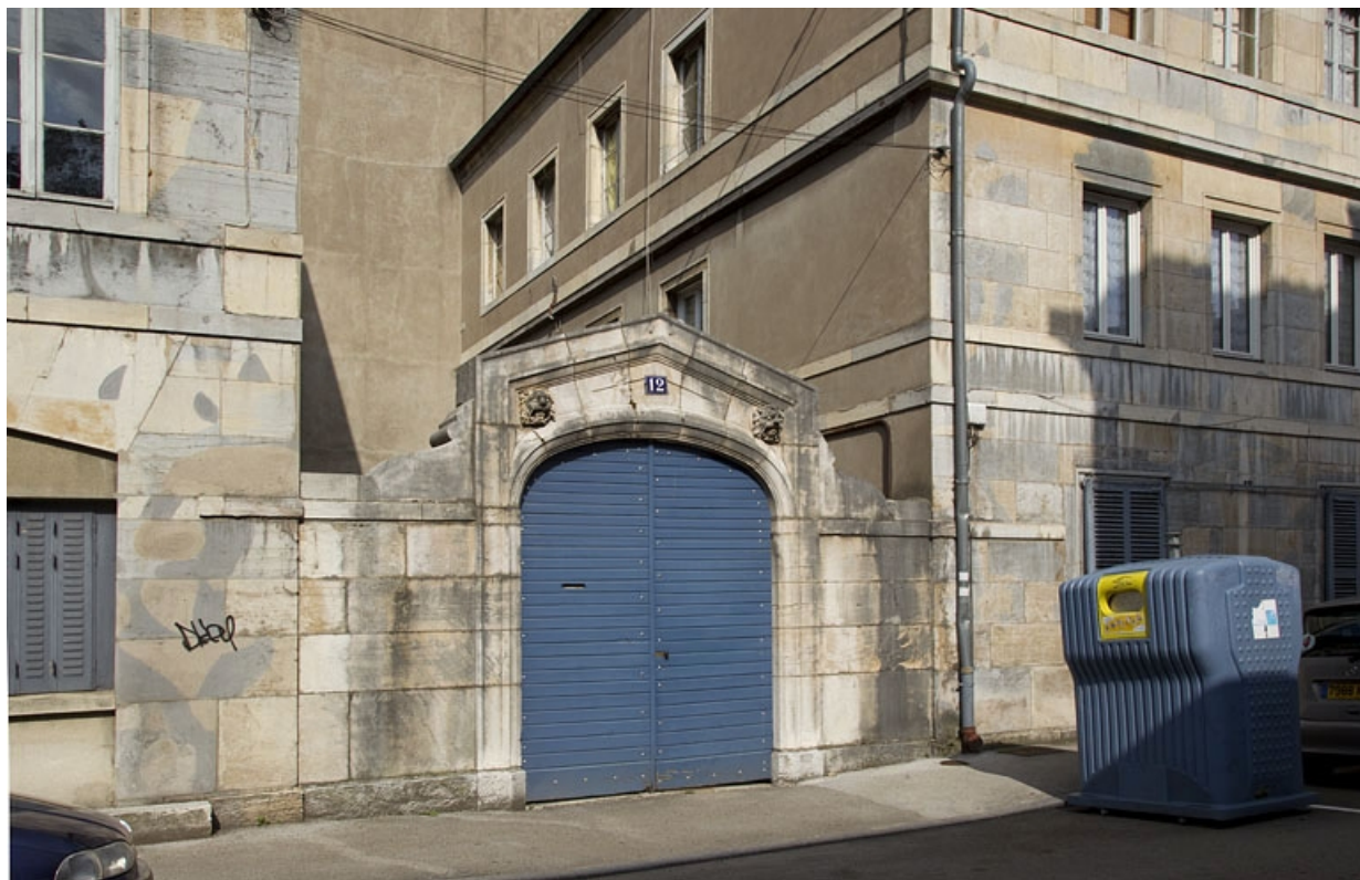
Vue du portail d'entrée et du logis secondaire, depuis la rue : de trois quarts gauche.

25, Besançon, 12 rue Lecourbe, lieudit : îlot Lecourbe