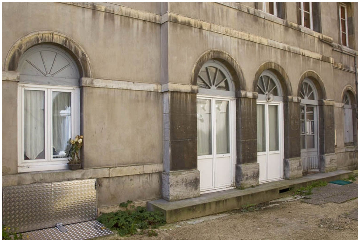
Logis principal, façade antérieure, détail du rez-de-chaussée : de trois quarts gauche.

25, Besançon, 12 rue Lecourbe, lieudit : îlot Lecourbe