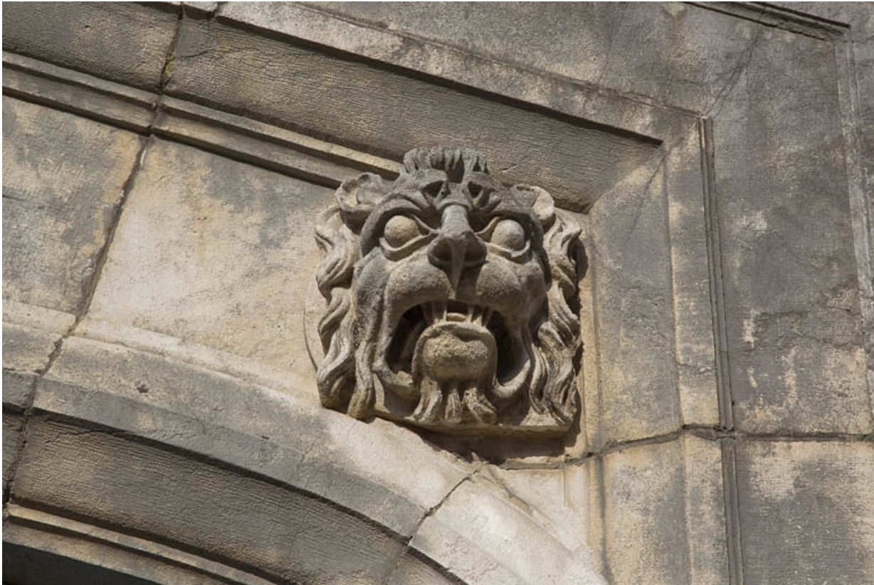
Portail d'entrée, partie supérieure : détail du mufle de lion droit.

25, Besançon, 12 rue Lecourbe, lieudit : îlot Lecourbe