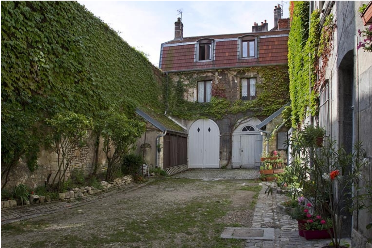
Deuxième logis secondaire : vue d'ensemble depuis l'entrée de la cour.

25, Besançon, 2 rue de la Vieille Monnaie, lieudit : îlot Refuge