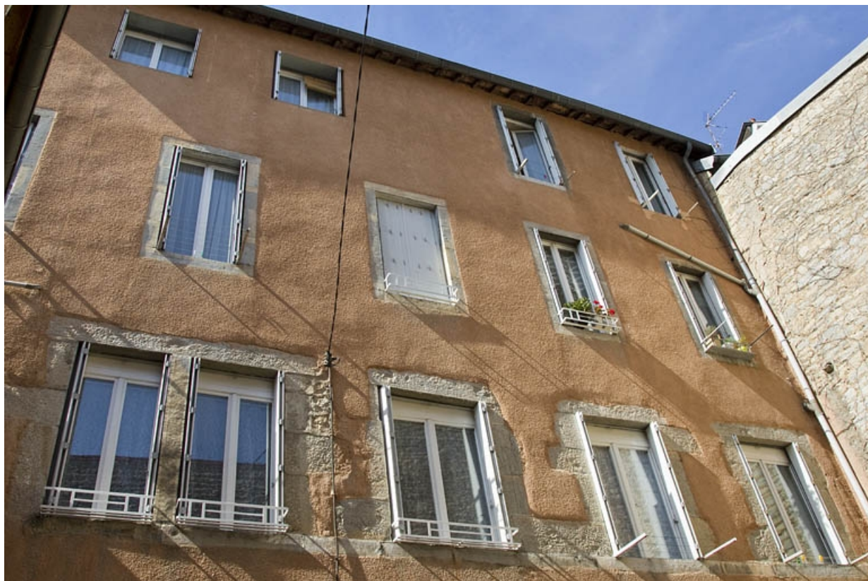
Logis principal : vue d'ensemble de la façade postérieure.

25, Besançon, 3 rue Lecourbe, lieudit : îlot Refuge