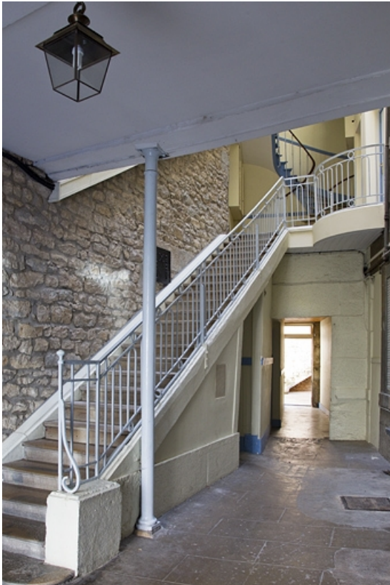
Logis principal : vue d'ensemble de l'escalier.

25, Besançon, 3 rue Lecourbe, lieudit : îlot Refuge