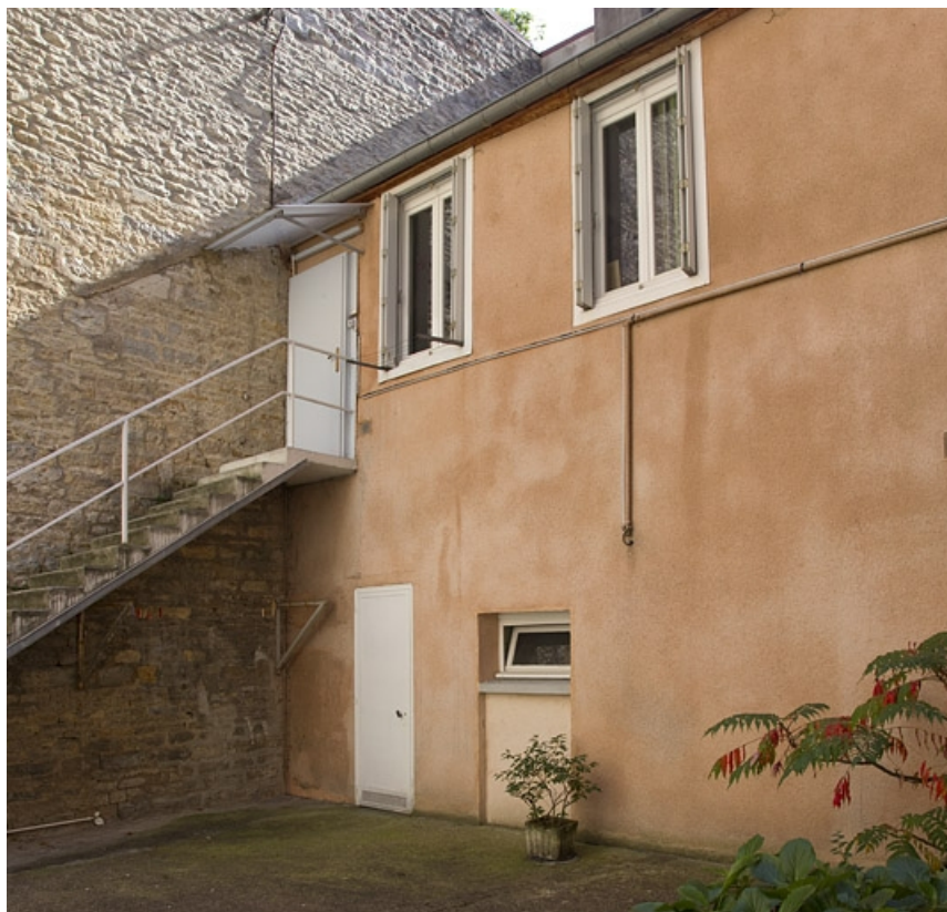
Vue d'ensemble du logis secondaire, de trois quarts droit.

25, Besançon, 3 rue Lecourbe, lieudit : îlot Refuge