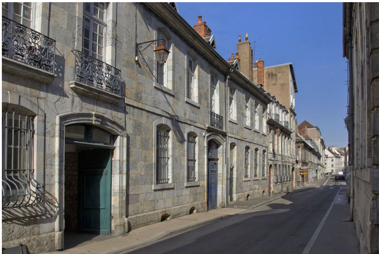
Vue d'ensemble depuis la rue, de trois quarts gauche, vue rapprochée.

25, Besançon, 4 rue de la Vieille Monnaie, lieudit : îlot Refuge