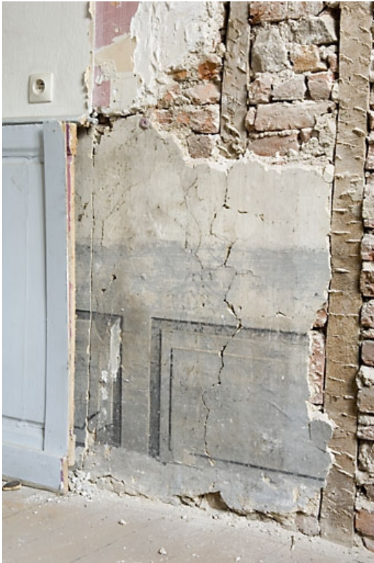
Détail d'une peinture murale sous un lambris d'appui dans une pièce du premier étage : vue rapprochée. 25, Besançon, 4 rue de la Vieille Monnaie, lieudit : îlot Refuge