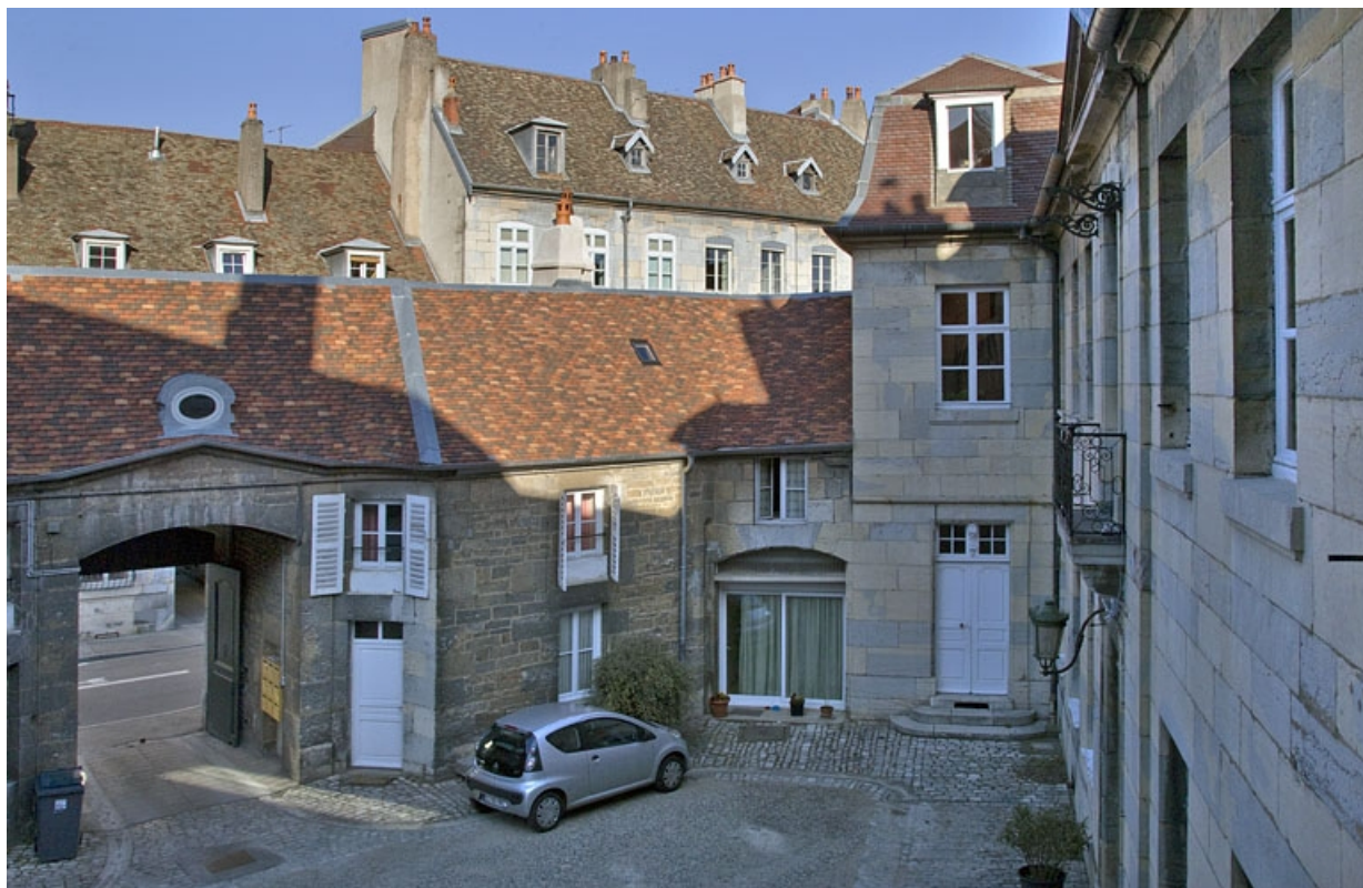
Détail d'une partie de la cour antérieure, en plongée.

25, Besançon, 7 rue Lecourbe, lieudit : îlot Refuge