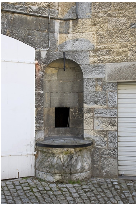
Détail du puits situé dans la cour antérieure.

25, Besançon, 7 rue Lecourbe, lieudit : îlot Refuge