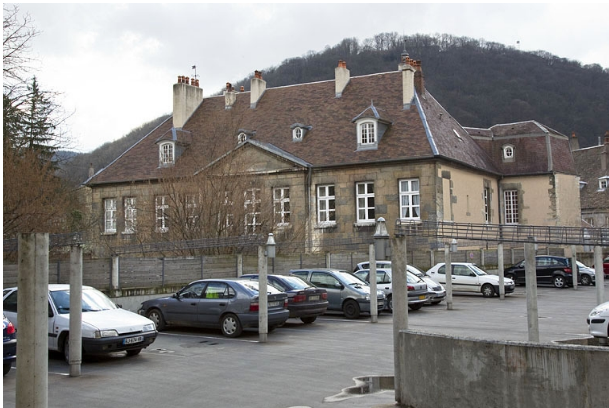
Vue de la façade postérieure depuis l'extérieur, de trois quarts droit.

25, Besançon, 7 rue Lecourbe, lieudit : îlot Refuge