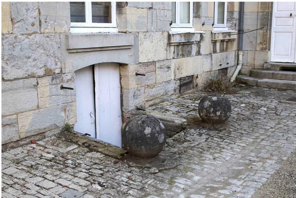
Cour : détail de l'entrée de cave.

25, Besançon, 7 rue Lecourbe, lieudit : îlot Refuge