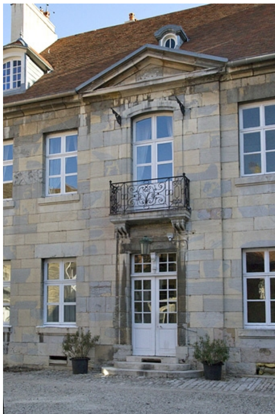
Façade antérieure : détail de la partie centrale. 25, Besançon, 7 rue Lecourbe, lieudit : îlot Refuge