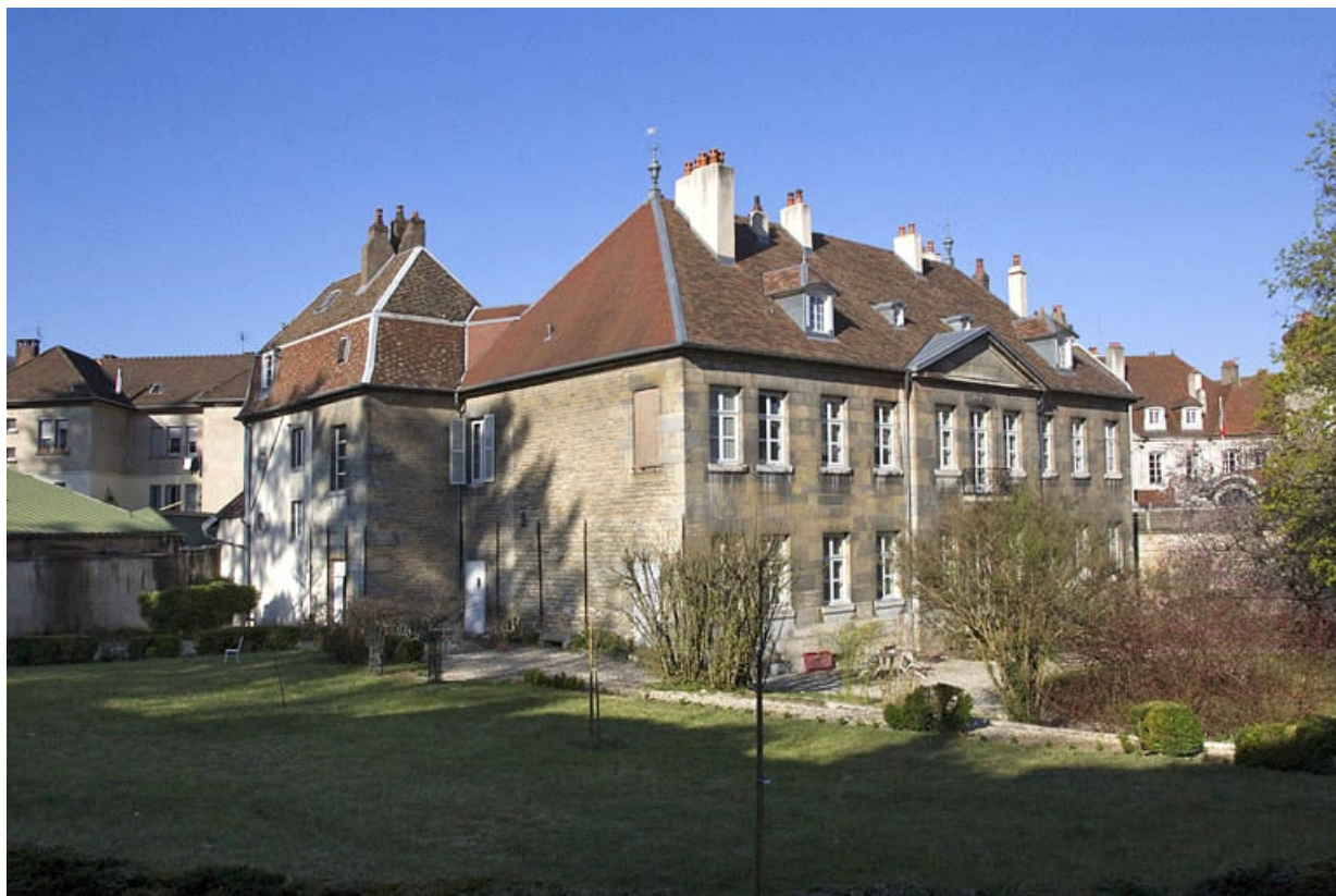
Vue d'ensemble de la façade postérieure, depuis le fond du jardin : de trois quarts gauche.

25, Besançon, 7 rue Lecourbe, lieudit : îlot Refuge