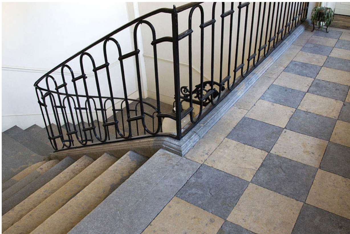
Intérieur, escalier d'honneur : vue de rampe en fer forgé et du dallage du palier.

25, Besançon, 7 rue Lecourbe, lieudit : îlot Refuge