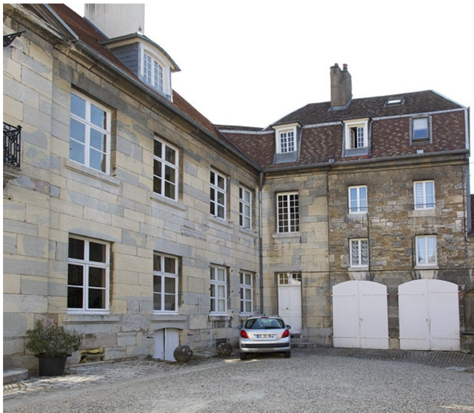
Aile droite sur cour, de trois quarts droit.

25, Besançon, 7 rue Lecourbe, lieudit : îlot Refuge