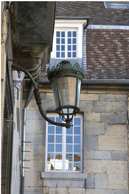
Façade antérieure : détail du bec de gaz.

25, Besançon, 7 rue Lecourbe, lieudit : îlot Refuge