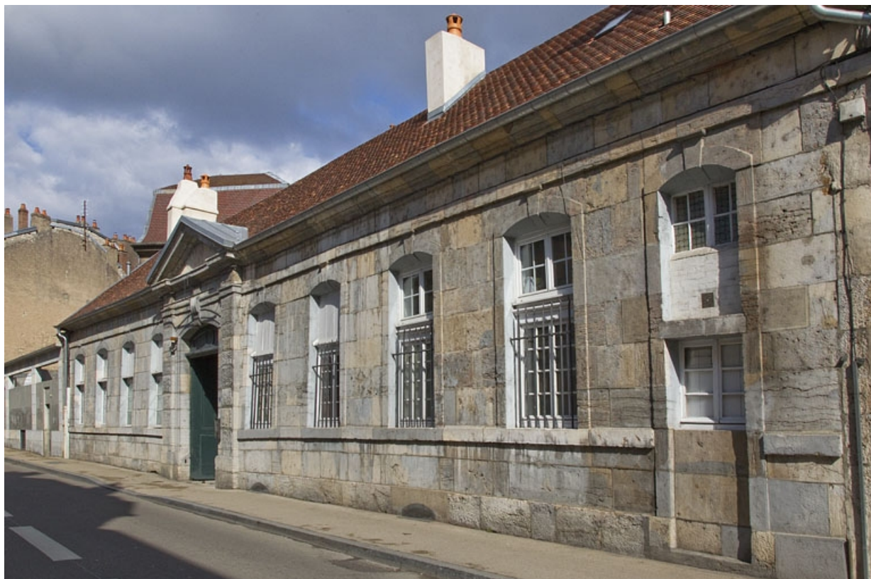
Vue d'ensemble de la clôture sur rue : de trois quarts droit.

25, Besançon, 7 rue Lecourbe, lieudit : îlot Refuge