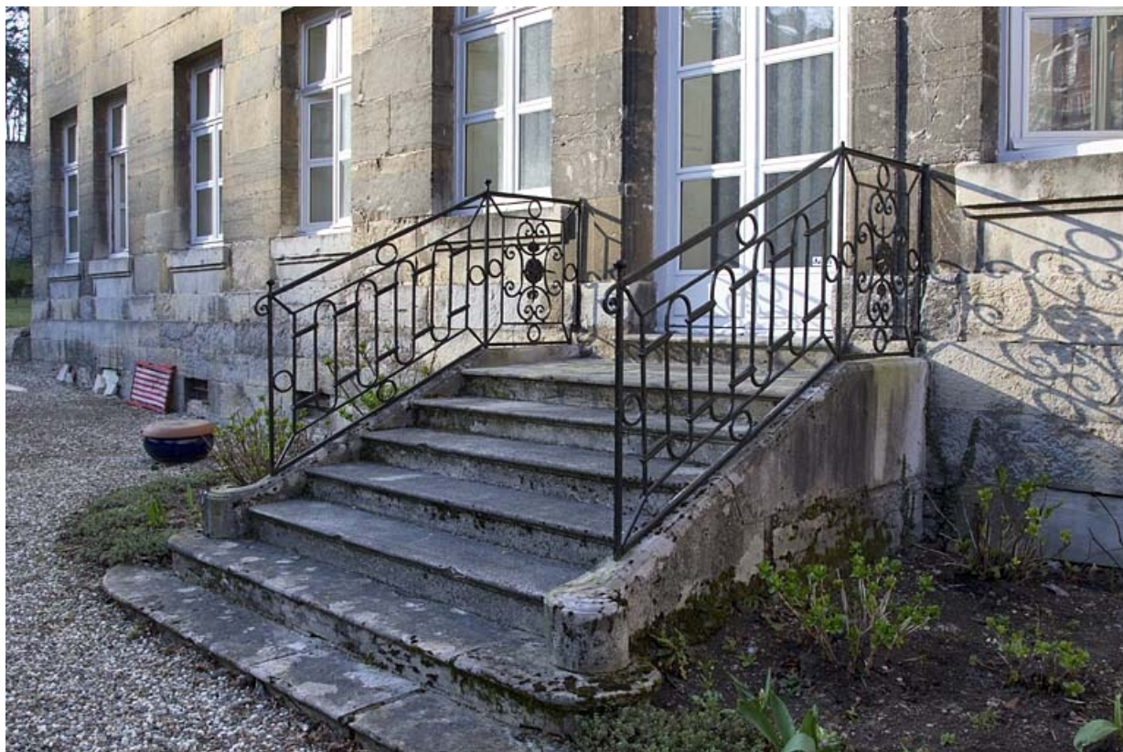
Détail du perron au centre de la façade postérieure.

25, Besançon, 7 rue Lecourbe, lieudit : îlot Refuge