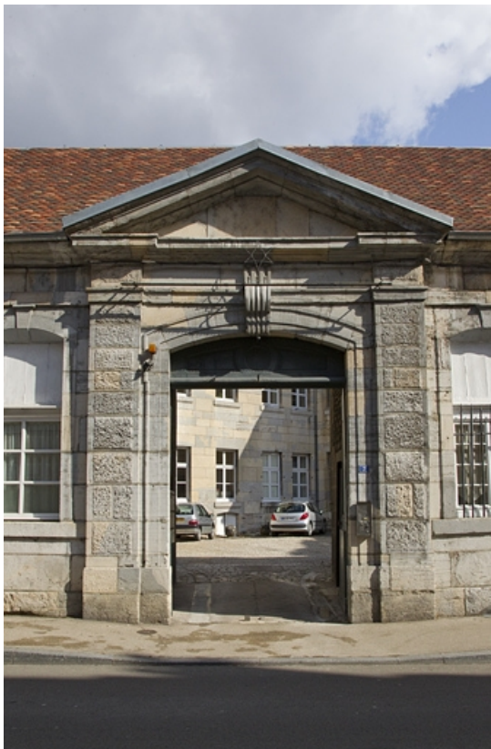
Vue du portail dans clôture : de face.

25, Besançon, 7 rue Lecourbe, lieudit : îlot Refuge