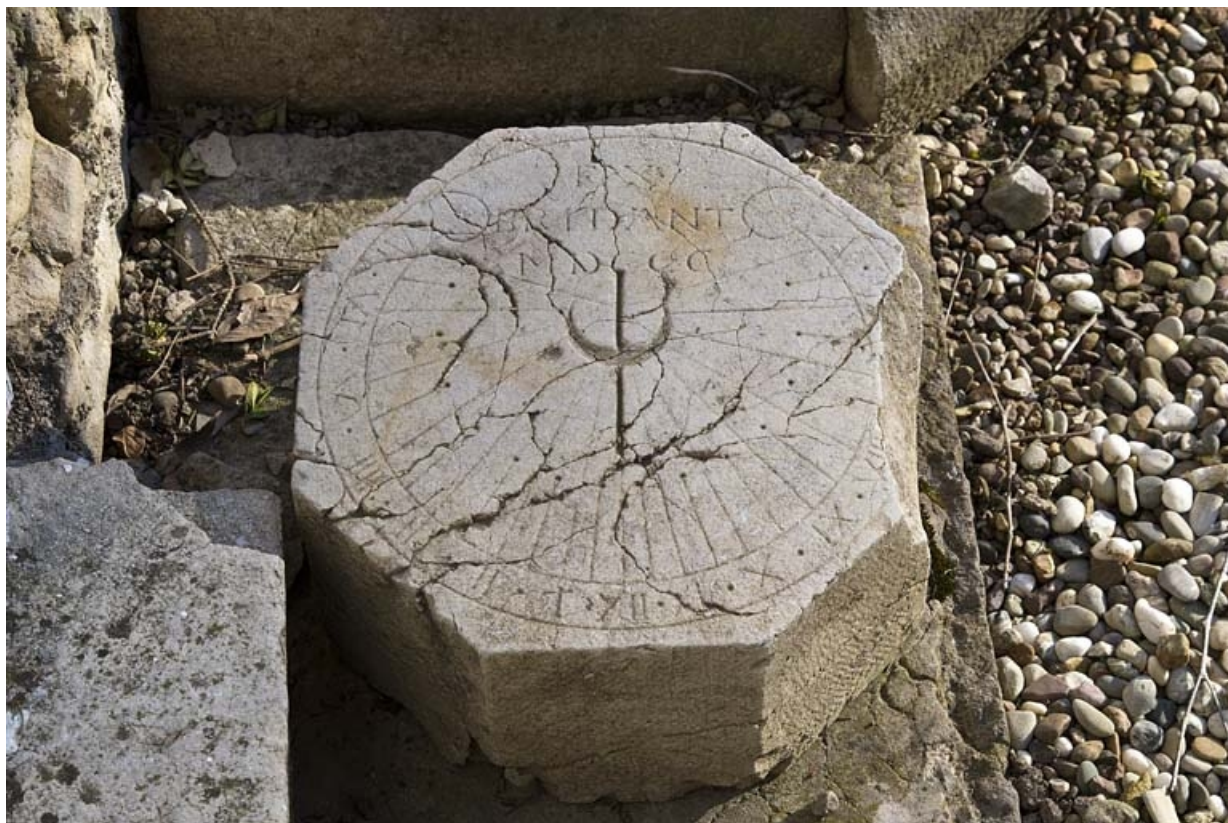
Détail d'un cadran solaire entreposé dans le jardin.

25, Besançon, 7 rue Lecourbe, lieu-dit : îlot Refuge