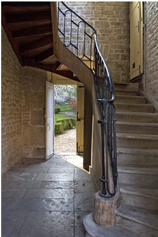
Intérieur : détail du départ de l'escalier secondaire situé dans l'aile droite.

25, Besançon, 7 rue Lecourbe, lieudit : îlot Refuge