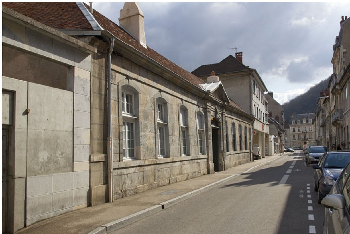
Vue d'ensemble de la clôture sur rue, de trois quarts gauche.

25, Besançon, 7 rue Lecourbe, lieudit : îlot Refuge