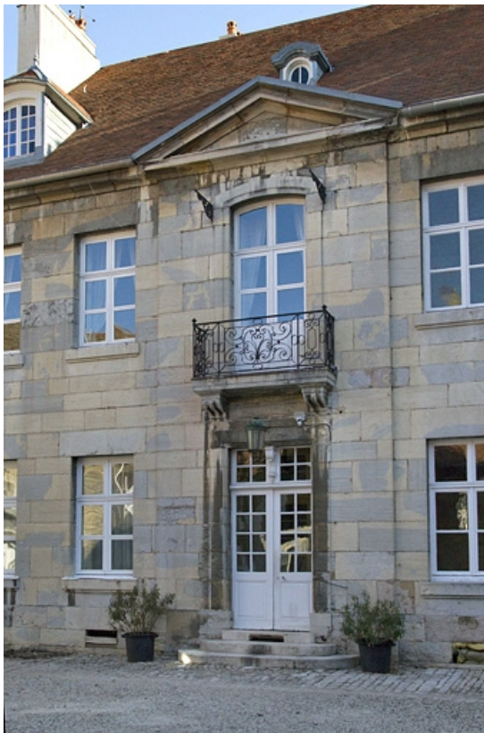
Façade antérieure : détail de la partie centrale. 25, Besançon, 7 rue Lecourbe, lieudit : îlot Refuge