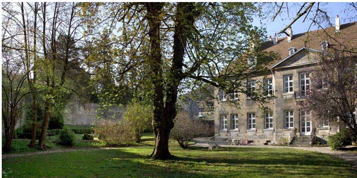
Vue de la partie gauche de la façade postérieure depuis le fond du jardin.

25, Besançon, 7 rue Lecourbe, lieudit : îlot Refuge