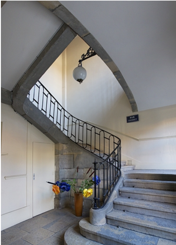
Intérieur : vue d'ensemble de l'escalier depuis le vestibule.

25, Besançon, 7 rue Lecourbe, lieudit : îlot Refuge