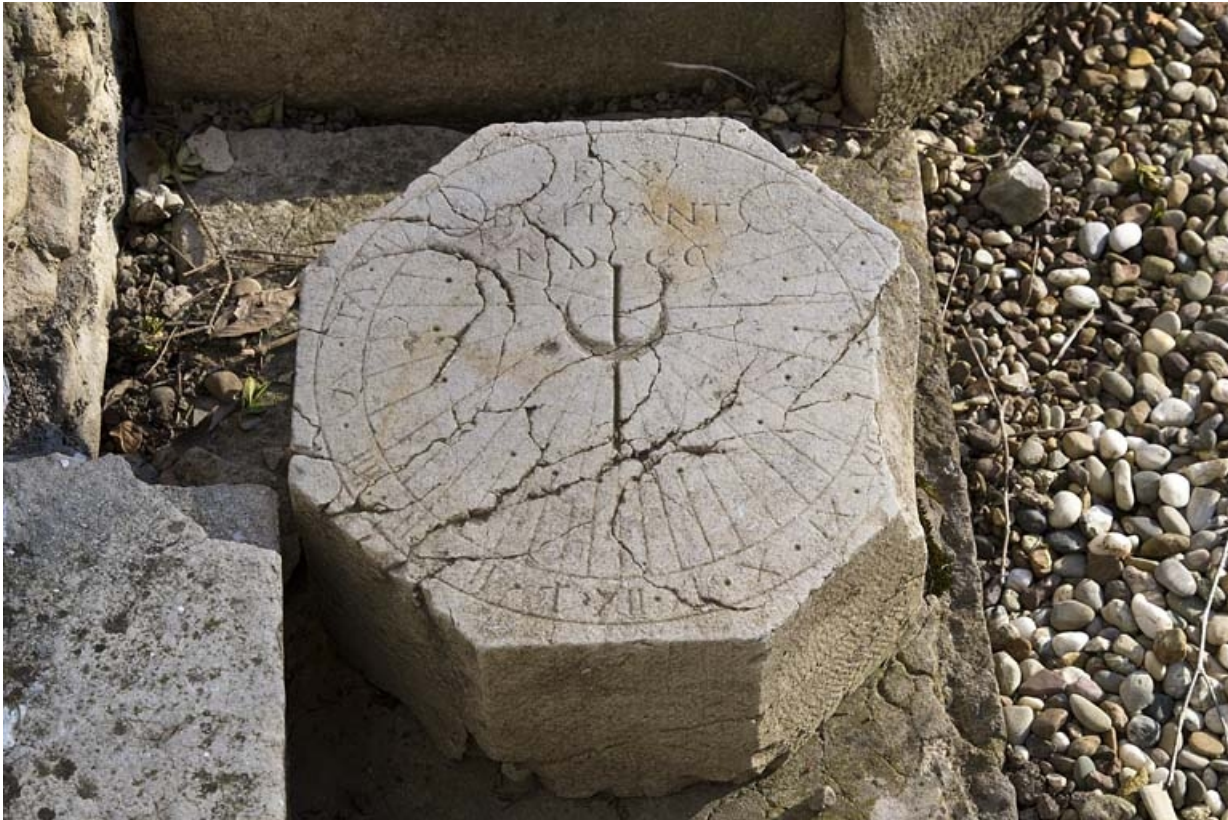
Détail d'un cadran solaire entreposé dans le jardin.

25, Besançon, 7 rue Lecourbe, lieudit : îlot Refuge