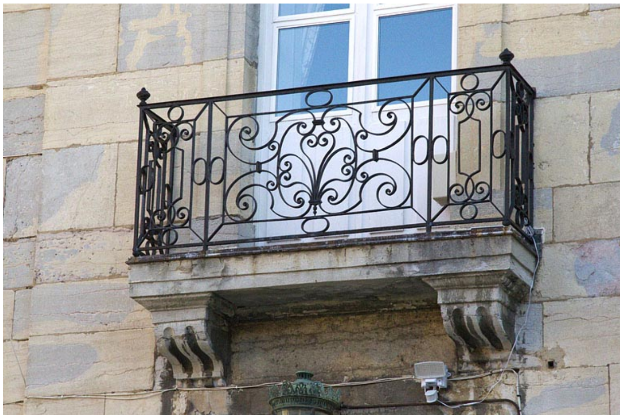
Façade antérieure, partie centrale : détail du balcon.

25, Besançon, 7 rue Lecourbe, lieudit : îlot Refuge