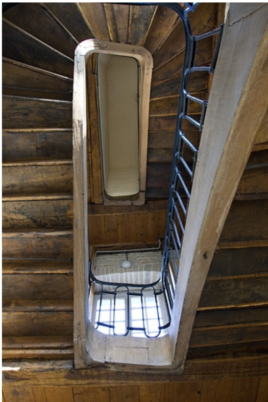
Intérieur : vue de l'escalier secondaire situé dans l'aile droite : en contre plongée.

25, Besançon, 7 rue Lecourbe, lieudit : îlot Refuge