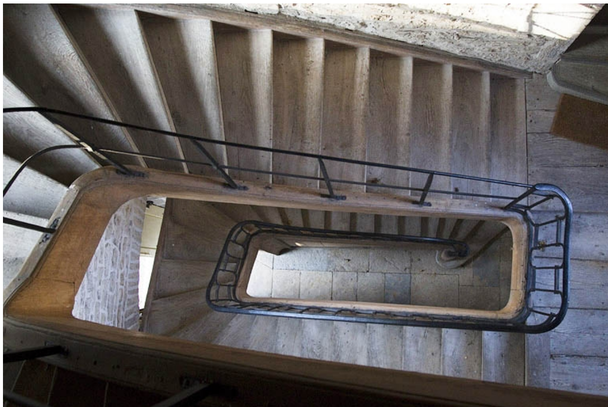
Intérieur : vue de l'escalier secondaire situé dans l'aile droite : en plongée.

25, Besançon, 7 rue Lecourbe, lieudit : îlot Refuge