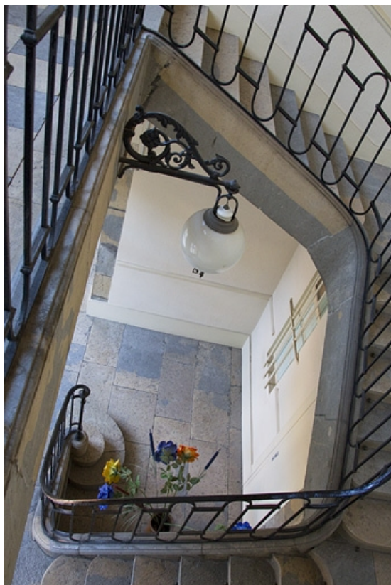
Intérieur, escalier d'honneur : vue en plongée. 25, Besançon, 7 rue Lecourbe, lieudit : îlot Refuge