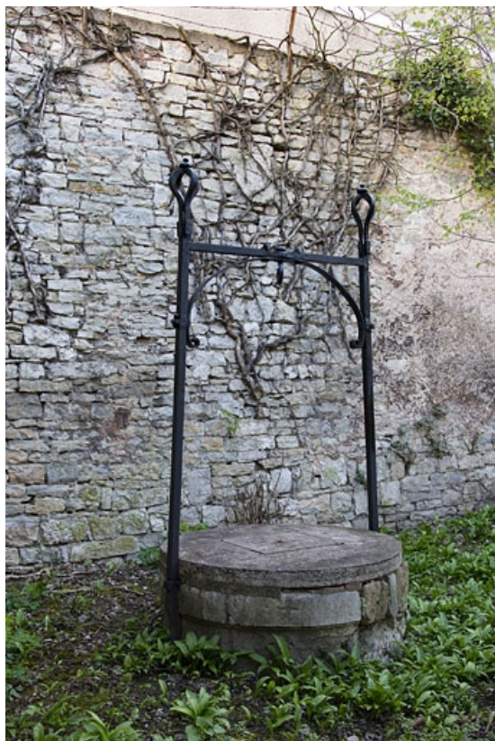
Détail du puits situé au fond du jardin.

25, Besançon, 7 rue Lecourbe, lieudit : îlot Refuge