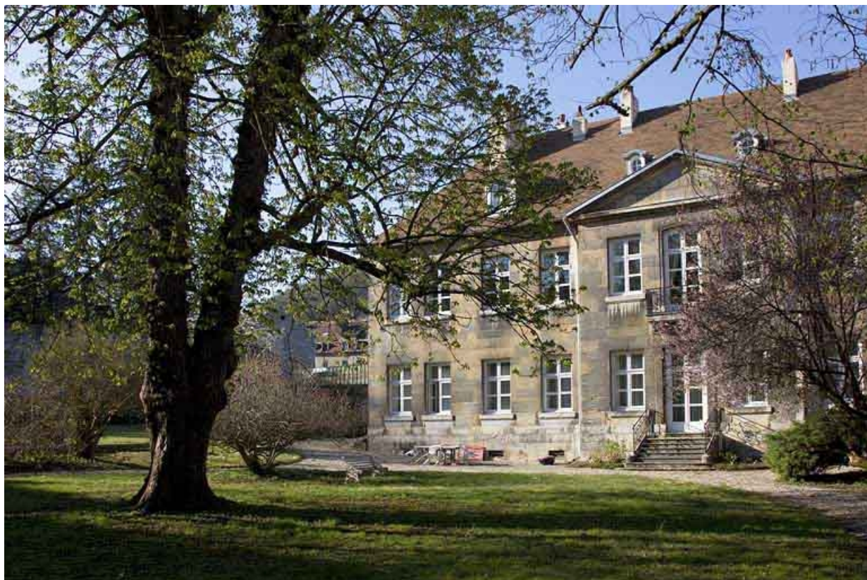
Vue de la partie gauche de la façade postérieure, depuis le fond du jardin : de trois quarts droit.

25, Besançon, 7 rue Lecourbe, lieudit : îlot Refuge