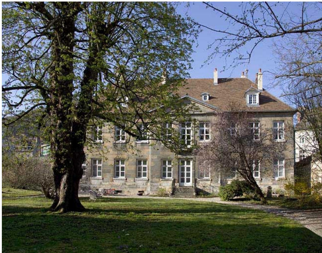
Vue d'ensemble de la façade postérieure depuis le fond du jardin.

25, Besançon, 7 rue Lecourbe, lieudit : îlot Refuge