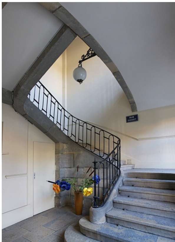
Intérieur : vue d'ensemble de l'escalier depuis le vestibule.

25, Besançon, 7 rue Lecourbe, lieudit : îlot Refuge