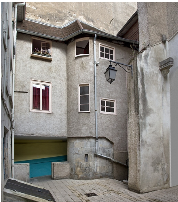
Vue d'ensemble de l'escalier à cage ouverte depuis le fond de la cour, de trois quarts gauche. 25, Besançon, 14 rue de la Vieille Monnaie, lieudit : îlot Refuge