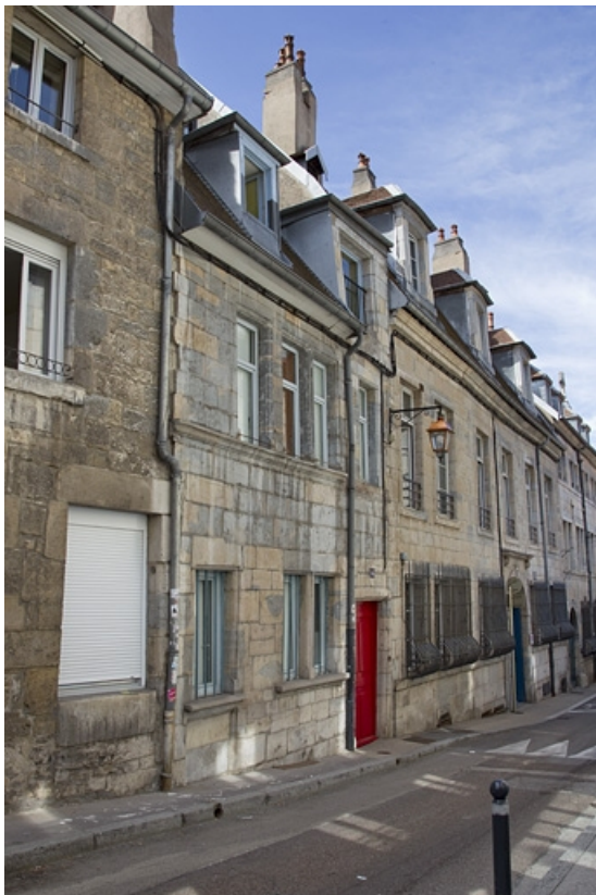
Vue d'ensemble depuis la rue, de trois quarts gauche.

25, Besançon, 14 rue de la Vieille Monnaie, lieudit : îlot Refuge