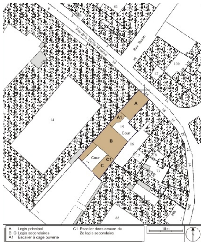
Plan masse et de situation. Extrait du plan cadastral, 1974, section AP. 25, Besançon, 14 rue de la Vieille Monnaie, lieudit : îlot Refuge