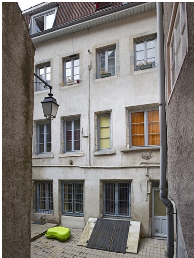
Premier logis secondaire : vue d'ensemble de la façade antérieure.

25, Besançon, 14 rue de la Vieille Monnaie, lieudit : îlot Refuge