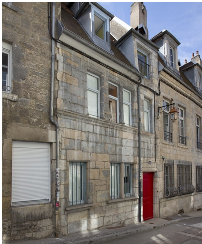
Vue d'ensemble depuis la rue, de trois quarts gauche, vue rapprochée.

25, Besançon, 14 rue de la Vieille Monnaie, lieudit : îlot Refuge