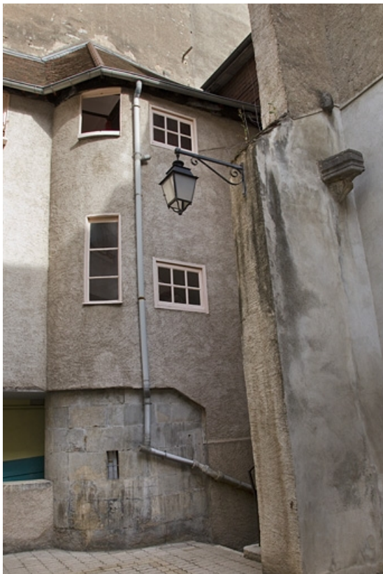
Escalier à cage ouverte : détail de la partie droite depuis la cour.

25, Besançon, 14 rue de la Vieille Monnaie, lieudit : îlot Refuge