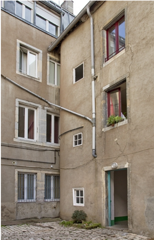
Deuxième logis secondaire : vue d'ensemble, de trois quarts droit.

25, Besançon, 14 rue de la Vieille Monnaie, lieudit : îlot Refuge