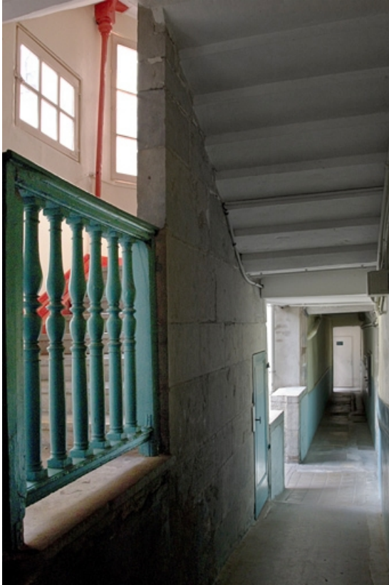
Logis principal, couloir : détail du passage sous l'escalier à cage ouverte.

25, Besançon, 14 rue de la Vieille Monnaie, lieudit : îlot Refuge