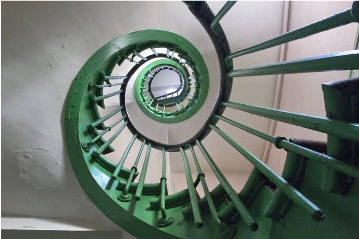
Deuxième logis secondaire : détail de l'escalier, en contre-plongée.

25, Besançon, 14 rue de la Vieille Monnaie, lieudit : îlot Refuge