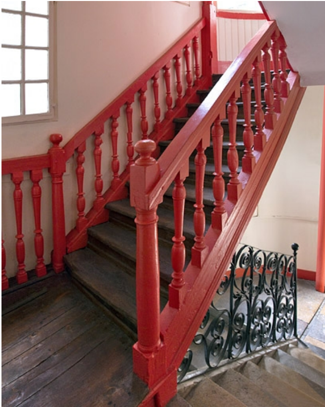
Escalier à cage ouverte : détail de la rampe en ferronnerie, puis à balustres de bois tourné.

25, Besançon, 14 rue de la Vieille Monnaie, lieudit : îlot Refuge