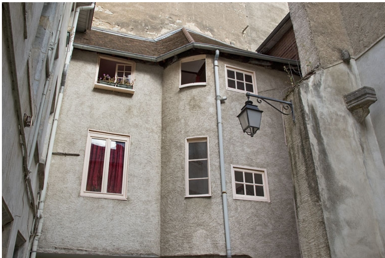
Escalier à cage ouverte : détail de la partie supérieure depuis la cour.

25, Besançon, 14 rue de la Vieille Monnaie, lieudit : îlot Refuge