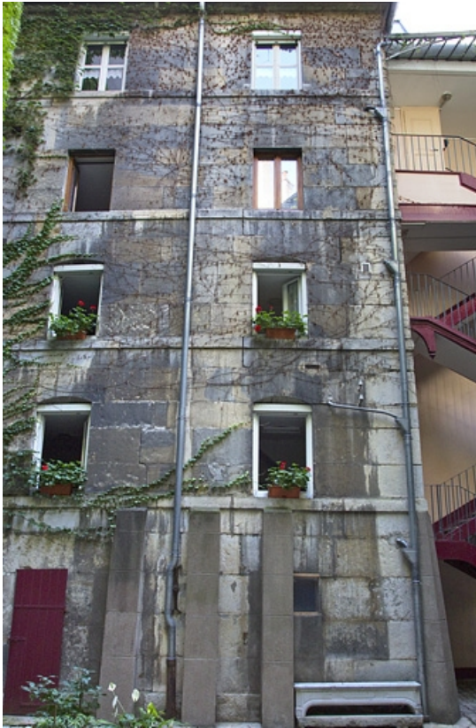
Vue d'ensemble du logis secondaire, de face.

25, Besançon, 1 rue Lecourbe, lieudit : îlot Refuge