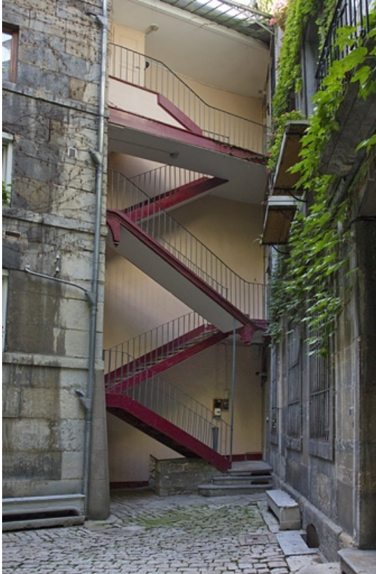
Vue d'ensemble de l'escalier à cage ouverte sur cour, de face.

25, Besançon, 1 rue Lecourbe, lieudit : îlot Refuge