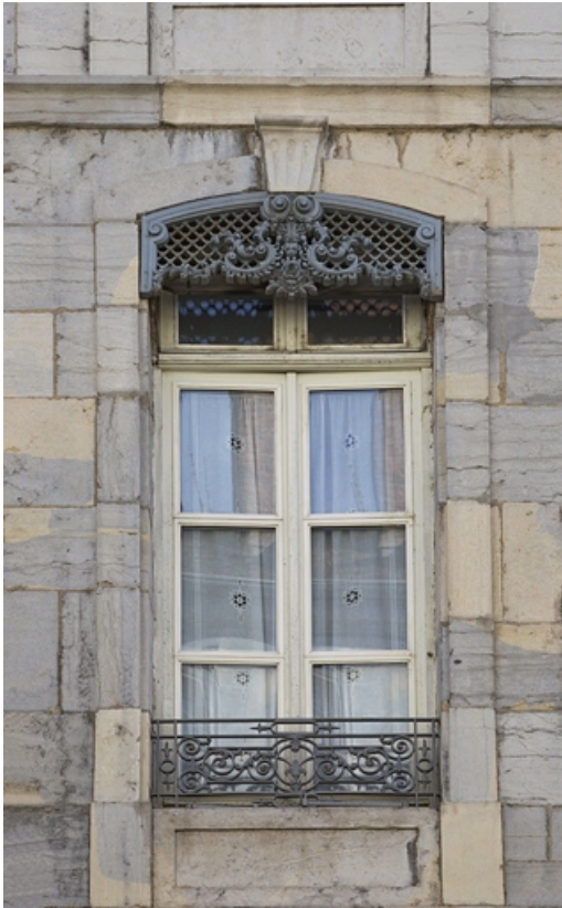
Logis principal, façade antérieure : détail d'une fenêtre du premier étage.

25, Besançon, 1 rue Lecourbe, lieudit : îlot Refuge