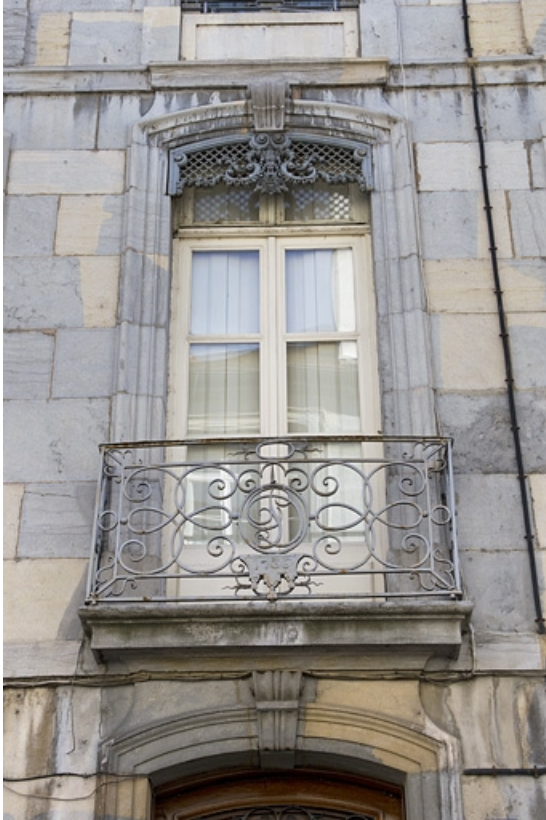
Logis principal, façade antérieure, premier étage : détail de la porte fenêtre.

25, Besançon, 1 rue Lecourbe, lieudit : îlot Refuge