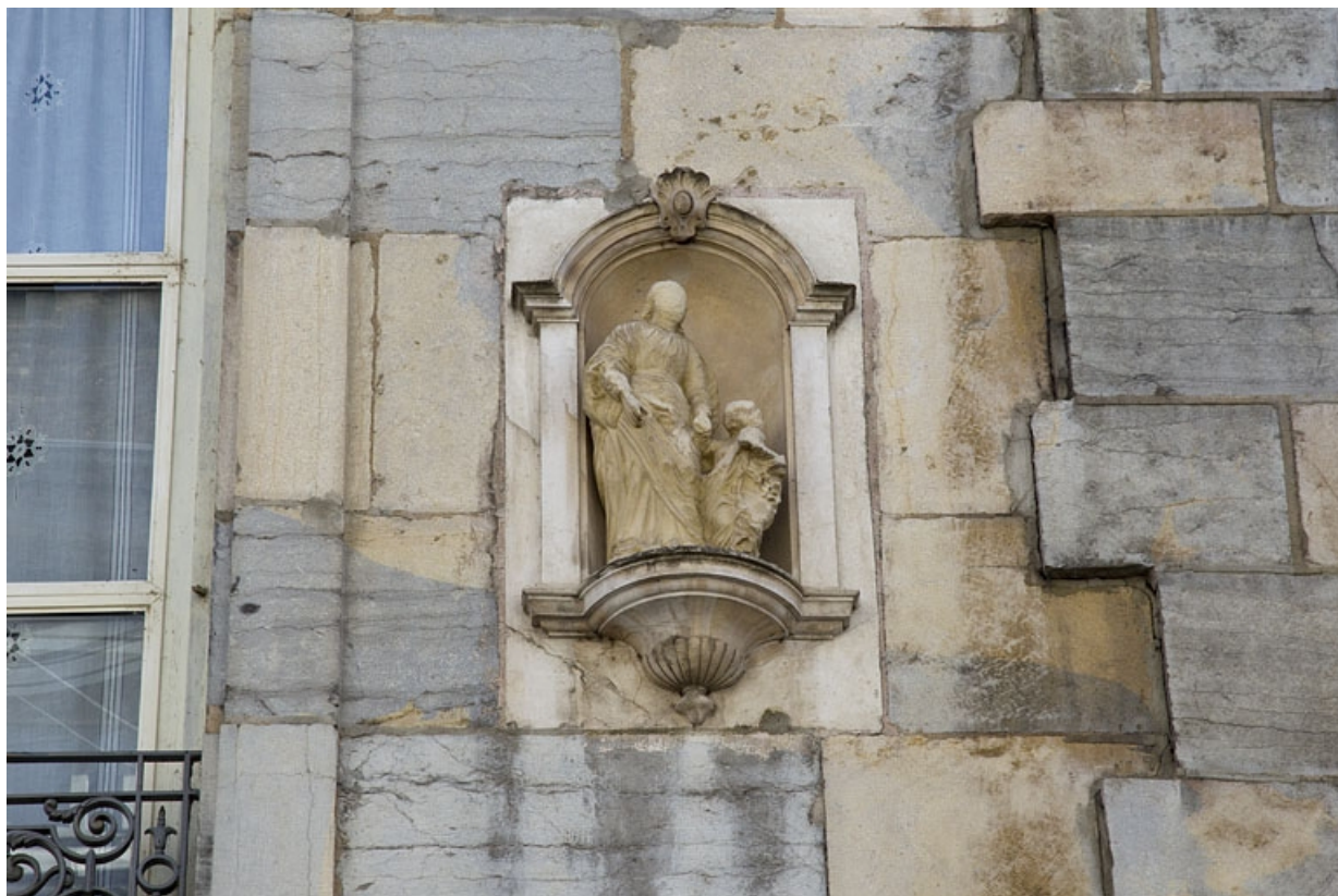
Logis principal, façade antérieure : détail d'une niche avec une sculpture représentant sainte Anne et la Vierge. 25, Besançon, 1 rue Lecourbe, lieudit : îlot Refuge