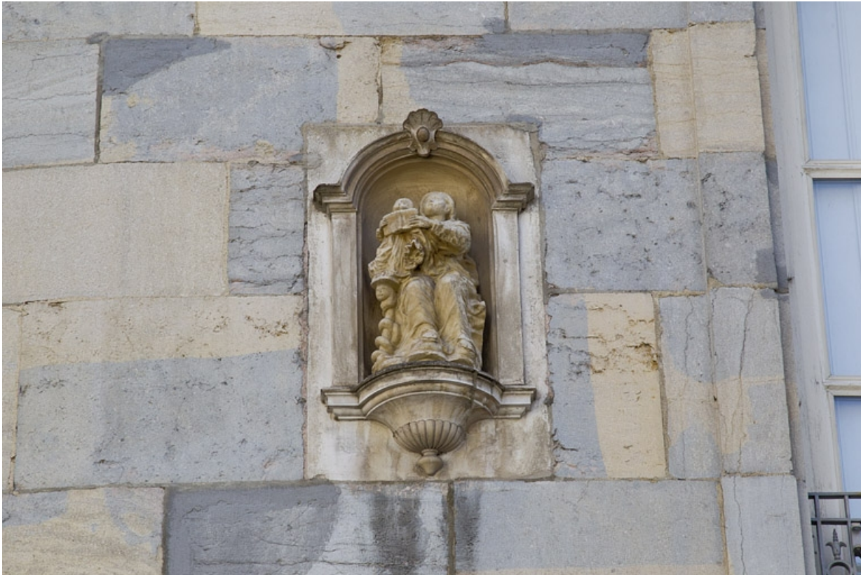
Logis principal, façade antérieure : niche avec une sculpture représentant l'Education de la Vierge.

25, Besançon, 1 rue Lecourbe, lieudit : îlot Refuge