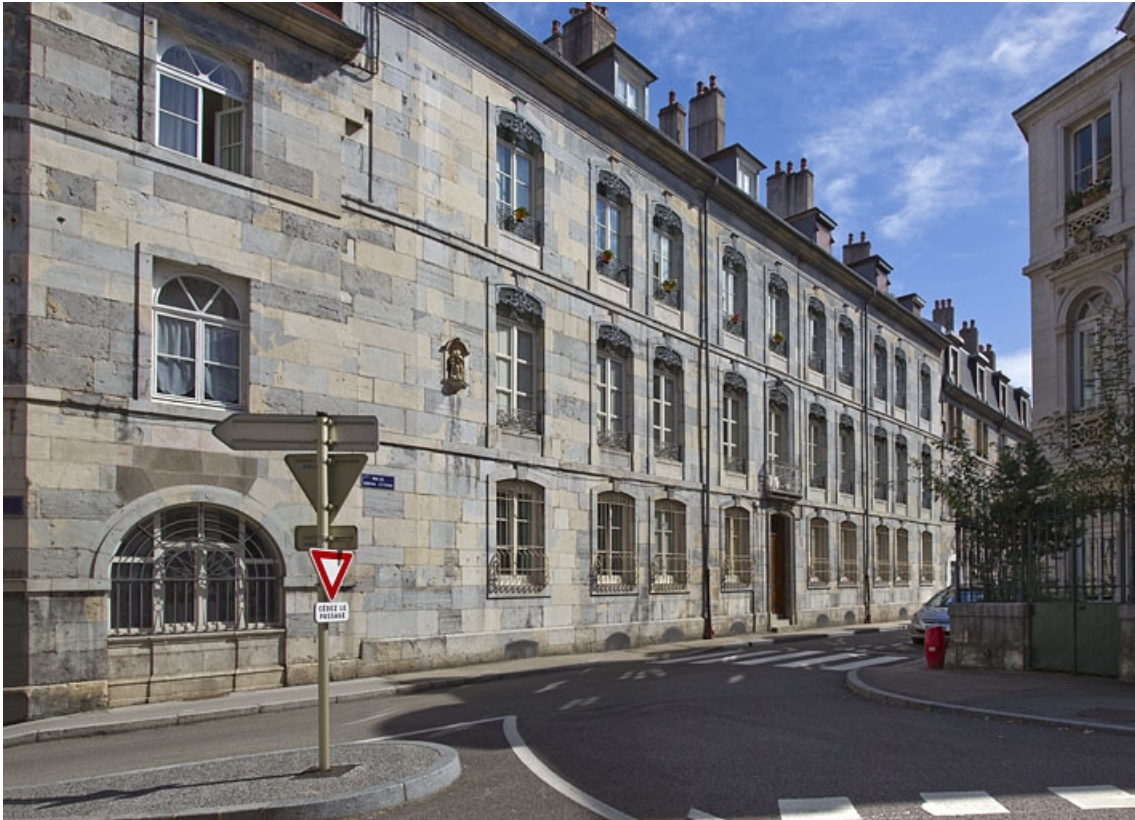
Vue d'ensemble depuis la rue, de trois quarts gauche.

25, Besançon, 1 rue Lecourbe, lieudit : îlot Refuge