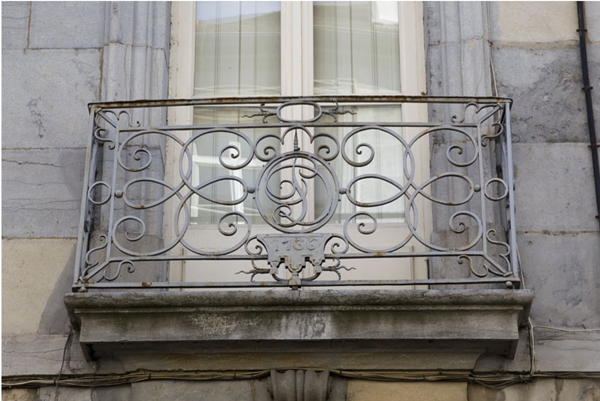
Logis principal, façade antérieure, premier étage : détail du balcon en ferronnerie.

25, Besançon, 1 rue Lecourbe, lieudit : îlot Refuge