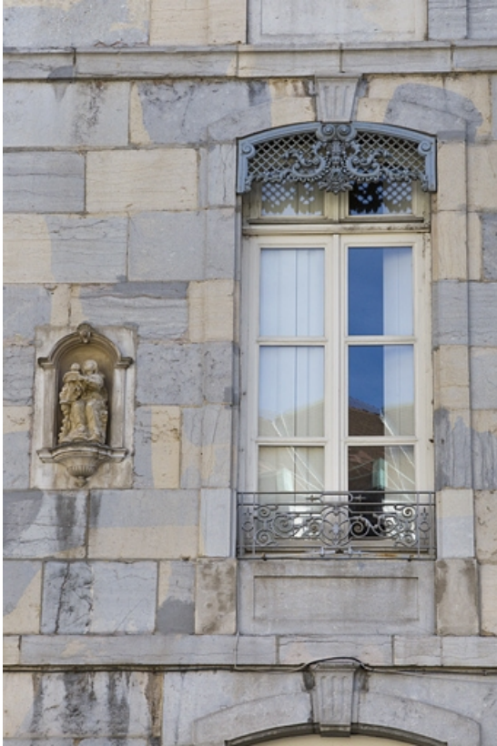
Logis principal, façade antérieure : détail d'une fenêtre et de la niche gauche. 25, Besançon, 1 rue Lecourbe, lieudit : îlot Refuge