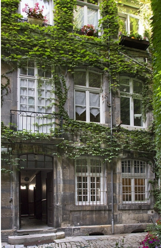
Logis principal, façade postérieure : de face. 25, Besançon, 1 rue Lecourbe, lieudit : îlot Refuge