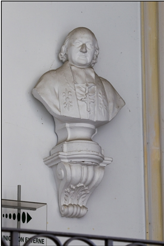
Décor de la cage d'escalier : buste d'un archevêque non identifié.

25, Besançon, 10 rue de la Convention, lieudit : îlot Saint Jean