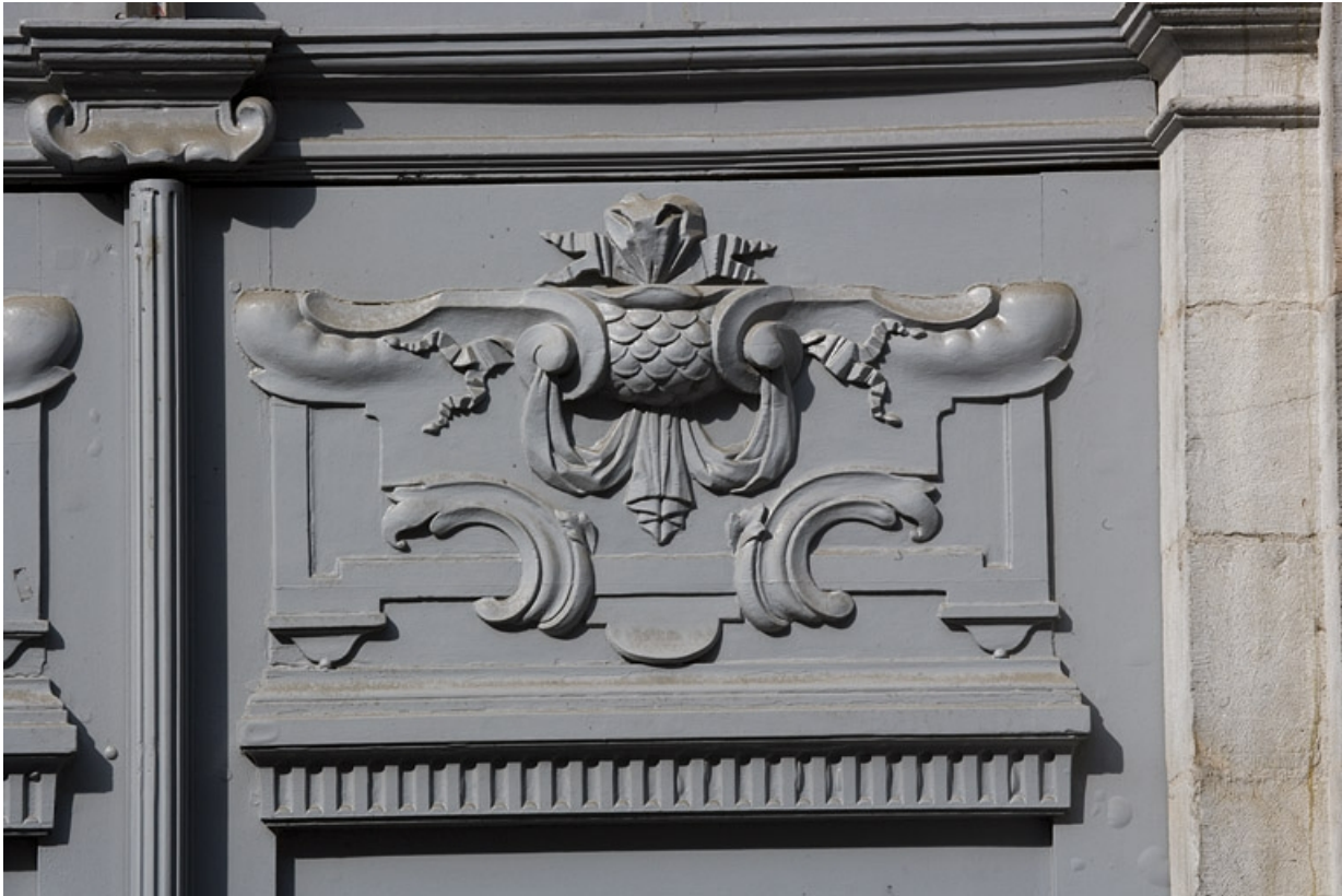
Détail d'une sculpture en bas-relief d'un vantail du portail d'entrée.

25, Besançon, 10 rue de la Convention, lieudit : îlot Saint Jean