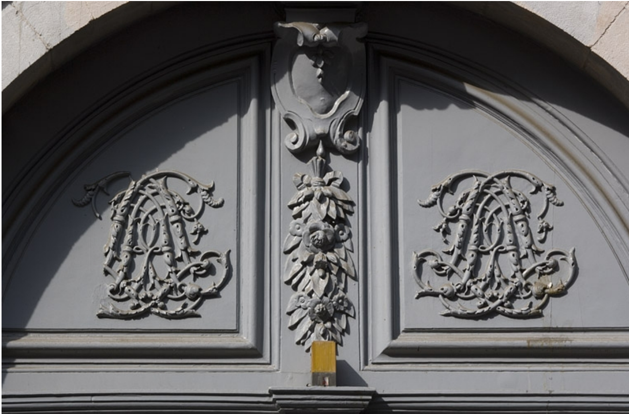
Détail du tympan en menuiserie du portail d'entrée.

25, Besançon, 10 rue de la Convention, lieudit : îlot Saint Jean