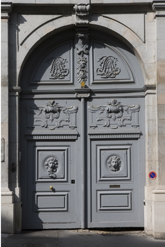
Portail d'entrée : vue d'ensemble.

25, Besançon, 10 rue de la Convention, lieudit : îlot Saint Jean