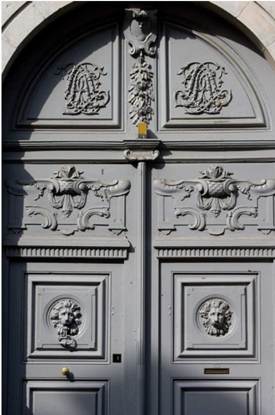
Vue d'ensemble des vantaux du portail d'entrée.

25, Besançon, 10 rue de la Convention, lieudit : îlot Saint Jean