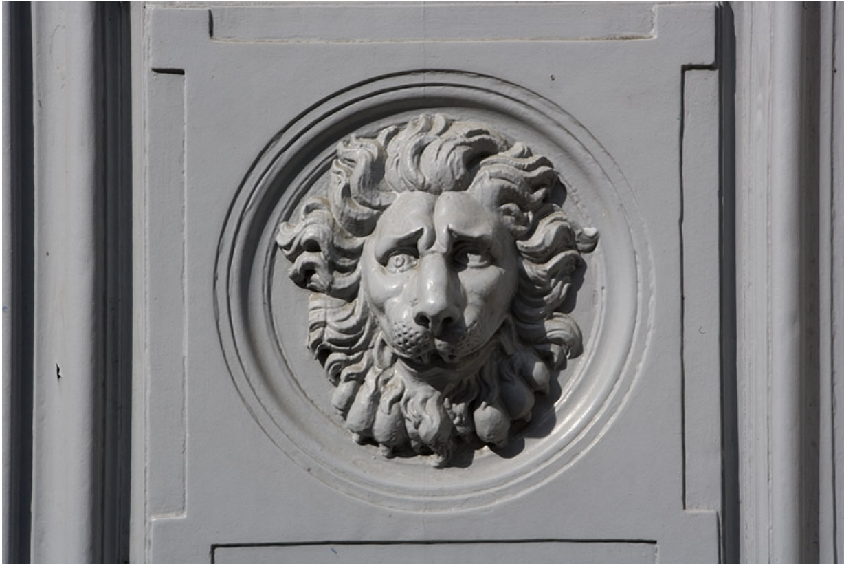
Détail d'une tête de lion sur un vantail du portail d'entrée.

25, Besançon, 10 rue de la Convention, lieudit : îlot Saint Jean