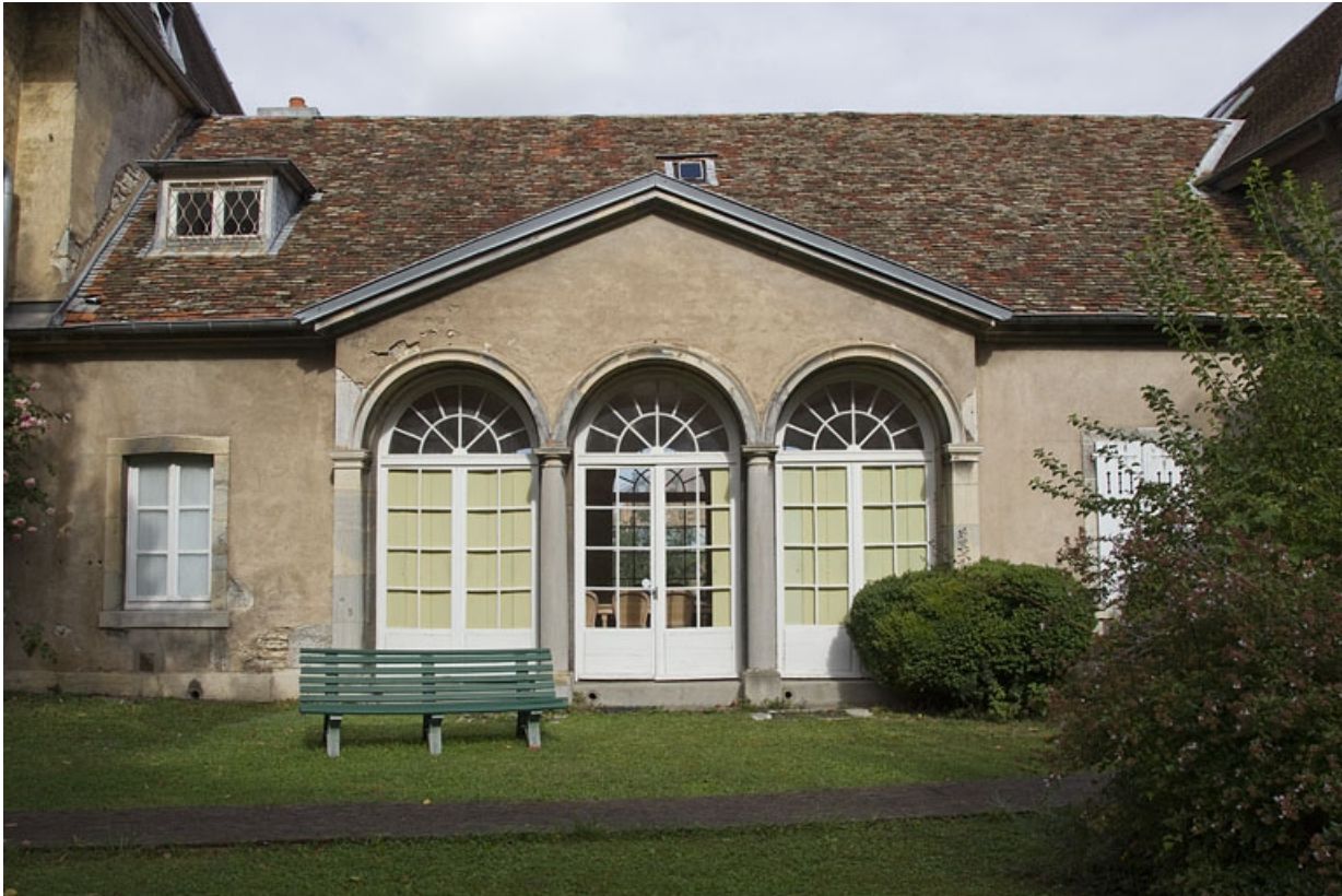
Orangerie : vue d'ensemble de la façade postérieure.

25, Besançon, 10 rue de la Convention, lieudit : îlot Saint Jean