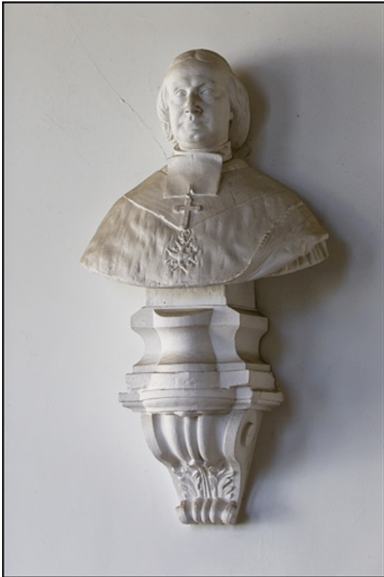
Décor de la cage d'escalier : buste d'un archevêque non identifié.

25, Besançon, 10 rue de la Convention, lieudit : îlot Saint Jean