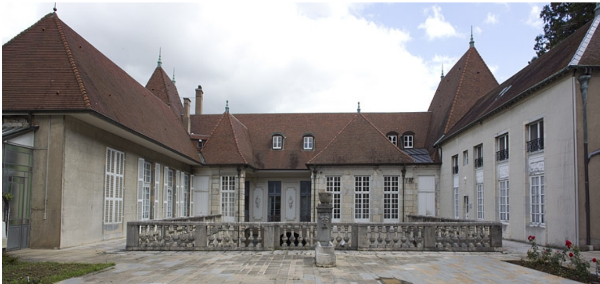
Vue du logis depuis la terrasse, de face.

25, Besançon, 10 rue de la Convention, lieudit : îlot Saint Jean