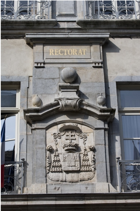
Vue d'ensemble des armoiries du cardinal Louis-François de Rohan-Chabot, situées au dessus du portail d'entrée. 25, Besançon, 10 rue de la Convention, lieudit : îlot Saint Jean