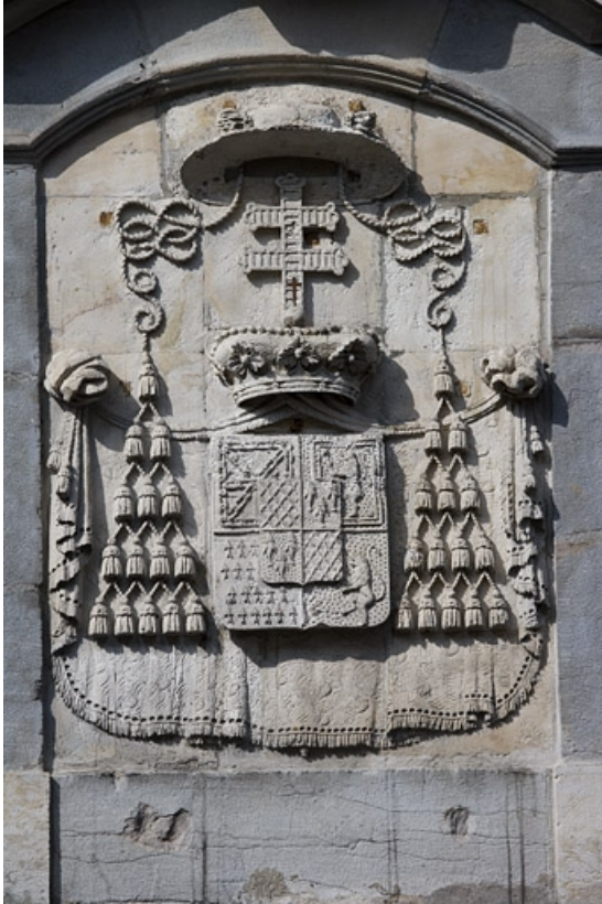
Détail des armoiries du cardinal Louis-François de Rohan-Chabot.

25, Besançon, 10 rue de la Convention, lieudit : îlot Saint Jean