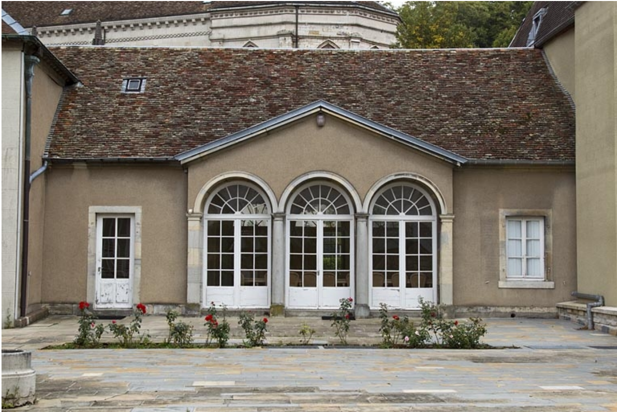
Orangerie : vue d'ensemble de la façade antérieure.

25, Besançon, 10 rue de la Convention, lieudit : îlot Saint Jean