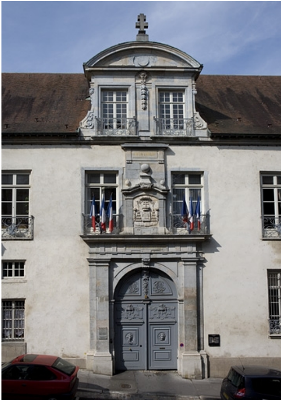
Vue d'ensemble de la travée centrale de la façade sur rue.

25, Besançon, 10 rue de la Convention, lieudit : îlot Saint Jean