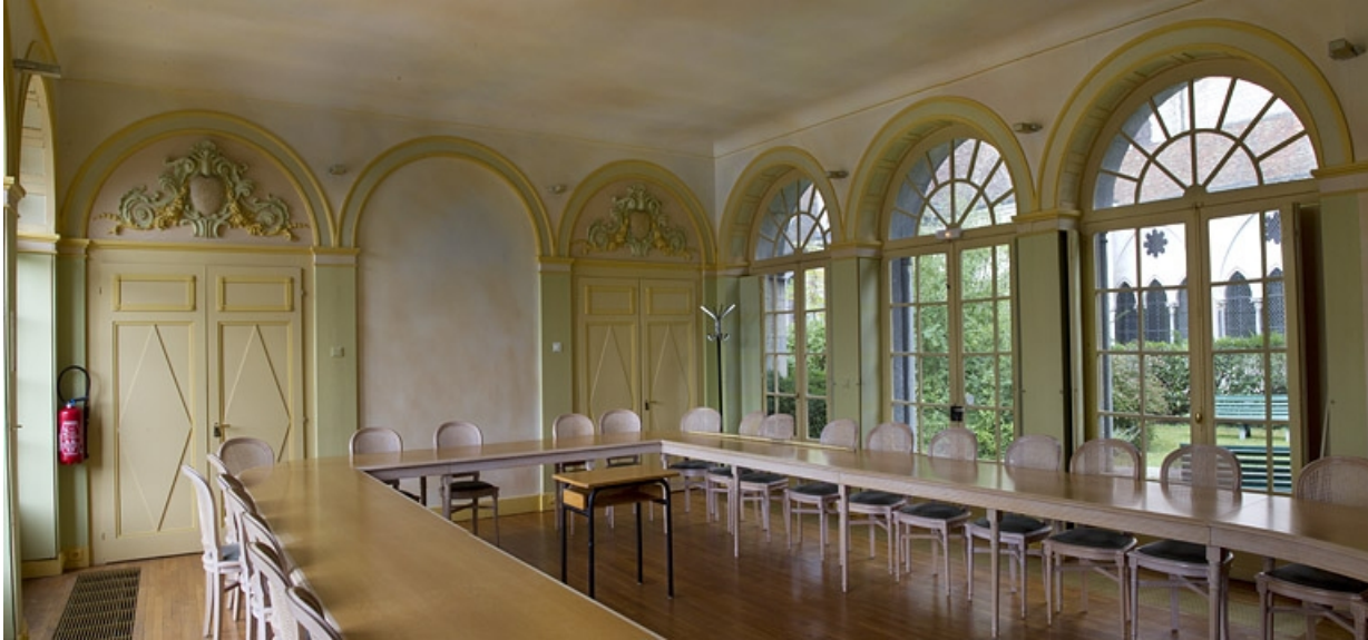
Orangerie, intérieur : vue de la pièce de trois quarts gauche.

25, Besançon, 10 rue de la Convention, lieudit : îlot Saint Jean