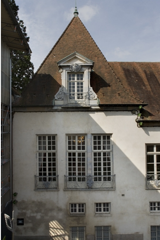
Détail de la partie supérieure de l'avant-corps gauche, vue rapprochée.

25, Besançon, 10 rue de la Convention, lieudit : îlot Saint Jean