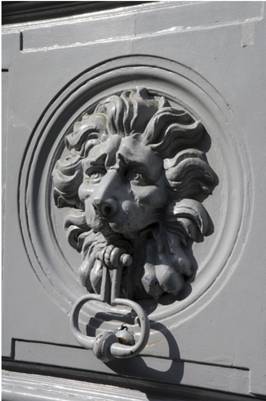
Portail d'entrée : détail du heurtoir surmonté d'un mufle de lion.

25, Besançon, 10 rue de la Convention, lieudit : îlot Saint Jean