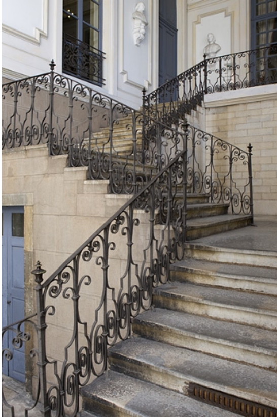
Escalier : vue d'ensemble de la rampe en ferronnerie.

25, Besançon, 10 rue de la Convention, lieudit : îlot Saint Jean