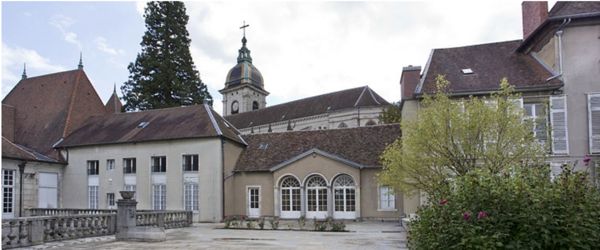
Orangerie : vue d'ensemble éloignée, de face.

25, Besançon, 10 rue de la Convention, lieudit : îlot Saint Jean