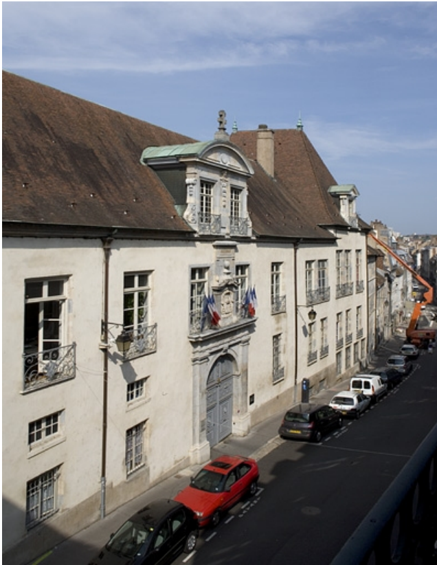
Façade sur rue, de trois quarts gauche.

25, Besançon, 10 rue de la Convention, lieudit : îlot Saint Jean