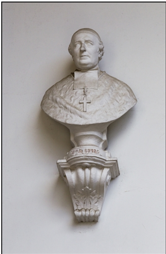
Décor de la cage d'escalier : buste de monseigneur Dubourg, archevêque. 25, Besançon, 10 rue de la Convention, lieudit : îlot Saint Jean