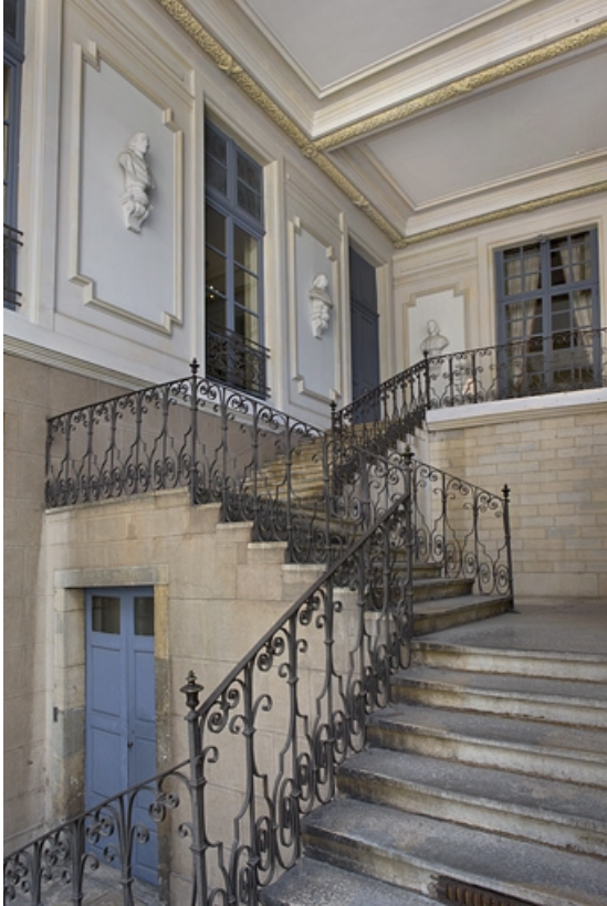
Vue d'ensemble de l'escalier, de trois quarts droit.

25, Besançon, 10 rue de la Convention, lieudit : îlot Saint Jean