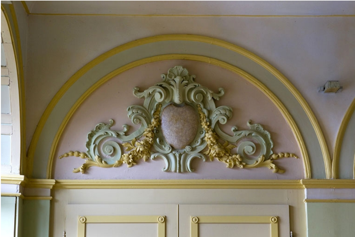
Orangerie, intérieur : détail du décor d'un dessus de porte, de face.

25, Besançon, 10 rue de la Convention, lieudit : îlot Saint Jean