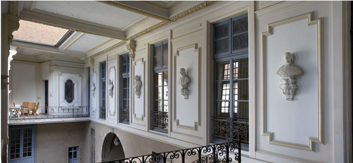
Vue de la partie supérieure de la cage d'escalier, de trois quarts gauche.

25, Besançon, 10 rue de la Convention, lieudit : îlot Saint Jean