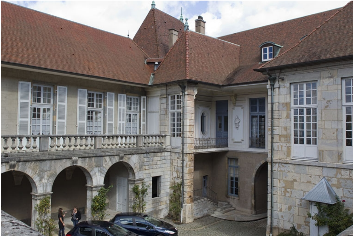
Vue d'ensemble de l'aile droite du logis depuis la terrasse, de trois quarts droit.

25, Besançon, 10 rue de la Convention, lieudit : îlot Saint Jean