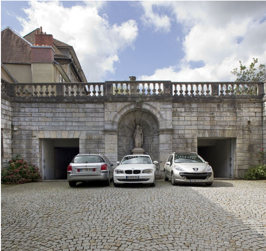
Vue d'ensemble du soubassement de la terrasse au fond de la cour, de face.

25, Besançon, 10 rue de la Convention, lieudit : îlot Saint Jean