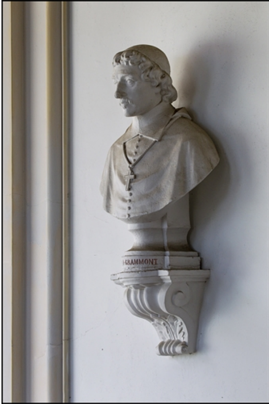
Décor de la cage d'escalier : buste d'Antoine-Pierre II de Grammont, archevêque.

25, Besançon, 10 rue de la Convention, lieudit : îlot Saint Jean