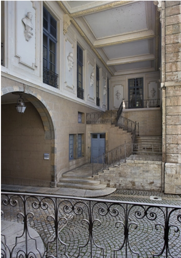
Vue d'ensemble du portail d'entrée sur cour et de l'escalier, depuis l'aile droite. 25, Besançon, 10 rue de la Convention, lieudit : îlot Saint Jean