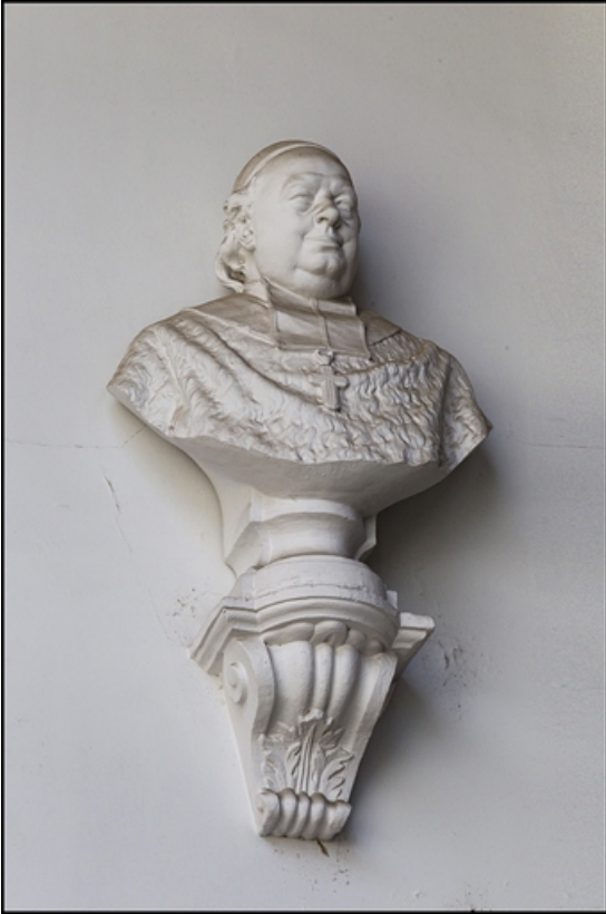
Décor de la cage d'escalier : buste d'un archevêque non identifié.

25, Besançon, 10 rue de la Convention, lieudit : îlot Saint Jean