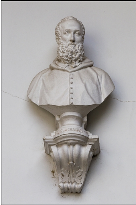
Décor de la cage d'escalier : buste du cardinal Antoine de Granvelle.

25, Besançon, 10 rue de la Convention, lieudit : îlot Saint Jean