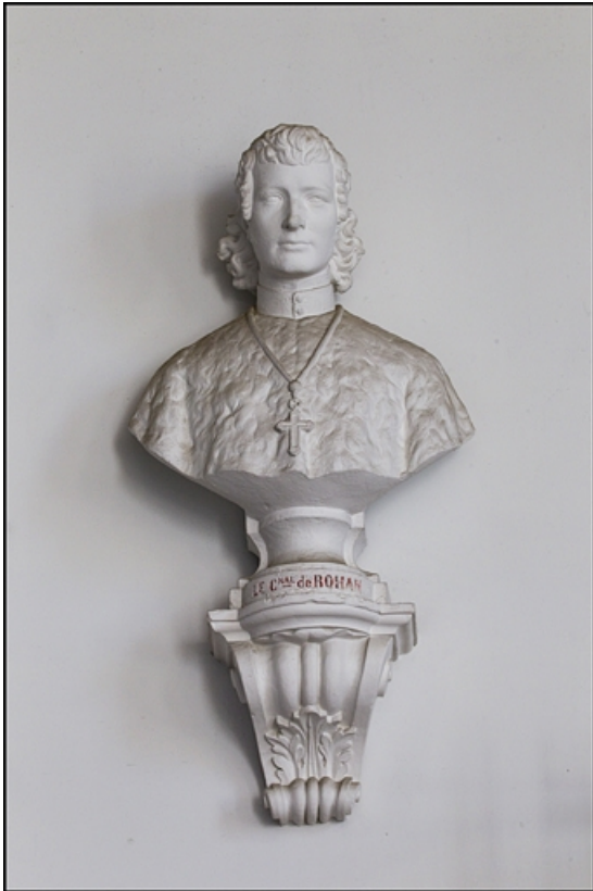
Décor de la cage d'escalier : buste du cardinal de Rohan-Chabot, archevêque.

25, Besançon, 10 rue de la Convention, lieudit : îlot Saint Jean