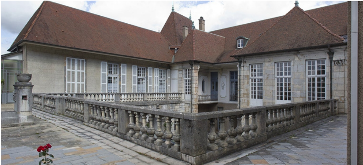
Vue du premier étage de l'aile droite du logis depuis la terrasse, de trois quarts droit.

25, Besançon, 10 rue de la Convention, lieudit : îlot Saint Jean