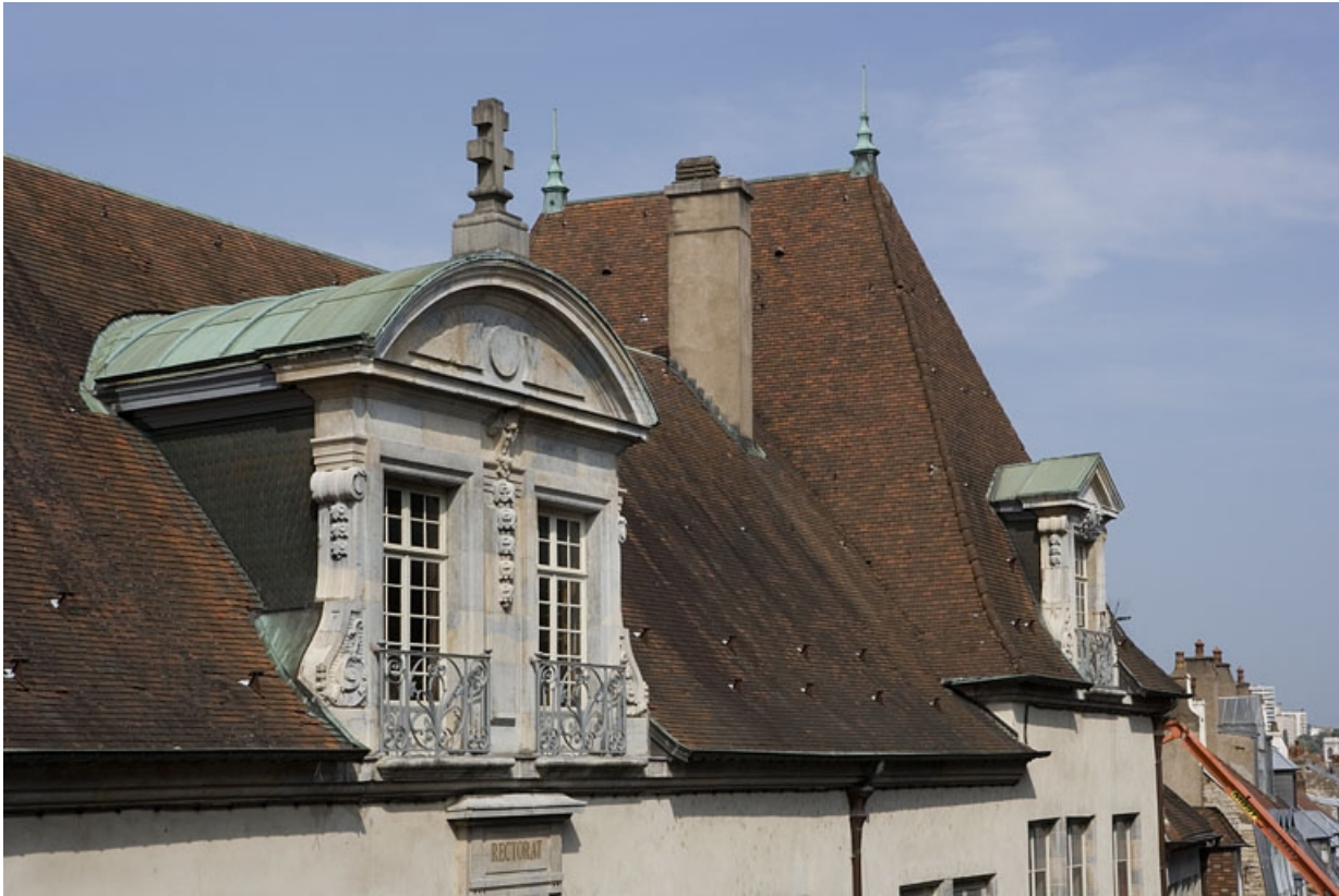
Détail d'une mansarde de trois quarts gauche.

25, Besançon, 10 rue de la Convention, lieudit : îlot Saint Jean