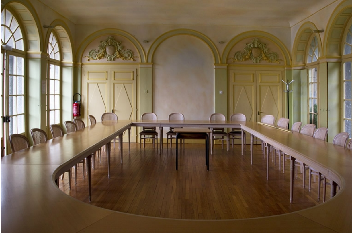
Orangerie, intérieur : vue de la pièce dans sa longueur, de face.

25, Besançon, 10 rue de la Convention, lieudit : îlot Saint Jean