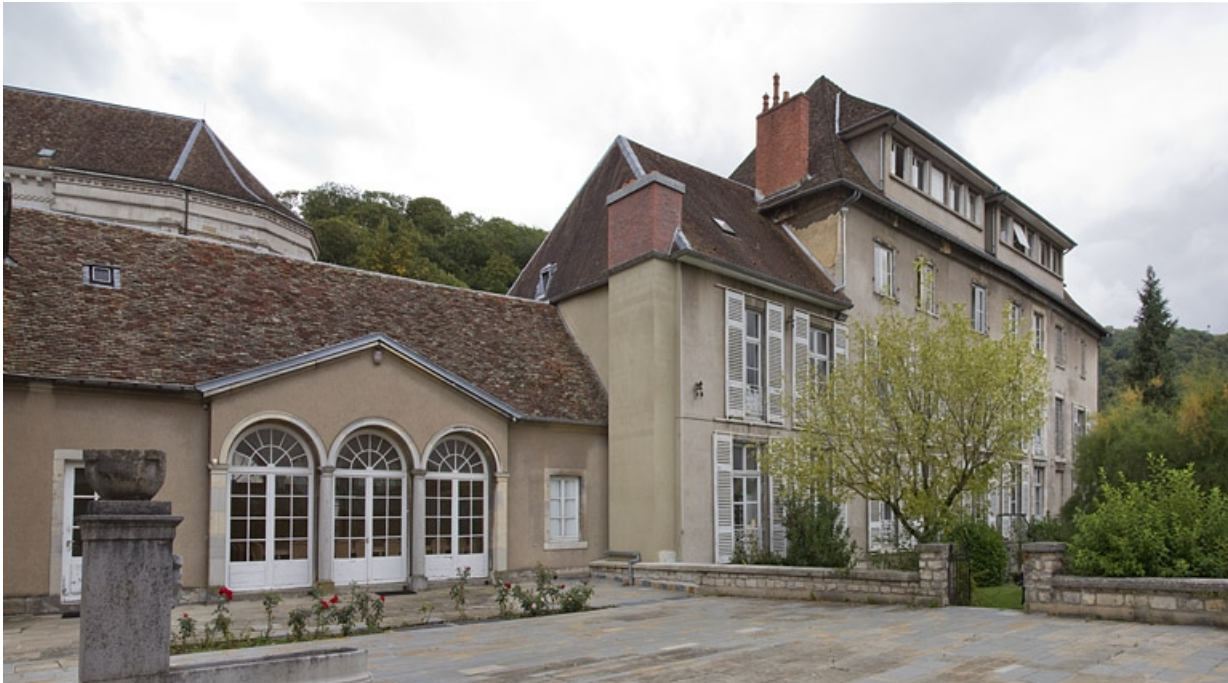
Vue d'ensemble de l'orangerie et du vieil archevêché, de trois quarts gauche. 25, Besançon, 10 rue de la Convention, lieudit : îlot Saint Jean