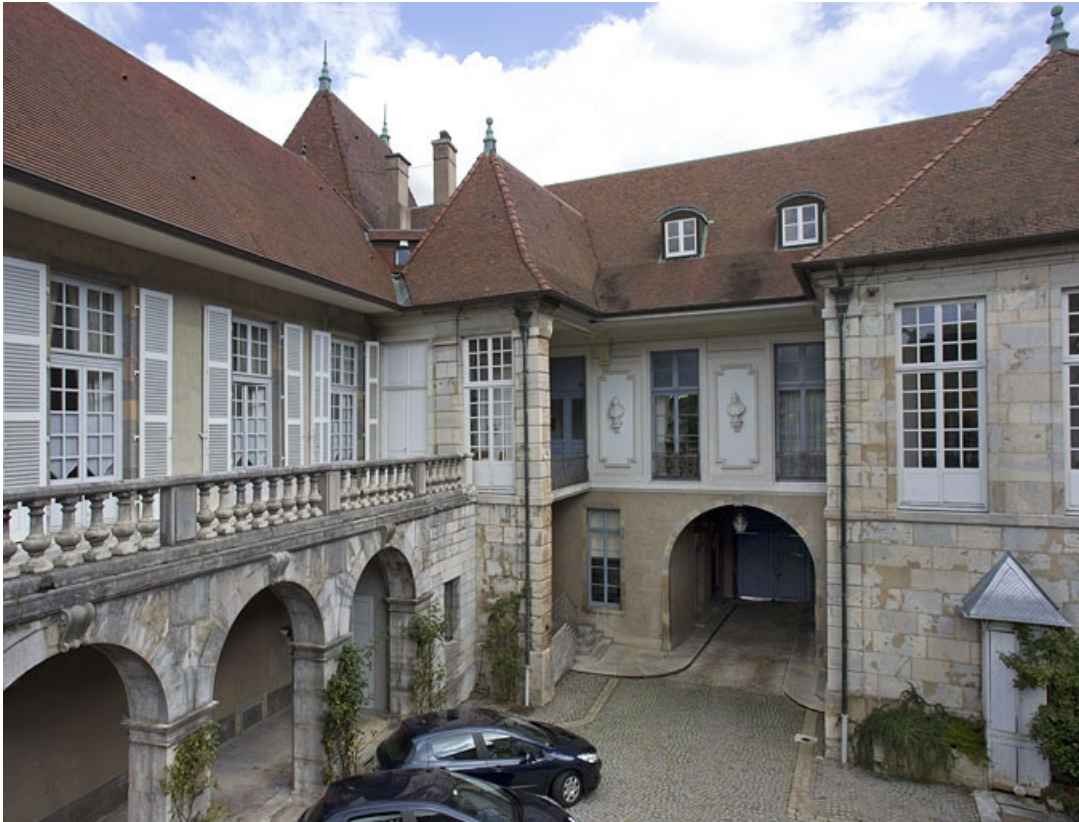
Vue du logis depuis la terrasse, de trois quarts droit.

25, Besançon, 10 rue de la Convention, lieudit : îlot Saint Jean