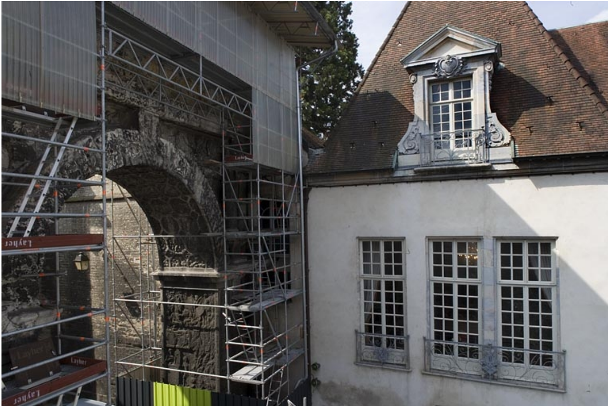
Détail de la partie supérieure de l'avant-corps gauche, vue éloignée.

25, Besançon, 10 rue de la Convention, lieudit : îlot Saint Jean