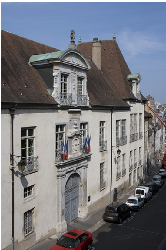
Façade sur rue, de trois quarts gauche : vue rapprochée. 25, Besançon, 10 rue de la Convention, lieudit : îlot Saint Jean