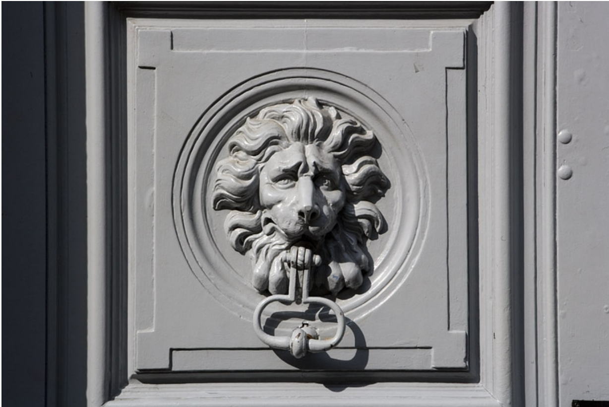
Portail d'entrée : Détail d'une tête de lion portant le heurtoir, de face.

25, Besançon, 10 rue de la Convention, lieudit : îlot Saint Jean