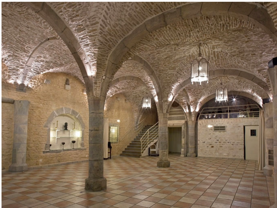
Vue d'ensemble de la cave depuis le fond, de trois quarts droit.

25, Besançon, 4 rue de la Convention, lieudit : îlot Saint Jean