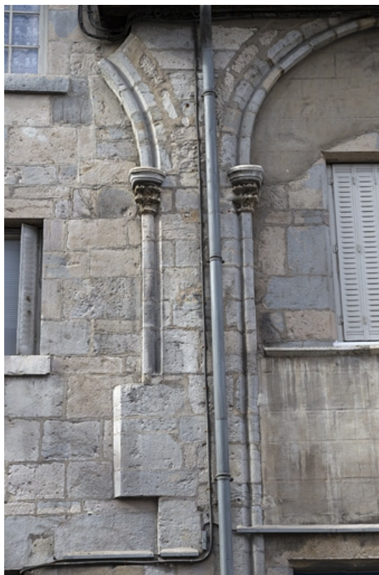
Façade antérieure : détail des arcs et des chapiteaux, vue éloignée.

25, Besançon, 4 rue de la Convention, lieudit : îlot Saint Jean