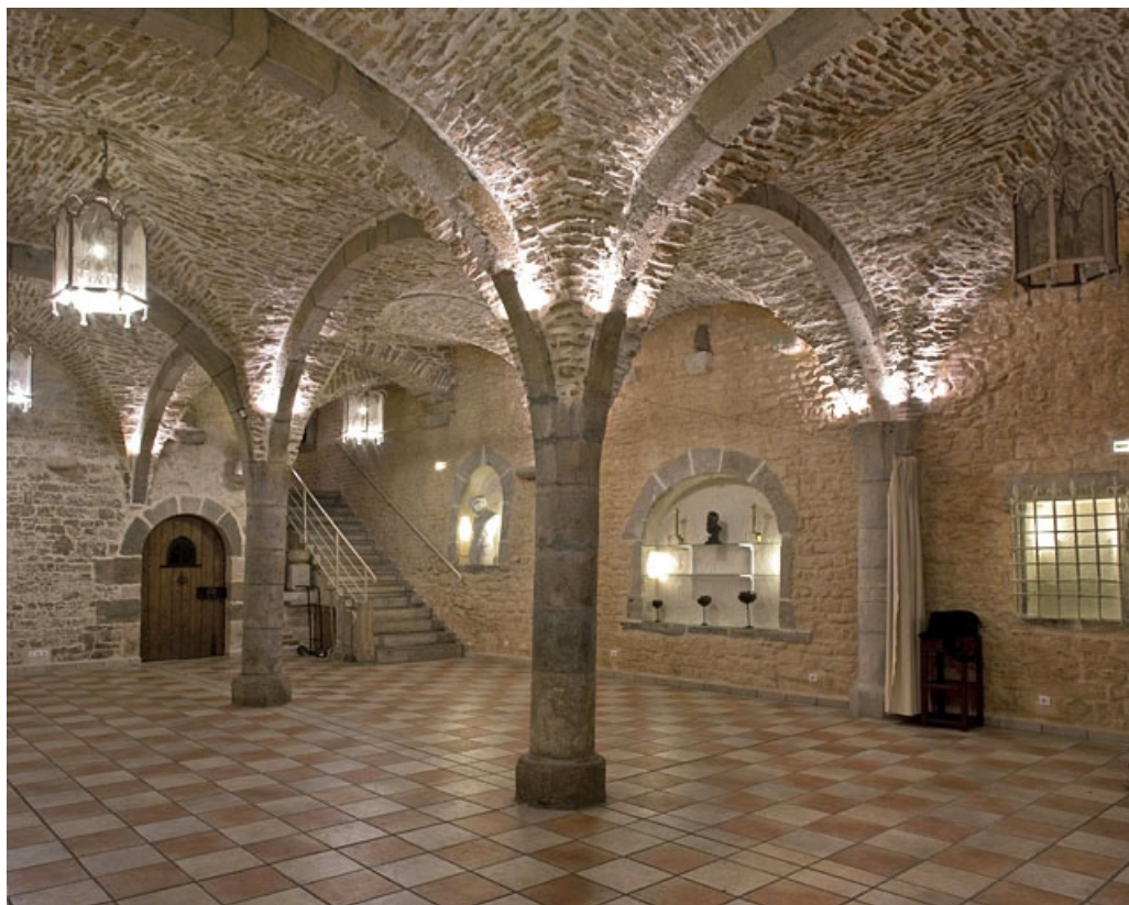
Vue d'ensemble de la cave depuis le fond, de trois quarts gauche.

25, Besançon, 4 rue de la Convention, lieudit : îlot Saint Jean