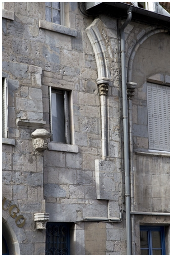
Façade antérieure : détail des arcs et des chapiteaux, de trois quarts gauche. 25, Besançon, 4 rue de la Convention, lieudit : îlot Saint Jean