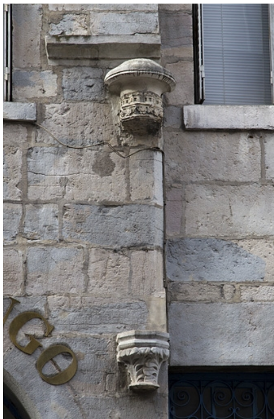
Façade antérieure : détail du décor.

25, Besançon, 4 rue de la Convention, lieudit : îlot Saint Jean