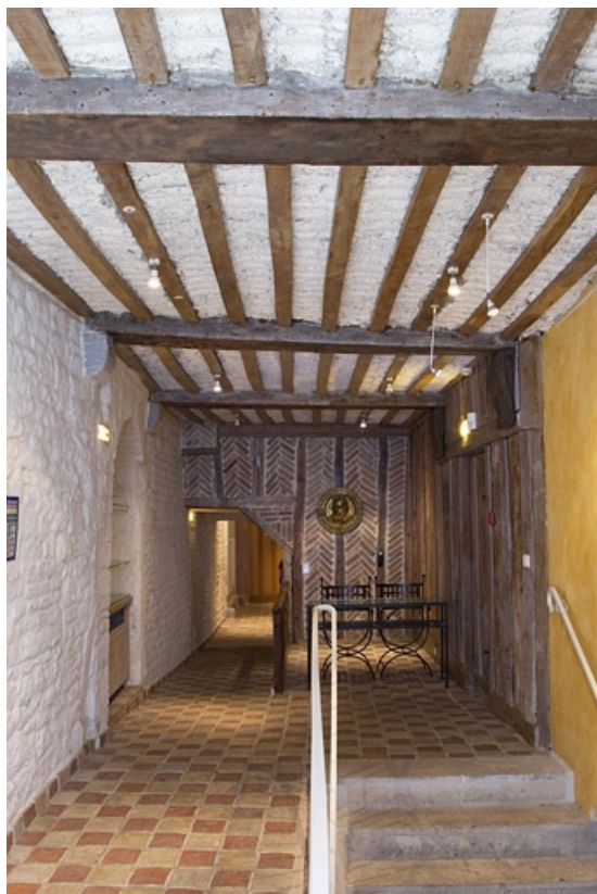
Vue d'ensemble du couloir.

25, Besançon, 4 rue de la Convention, lieudit : îlot Saint Jean