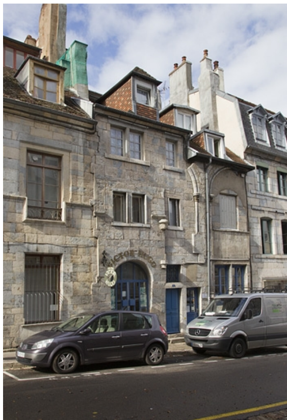
Vue d'ensemble depuis la rue, de trois quarts gauche.

25, Besançon, 4 rue de la Convention, lieudit : îlot Saint Jean