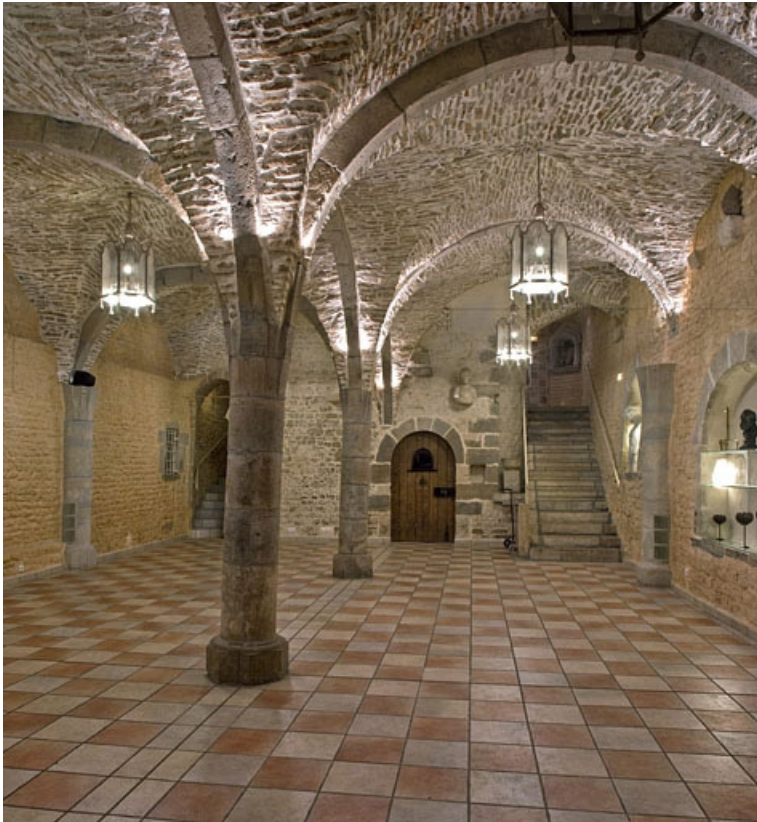
Vue d'ensemble de la cave depuis le fond.

25, Besançon, 4 rue de la Convention, lieudit : îlot Saint Jean