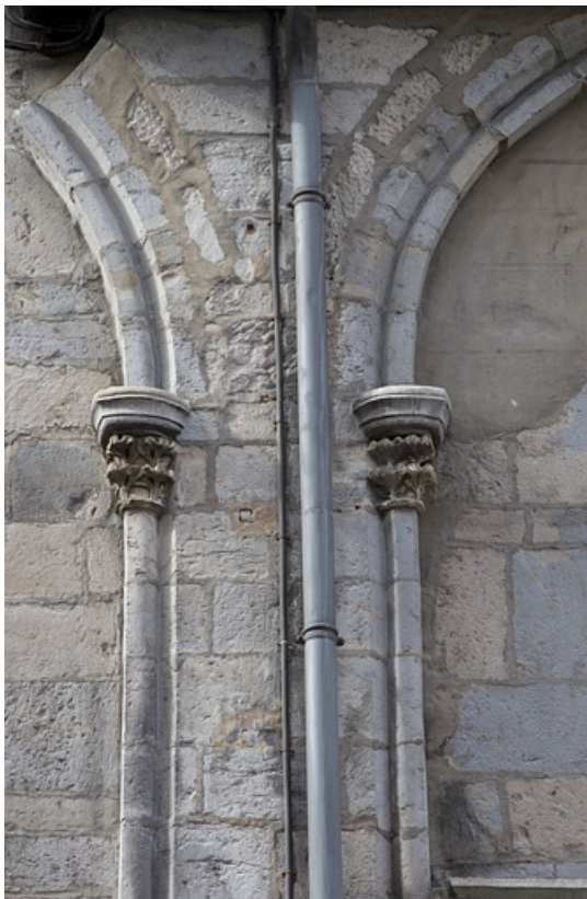
Façade antérieure : détail des arcs et des chapiteaux, vue rapprochée.

25, Besançon, 4 rue de la Convention, lieudit : îlot Saint Jean