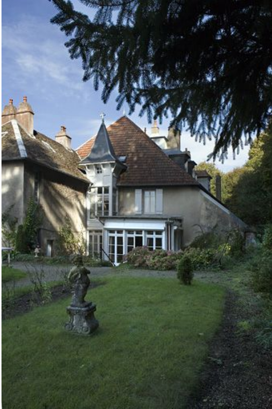
Façade latérale droite : vue éloignée depuis le fond du jardin, de trois quarts droit.

25, Besançon, 1 rue des Fusillés de la Résistance, lieudit : îlot Chapitre