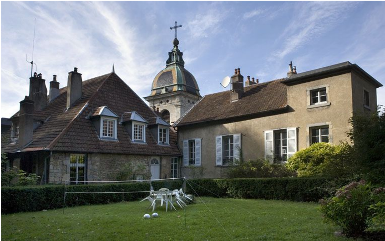
Vue d'ensemble de l'aile gauche depuis le jardin situé à gauche de la maison.

25, Besançon, 1 rue des Fusillés de la Résistance, lieudit : îlot Chapitre