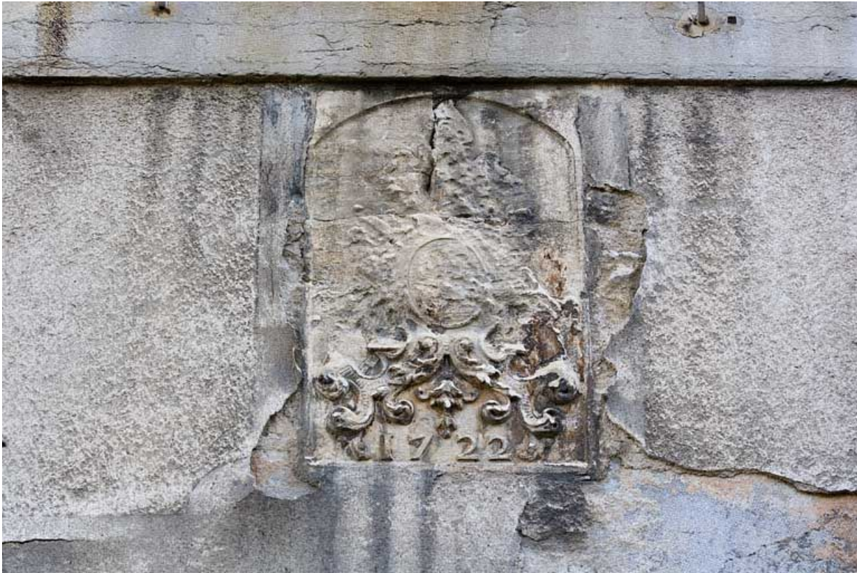
Détail d'un blason bûché daté 1722 sur une baie du rez-de-chaussée.

25, Besançon, 1 rue des Fusillés de la Résistance, lieudit : îlot Chapitre