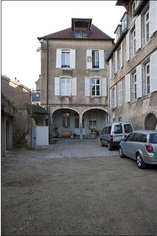
Vue d'ensemble de l'aile gauche depuis la cour, de face.

25, Besançon, 1 rue des Fusillés de la Résistance, lieudit : îlot Chapitre