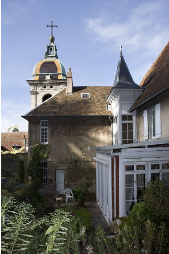
Façade latérale droite : vue latérale avec le clocher de la cathédrale.

25, Besançon, 1 rue des Fusillés de la Résistance, lieudit : îlot Chapitre