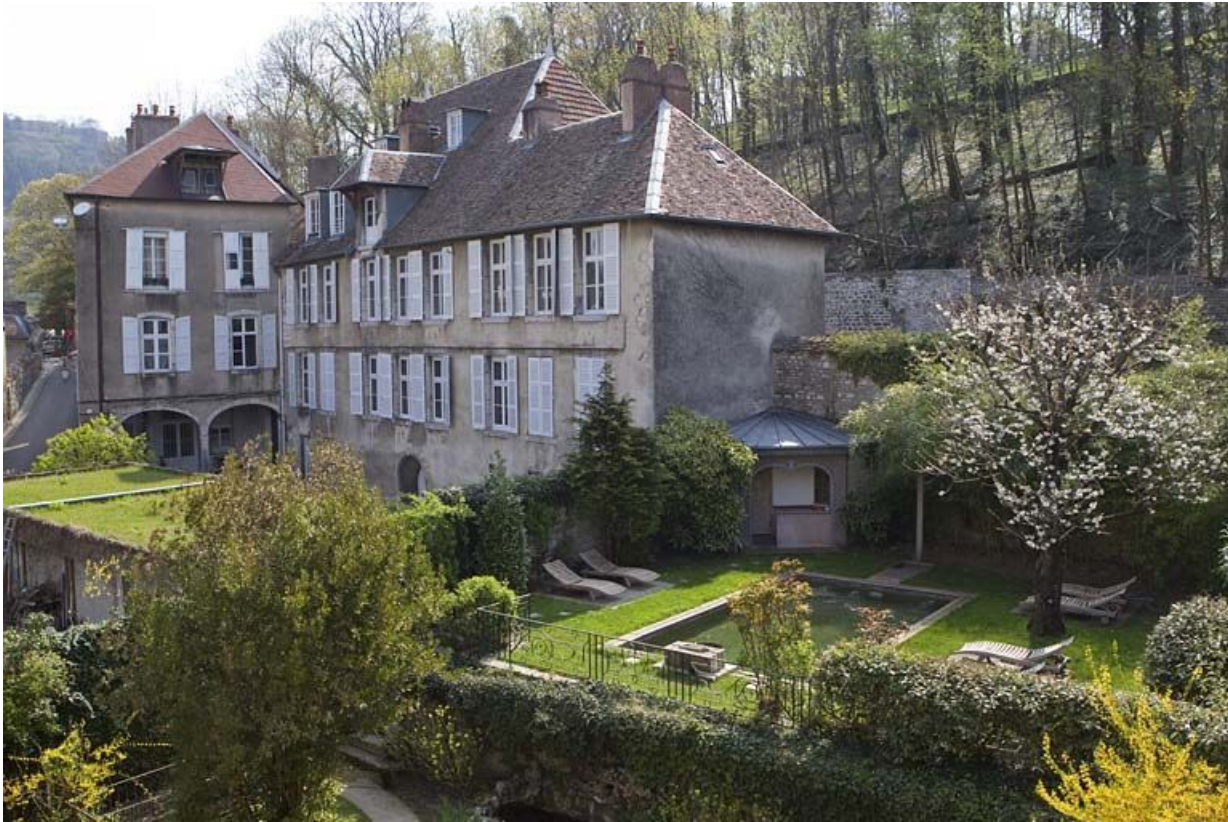
Vue d'ensemble de l'édifice de trois quarts droit, depuis le jardin voisin.

25, Besançon, 1 rue des Fusillés de la Résistance, lieudit : îlot Chapitre