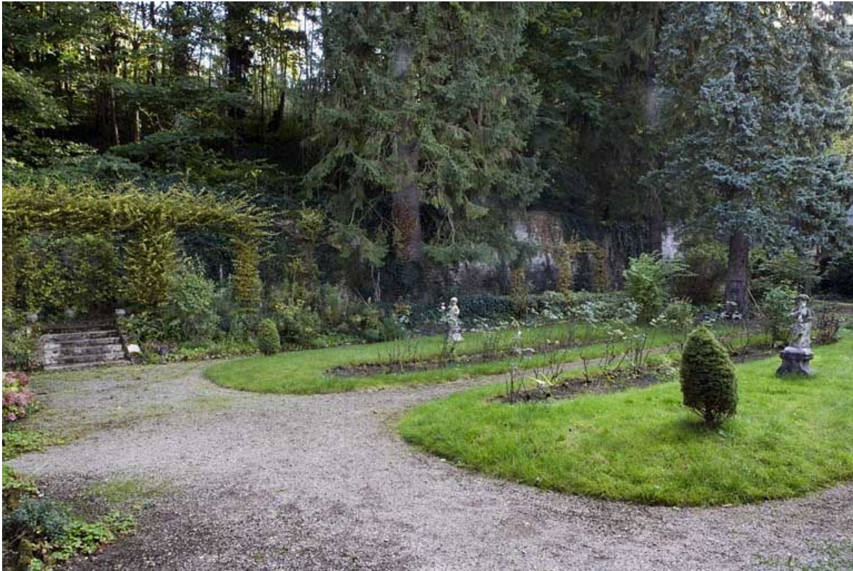
Vue du jardin à droite de l'édifice.

25, Besançon, 1 rue des Fusillés de la Résistance, lieudit : îlot Chapitre