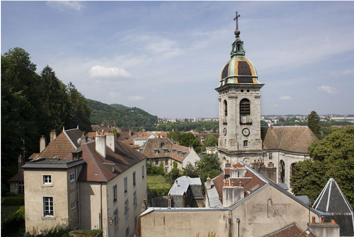
Vue d'ensemble de l'édifice dans son environnement architectural.

25, Besançon, 1 rue des Fusillés de la Résistance, lieudit : îlot Chapitre