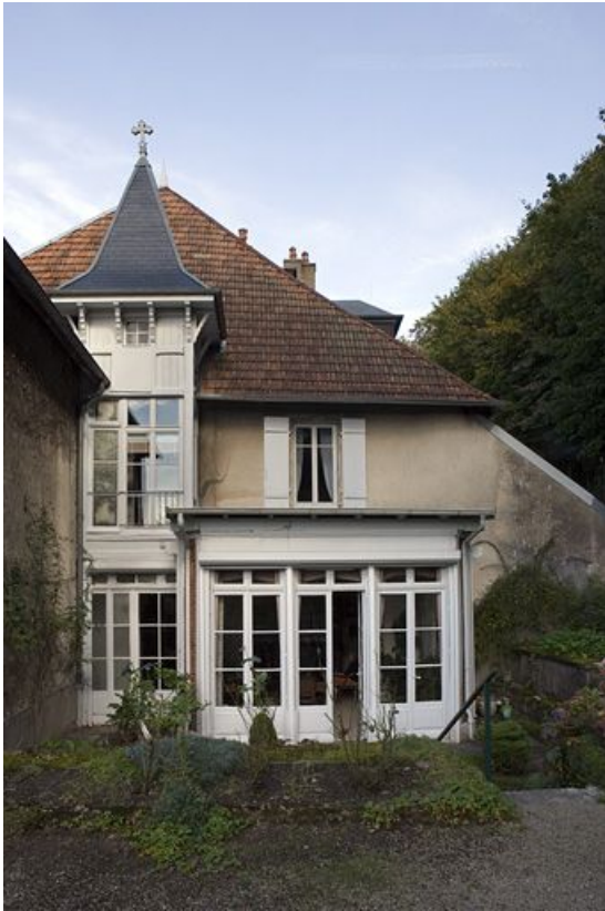
Façade latérale droite : vue rapprochée de face.

25, Besançon, 1 rue des Fusillés de la Résistance, lieudit : îlot Chapitre