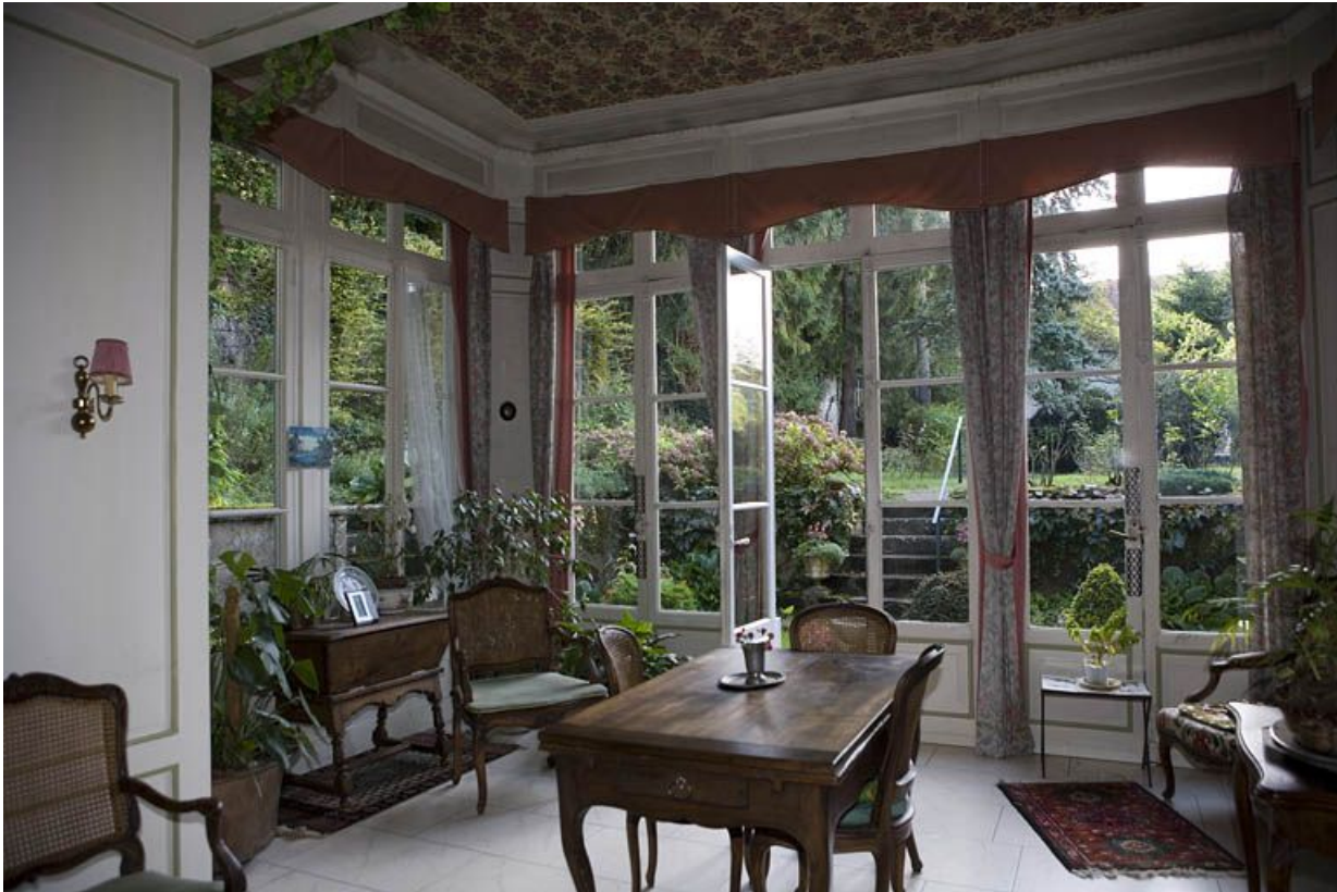
Intérieur : vue d'ensemble de la salle à manger d'été de trois quarts droit.

25, Besançon, 1 rue des Fusillés de la Résistance, lieudit : îlot Chapitre