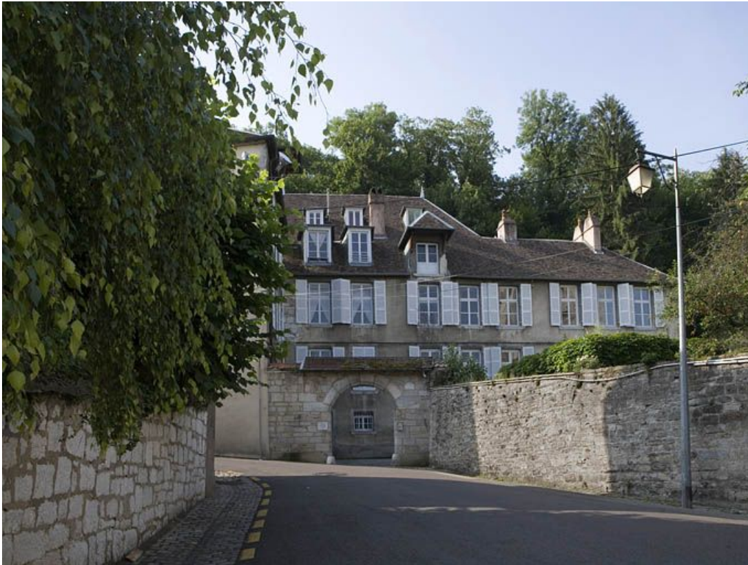
Vue d'ensemble depuis la rue.

25, Besançon, 1 rue des Fusillés de la Résistance, lieudit : îlot Chapitre