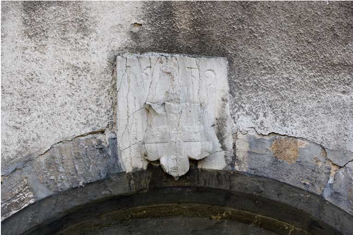
Détail d'un blason daté 1532 sur une entrée de cave.

25, Besançon, 1 rue des Fusillés de la Résistance, lieudit : îlot Chapitre