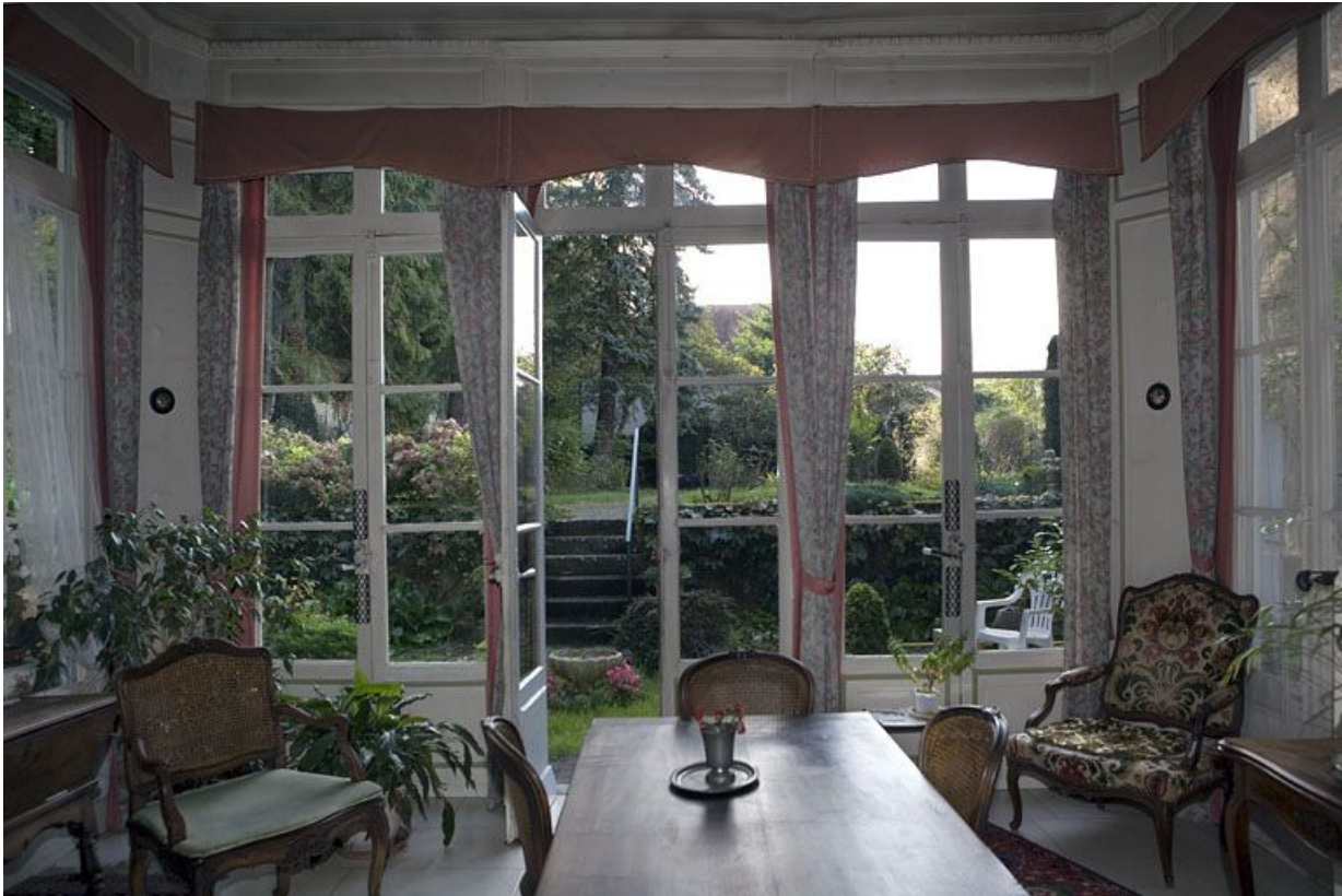
Intérieur : vue d'ensemble de la salle à manger d'été depuis le fond de la pièce.

25, Besançon, 1 rue des Fusillés de la Résistance, lieudit : îlot Chapitre