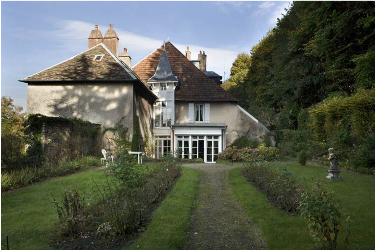
Façade latérale droite : vue éloignée depuis le fond du jardin.

25, Besançon, 1 rue des Fusillés de la Résistance, lieudit : îlot Chapitre