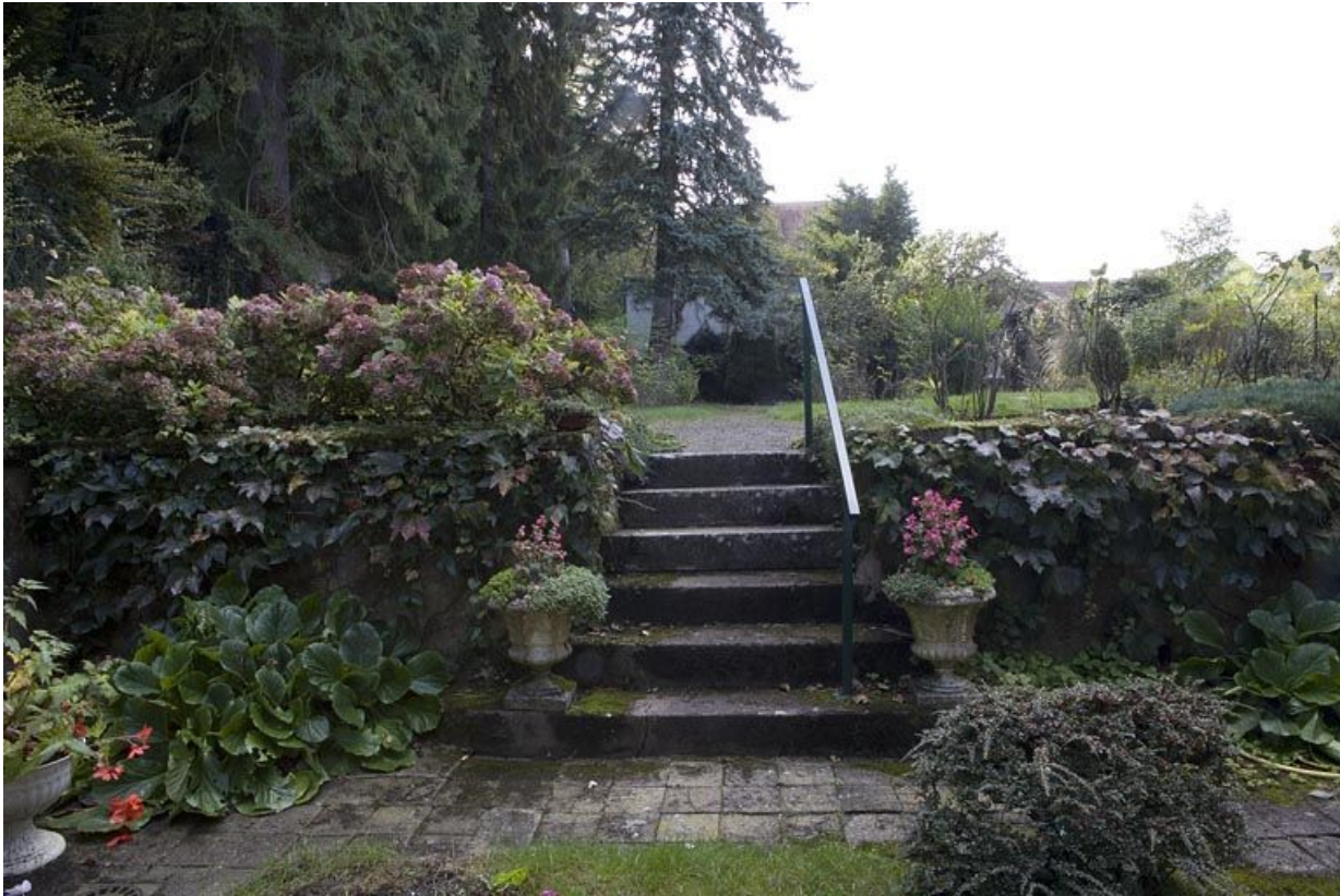
Vue du jardin à droite de l'édifice depuis la courette.

25, Besançon, 1 rue des Fusillés de la Résistance, lieudit : îlot Chapitre