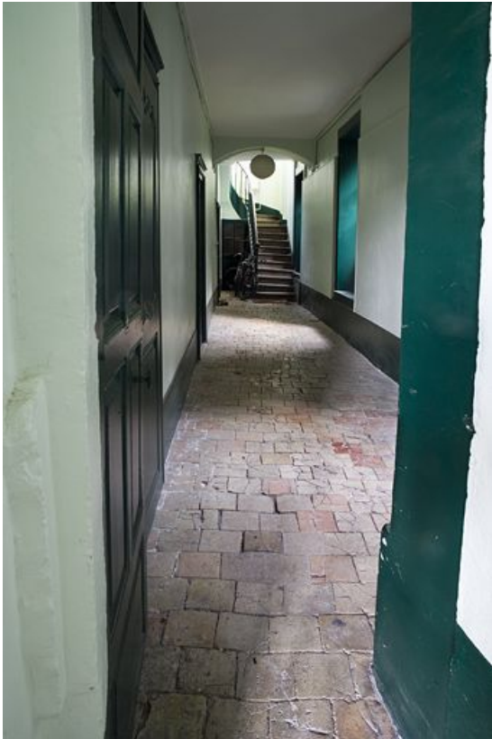
Intérieur : détail de l'escalier secondaire situé dans l'aile gauche.

25, Besançon, 1 rue des Fusillés de la Résistance, lieudit : îlot Chapitre