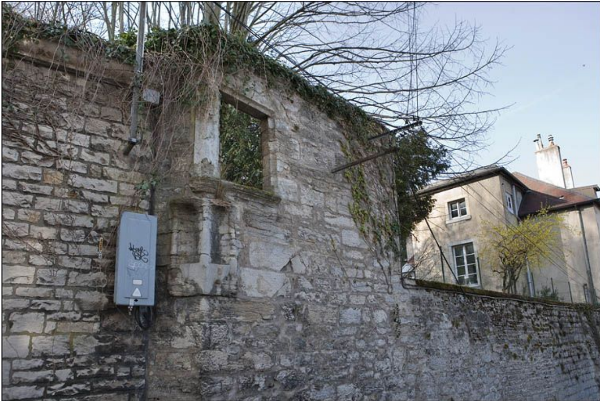
Restes d'une ouverture et de niches aménagées dans le mur du jardin longeant la rue.

25, Besançon, 1 rue des Fusillés de la Résistance, lieudit : îlot Chapitre