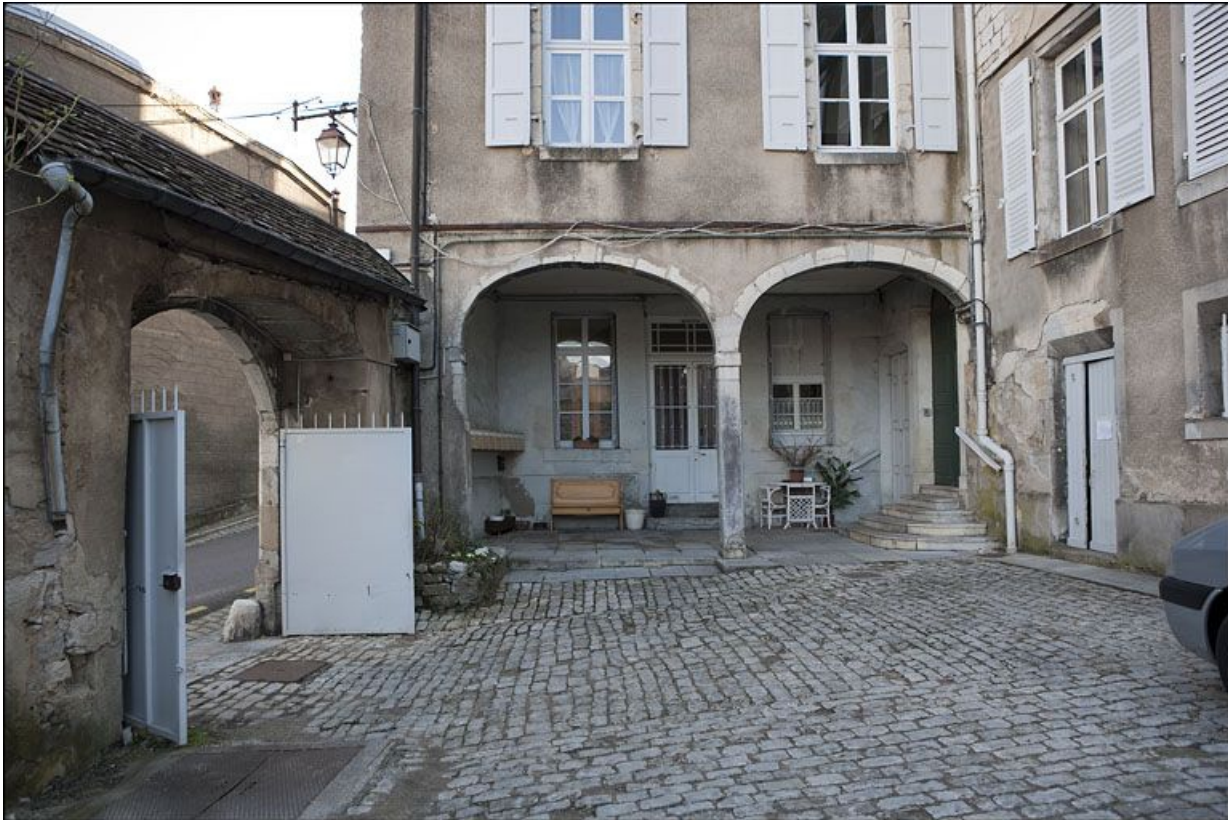
Détail du rez-de-chaussée de l'aile gauche, de face.

25, Besançon, 1 rue des Fusillés de la Résistance, lieudit : îlot Chapitre