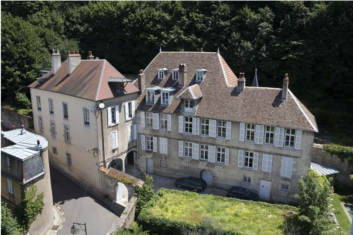
Vue plongeante sur la demeure depuis le clocher de la cathédrale Saint-Jean.

25, Besançon, 1 rue des Fusillés de la Résistance, lieudit : îlot Chapitre