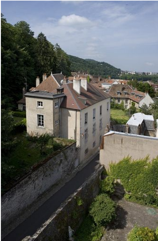
Vue d'ensemble depuis les locaux du CRDP.

25, Besançon, 1 rue des Fusillés de la Résistance, lieudit : îlot Chapitre