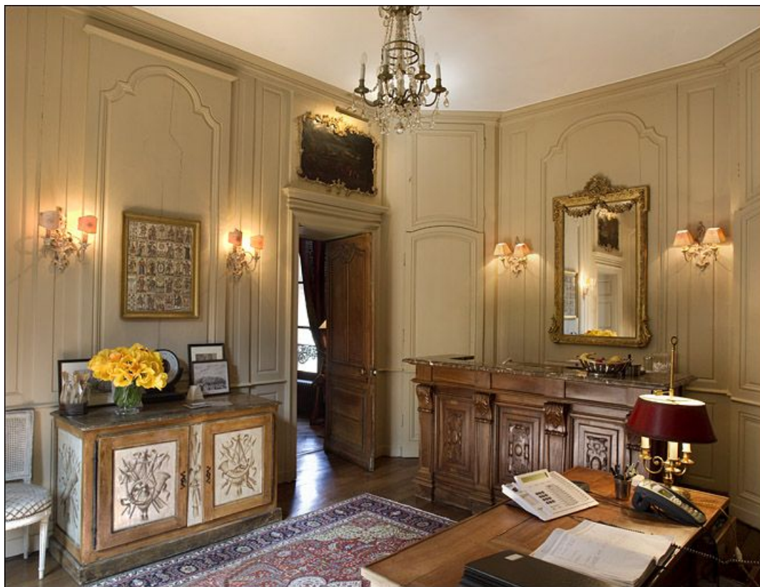
Vue de la pièce de réception de l'hôtel (ancienne antichambre ?).

25, Besançon, 3 rue du Chapitre, lieudit : îlot Chapitre