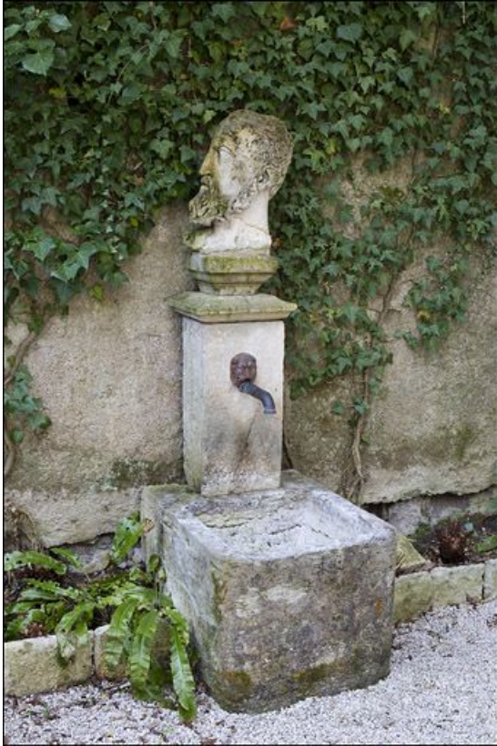
Détail d'une borne-fontaine située dans le jardin.

25, Besançon, 3 rue du Chapitre, lieudit : îlot Chapitre