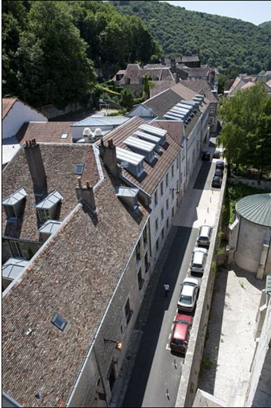
Vue de l'alignement sur rue du logis, depuis le clocher de la cathédrale.

25, Besançon, 3 rue du Chapitre, lieudit : îlot Chapitre