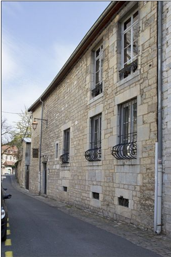
Vue d'ensemble du logis principal depuis la rue, de trois quarts droit.

25, Besançon, 3 rue du Chapitre, lieudit : îlot Chapitre