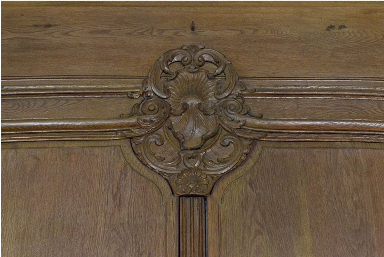
Salon : détail d'un décor à coquille des lambris.

25, Besançon, 3 rue du Chapitre, lieudit : îlot Chapitre