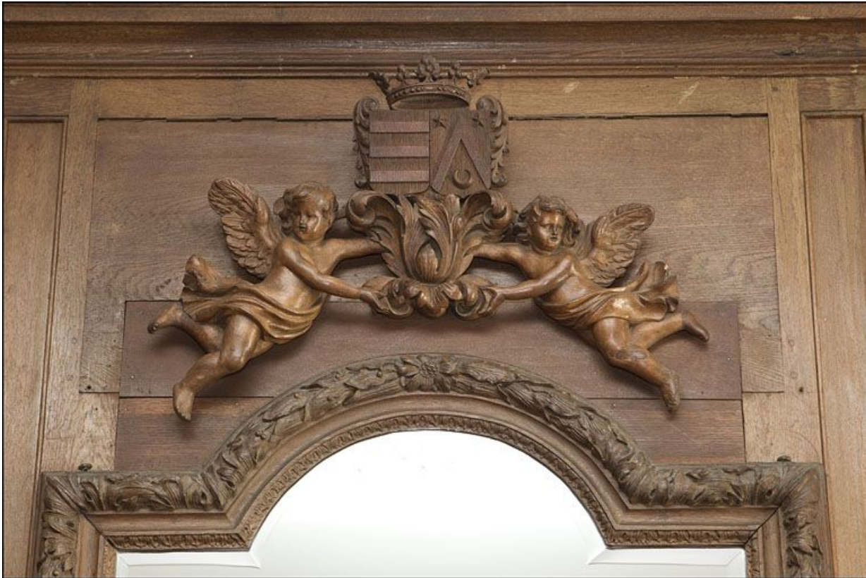
Salon : décor du dessus de glace de la cheminée, avec des armoiries.

25, Besançon, 3 rue du Chapitre, lieudit : îlot Chapitre