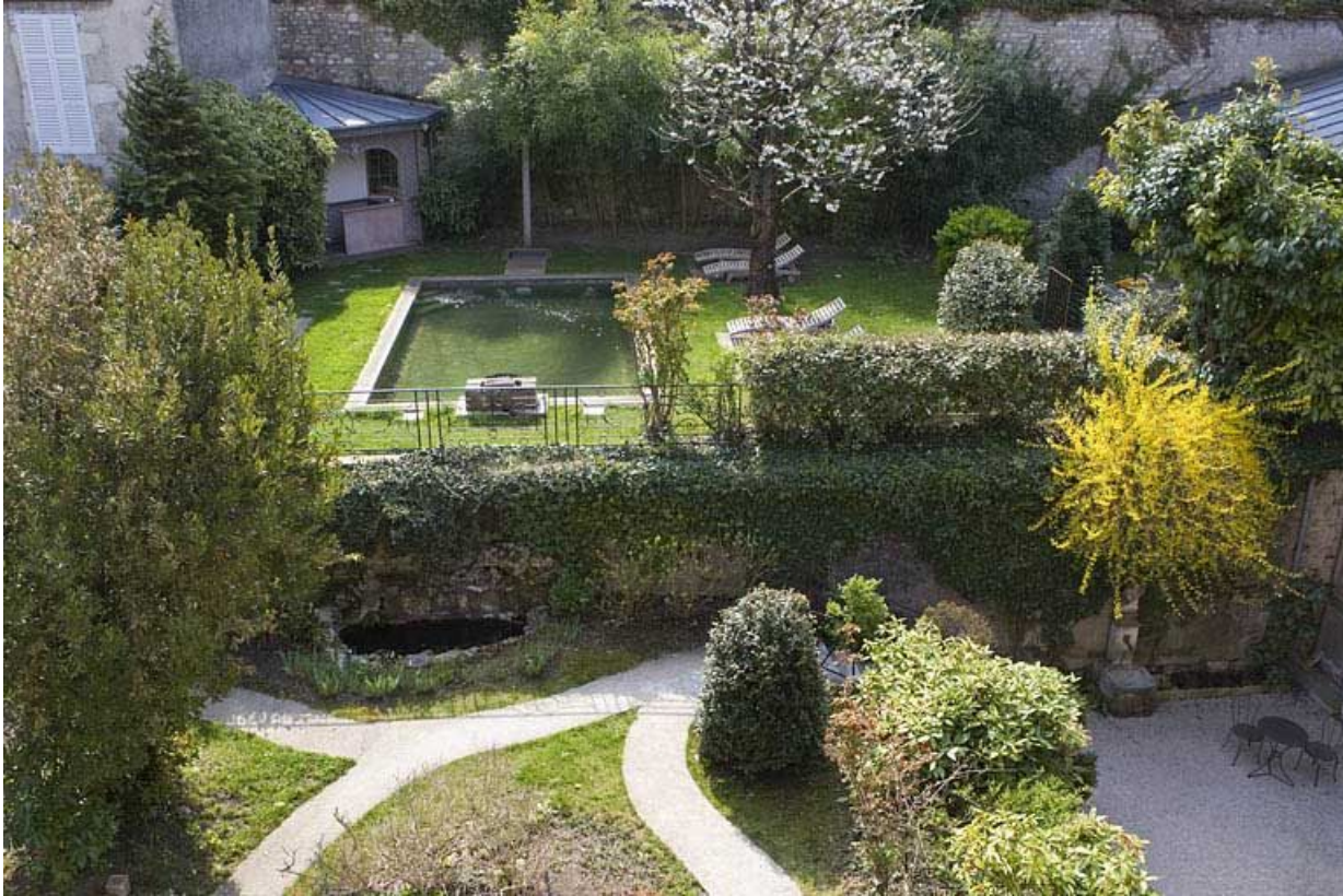
Vue d'ensemble du jardin depuis le premier étage du logis.

25, Besançon, 3 rue du Chapitre, lieudit : îlot Chapitre