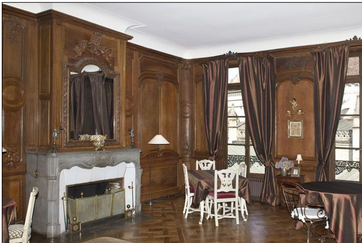
Salon : vue partielle depuis l'entrée avec la cheminée.

25, Besançon, 3 rue du Chapitre, lieudit : îlot Chapitre