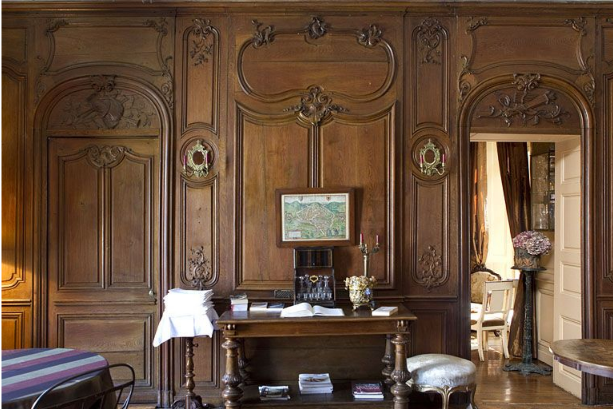
Salon : vue du mur en lambris face à la cheminée, de face.

25, Besançon, 3 rue du Chapitre, lieudit : îlot Chapitre