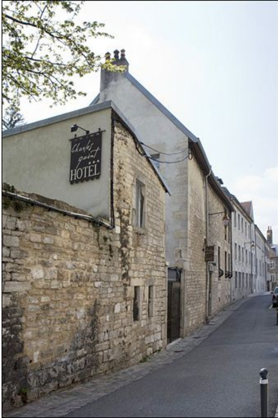
Vue d'ensemble du logis principal depuis la rue, de trois quarts gauche.

25, Besançon, 3 rue du Chapitre, lieudit : îlot Chapitre