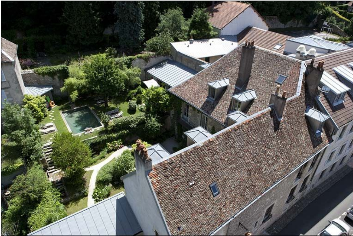
Vue du logis et du jardin, depuis le clocher de la cathédrale.

25, Besançon, 3 rue du Chapitre, lieudit : îlot Chapitre