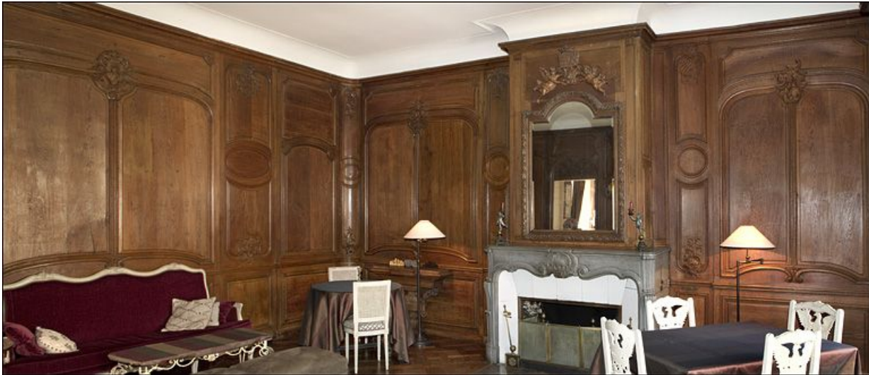
Vue de l'angle du salon avec la cheminée depuis les fenêtres.

25, Besançon, 3 rue du Chapitre, lieudit : îlot Chapitre