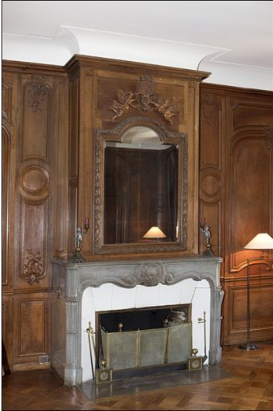
Salon : vue d'ensemble de la cheminée.

25, Besançon, 3 rue du Chapitre, lieudit : îlot Chapitre