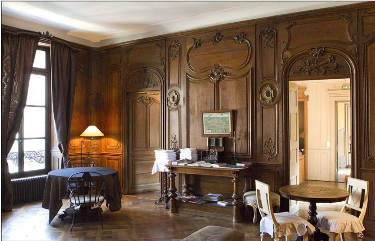
Salon : vue de trois quarts depuis le fond de la pièce.

25, Besançon, 3 rue du Chapitre, lieudit : îlot Chapitre