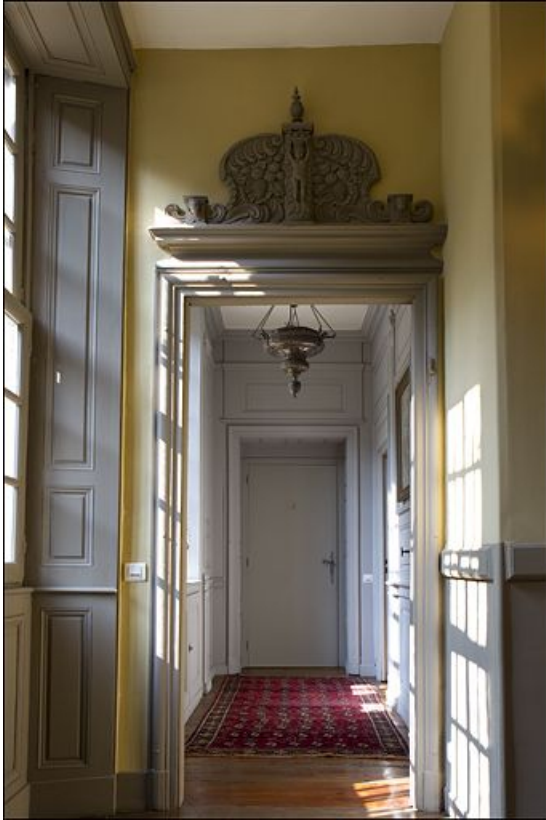
Intérieur : vue du couloir distribuant les pièces de l'étage.

25, Besançon, 3 rue du Chapitre, lieudit : îlot Chapitre