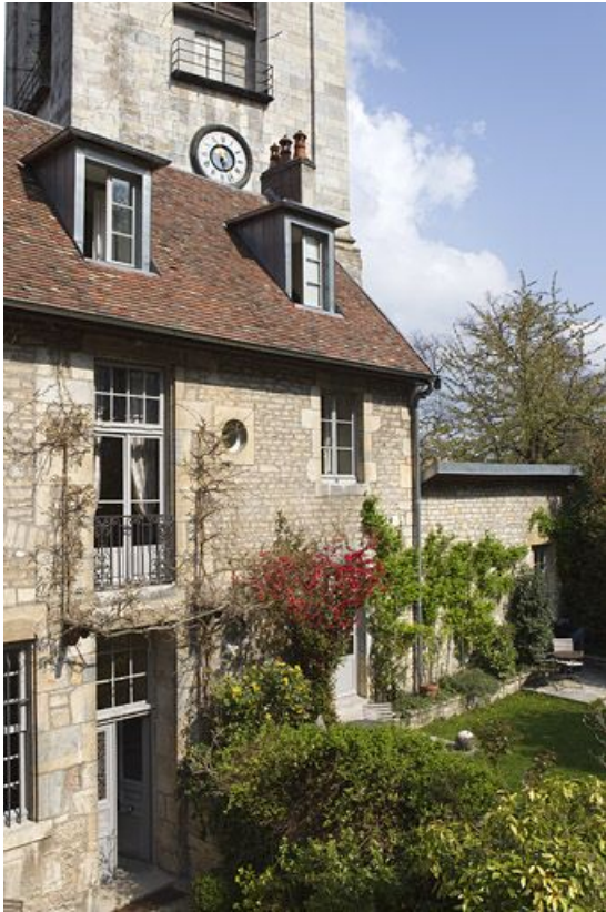
Façade postérieure du logis donnant sur le jardin. 25, Besançon, 3 rue du Chapitre, lieudit : îlot Chapitre