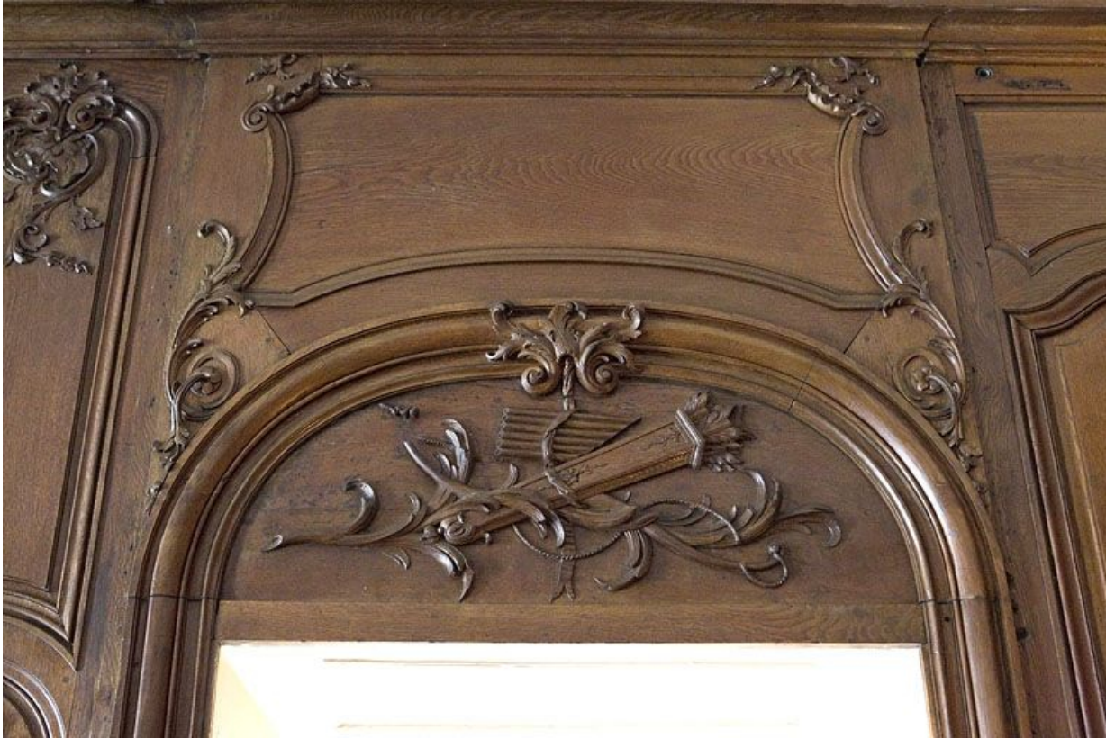
Lambris du salon : détail d'un dessus de porte.

25, Besançon, 3 rue du Chapitre, lieudit : îlot Chapitre