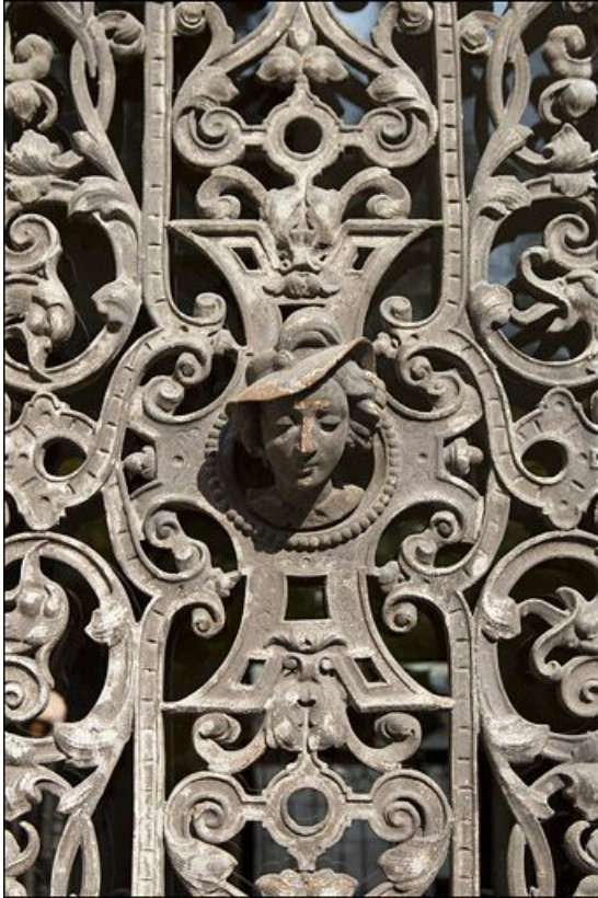
Détail du décor en fonte d'un des panneaux de la porte d'entrée.

25, Besançon, 3 rue du Chapitre, lieudit : îlot Chapitre