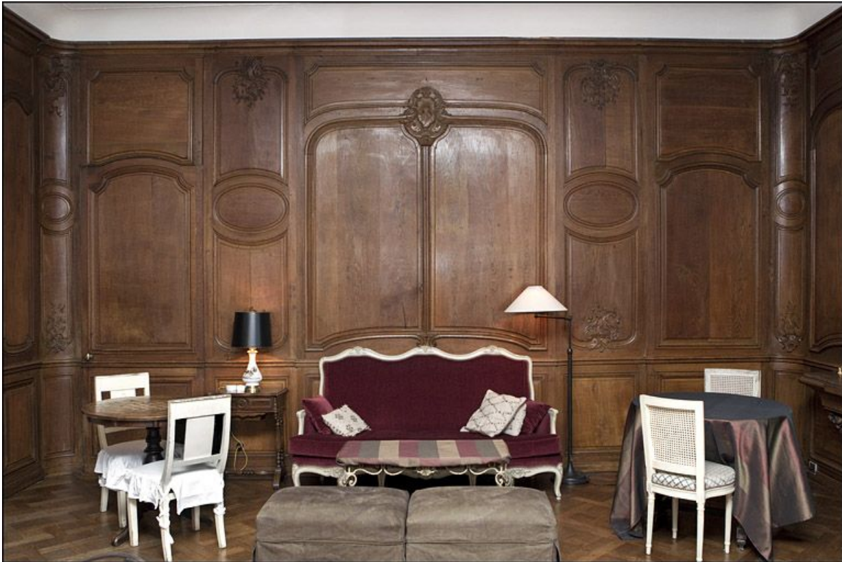
Salon : vue du mur en lambris opposé aux fenêtres.

25, Besançon, 3 rue du Chapitre, lieudit : îlot Chapitre