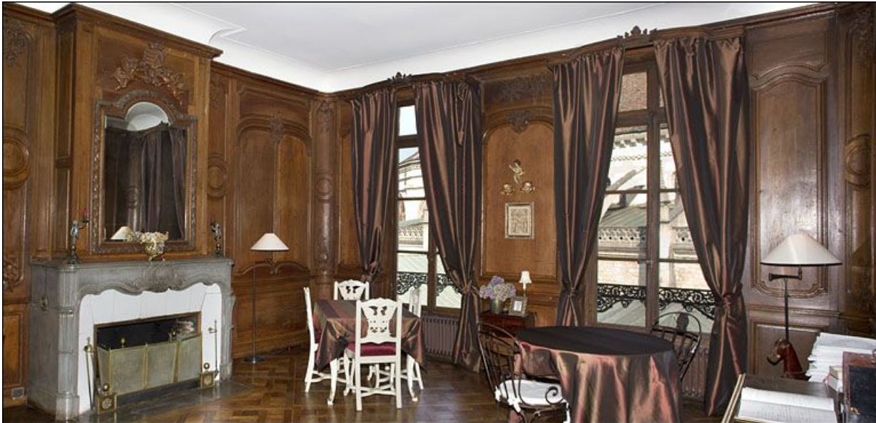
Vue du salon depuis l'entrée de la pièce, de trois quarts droit.

25, Besançon, 3 rue du Chapitre, lieudit : îlot Chapitre