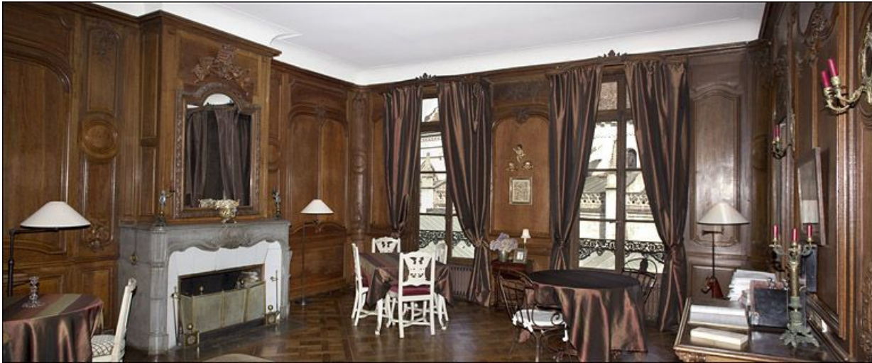
Vue du salon avec la cheminée depuis l'entrée de la pièce, de trois quarts droit.

25, Besançon, 3 rue du Chapitre, lieudit : îlot Chapitre