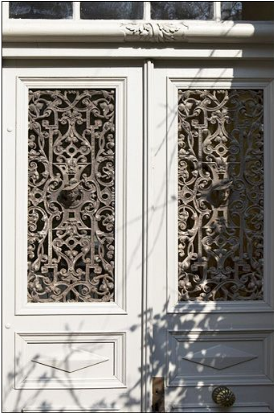
Détail du décor en fonte des deux panneaux de la porte d'entrée.

25, Besançon, 3 rue du Chapitre, lieudit : îlot Chapitre