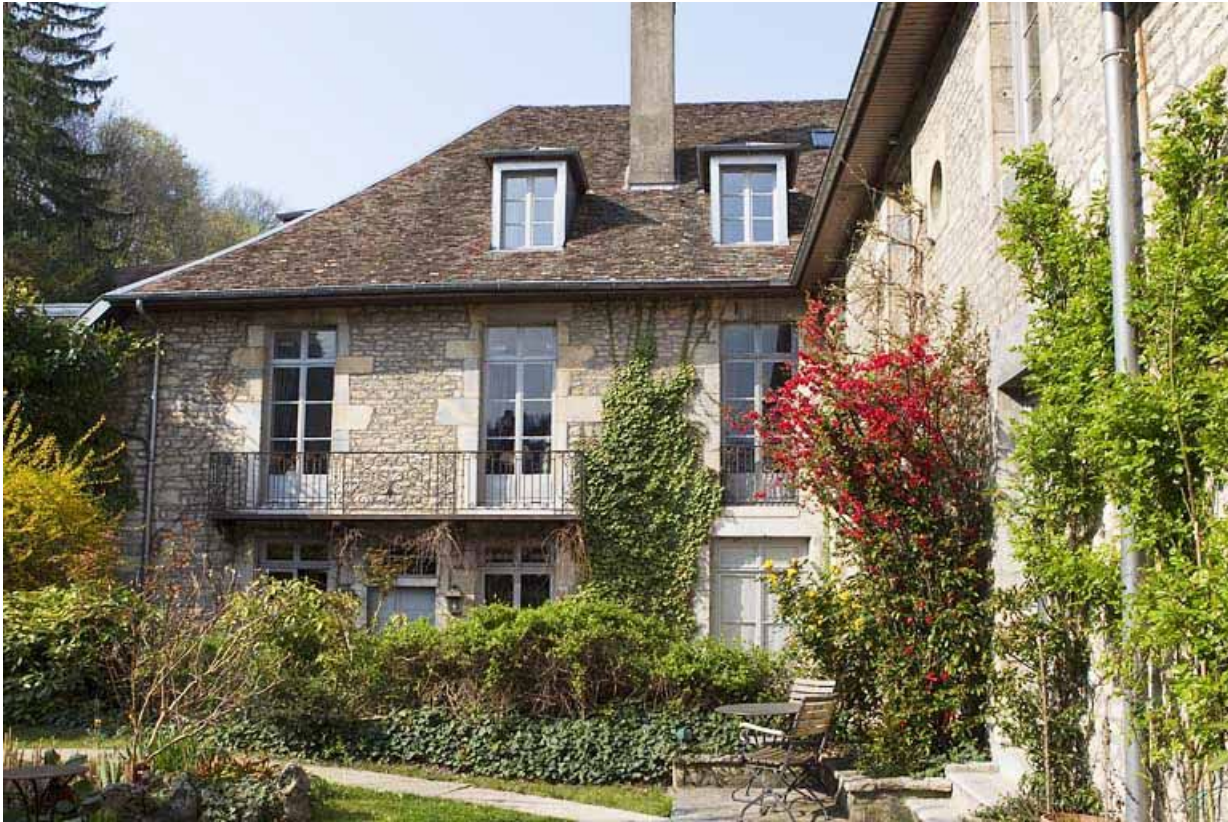
Vue d'ensemble de l'aile sur jardin du logis principal.

25, Besançon, 3 rue du Chapitre, lieudit : îlot Chapitre