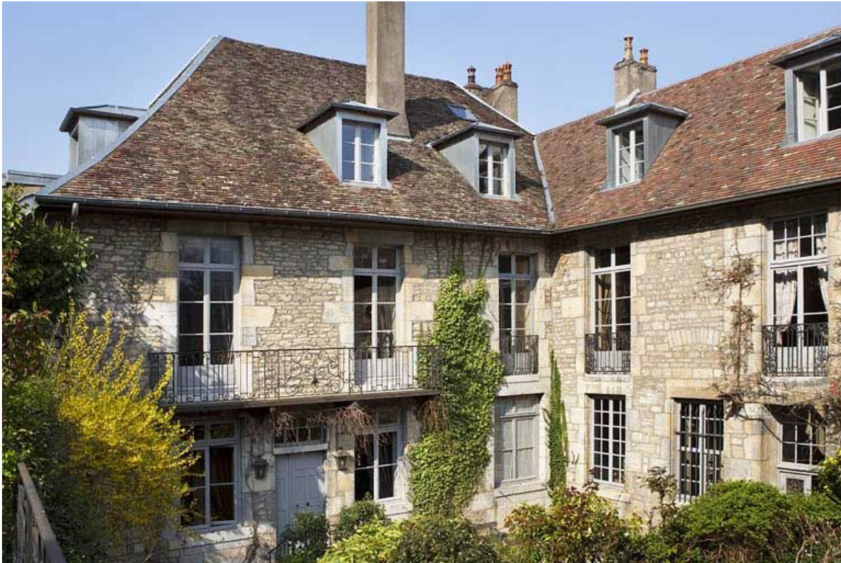
Vue d'ensemble de façades sur jardin du logis principal.

25, Besançon, 3 rue du Chapitre, lieudit : îlot Chapitre