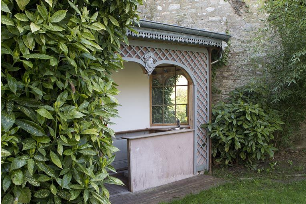
Détail de la fabrique de jardin, de trois quarts gauche.

25, Besançon, 3 rue du Chapitre, lieudit : îlot Chapitre