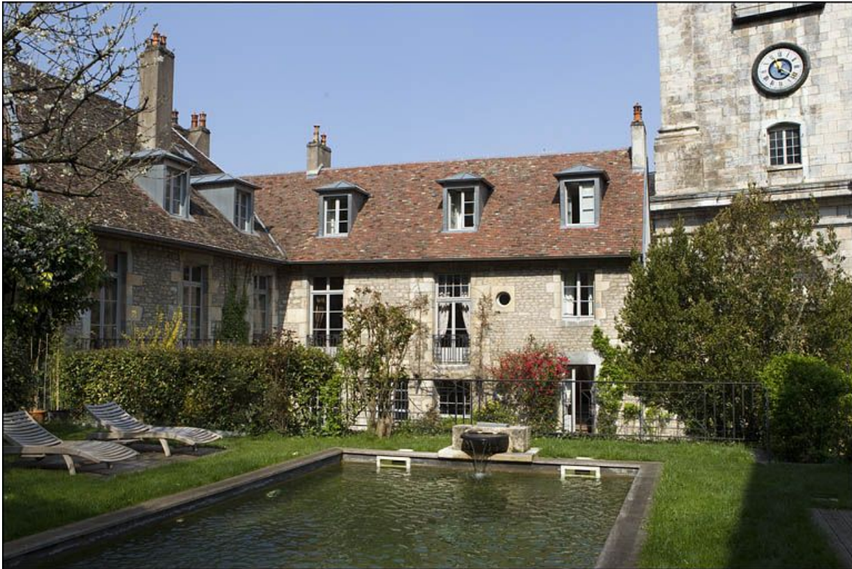
Vue d'ensemble du logis depuis le fond du jardin.

25, Besançon, 3 rue du Chapitre, lieudit : îlot Chapitre