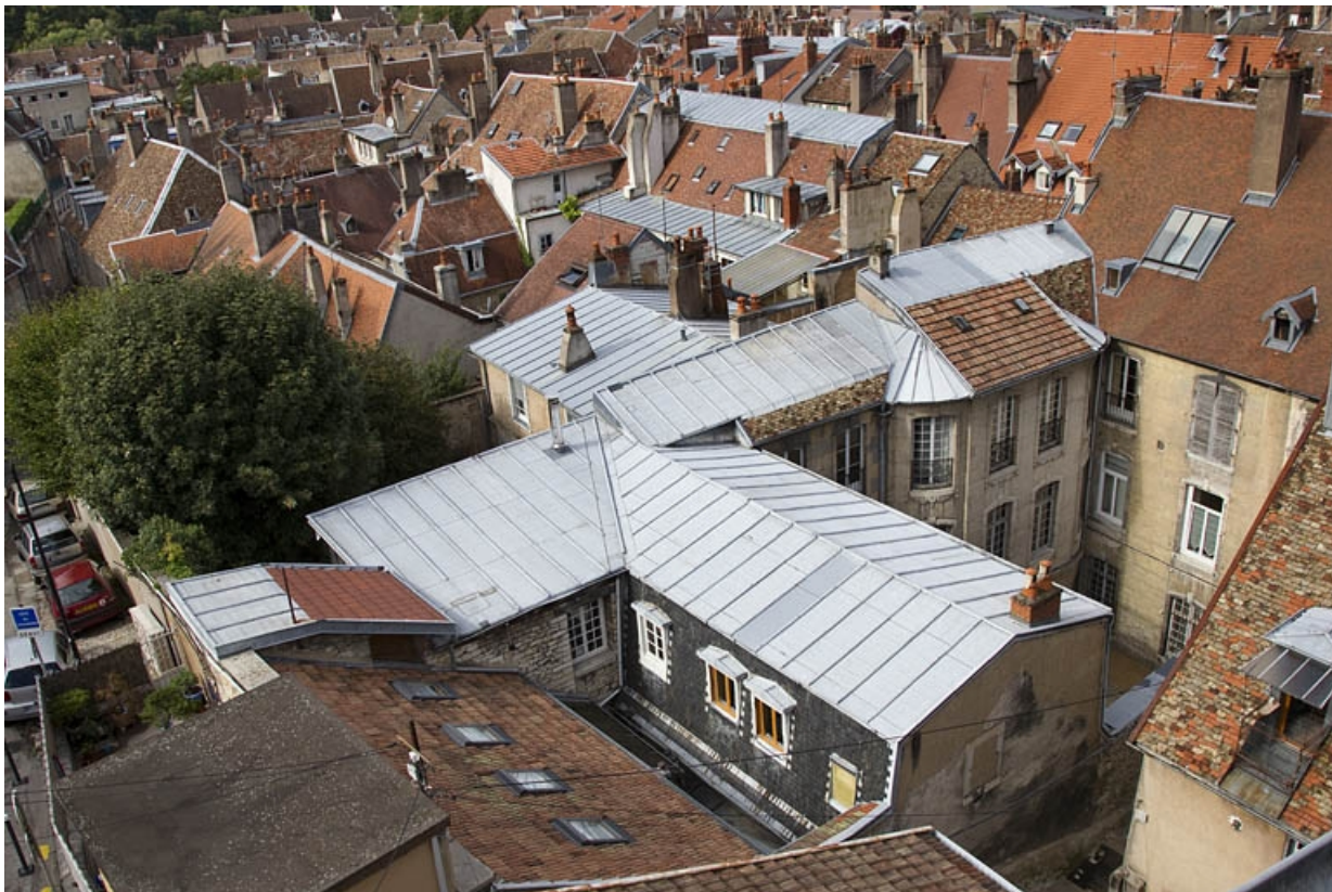
Vue d'ensemble de l'édifice depuis la rue du Palais.

25, Besançon, 25 rue Renan, lieudit : îlot Cingle