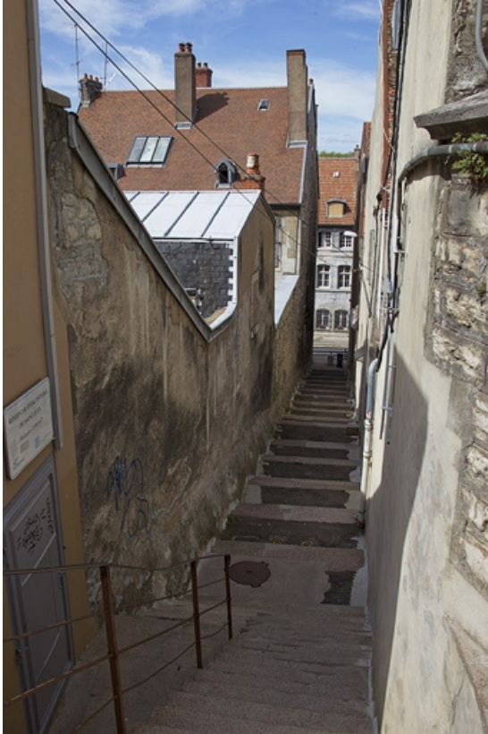
Façade latérale gauche de l'édifice longeant la ruelle Casenat, depuis le haut de la ruelle. 25, Besançon, 25 rue Renan, lieudit : îlot Cingle