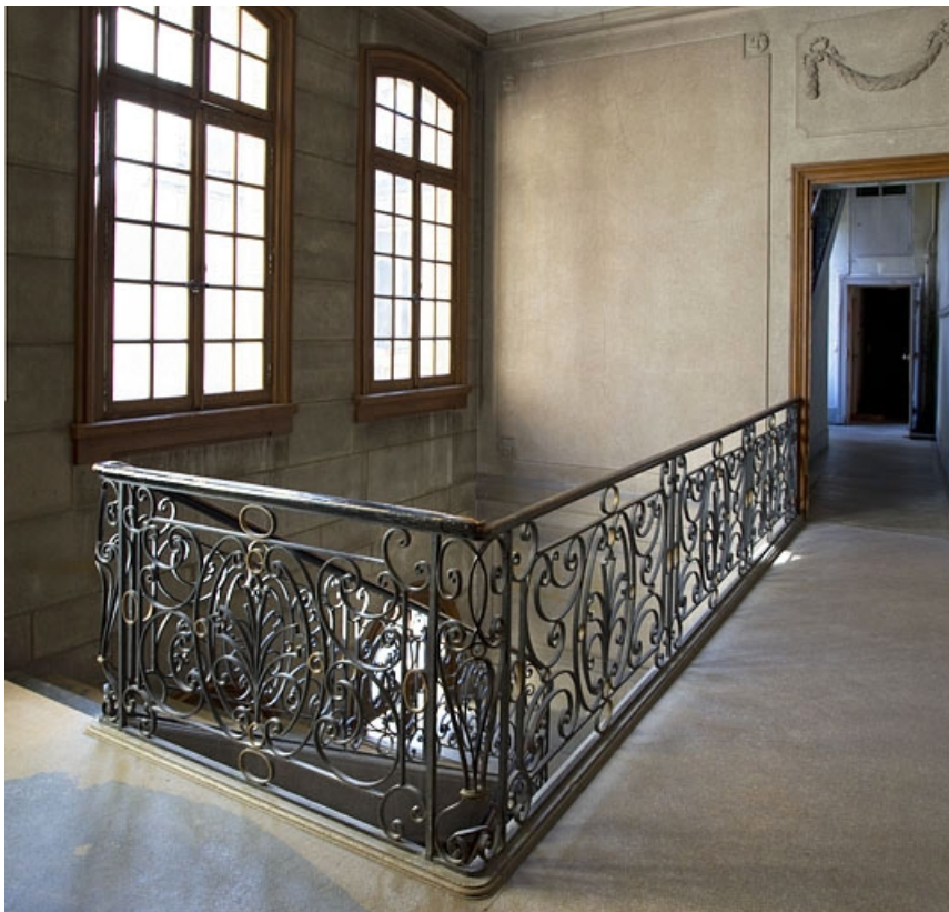
Logis principal : détail de la rampe en ferronnerie de l'escalier.

25, Besançon, 25 rue Renan, lieudit : îlot Cingle