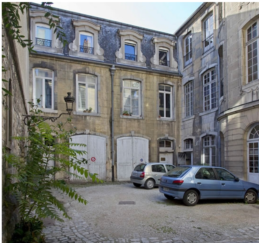
Vue d'ensemble de la façade antérieure du logis secondaire : de trois quarts gauche. 25, Besançon, 25 rue Renan, lieudit : îlot Cingle