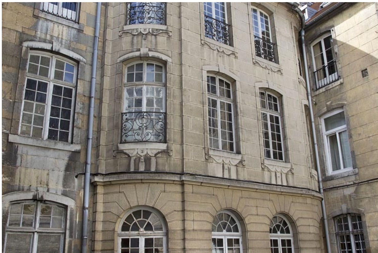
Aile de l'escalier : détail du premier étage.

25, Besançon, 25 rue Renan, lieudit : îlot Cingle