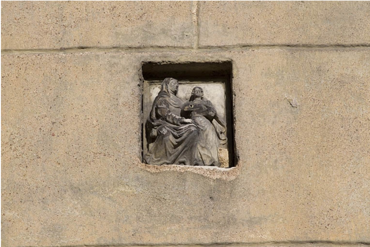
Mur de la cour : détail d'une sculpture représentant sainte Anne et la Vierge.

25, Besançon, 25 rue Renan, lieudit : îlot Cingle