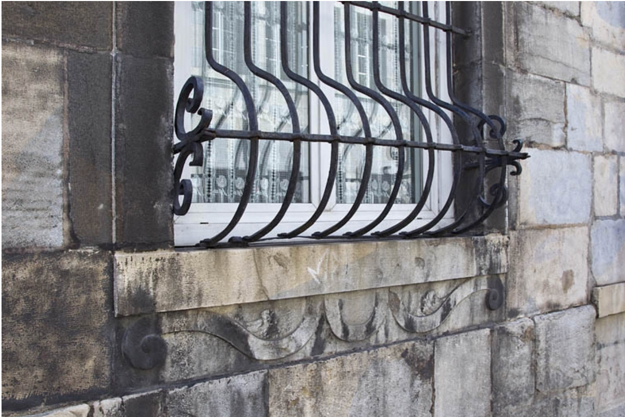
Logis principal, façade antérieure, rez-de-chaussée : détail de la partie inférieure d'une grille de fenêtre.

25, Besançon, 25 rue Renan, lieudit : îlot Cingle