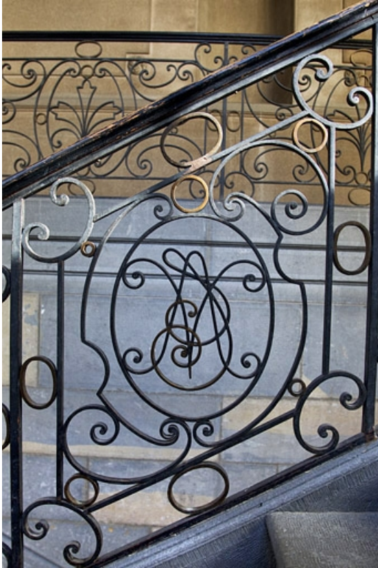
Aile de l'escalier : détail d'un motif de la rampe d'escalier.

25, Besançon, 25 rue Renan, lieudit : îlot Cingle