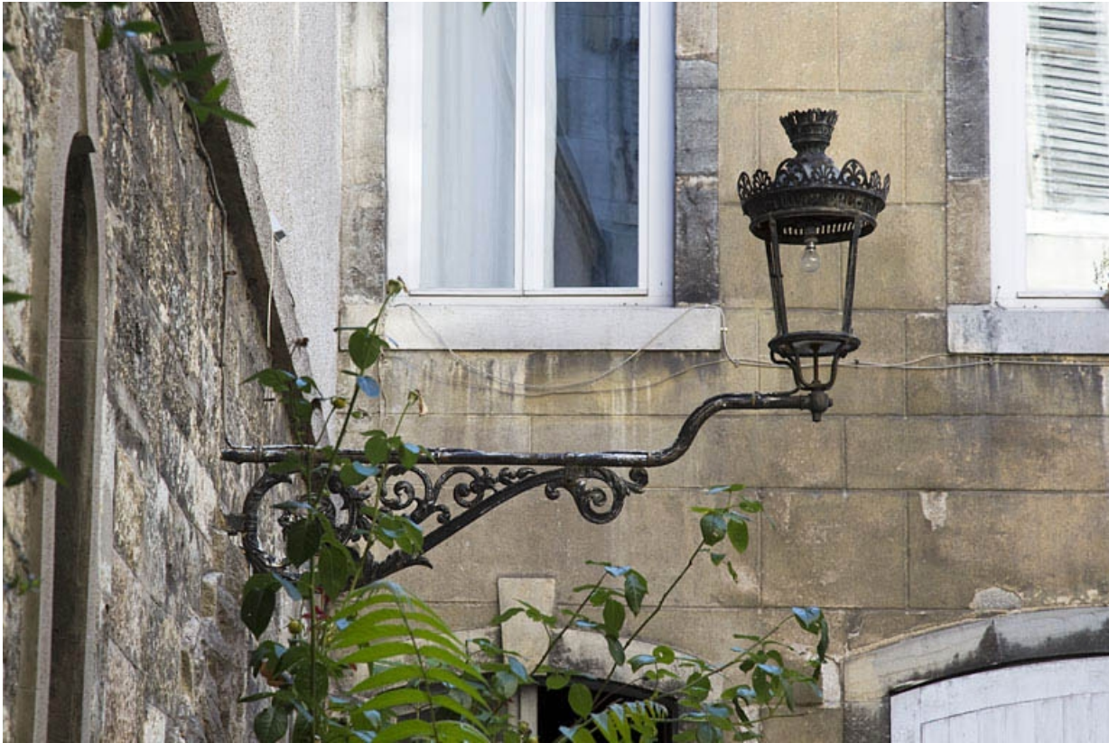
Détail d'un bec de gaz situé dans la cour.

25, Besançon, 25 rue Renan, lieudit : îlot Cingle