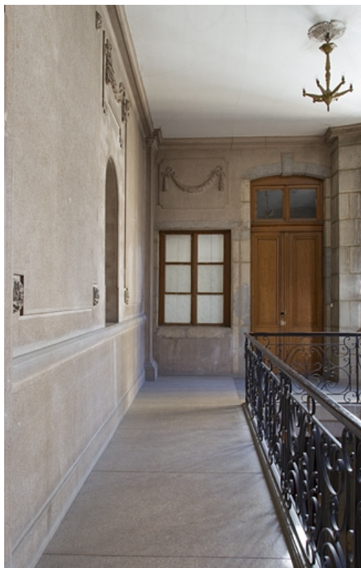
Aile de l'escalier : détail du premier palier.

25, Besançon, 25 rue Renan, lieudit : îlot Cingle