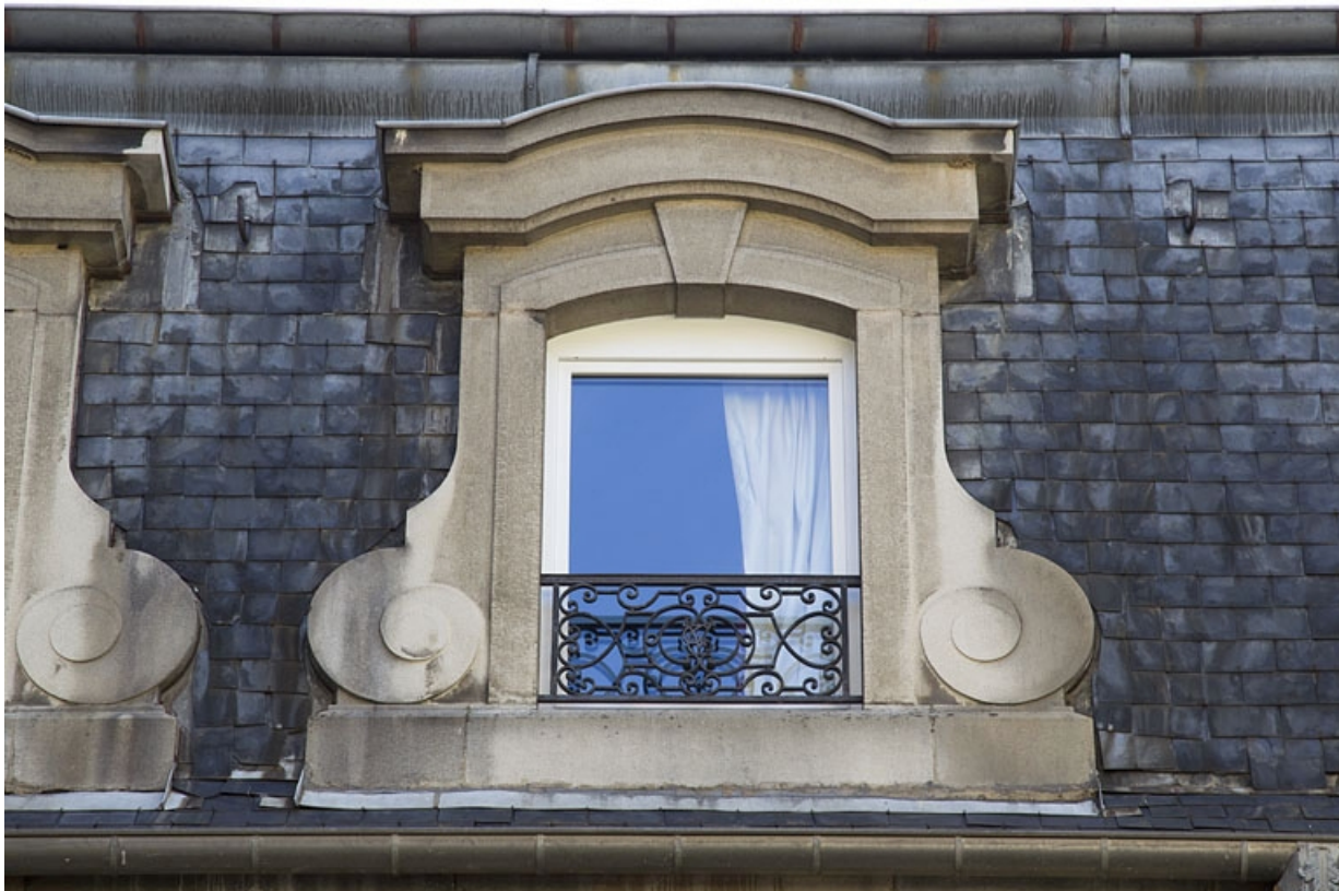
Logis secondaire : détail d'une lucarne.

25, Besançon, 25 rue Renan, lieudit : îlot Cingle