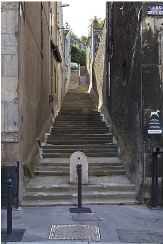
Façade latérale gauche de l'édifice longeant la ruelle Casenat, depuis la rue Renan. 25, Besançon, 25 rue Renan, lieudit : îlot Cingle