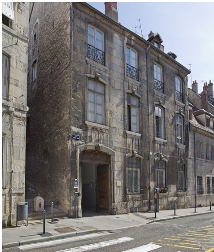
Vue d'ensemble depuis la rue, de trois quarts gauche.

25, Besançon, 25 rue Renan, lieudit : îlot Cingle