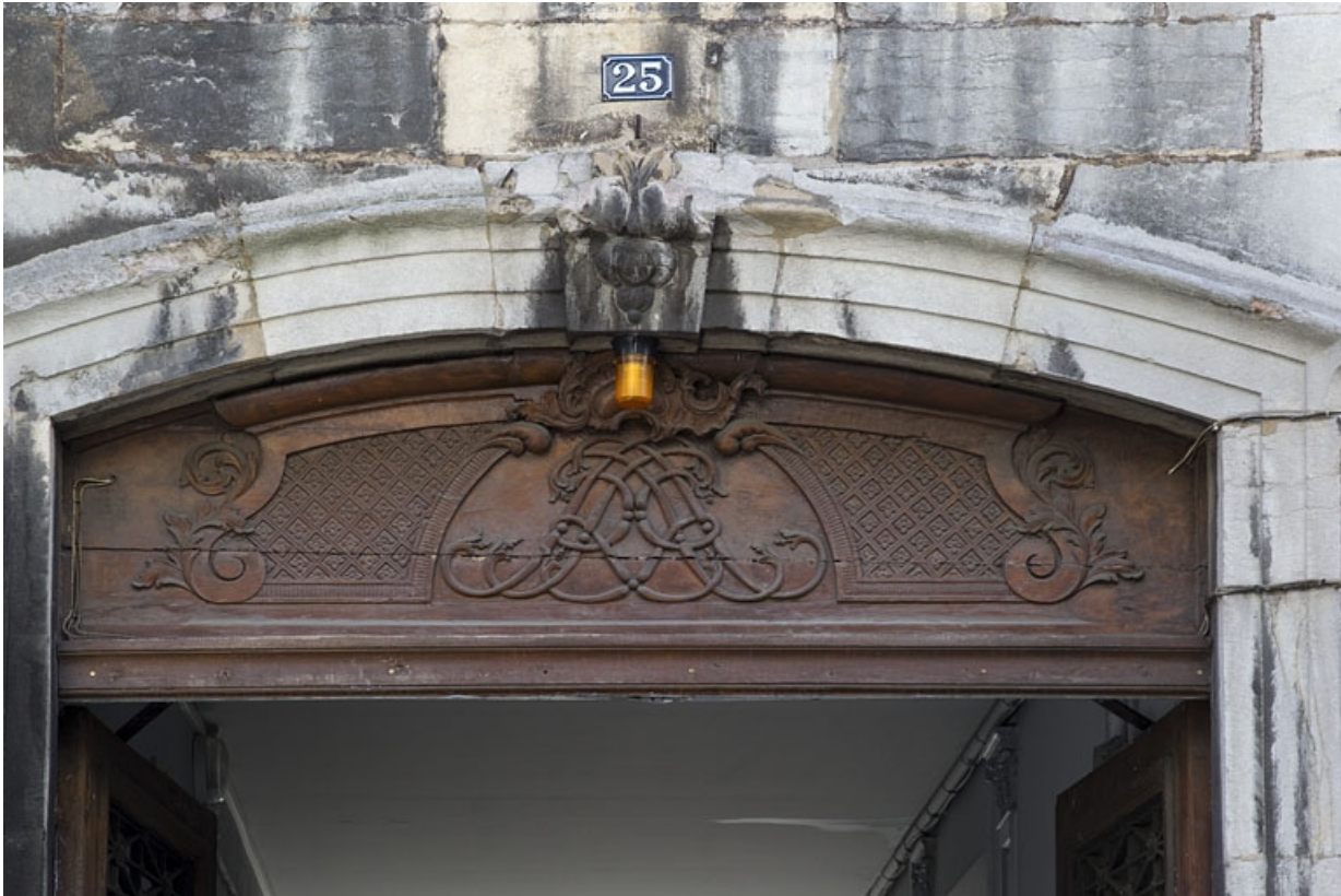
Logis principal : détail du décor du tympan en menuiserie de la porte d'entrée.

25, Besançon, 25 rue Renan, lieudit : îlot Cingle