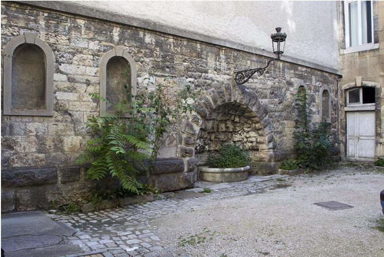
Mur gauche de la cour : vue d'ensemble.

25, Besançon, 25 rue Renan, lieudit : îlot Cingle