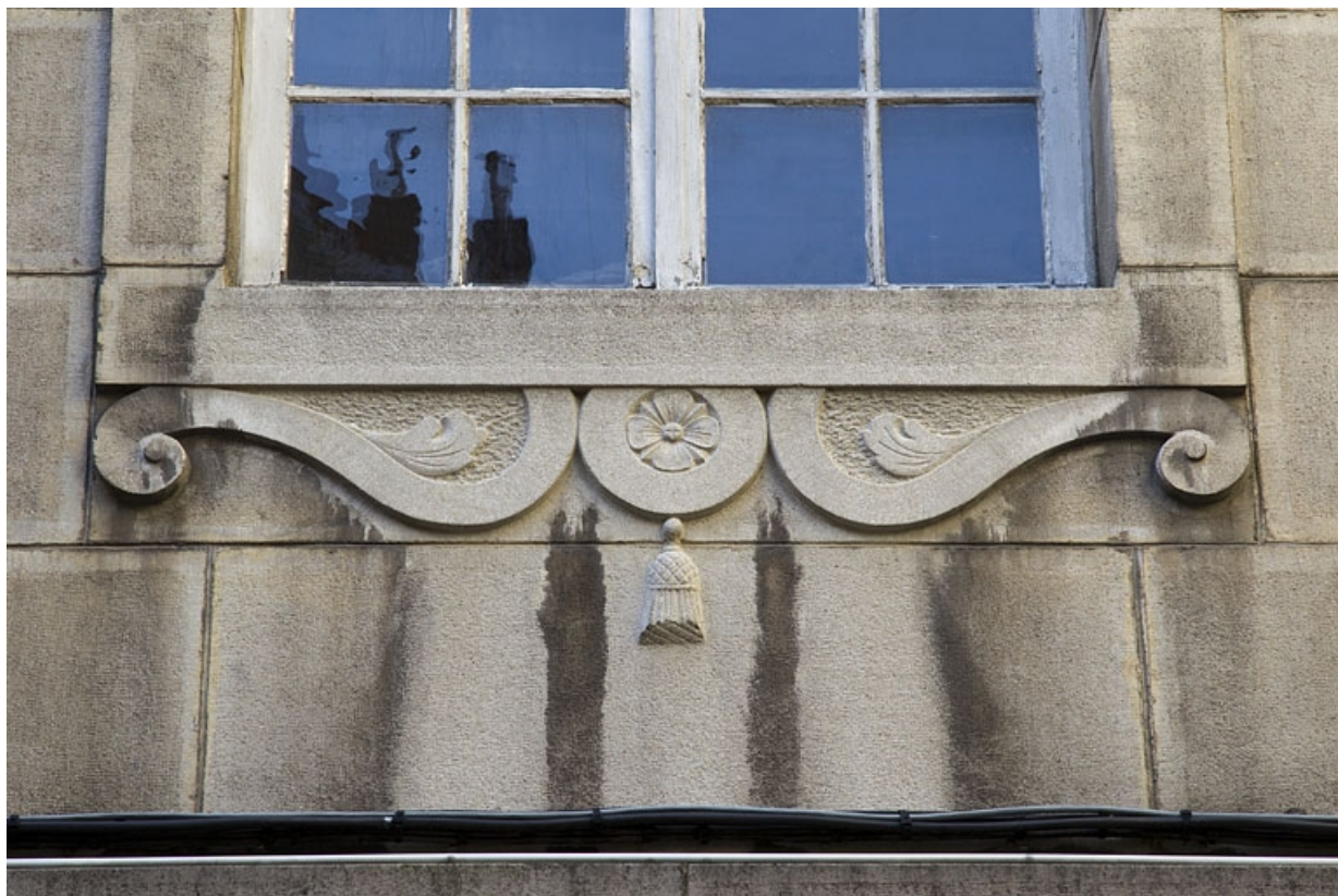
Logis principal, façade antérieure : détail d'un décor situé sous une fenêtre.

25, Besançon, 25 rue Renan, lieudit : îlot Cingle