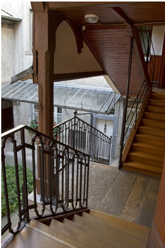
Escalier à cage ouverte : vue depuis l'intérieur.

25, Besançon, 27 rue Renan, lieudit : îlot Cingle