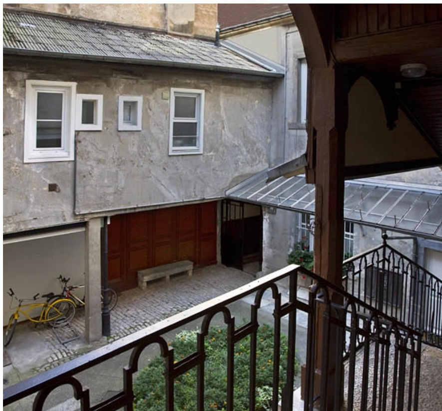
Vue d'ensemble de la cour depuis l'escalier à cage ouverte.

25, Besançon, 27 rue Renan, lieudit : îlot Cingle