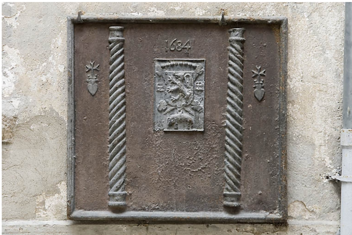
Vue d'ensemble d'une plaque de cheminée entreposée dans la cour.

25, Besançon, 27 rue Renan, lieudit : îlot Cingle