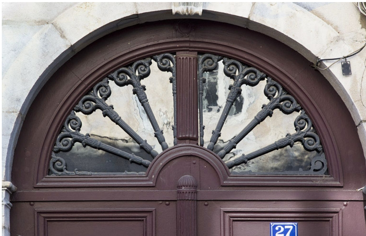
Portail d'entrée : détail du tympan en menuiserie de la porte.

25, Besançon, 27 rue Renan, lieudit : îlot Cingle