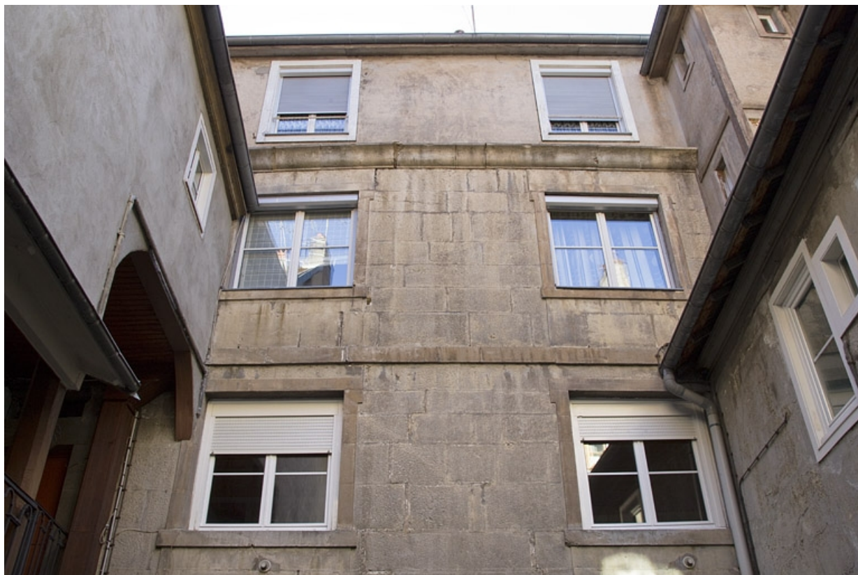
Logis principal, façade postérieure : de face. 25, Besançon, 27 rue Renan, lieudit : îlot Cingle