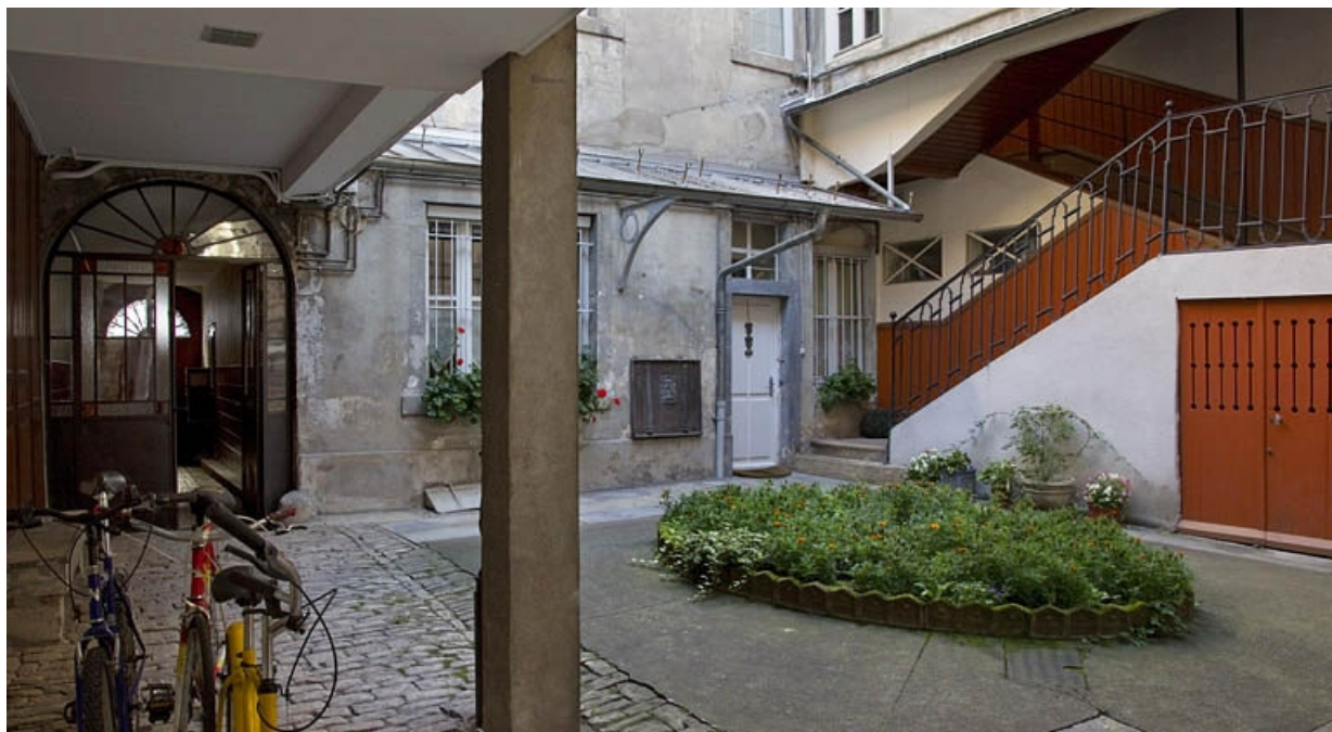
Vue d'ensemble de la cour depuis le fond, de trois quarts gauche.

25, Besançon, 27 rue Renan, lieudit : îlot Cingle