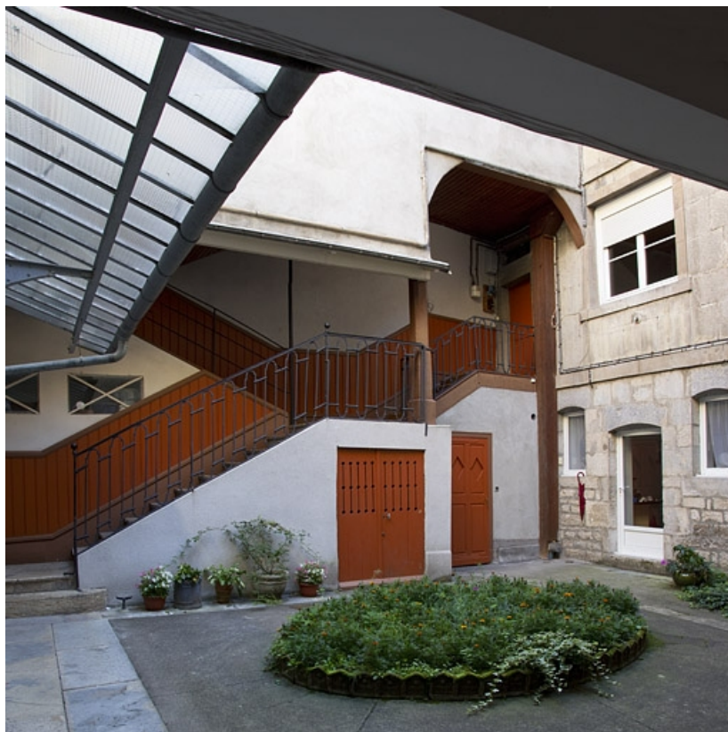
Vue d'ensemble de l'escalier à cage ouverte sur cour, de trois quarts gauche. 25, Besançon, 27 rue Renan, lieudit : îlot Cingle