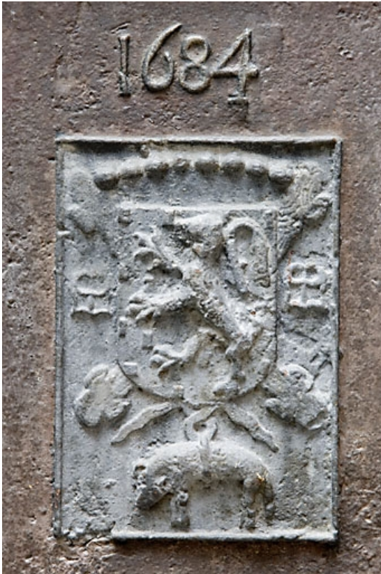
Détail central d'une plaque de cheminée entreposée dans la cour.

25, Besançon, 27 rue Renan, lieudit : îlot Cingle