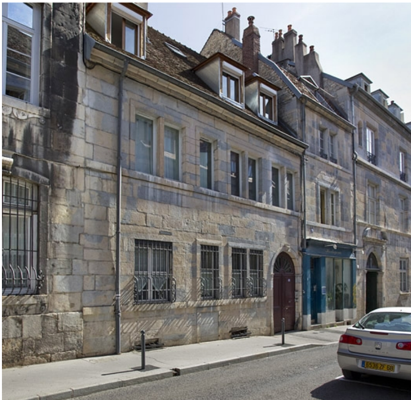
Vue d'ensemble depuis la rue : de trois quarts gauche.

25, Besançon, 27 rue Renan, lieudit : îlot Cingle