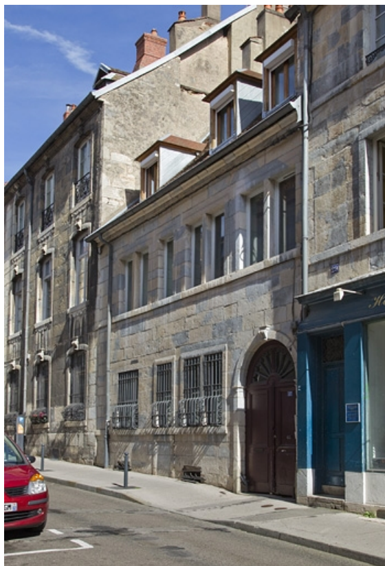
Vue d'ensemble depuis la rue : de trois quarts droit.

25, Besançon, 27 rue Renan, lieudit : îlot Cingle