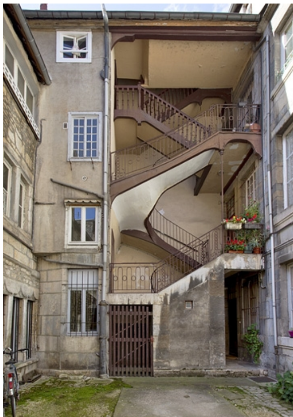
Vue d'ensemble de l'escalier à cage ouverte de la première cour : de face.

25, Besançon, 37 rue Renan, lieudit : îlot Cingle