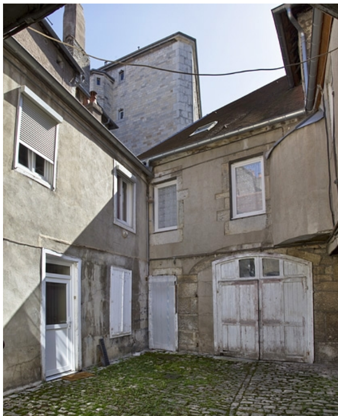
Vue d'ensemble de la deuxième cour, depuis l'entrée.

25, Besançon, 37 rue Renan, lieudit : îlot Cingle