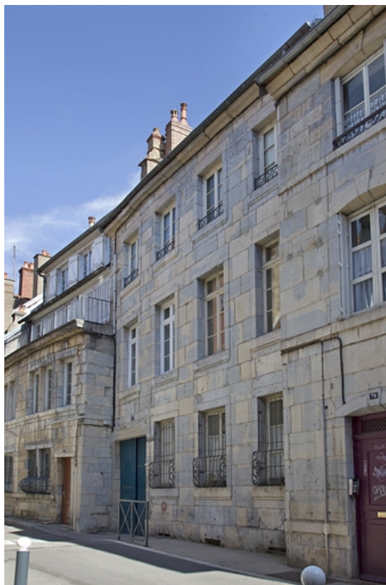
Vue d'ensemble depuis la rue, de trois quarts droit.

25, Besançon, 37 rue Renan, lieudit : îlot Cingle