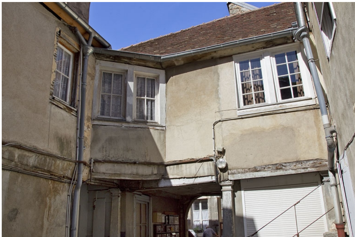
Façade postérieure du premier logis secondaire : vue d'ensemble.

25, Besançon, 37 rue Renan, lieudit : îlot Cingle