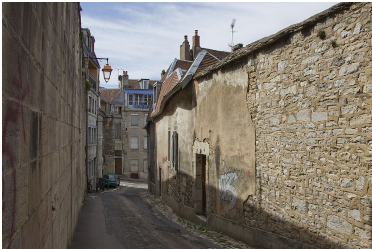
Premier logis secondaire : vue de la façade postérieure, de trois quarts droit.

25, Besançon, 37 rue Renan, lieudit : îlot Cingle