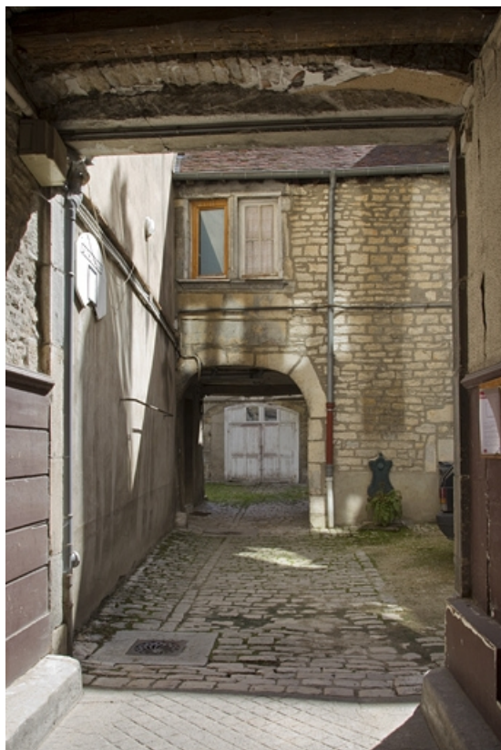
Premier logis secondaire : vue du passage cochers.

25, Besançon, 37 rue Renan, lieudit : îlot Cingle