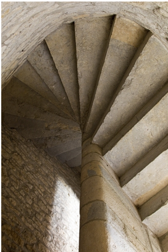
Premier logis secondaire : détail de l'escalier en vis.

25, Besançon, 37 rue Renan, lieudit : îlot Cingle