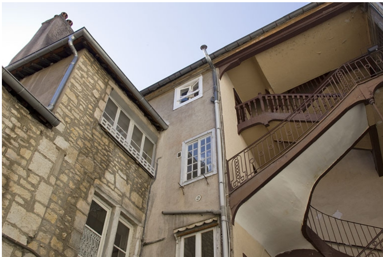
Logis secondaire et escalier à cage ouverte : détail des parties supérieures.

25, Besançon, 37 rue Renan, lieudit : îlot Cingle