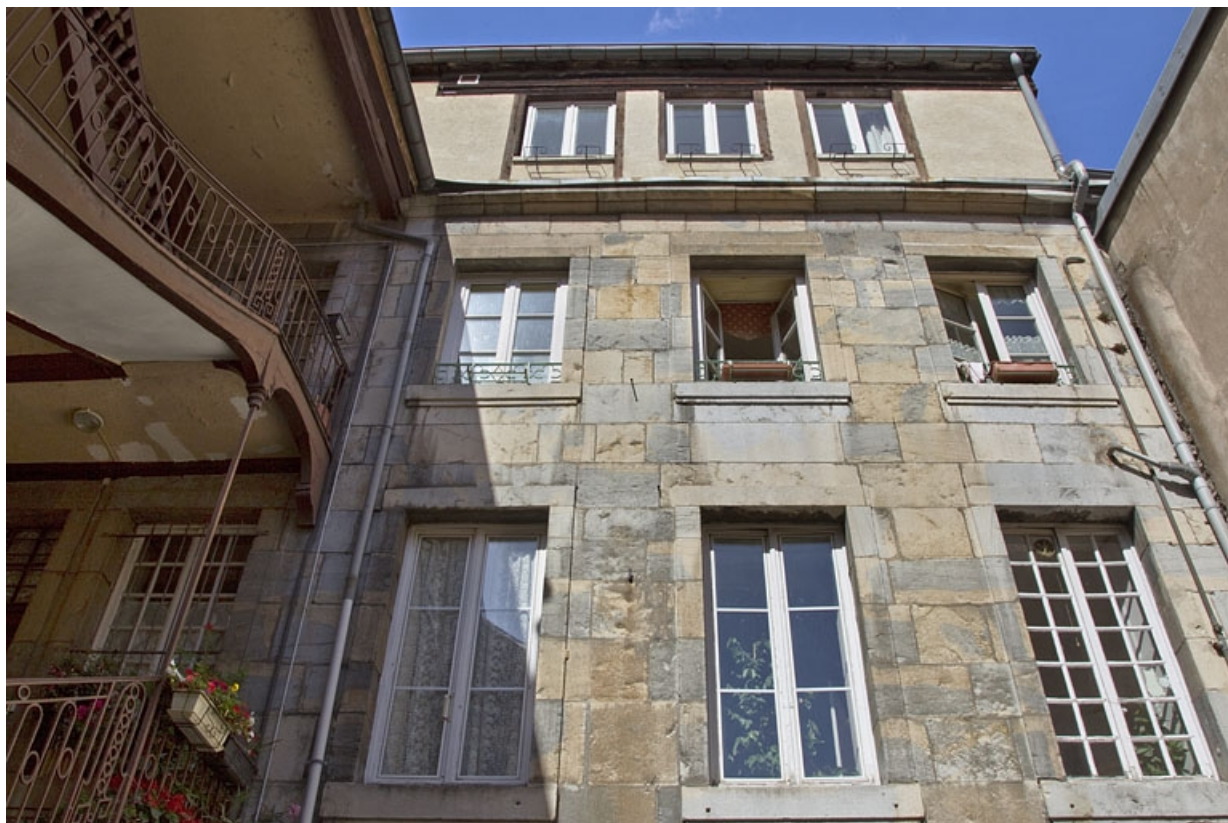
Logis principal, façade postérieure : de face. 25, Besançon, 37 rue Renan, lieudit : îlot Cingle