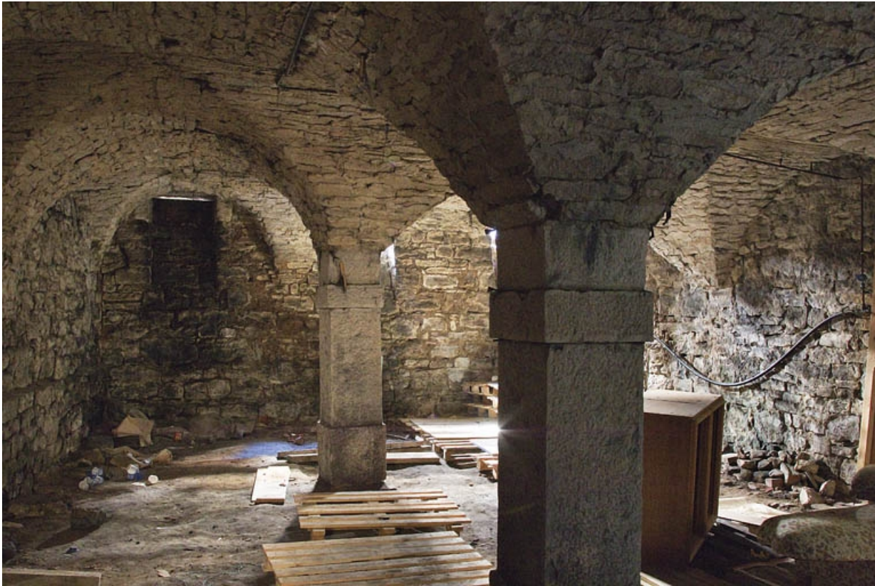
Logis principal : vue de la cave, depuis l'entrée.

25, Besançon, 37 rue Renan, lieudit : îlot Cingle