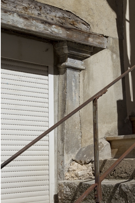
Façade postérieure du premier logis secondaire, vestiges supposés d'un portique : détail d'un chapiteau toscan. 25, Besançon, 37 rue Renan, lieudit : îlot Cingle